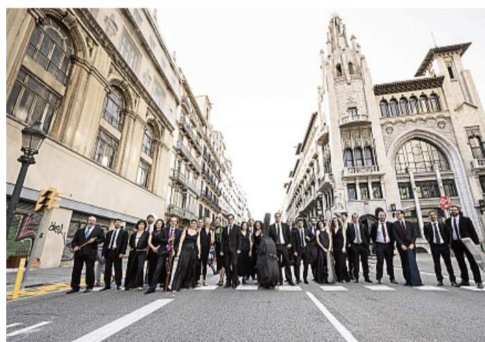
Das katalanische Ensemble Vespres d'Arnadí gestaltet das Abschlusskonzert bei den Arolser Barock-Festspielen. Ihr Auftritt wird gefördert durch teilweise Übernahme der Flugkosten durch die katalanische Regionalverwaltung.