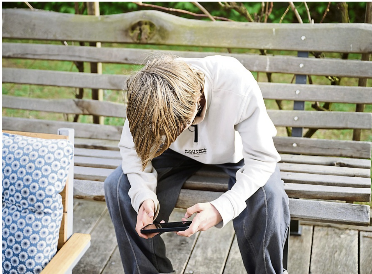
Australien setzt mit einem Social-Media-Verbot für Unter-16-Jährige weltweit ein Zeichen: Die Debatte um Altersgrenzen gewinnt an Fahrt.

Hass, Hetze, Cybermobbing, Falschinformation, unrealistische Vorbilder und Schönheitsideale: Das sind alles Herausforderungen, die soziale Medien mit sich bringen. Doch bei der Nutzung geht es zugleich um Austausch, Nachrichten, Unterhaltung – und Zugehörigkeitsgefühl. Man tut also gut daran, zwar die Risiken zu kennen und zu benennen, aber nicht alles zu verteufeln.