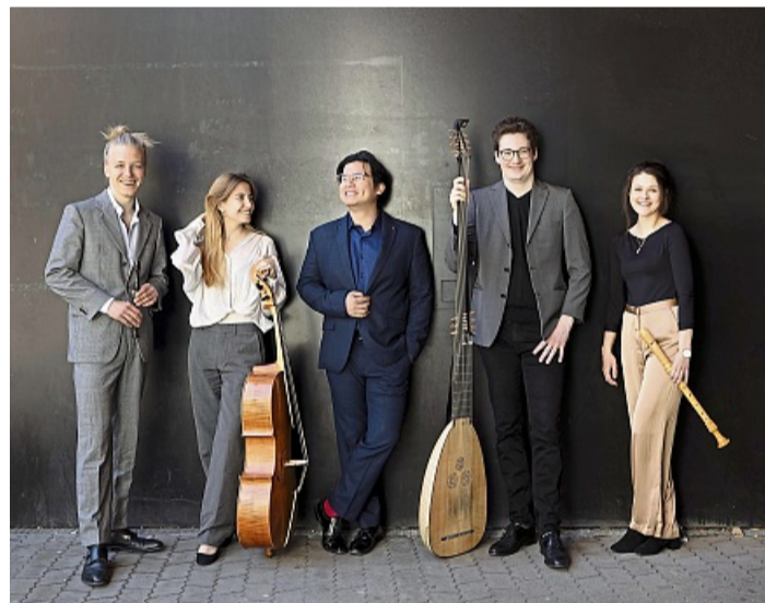
Die Matinee Junger Künstler gestaltet das Ensemble Interchange.