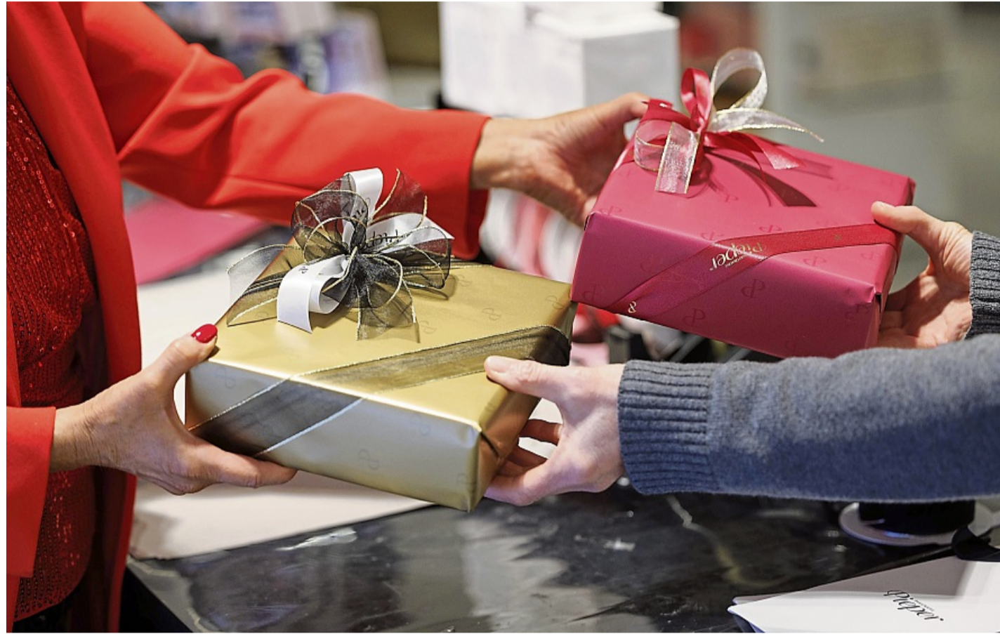
Manchmal geht's zurück: Ein Umtausch im Geschäft ist meist nur auf Kulanz möglich, bei mangelhafter Ware bestehen jedoch gesetzliche Ansprüche.

Wem ein Produkt nach dem Kauf schlicht nicht mehr gefällt, muss auf Kulanz des Händlers hoffen. Ob der Händler bei Rückgabe im Gegenzug einen Gutschein ausstellt oder den Betrag bar zurückerstattet, bleibt ihm überlassen. Nur bei