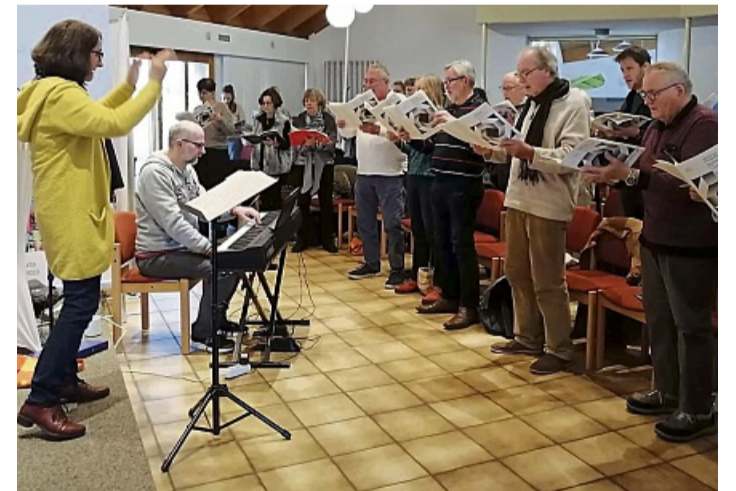
Die Evangelische Kantorei Korbach hat bei einem Probenwochenende intensiv für die Aufführung des Weihnachtsoratoriums geprobt.

„Die Geburt Christi“ wird am 4. Advent in der Nikolaikirche aufgeführt