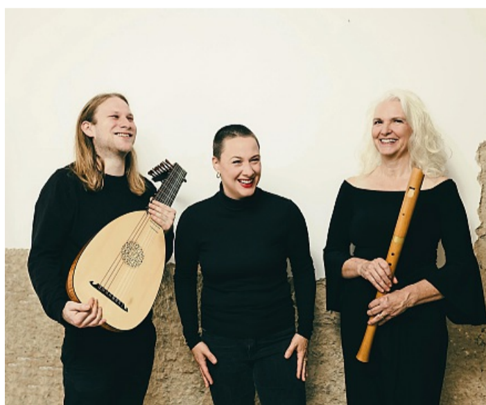
Nicht immer jugendfrei: Das Ensemble Semperviva hat florentinische Karnevalslieder im Repertoire