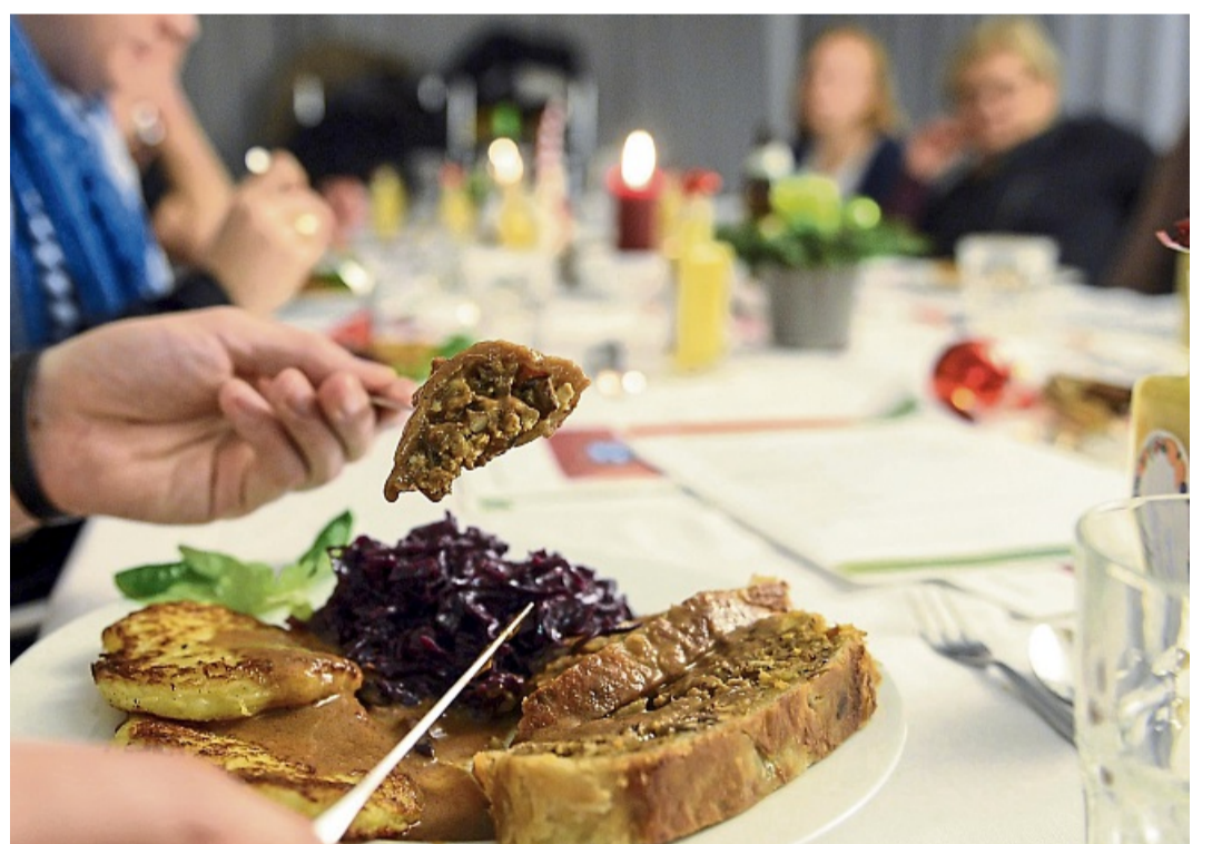
Vegetarische Gerichte mit saisonalem Gemüse wie Rotkohl, Wirsing oder Rote Bete sind günstige Alternativen zum klassischen Festtagsbraten.

Ente, Gans oder Karpfen: Alles Gerichte, die ganz schön ins Geld gehen können, vor allem, wenn eine große Familie mit am Tisch sitzt. Wer offen für Alternativen ist und den Festtagschmaus gut plant, kommt günstiger weg. Hier einige praktische Empfehlungen der Verbraucherzentrale Brandenburg: