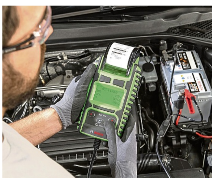
Ein Batteriecheck in der Fachwerkstatt beugt möglichen Pannen in der kalten Jahreszeit vor.

Ein Werkstattbesuch für einen sicheren Start in die kalte Jahreszeit ist aber nicht nur wegen der Energieversorgung sinnvoll. Auch Bremsen, Reifen und Beleuchtung verdienen Aufmerksamkeit, da sie bei Glätte, Nässe und Dunkelheit stärker beansprucht werden. Ebenso wichtig sind funktionierende Scheibenwischer. Abgenutzte Wischerblätter hinterlassen Schlieren, die bei Gegenverkehr zu einer gefährlichen Blendung führen können.