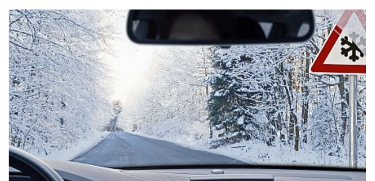
Gute Sicht mit neuen Wischerblättern sorgt für mehr Sicherheit – besonders in der kalten Jahreszeit.

Selbst mit einwandfreier gute Idee. Wer stets bremsbereite Technik gilt: Eine vorausschauende Fahrweise ist bei winterlichen Bedingungen immer eine hält, kommt auch bei Schnee und Eis entspannt ans Ziel. djd