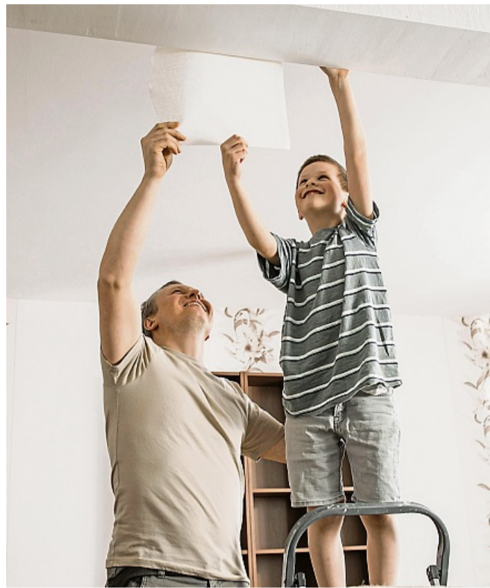
Mit Kindern heimwerken macht Freude - wenn man die passenden Projekte für die Kleinen wählt.