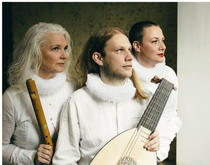
Das Ensemble Semperviva bei den Arolser Barock-Festspielen.

Stellvertretend für die junge Barock-Szene gestalten die Nachwuchskünstler vom Ensemble Interchange im Rauch-Museum die „Matinee Junge Künstler“ am Himmelfahrtstag. Am Nachmittag serviert das Ensemble Semperviva mit den „Canti Carnaleschi“ doppeldeutige Lieder des florentinischen Karnevals. Bestseller-Autor Tobias Roth führt kenntnisreich in die Texte und Alltagsatire. Versprochen wird ein humorvolles Programm, al-