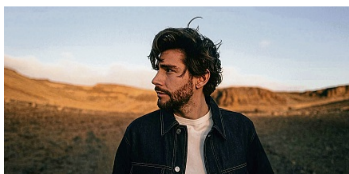
Alvaro Soler tritt in Bad Arolsen auf.

Die „El Camino Tour 2026“ führt ihn durch zahlreiche Länder – darunter Deutschland, die Niederlande, Belgien, die Schweiz, Polen, die Slowakei, Luxemburg, Österreich und Tschechien. Nun wurde die Tour um weitere Sommertermine ergänzt – mit stimmungsvollen Open-Air-Konzerten auf besonderen Bühnen unter freiem Himmel.