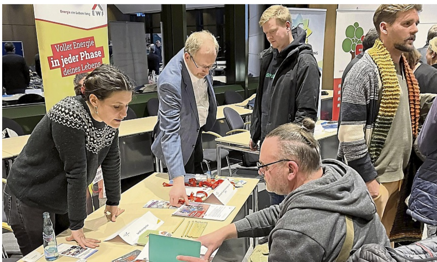
Beim „Markt der Fördermöglichkeiten“ des Landkreises Waldeck-Frankenberg informierten sich zahlreiche ehrenamtlich Engagierte über Unterstützungsangebote.

Ob Vorhaben im sozialen, allgemein ehrenamtlichen oder kulturellen Bereich – finanzielle Unterstützung wird in den unterschiedlichsten Bereichen