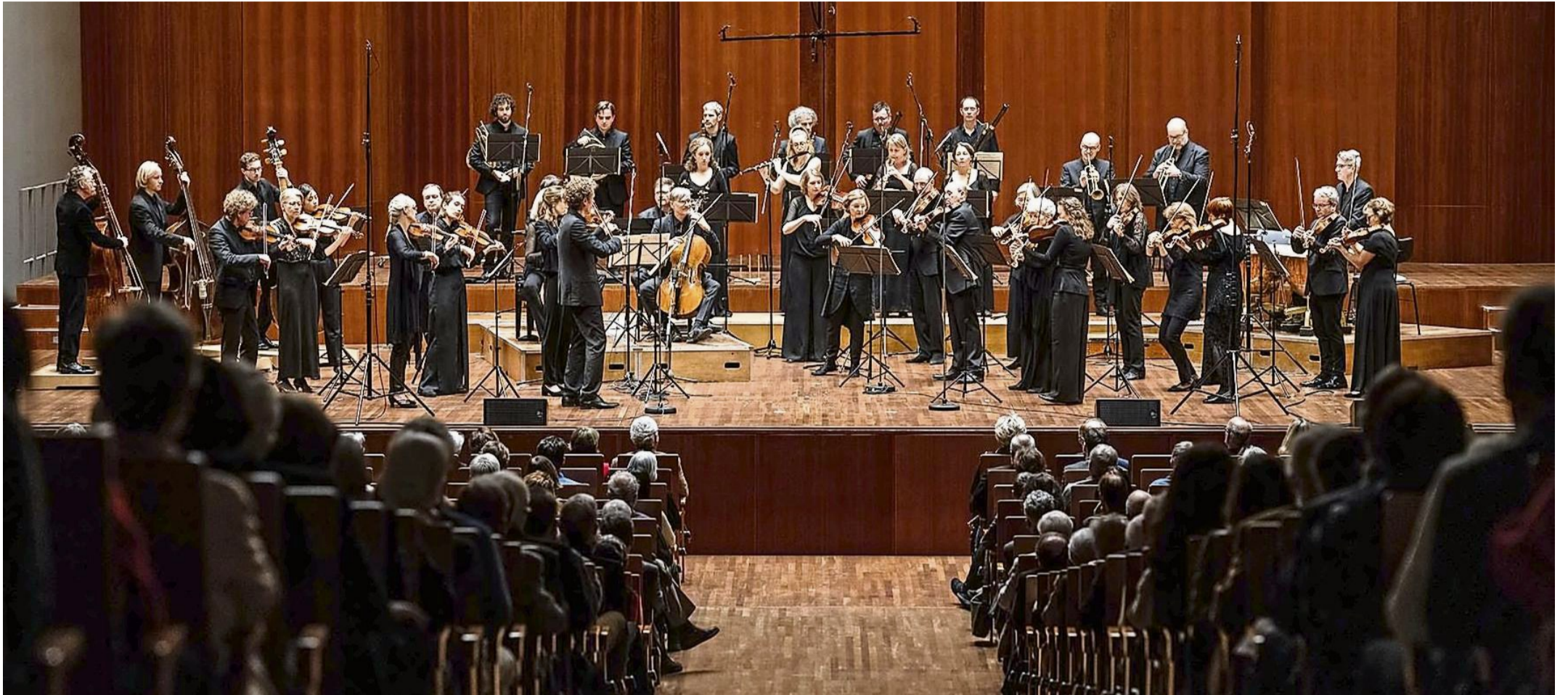
Das Freiburger Barockorchester eröffnet die Arolser Barock-Festspiele 2026.

Zum 40. Geburtstag der Barock-Festspiele präsentiert Bad Arolsen 29 Veranstaltungen