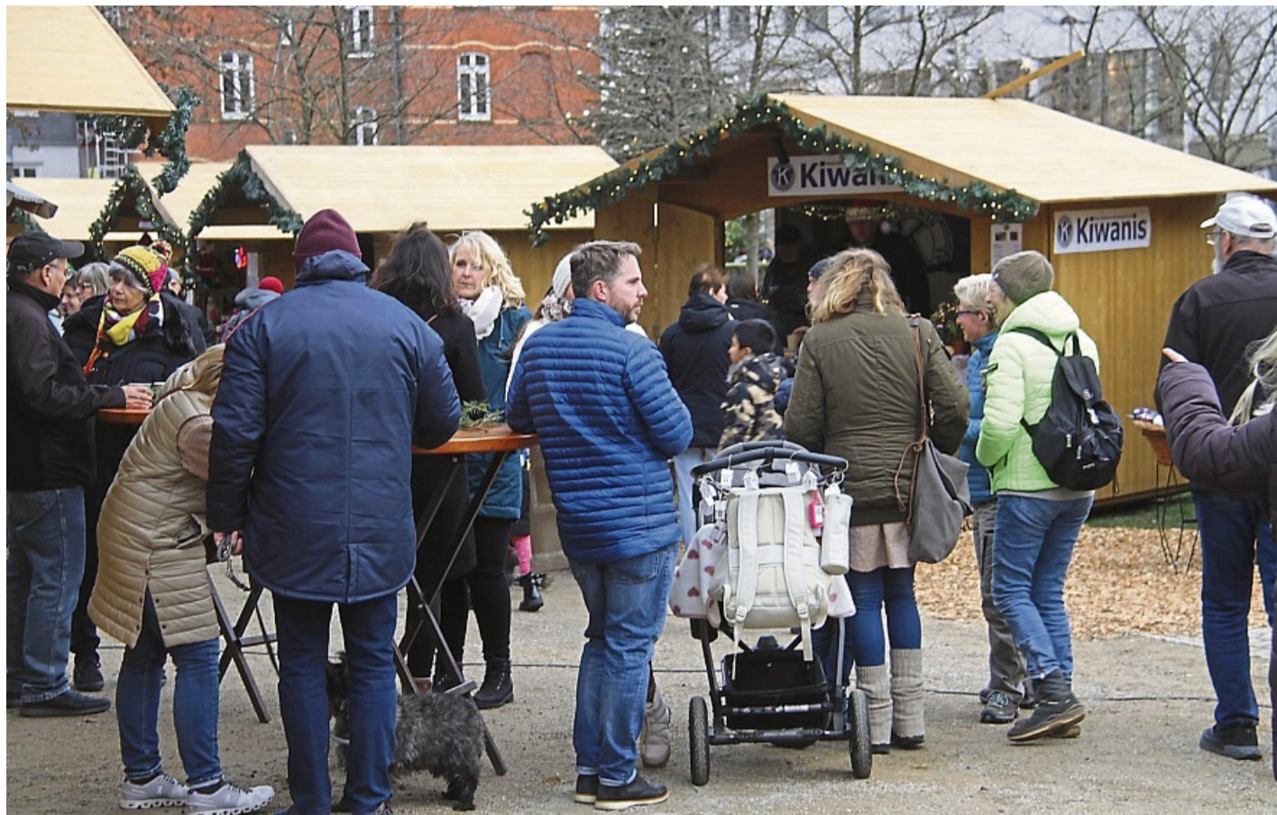
Ein Foto vom Adventsmarkt im Klostergarten 2025.