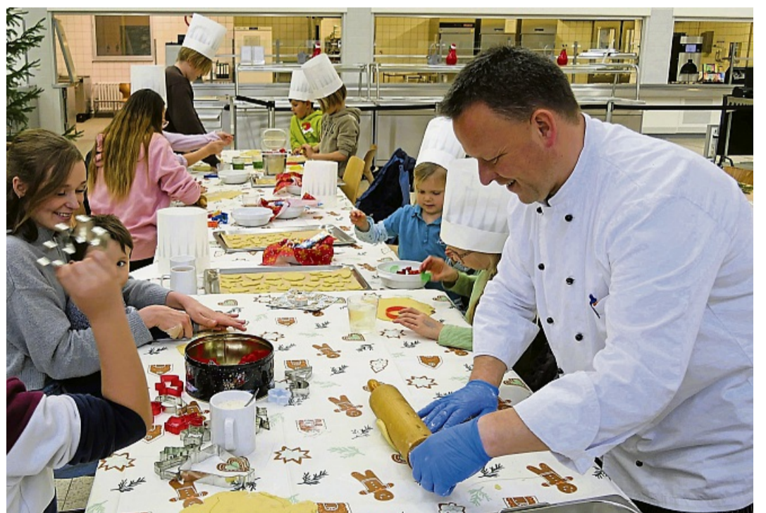
Plätzchenbacken für Soldatenfamilien wurde in der Frankenger Burgwaldkaserne angeboten.