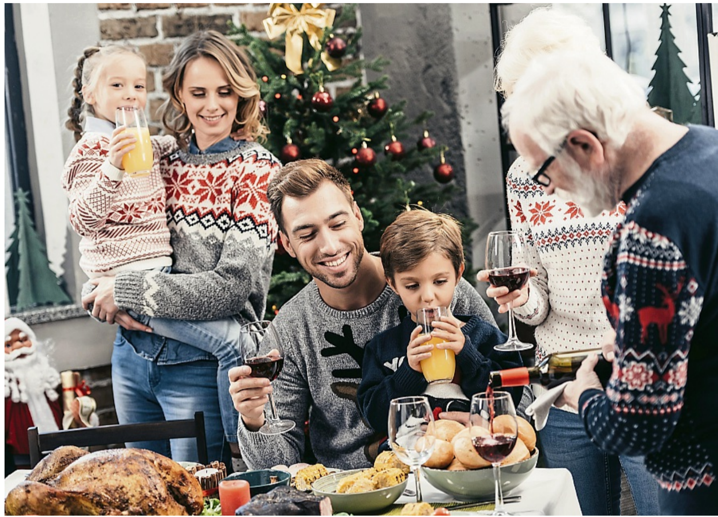
Wenn Sie zu den Singles gehören, deren Verwandtschaft aus allen Ecken anreist, um gemeinsam mit ihnen das Weihnachtsfest zu feiern, erscheint einem der Wunsch nach einer Partnerschaft vielleicht belanglos.

Manchen Alleinstehenden gelingt es trotz aller Bemühungen nicht, sich das Gefühl der Dank-