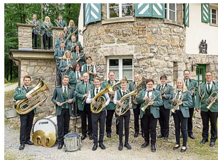
„Blasmusik grenzenlos“ heißt das Motto der Schützenblaskapelle Willingen zum Jahresabschluss.

Schützenblaskapelle gibt Abschlusskonzert mit breitem Programm