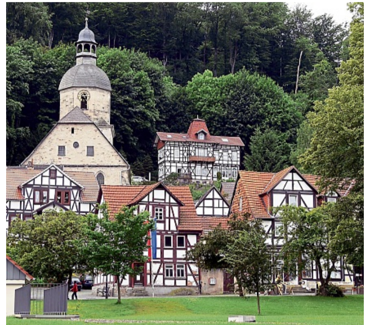
Bad Sooden-Allendorf und Hessisch Lichtenau wurden in die Städtebauförderprogramme des Landes Hessen aufgenommen.

Zwei Städte im Landkreis profitieren von Landesprogrammen