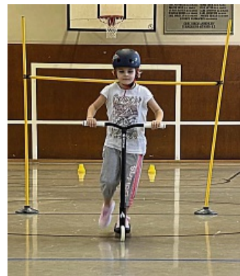
Unter einer Stange und anschließend zwischen zwei Hütchen durch war die Aufgabe, die in der Schwierigkeit mit Anpassung der Höhe der Stange und dem Abstand der Hütchen verändert wurde.

Von den Grundschulen in der Region kann das Angebot kostenfrei für zwei Schulwochen gebucht werden. Zusätzlich muss eine Lehrkraft an einer entsprechenden Fortbildung teilgenommen haben. Zuvor wurde der Container mit der Ausrüstung durch den Bauhof Hann. Münden in Göttingen von einer anderen Grundschu-