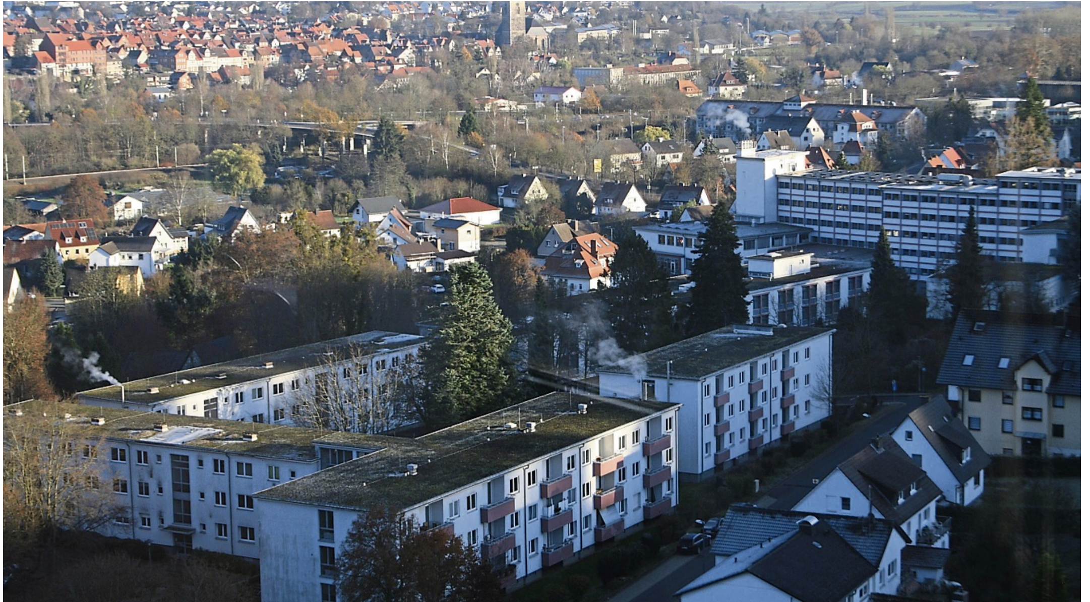
Aus der Vogelperspektive: Sooden Nord ist das Gebiet, für dessen städtebauliche Förderung sich Stadt, Land und Bund die Kosten teilen.