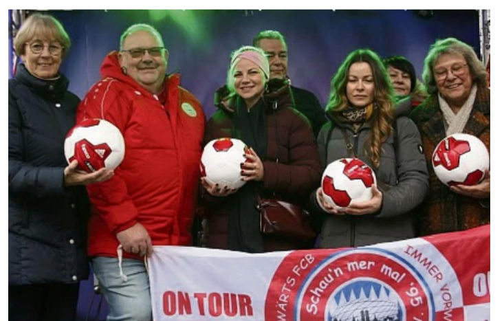
Der Fanclub des Fußball-Bundesligisten FC Bayern München übergab Spenden an die Kitas in Bad Sooden-Allendorf.

Spenden an Kitas in Bad Sooden-Allendorf