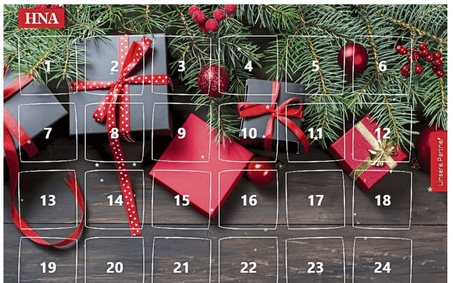
Überall steckt ein Gewinn hinter: der digitale HNA-Adventskalender 2025.

Die Gewinner werden direkt am nächsten Werktag benachrichtigt. Die Teilnahme ist kostenfrei. Wir wünschen Ihnen viel Erfolg.