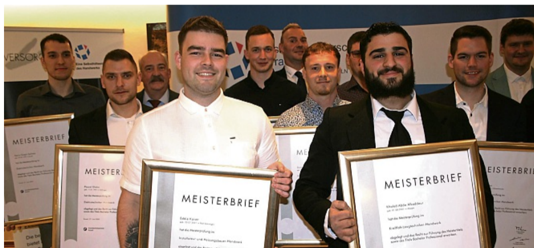
Berechtigter Stolz: Nicht alle waren zur Übergabe der Meisterbriefe erschienen.