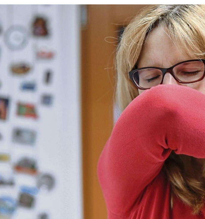
Nach einer Erkältung kann trockener Reizhusten auch Wochen später anhalten.

Besser sind daher spezielle Inhalationsgeräte. Hölting rät zu Kalt- und Ultraschallverneblern, die es etwa in der Apotheke zu kaufen gibt. Sie vernebeln die Inhalationslösung zu so kleinen Partikeln, dass sie bis tief in die Lunge langen und