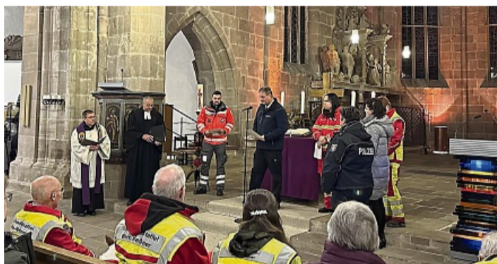
Uniformfarben zwischen Kerzenlicht und Kirchenraum: Witzenhausen feiert die Einsatzkräfte der Region.

den und Zusammenhalt. Der Gottesdienst endete mit dem Adventslied „Macht hoch die Tür“ und dem Segen. Beim anschließenden Beisammensein zeigte sich, wie wichtig dieser Abend vielen war. Ein Satz aus der Predigt blieb haften: „Gemeinsam können wir vielleicht nicht die ganze Welt retten. Aber wir sind stark. Wir geben alles.“ ELVAN POLAT