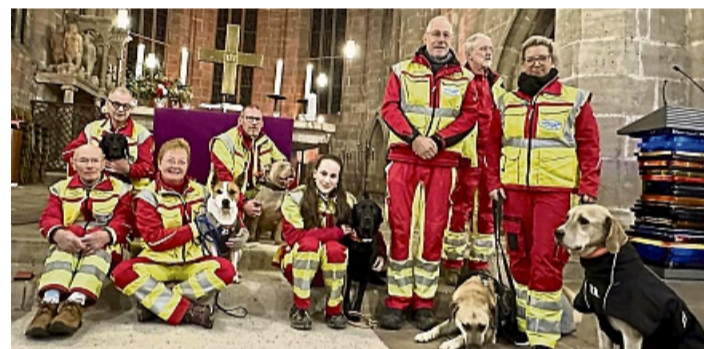
Auch die Rettungshundestaffel war Teil des Gottesdienstes: Suchhunde lagen aufmerksam neben ihren Hundeführerinnen und Hundeführern.