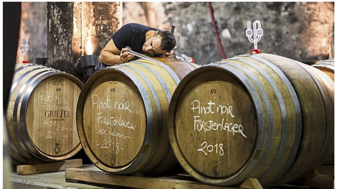
Die erste Gärung von Winzersekt findet in Fässern der Weingüter statt.