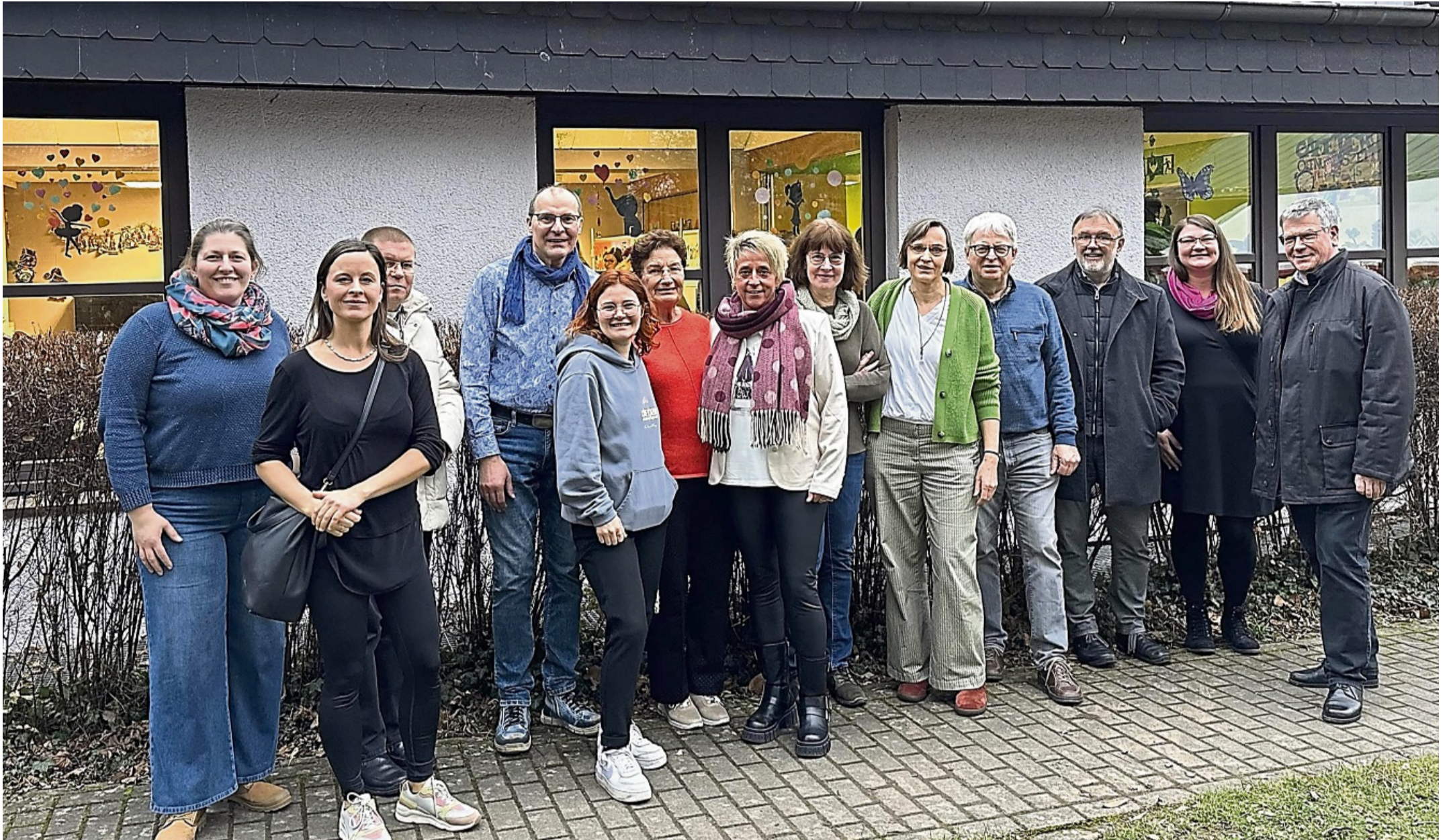
Viele Hände, ein Hort: Ehemalige und aktuelle Wegbegleiter feiern gemeinsam ein Vierteljahrhundert Schulkinderbetreuung im Kinderhaus St. Jakob.

Der Hort St. Jakob feiert 25 Jahre Gemeinschaft, Engagement und gelebten Alltag