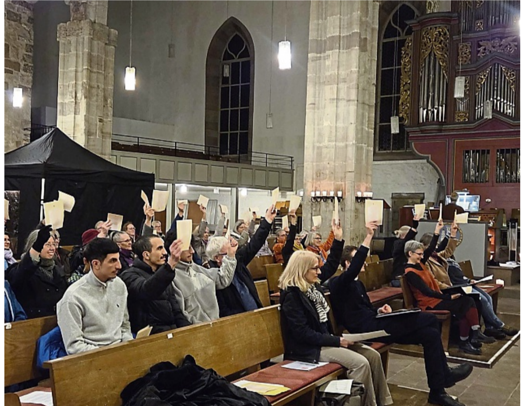
Beim Gottesdienst zum Dank an ehrenamtliches Engagement in der Liebfrauenkirche waren die Besucher aufgefordert, ihr Licht, symbolisiert mit dem Schein einer Kerze, in die Höhe zu halten.