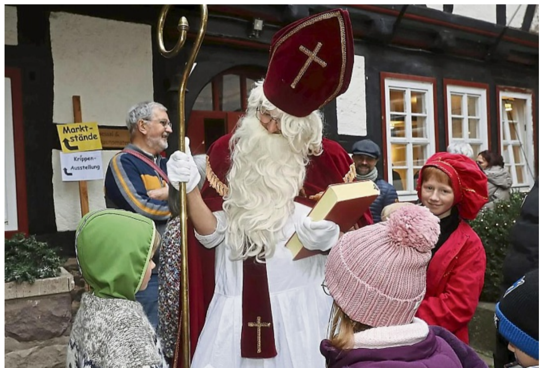
Die Kinder nähren sich ehrfürchtig dem Heiligen St. Nikolaus.