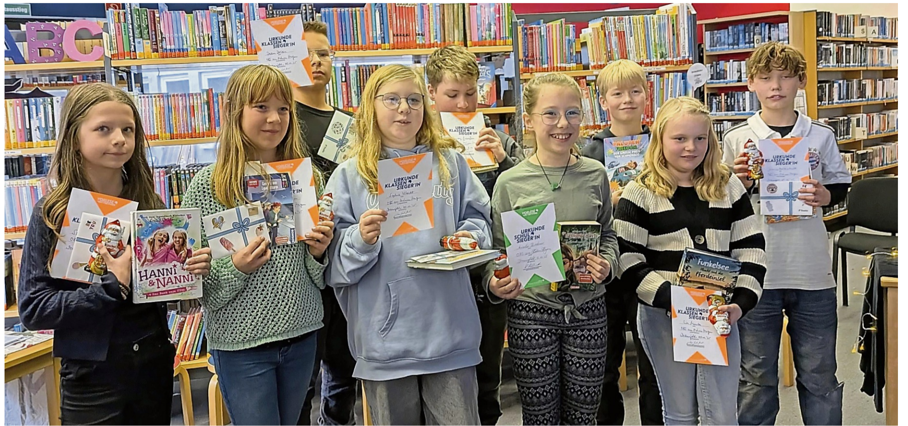
In der Samtgemeindebücherei traten die neun besten Leserinnen und Leser der sechsten Klassen gegeneinander an.

Für eine stimmungsvolle Atmosphäre sorgte währenddessen das Publikum, bestehend