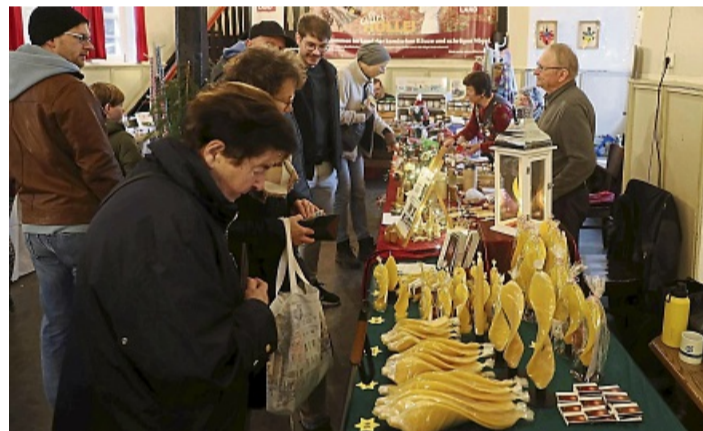
Zahlreiche Stände gab es in der Burg Ludwigstein zu entdecken.