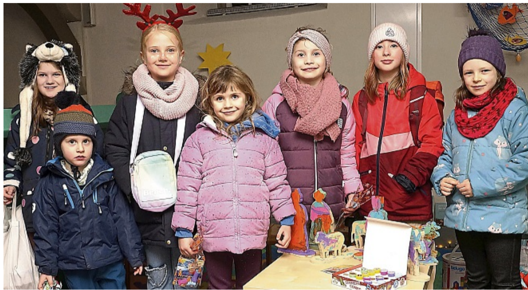
Zum ersten Mal konnten sich die Uengsteröder Kinder ein Nikolausgeschenk in der Dorfkirche abholen.

Der leibhaftige Nikolaus war natürlich ein Unikat. Aber als süße Schokolade gab es ihn am