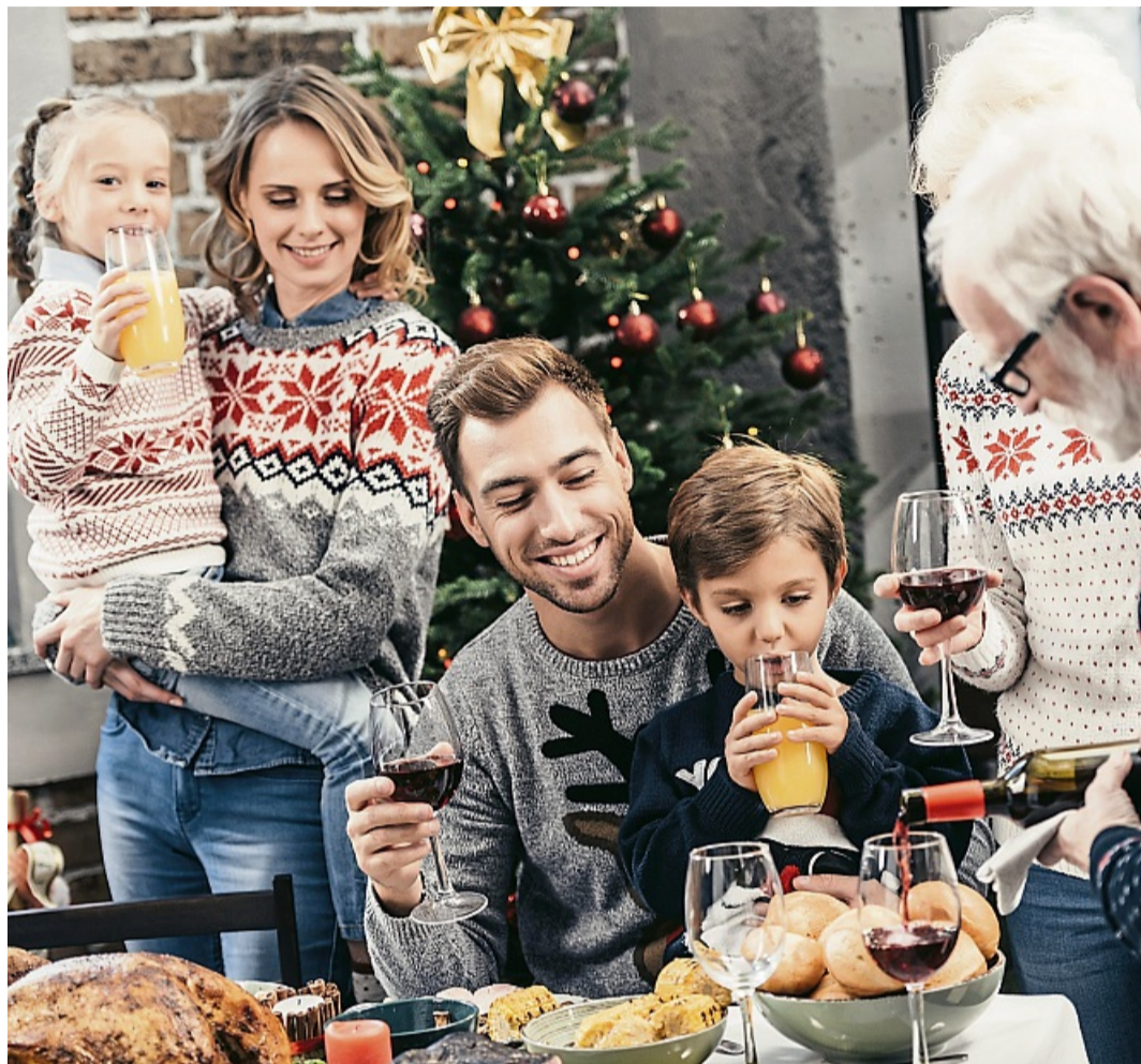
Wenn Sie zu den Singles gehören, deren Verwandtschaft aus allen Ecken anreist, um gemeinsam mit ihnen das Weihnachtsfest zu feiern, erscheint einem der Wunsch nach einer Partnerschaft vielleicht belanglos.

Wenn Sie zu den Singles gehören, deren Verwandtschaft aus allen Ecken anreist, um gemeinsam mit ihnen das Weihnachtsfest zu feiern, erscheint Ihnen der Wunsch nach einer Partnerschaft vielleicht belanglos. Denn eines ist sicher: Sie werden an Weihnachten nicht allein sein, sondern im Kreise Ihrer Liebsten. Und doch kennen auch Sie vielleicht diese kleinen Momente, in denen Sie sich trotz Gesellschaft einsam fühlen. Die regionale Online-Partnerbörse partner.HNA.de