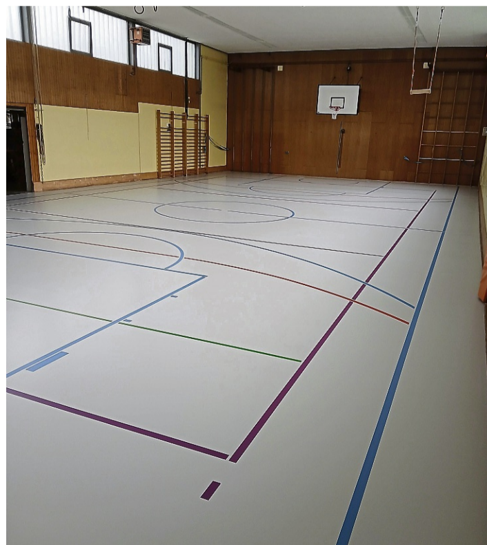
Der Boden der Sporthalle in Uschlag ist wieder rutschfest.

Der Sicherungskasten und die Steuerungsgeräte sollen noch in diesem Jahr zwischen dem 15. und 19. Dezember erneuert werden. In dieser Zeit ist die Halle gesperrt. Die Ertüchtigung der Sicherheitsbeleuchtung sei für Januar geplant. rus