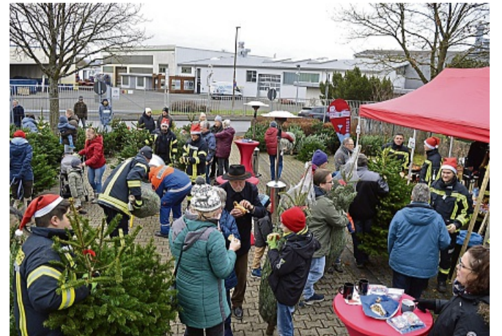
Viel los: Die Feuerwehr Hessisch Lichtenau hat am Nikolaustag einen Weihnachtsbaumverkauf veranstaltet.

Spende über 500 Euro für Nachwuchs der Freiwilligen Feuerwehr