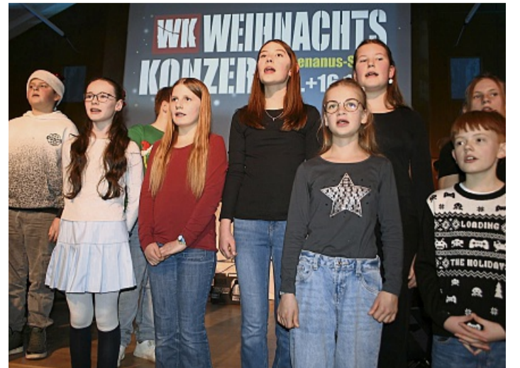
Voll konzentriert: Ein Teil des Schulchores bei seinem Auftritt.

Weihnachtskonzert an Rhenanus-Schule zieht 500 Zuhörer in den Bann