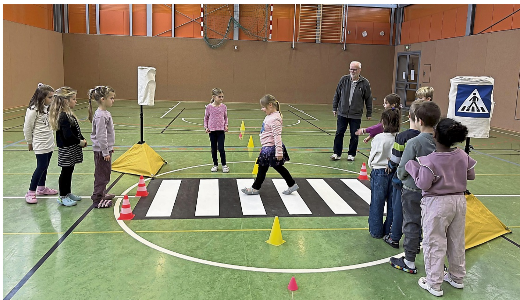
Sicher über den Zebrastreifen: Erst wenn alle „Autos“ angehalten haben, konnten die Fußgänger die Straße überqueren.

So hieß es also: Wer als Fußgänger über die Straße wollte,