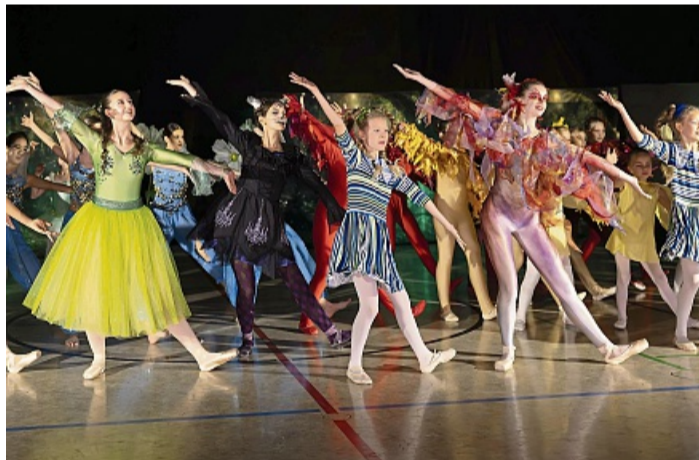
Das Können der Tänzerinnen honorierte das Publikum mit kräftigem und lang anhaltendem Applaus.