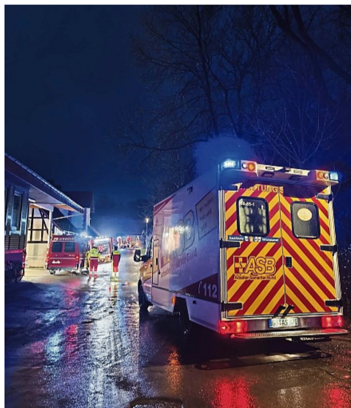
Auch der Hann. Mündener ASB hat an den Übungen in der Samtgemeinde teilgenommen.