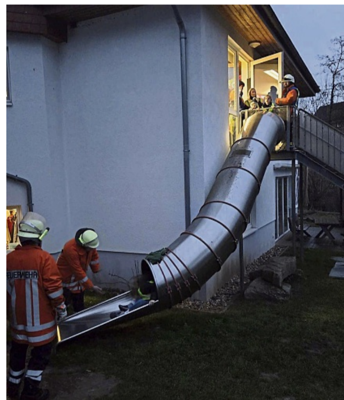
Über eine Rutsche sind in Löwenhagen Kinder evakuiert worden.

war noch eine ältere Person, dargestellt durch eine Puppe“, so die Feuerwehr.