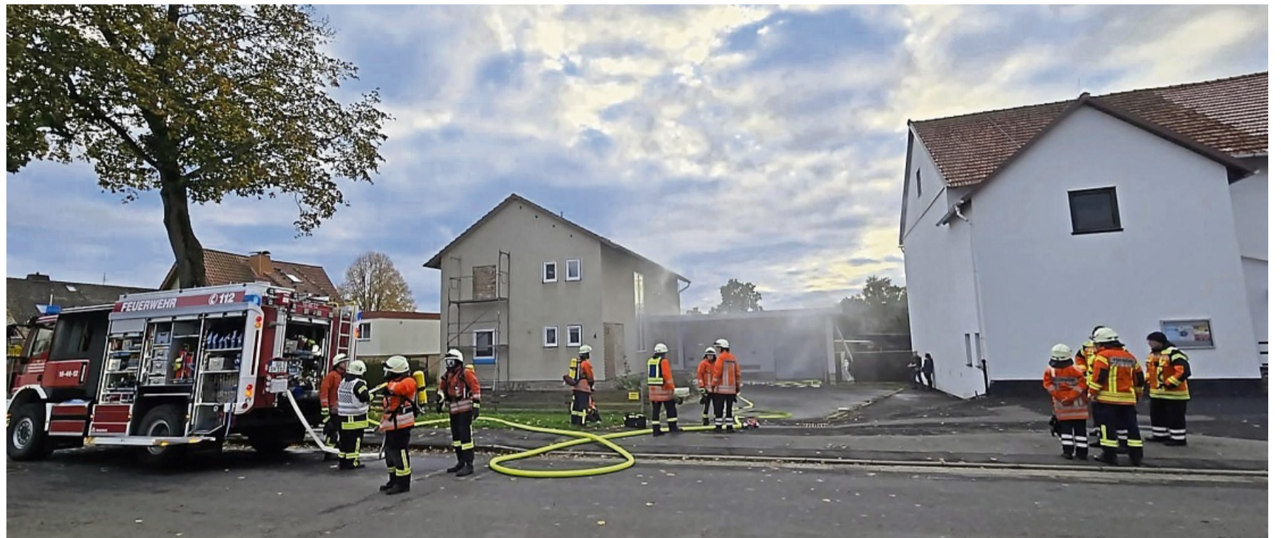
Das Löschen eines Hausbrandes und das Retten eines Bewohners wurde in Scheden geübt.

Diesem Einsatz vorausgegangen waren eine Herbstabschlussübung in Scheden im Oktober und eine in Jühnde Anfang November. In Scheden waren die Feuerwehren Scheden, Dankelshausen und Bühren beteiligt, das Szenario war dort ein Zimmerbrand in einem Einfamilienhaus in der Bahnhofstraße. „Im verrauchten Haus