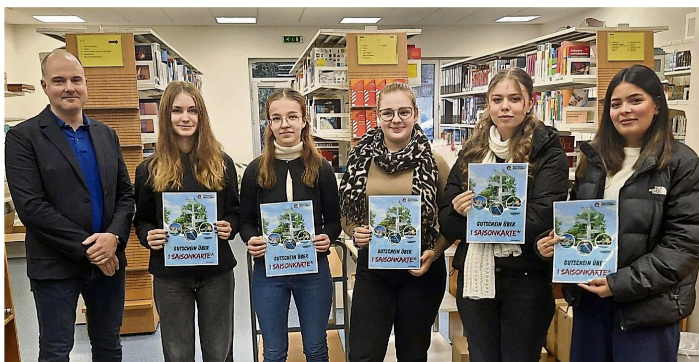
Schülerinnen der Johannisbergschule nahmen erfolgreich an der Quizwoche der Beruflichen Schulen Witzenhausen teil und lernten dabei nicht nur die Bibliothekssystematik, sondern auch den Umgang mit modernen Recherchetools.

Die Quizaufgaben basierten nach eigenen Angaben auf der Bibliothekssystematik, die an die Struktur von Universitätsbibliotheken angelehnt sei. Neben dem Lösen der Aufgaben erhielten die Schülerinnen und Schüler dabei auch eine praktische Einführung in den Umgang mit dem Bibliothekskata-