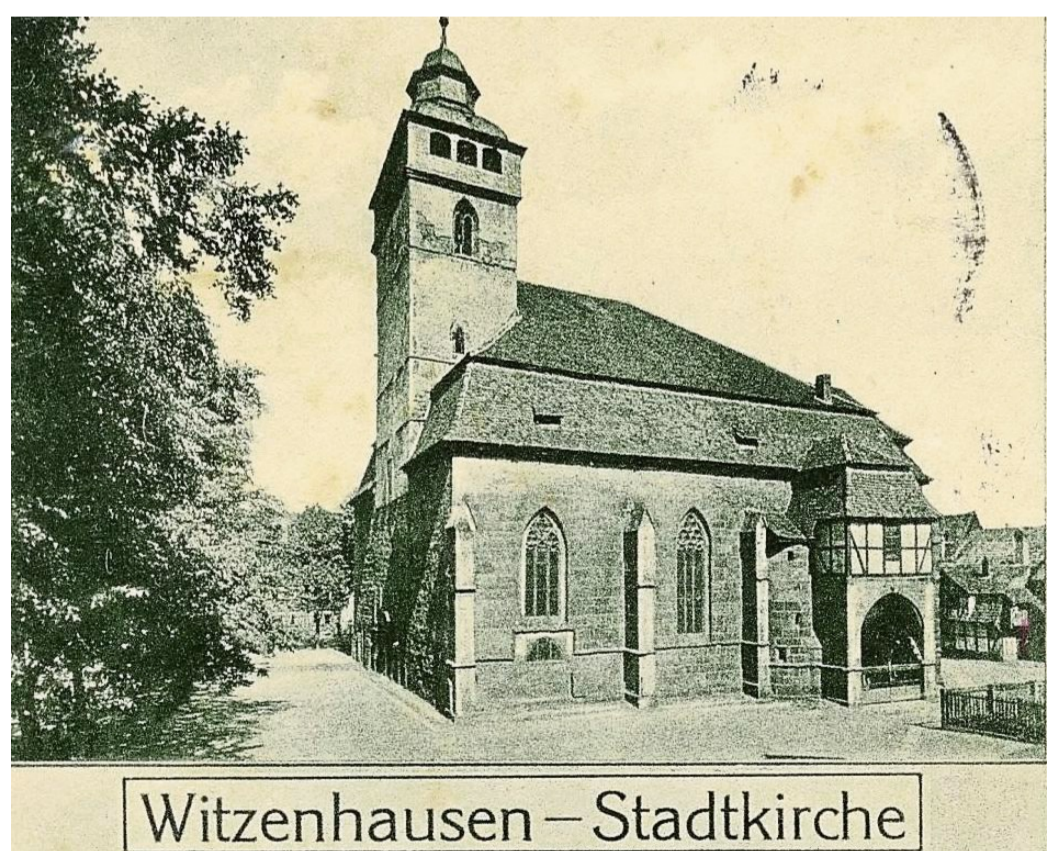
Witzenhausen – Stadtkirche

Leider gibt's es vom Ergebnis dieser Anordnung keine Bild-dokumente, aber interessant ist mit dieser Ausschmückung der Straßen durch Girlanden aus Tannen-