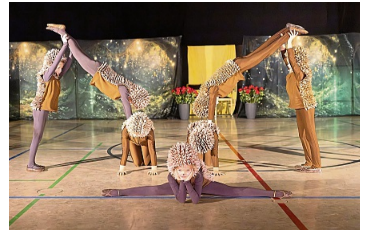
Die kleineren Tänzerinnen begeisterten bei der Aufführung mit ihrer anspruchsvollen Igel-Choreografie.