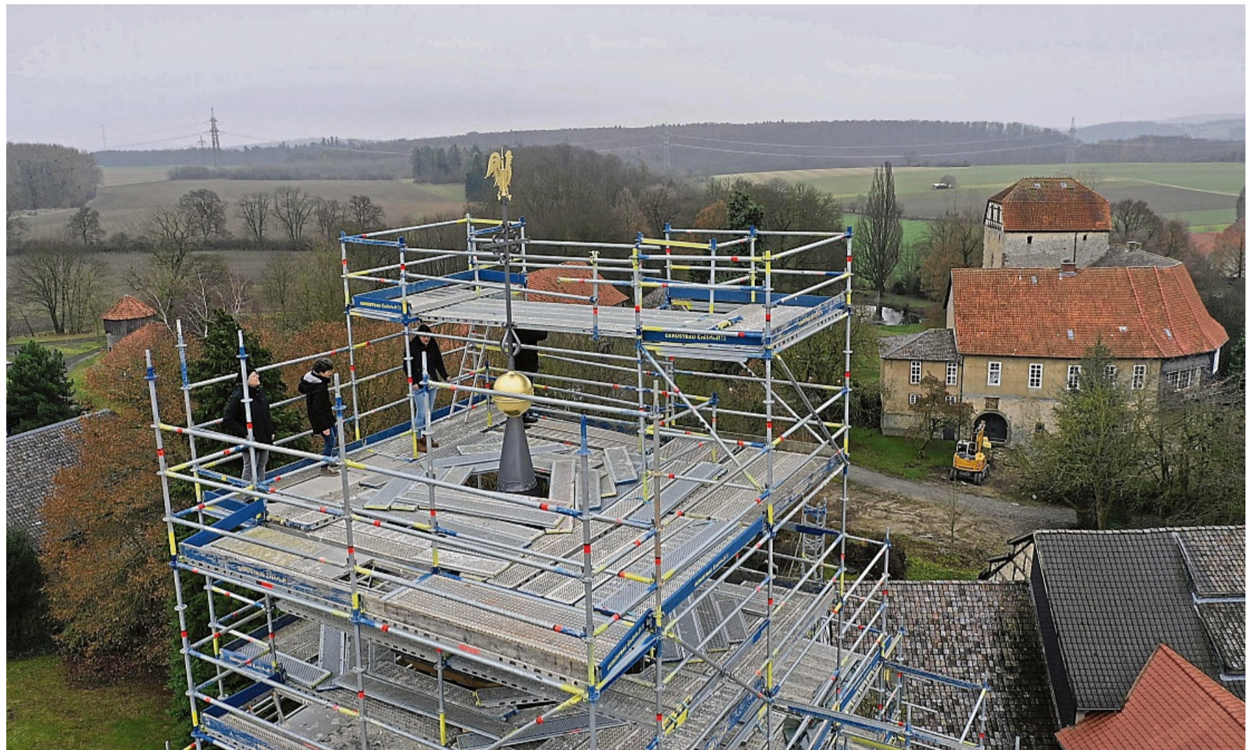
Strahlt wieder über Jühnde: die vergoldete Kugel mit Wetterhahn auf dem Turm der St. Martini-Kirche, dahinter der Gutshof von Schloss Jühnde.