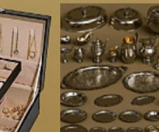
Für Schmuckschatullen zahlen wir bis 150 € extra - wir kaufen auch Modeschmuck