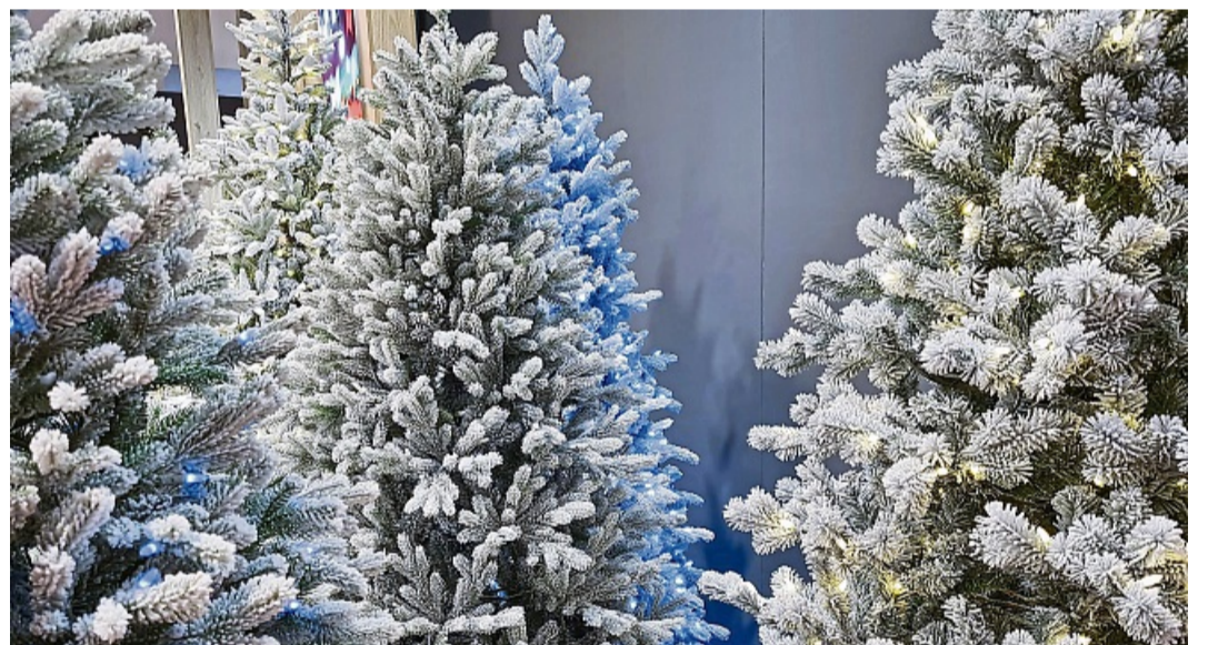
Wer über einen künstlichen Weihnachtsbaum nachdenkt, sollte ein Modell auswählen, das viele Jahre lang gefällt.

Die Auswahl im Onlinehandel ist besonders groß. Vom Kauf im Internet rät Philip