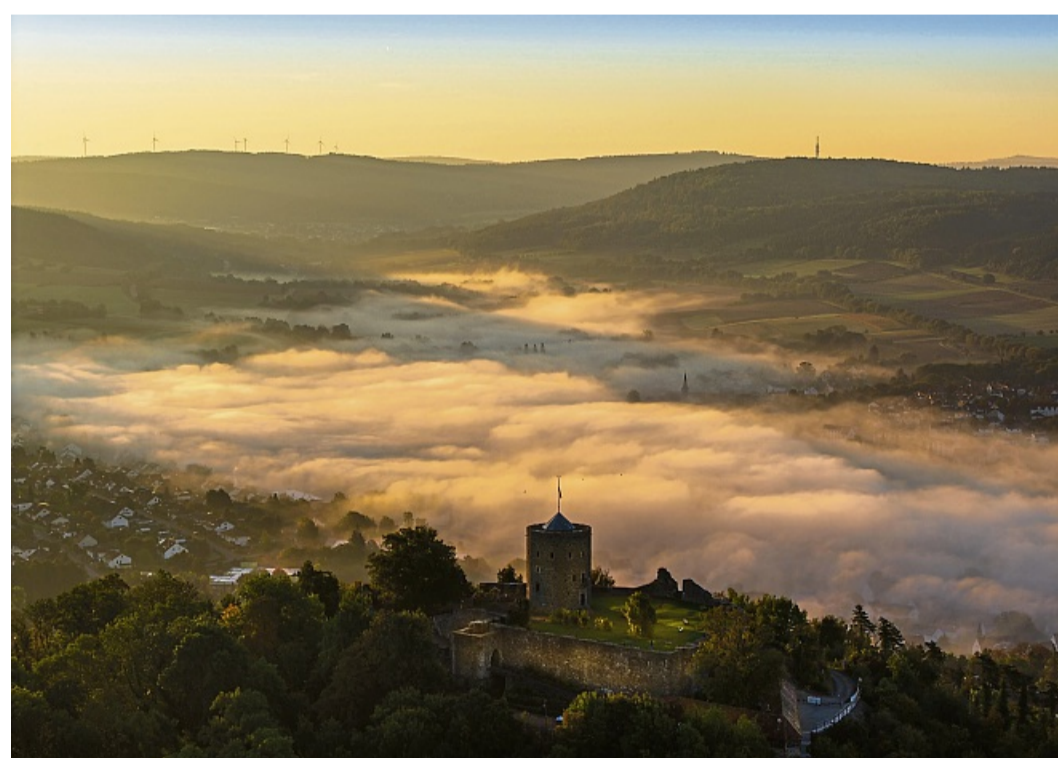
Homberg im Nebel: Auch in der Kreisstadt wird es schwieriger, ausgeglichene Haushalte zulegen. Das Bild zeigt die Hohenburg.

Investiert werden soll auch in die Feuerwehren – eine Million