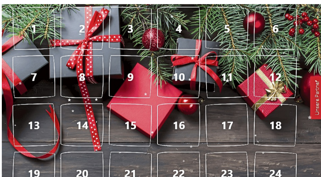
Überall steckt ein Gewinn hinter: der digitale HNA-Adventskalender 2025.

Mit dem Dezember beginnt nicht nur die Zeit der Besinnlichkeit und des Advents, sondern auch die Zeit der täglichen Überraschungen. So auch bei der HNA: Mit unserem digitalen Adventskalender wollen wir Sie täglich mit einem exklusiven Gewinn überraschen, um so die Wartezeit bis zum Weihnachtsfest zu verschönern. Zu finden ist der Adventskalender auf der HNA-Internetseite. Hinter jedem Türchen warten tolle Preise auf die teilnehmenden Leser und Leserinnen. Bereitgestellt werden diese von regionalen Unternehmen aus Nordhessen und Südniedersachsen. Von Technikprodukten über Einkaufsgutscheine und Erlebnispreise bis hin zu Reiseangeboten ist alles dabei. Die Teilnahme ist schnell und unkompliziert. Ganz einfach im Internet auf zu.hna.de/kalender2025 ge-