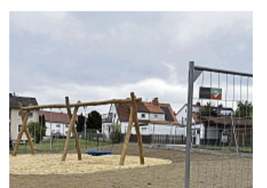
Dorfentwicklung in Wernswig: Neben Spielmöglichkeiten soll der Spielplatz auch ein Ort der Begegnung sein.

Wernswig – Im Zuge des Umbaus des Hofes Rohde in Wernswig zu einer Kindertagesstätte ist auf der hinteren Fläche des Gartens ein öffentlicher Spielplatz entstanden. Die Spielplätze an der Schulstraße und an der Straße Neue Länge sollen hingegen geschlossen werden, teilt die Stadt mit.