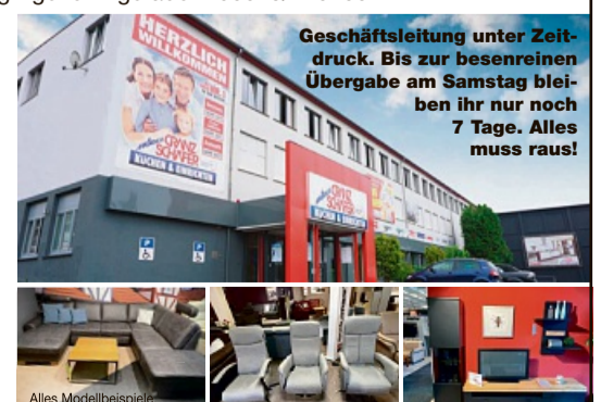
Alles Modellbeispiele. Geschäftsleitung unter Zeitdruck. Bis zur besenreinen Übergabe am Samstag bleiben ihr nur noch 7 Tage. Alles muss raus!

Sie kaufen 1 Matratze und erhalten dafür 2! Das ist die Gelegenheit beim Matratzenkauf richtig Geld zu sparen. Nur für kurze Zeit: Inkl. Lieferung! Also, worauf warten Sie noch? Die Total-Räumung findet in den Geschäftsräumen von Cranz und Schäfer statt, Brüder-Grimm-Straße 4 in 36199 Rotenburg a.d.F. Mo.-Fr.: 10:00-18:30 Uhr, Sa.: 10:00-16:00 Uhr geöffnet. Tel.: 06623/410108.