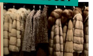
Für Pelze und Nerze zahlen wir bis zu 12.000,- € *

Wir kaufen auch größere Mengen von Nachlässen