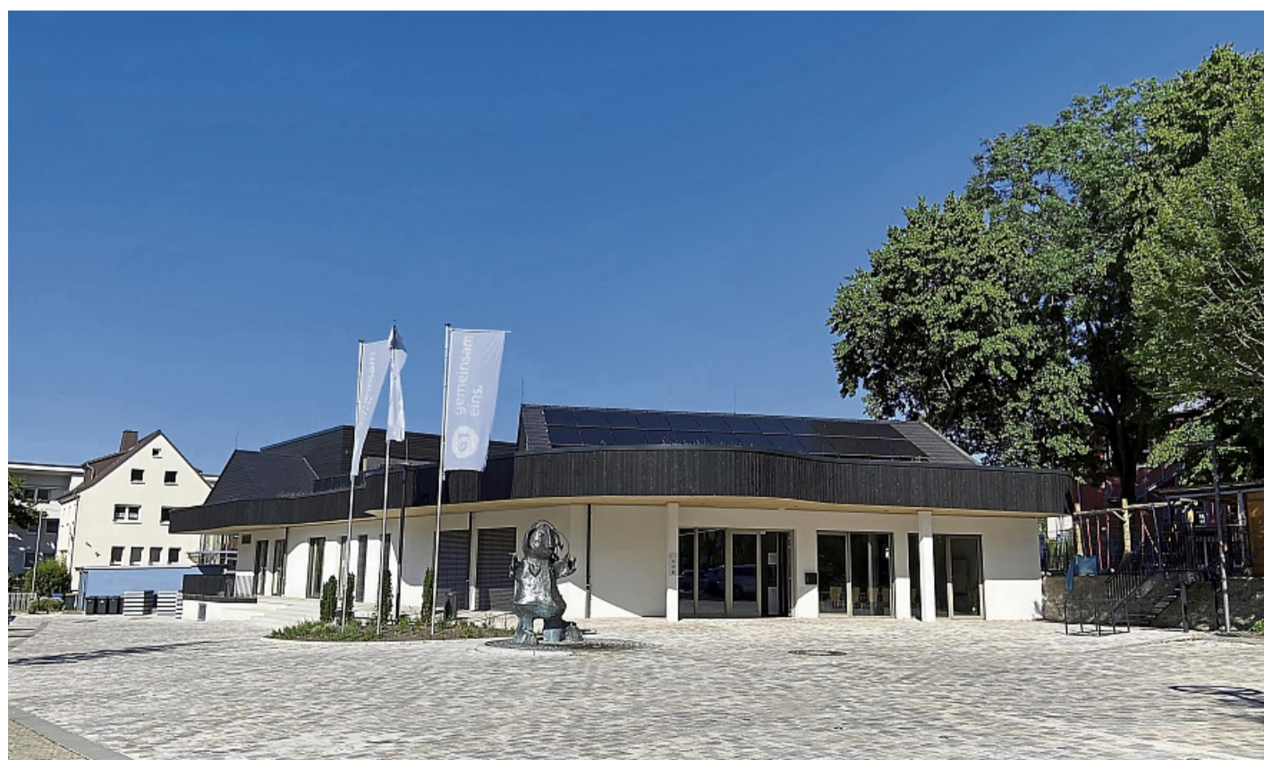
Preisgekrönt: Das neue Begegnungs- und Kommunikationszentrum G1 hat aufgrund seiner Bauweise in diesem Jahr drei Auszeichnungen erhalten.