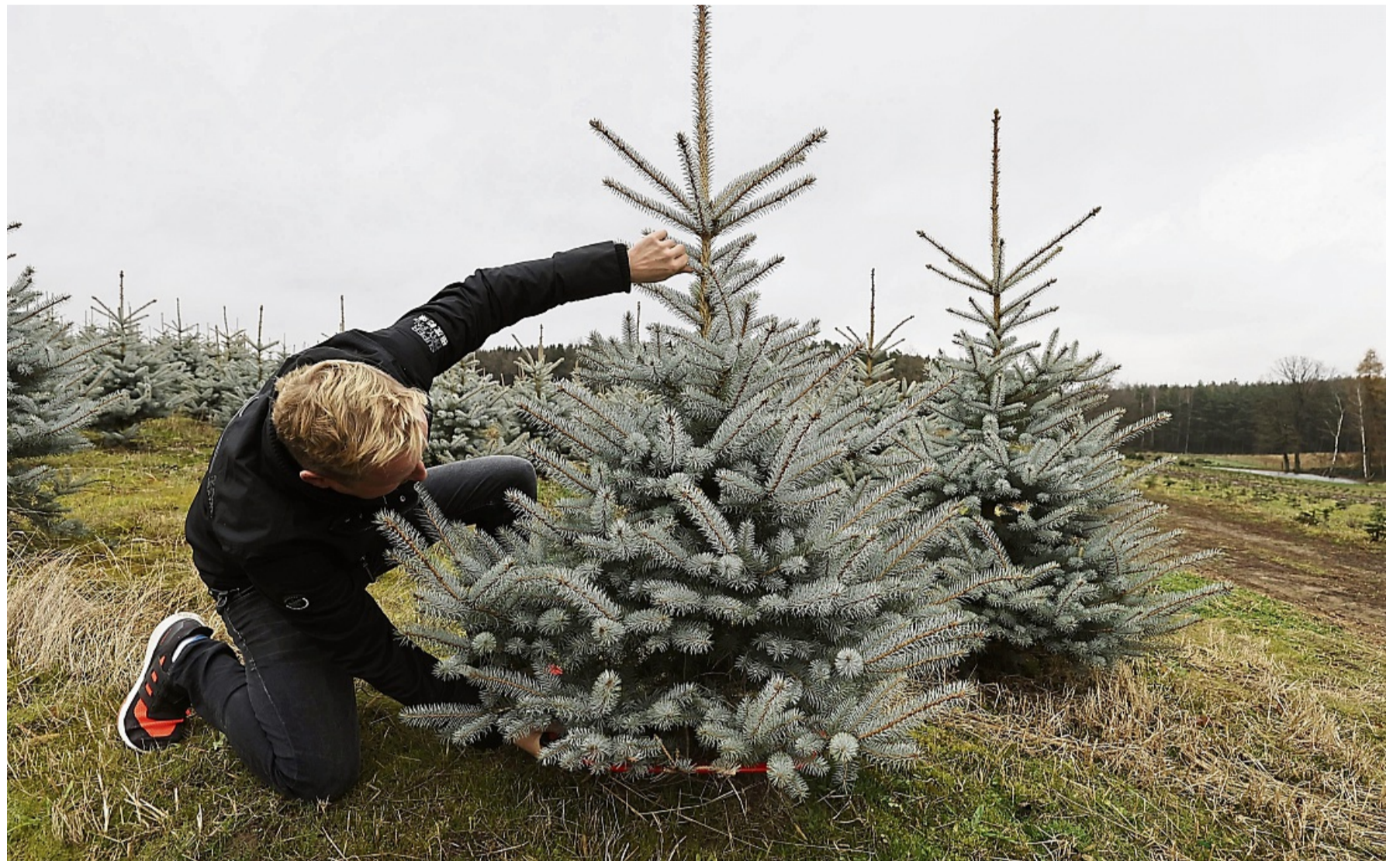
Zuerst die passende Höhe ausmessen, dann das Bäumchen auswählen und absägen - denn im Freien wirkt die Blaufichte kleiner als im Wohnzimmer.

Am besten kauft man heimische Bäume wie Fichten, Kiefern und Tannen, die auf soge-