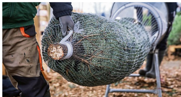
Wer einen Weihnachtsbaum kauft, sollte darauf achten, dass der Anschnitt frisch aussieht.