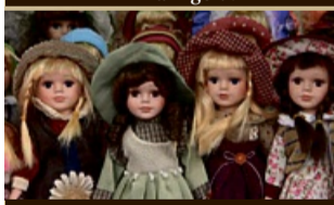
Puppen zu Höchstpreisen von 1.500,- €

Zahngoldsammelaktion! Sie erhalten aktuell 20% mehr für Ihr Zahngold.