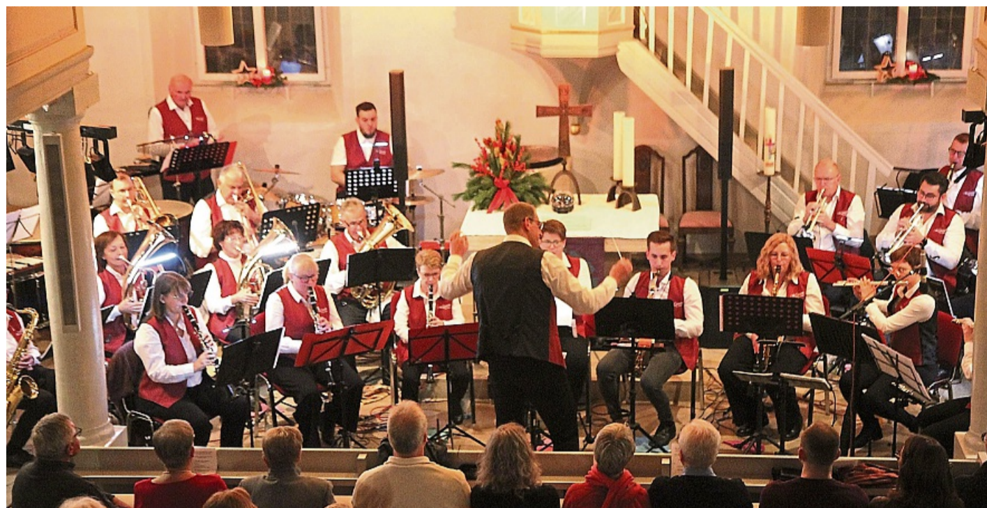
Sorgen für eine vollbesetzte Kirche: Das Körler Orchester spielte vor mehr als 250 Gästen.

Mit dem oft gespielten Weihnachtslied „Christmas Joy“ eröffneten die Instrumentalisten das Programm. Schon zu Beginn des Konzerts zeigte das Orchester mit den Musikstücken „Celebration and Song“ von Robert