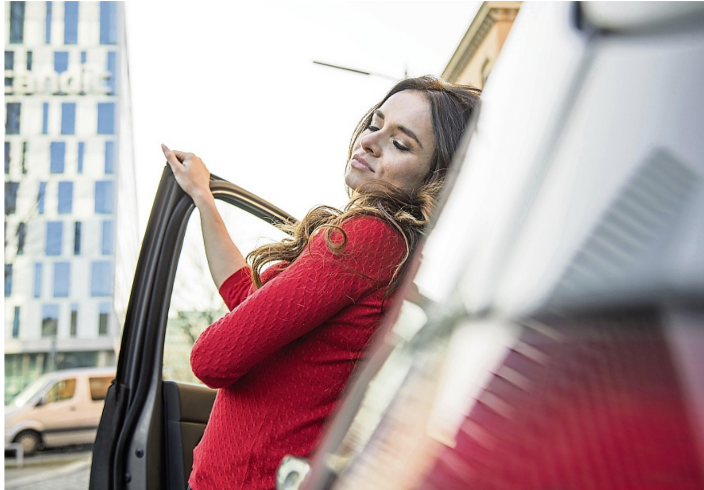
Wer Warnzeichen eines Sekundenschlafs bemerkt, legt besser eine Pause ein.

Dass Fahrer Müdigkeitsanzeichen ernst nehmen sollten, zeigt auch dieser Vergleich: Wer seit 17 Stunden wach ist, ist in seiner Fahrtauglichkeit bereits in etwa so eingeschränkt wie bei einer Blutalkoholkonzentration von 0,5 Promille. 24 Stunden ohne Schlaf entsprechen