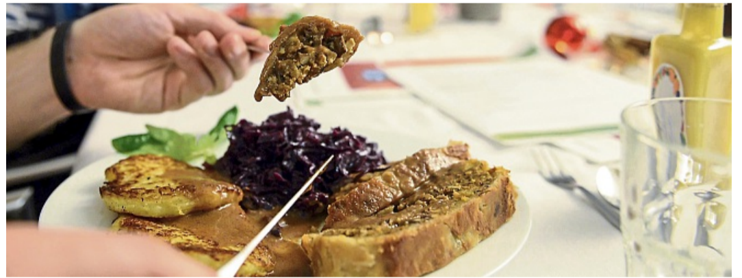
Vegetarische Gerichte mit saisonalem Gemüse wie Rotkohl, Wirsing oder Rote Bete sind günstige Alternativen zum klassischen Festtagsbraten.