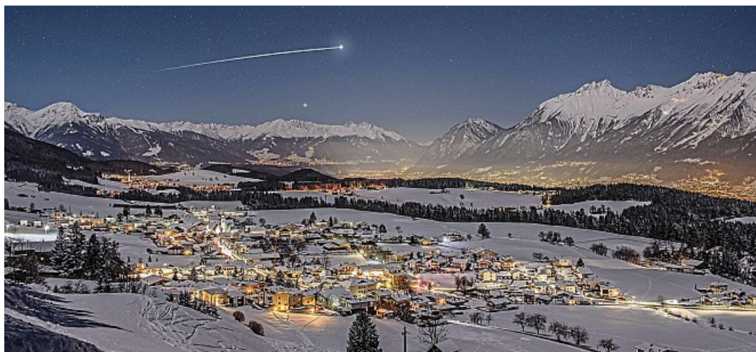
Eine herrliche Winterstimmung herrscht in Tulfes am Fuße des Glungezer.