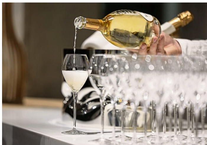
Für die Perlen im Schaumwein sorgt die zweite Gärung. Bei der traditionellen Methode nach Champagner-Art findet sie direkt in der Flasche statt. (zu dpa: «Perlen im Glas fürs Fest: Wie sich Schaumweine unterscheiden»)