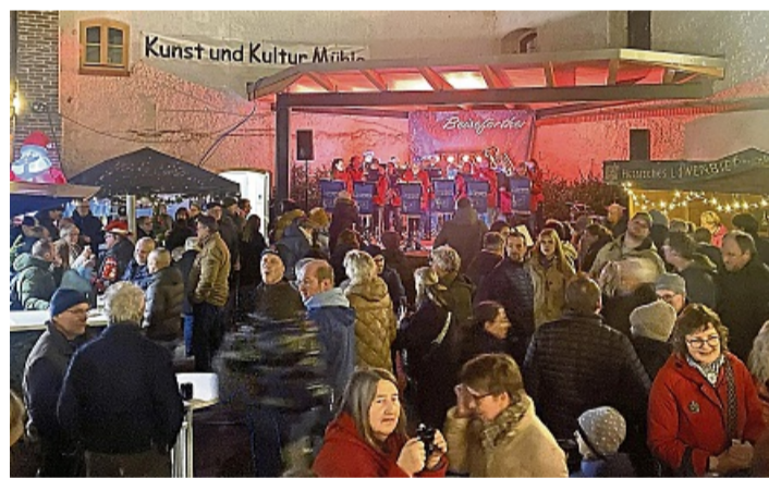
Stimmungsvoller Weihnachtsmarkt: 400 Menschen kamen nach Beiseförth.

Die Kinder der Astrid-Lindgren-Schule sorgten mit weihnachtlichen Liedern für Stimmung. Außerdem unterhielten Tim Hesselbein und die Bigband Haddamar das Publikum. Ergänzt wurde das musikalische Programm durch den Musikzug des TSV Malsfeld. Höhepunkte waren das gemeinschaftliche Singen, der von den