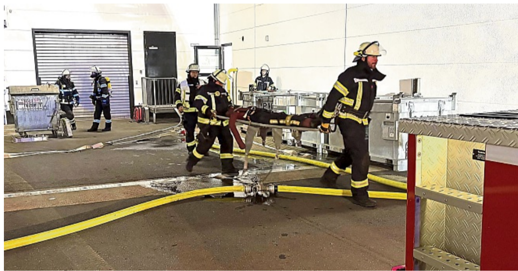
Der Verletzte wurde gerettet: Feuerwehren aus Günsterode, Kehrenbach, Kirchhof und der Kernstadt Melsungen übten am Mittwochabend.

hat. Nachdem diese Überprüfung negativ war, wurde von oben die Brandbekämpfung eingeleitet. Ein dicker Wasserstrahl aus dem Wasserwerfer ergoss sich auf das Hallendach. Zur klaren Ordnung der Einsatzstelle wurden drei Einsatzabschnitte gebildet: Innen, Außen und Wasserversorgung. Das benötigte Löschwasser wurde von Hydranten zu den Einsatzfahrzeugen und den Strahlrohren geleitet. Von den Einsatzabschnittsleitern wurden die Arbeiten der Trupps koordiniert.