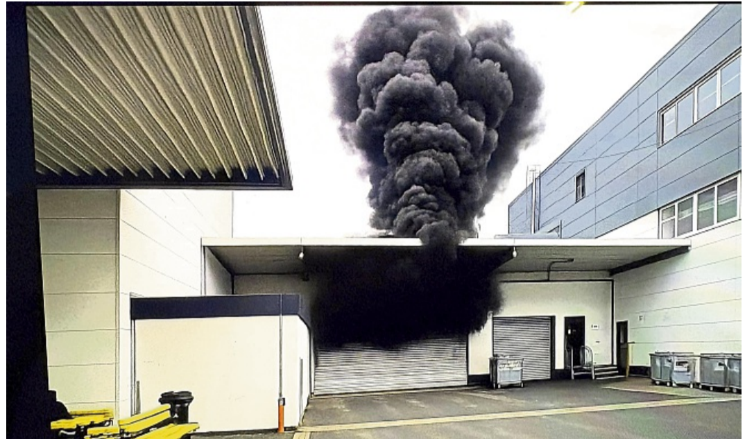
Das Szenario: Mit diesem künstlich erstellten Bild wurden die Feuerwehrleute an der Einsatzstelle auf die Situation vor Ort hingewiesen.

Während Atemschutzgeräte-träger sich zur Rettung ausrüsteten und dann in das Gebäude vordrangen, wurden aus dem Korb der Drehleiter die Fenster der gegenüberliegenden Gebäude abgefahren, um zu prüfen, ob sich dort noch Personen befinden, oder der Rauch sich schon bis in diese Räume ausgebreitet