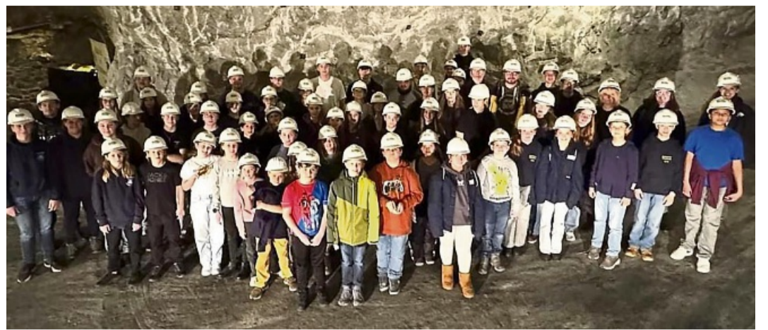
Vor den Salzlagerstätten: Die Melsunger Jugendfeuerwehrlaute waren beeindruckt von der Größe des Bergwerks.

In den Stall eingeladen und den Nachmittag vorbereitet hatte der Förderverein Dorfgemeinschaftshaus Kirchhof, der am Ende den Besucherinnen und Besuchern ein kleines Sterngebäck mit auf dem Weg gab. Die Freiwillige Feuerwehr Kirchhof sorgte dafür, dass die etwa 100 Autos einen Platz auf dem Hof fanden. ddd