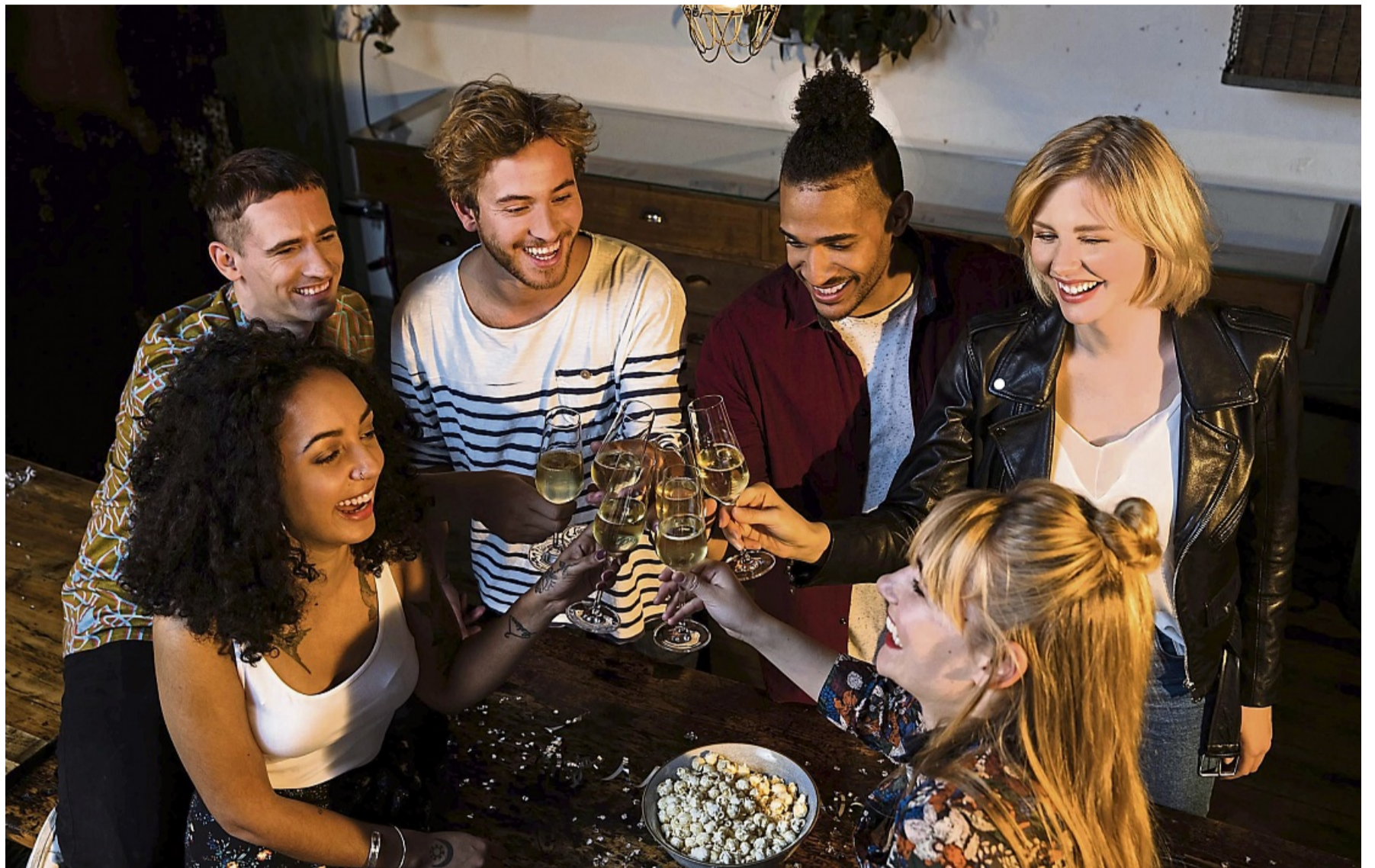
In Familie, unter Kollegen oder Freunden: An Geburts- und Festtagen, zu Jubiläen oder Silvester gönnt man sich sprudelnden Schaumwein.

Was für Champagner gilt, gilt auch andernorts: Spanischer Cava, italienischer Franciacorta und Crémant werden ebenfalls nach der klassischen Flaschengärung hergestellt. Crémant gibt es vor allem in Frankreich, darf nach EU-Recht aber auch in anderen Ländern produziert werden.