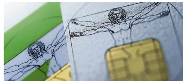
Gesetzlich garantiertes Recht: Versicherte können jederzeit innerhalb ihrer privaten Krankenversicherung in einen anderen Tarif wechseln und dabei ihre Altersrückstellungen behalten.

Übrigens: Ein Wechsel zu einer anderen privaten Krankenversicherung ist häufig nicht ratsam, so die Experten. Denn dort ist man Neukunde oder -kundin. Die Tarife sind oft deutlich teurer, weil man schon älter ist und mögliche Risikozuschläge hinzukommen. Und man verliere unter Umständen einen Teil oder alle angesparten Altersrückstellungen. dpa