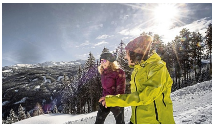
Am Glungezer Berg kann man sich auf eine wunderschöne Winterwanderung begeben.

Übernachtungen in der Region Hall-Wattens inklusive der Eintritte für das Museum Münze Hall und Münzerturm sowie die Swarovski Kristallwelten, dazu eine Stadtführung durch die historische Altstadt von Hall.