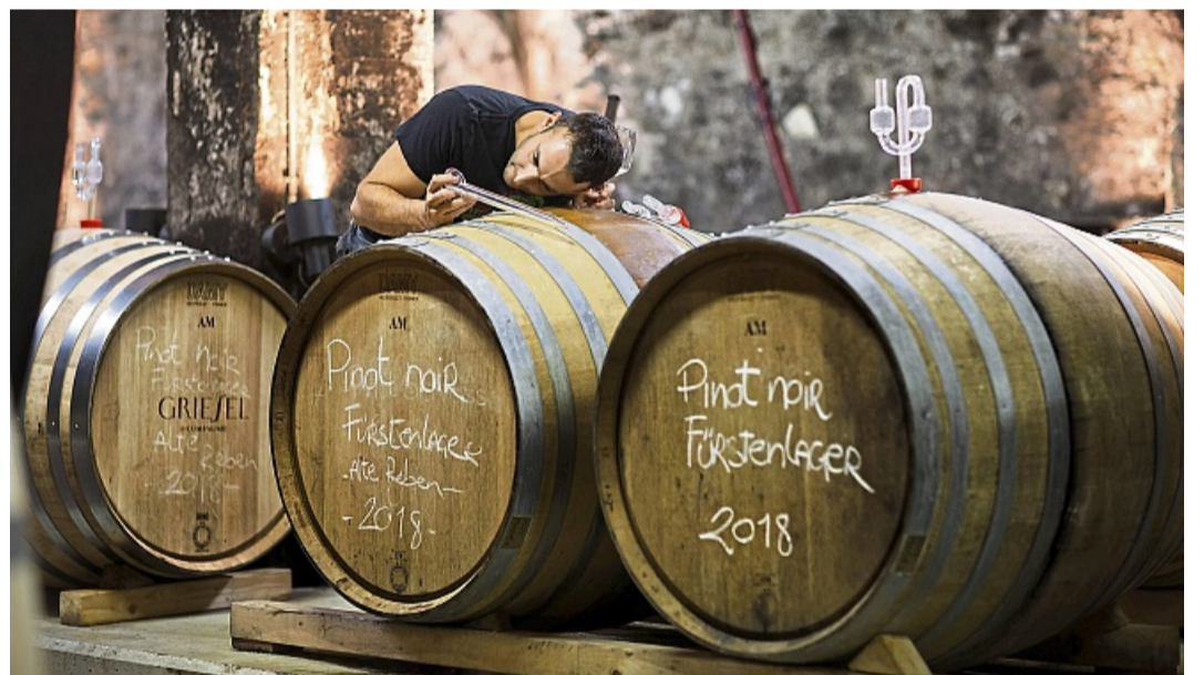
Die erste Gärung von Winzersekt findet in Fässern der Weingüter statt.