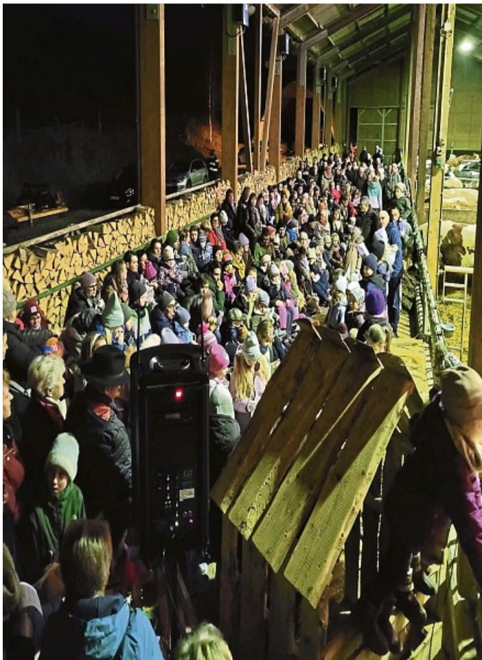
Advent im Stall: Viel los war in Kirchhof zur Weihnachtsgeschichte. CHRISTIANE MEURER-KRAMER