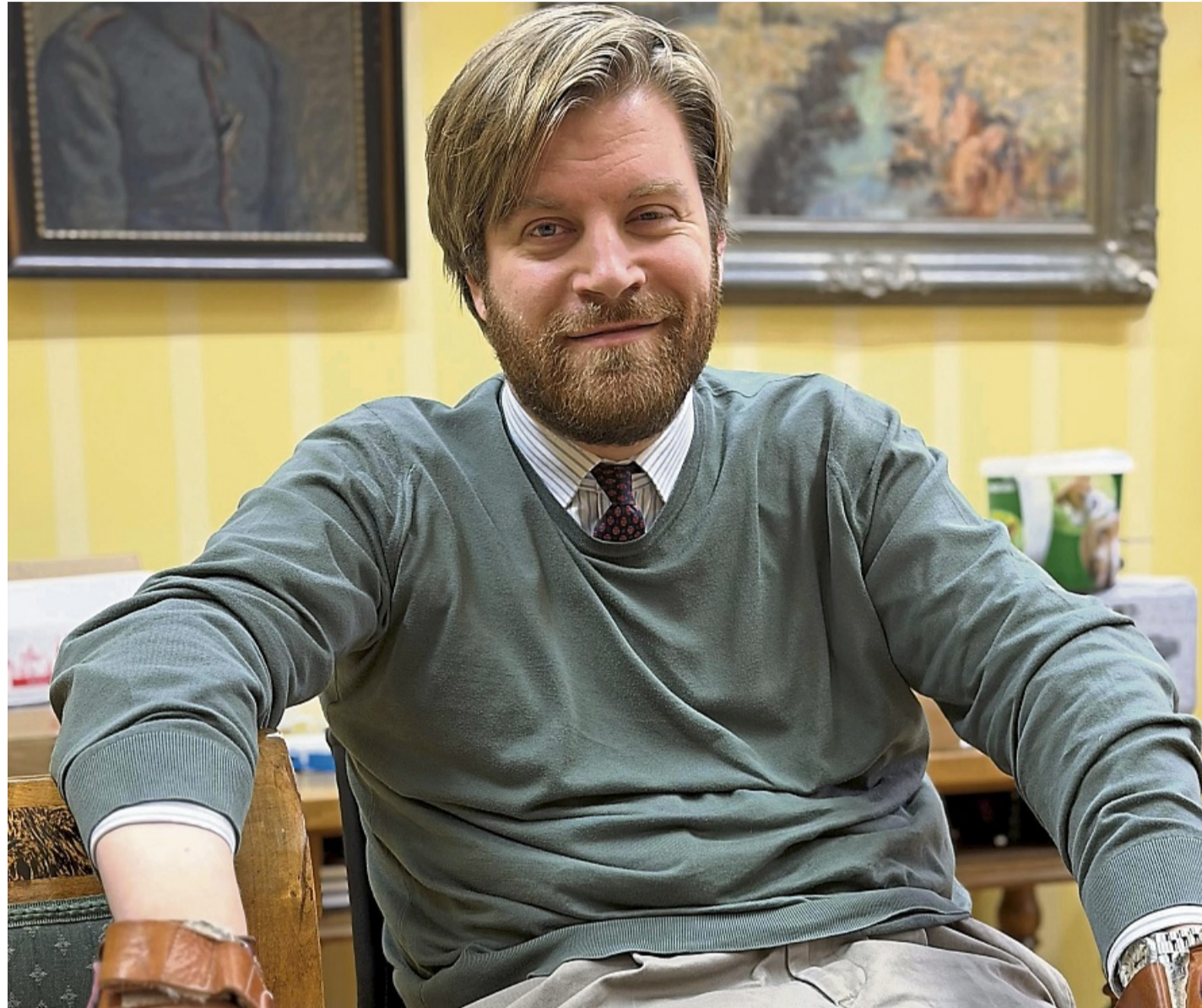
Fürst Carl Anton zu Waldeck und Pyrmont verwaltet für die Fürstliche Stiftung von Bad Arolsen 3300 Hektar Privatwald.

„Ich bin überzeugter Europäer“, sagt Fürst Carl Anton. Umso wichtiger sei es, dass man konstruktiv mitgestalte und nicht nur kritisiere. Es sei nicht ganz einfach, einheitliche Regeln für den Wald im feuchten Skandi-