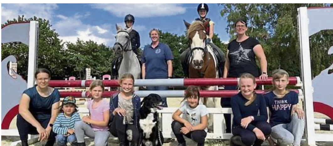
Dankbar für Unterstützung: Mitglieder des Reit- und Fahrvereins Korbach auf dem neuen Jugendparcours mit modernen Hindernissen.

Fördergeld für Reit- und Fahrverein Korbach aus Leader-Budget