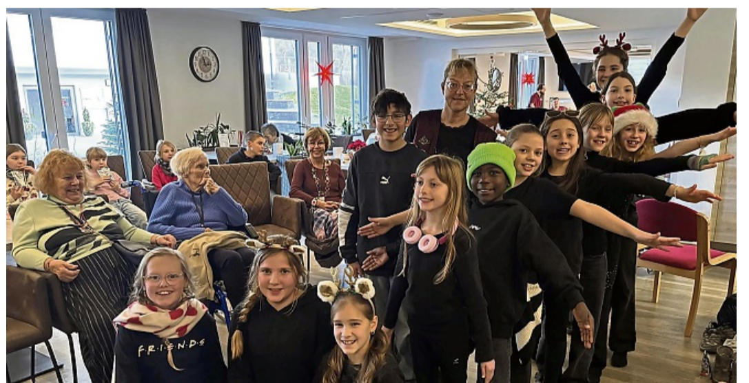
Ein musikalisches Stück präsentierte die Schau-Spiel-AG der Uplandschule im Pflegehotel.

Schau-Spiel-AG der Uplandschule besucht Willinger Pflegehotel