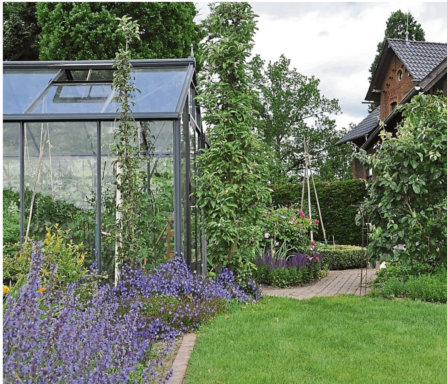
Gartenenthusiasten freuen sich schon jetzt auf die nächsten „Offenen Gärten“ im kommenden Jahr in Waldeck-Frankenberg. Anmeldungen sind noch willkommen.