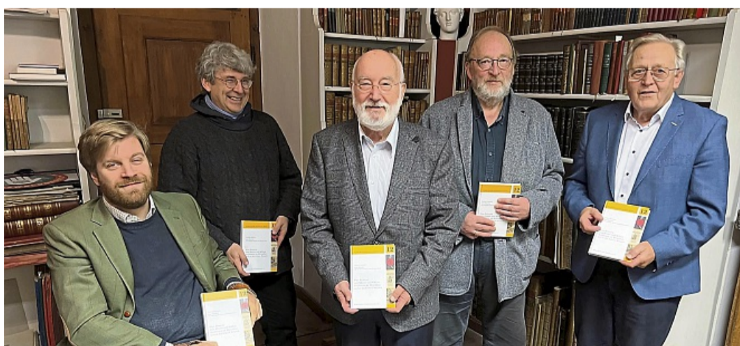
Eine Zeitreise zum Kloster und Schloss Aroldeffen hat Prof. Gerhard Aumüller in der Buchreihe des Geschichtsvereins veröffentlicht.

Ausblick auf Vortrag, Filmabend und Vorstandswahl