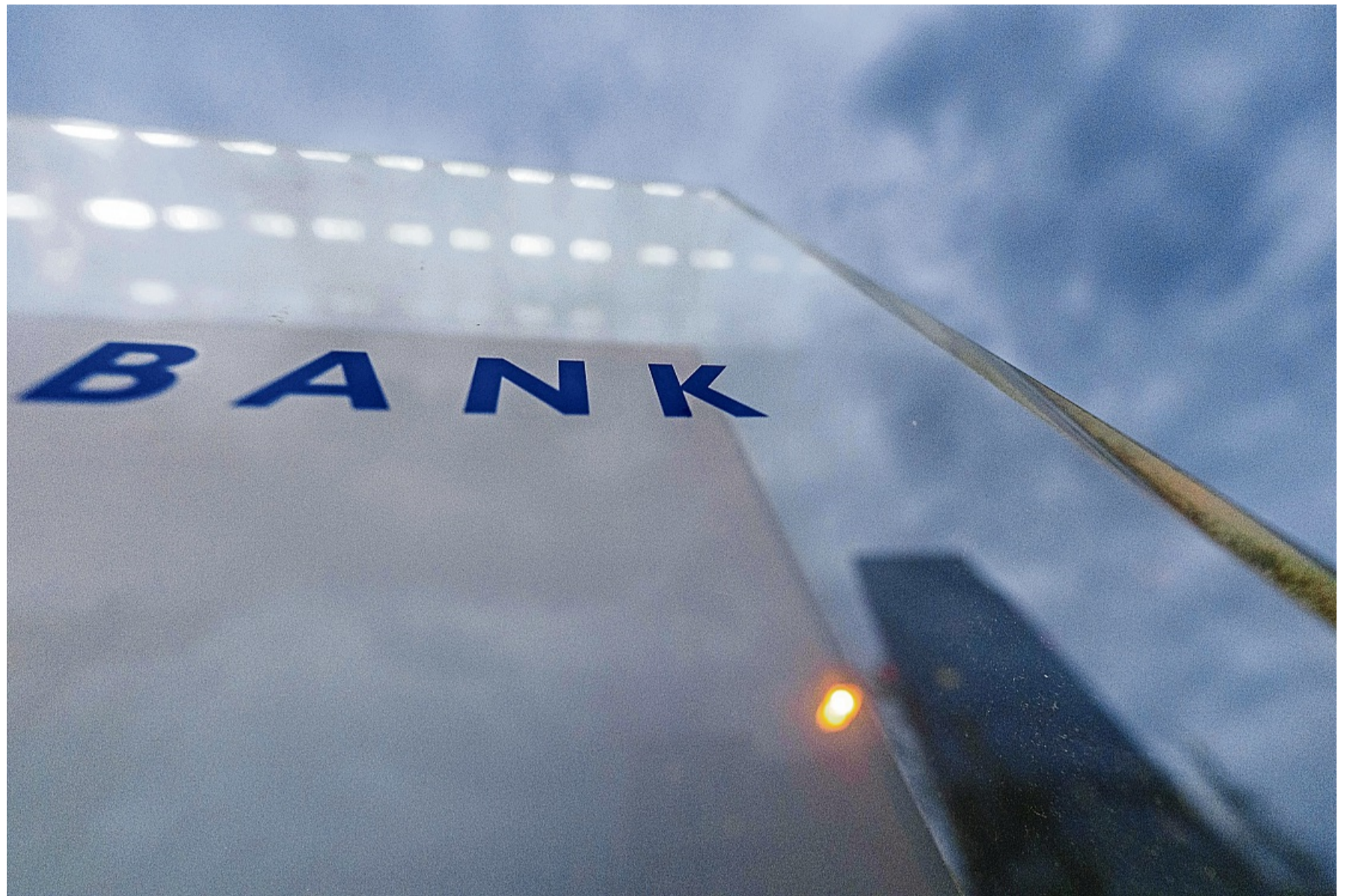
Welche Auskünfte darf meine Bank eigentlich von mir verlangen? Das kommt ganz darauf an, welches Produkt nachgefragt wird.

Deshalb muss die Bank einschätzen können, wie groß das Risiko ist, geliehenes Geld womöglich nicht zurückzubekommen.