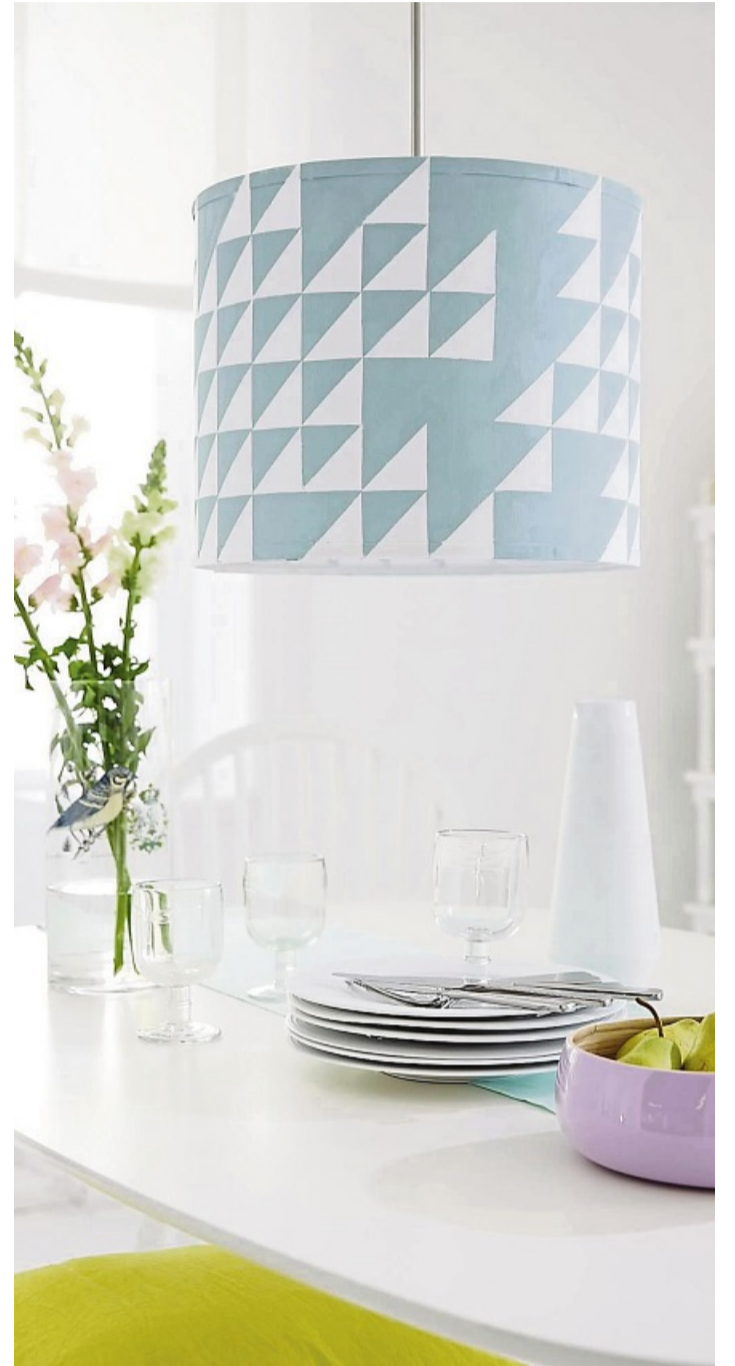
Mit diesem Muster sieht der Lampenschirm wie neu aus - einfach Dreiecke abkleben und etwas Farbe auftragen.

Leuchten aus Papier sind beliebt. Sie müssen sich aber nicht unbedingt eine neue Designerlampe kaufen. Wer Geld sparen will oder alte Materialien lieber weiter verwendet, kann seinen Lampenschirm einfach upcyclen. Drei kreative Anregungen von der DIY-Academy: