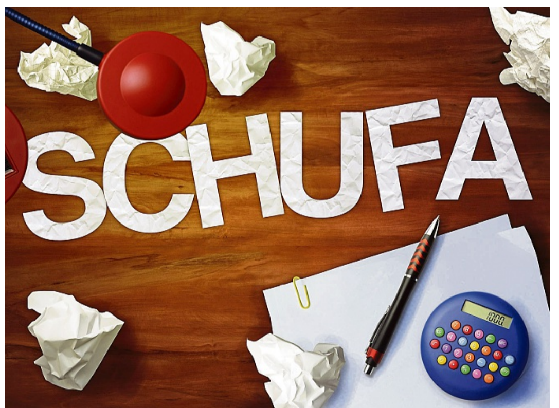
Anrecht auf ein einfaches Girokonto, ein sogenanntes Basis- oder Jedermann-Konto hat aber jeder Verbraucher, egal wie die Schufa-Auskunft ausfällt.