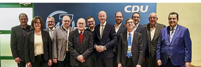
Blickten gemeinsam zurück auf viele Jahrzehnte politischer Arbeit in Volkmarsen: die CDU-Mitglieder mit ihren Gästen.