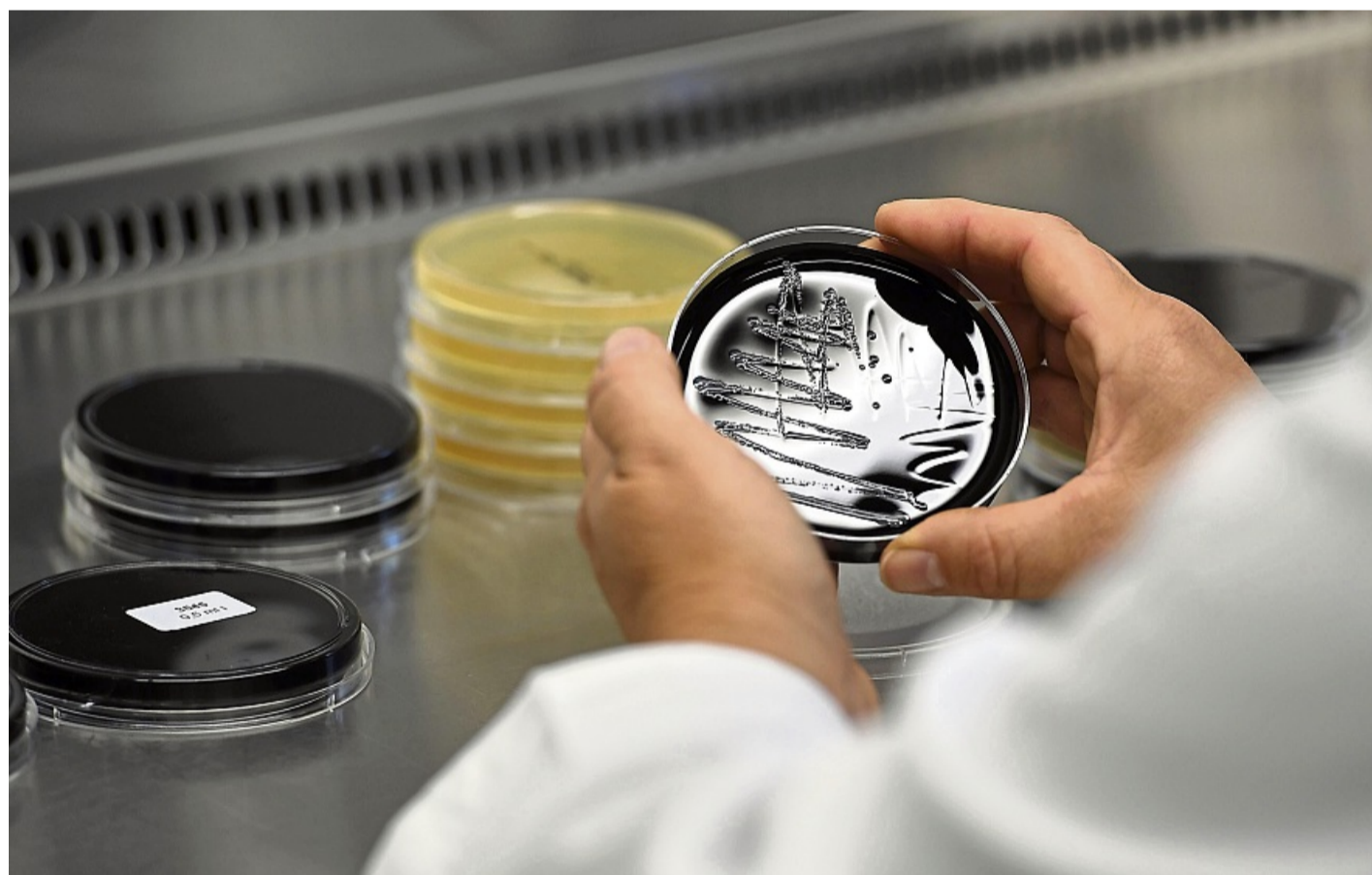
Legionellen kann man mit bloßem Auge nicht sehen und auch nicht riechen.