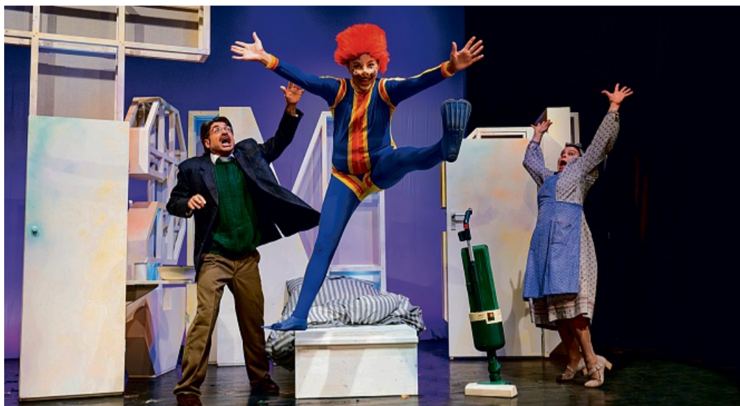
Das Theaterstück „Das Sams – Eine Woche voller Samstage“ wird in Korbach aufgeführt.