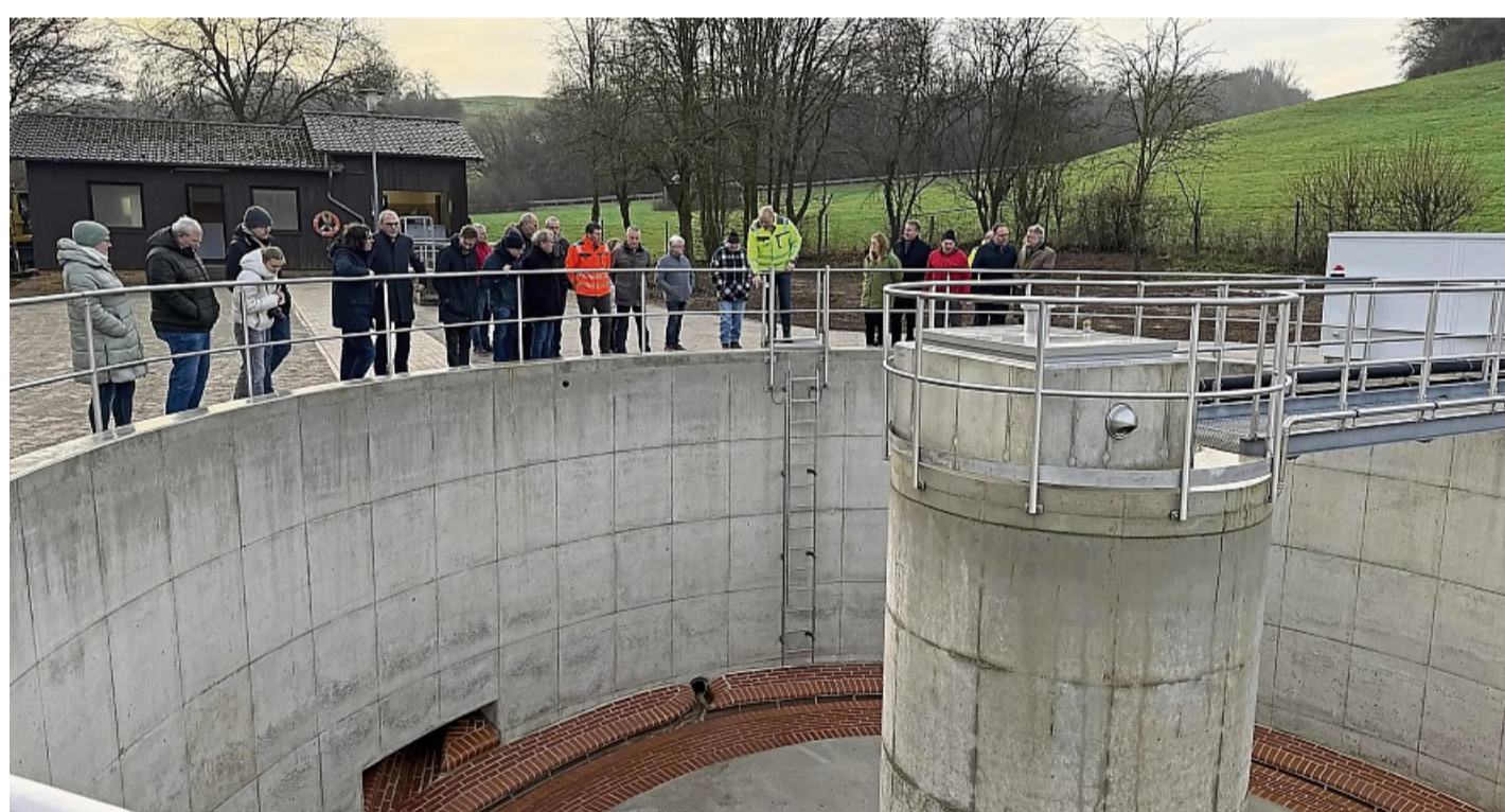
Das Regenüberlaufbecken auf dem Gelände der ehemaligen Kläranlage Kallental fasst 460 Kubikmeter. An dieser Stelle war einst der erste von vier Klärteichen der Teichkläranlage, die jetzt abgerissen wurde.

Nach vielen Nachbesserungsversuchen habe die Diemelstadt schließlich auf Anregung des damaligen Bürgermeisters Elmar Schröder und in enger Abstimmung mit den zuständigen Wasserbehörden auf beiden Seiten der Diemel beschlossen, die Kläranlage schrittweise stillzulegen und die anfallenden Abwässer über eine 1,7 Kilometer lange Abwasserleitung