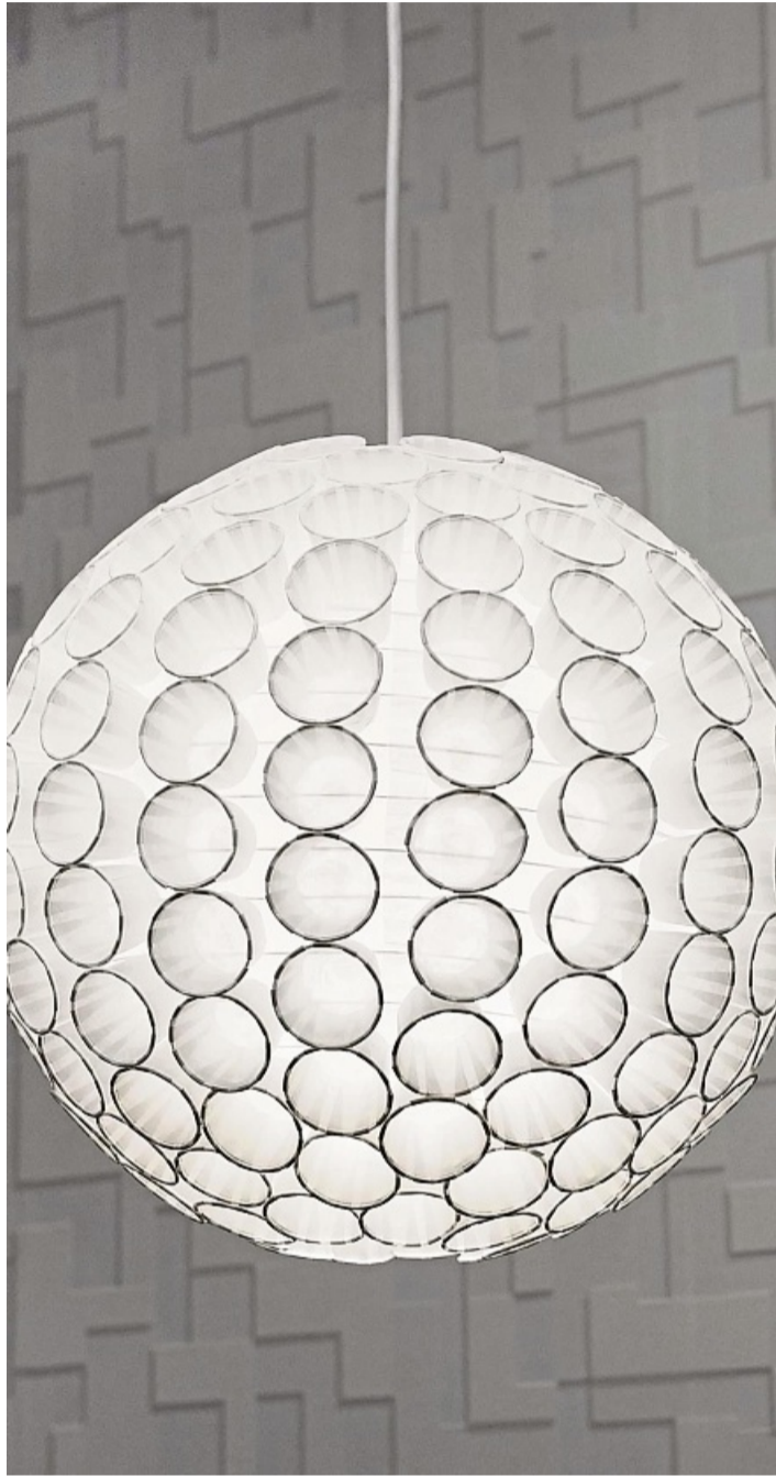
Die Pappbecher kleben an einem kugelförmigen Lampenschirm.

Selbst gemacht: So werden alte Lampen zu Unikaten