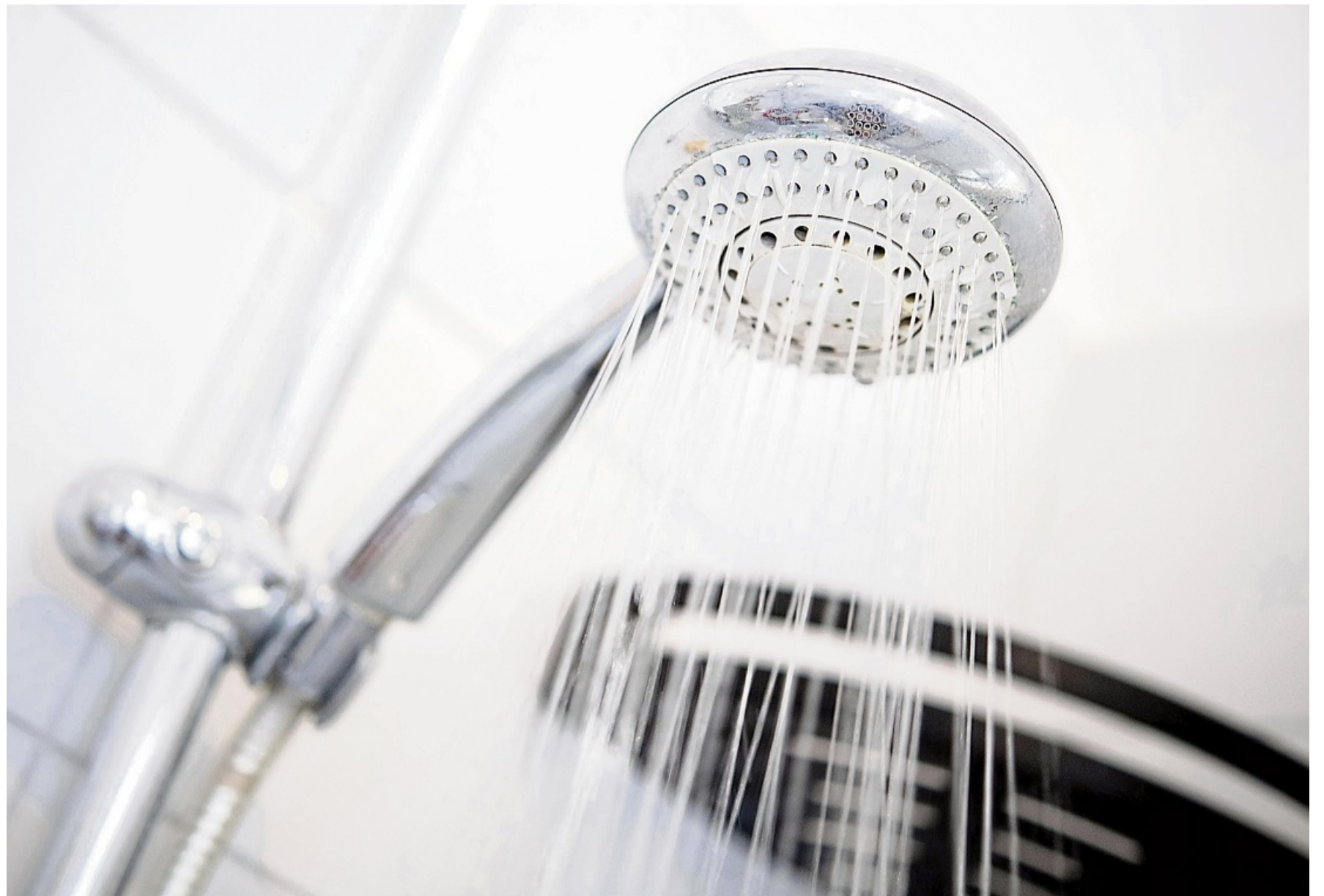
Bei längerer Abwesenheit sollte man Nachbarn, Freunde und Co. finden, die mal das Wasser laufenlassen.

Dafür haben Eigentümer und Vermieter zu sorgen, aber auch Mieter. „Der Eigentümer hat dafür zu sorgen, dass mindestens 60 Grad am Warmwasserspeicher anliegen, da Legionellen oberhalb dieser Temperatur absterben. Der Bewohner ist dafür