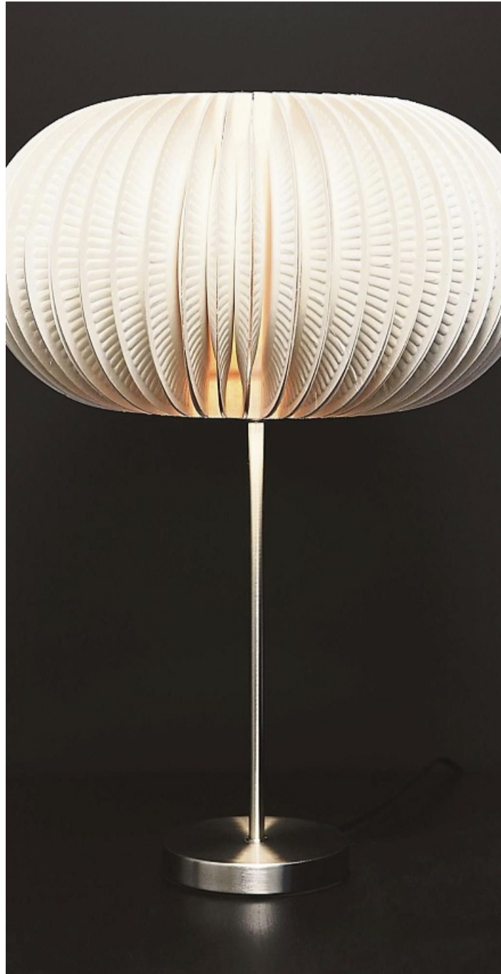
Durch die gefalteten Pappsteller erhält der Lampenschirm mehr Tiefe.