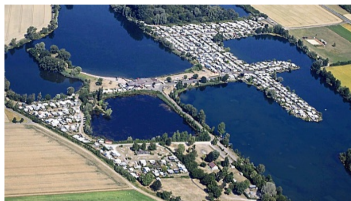
Fast ganzjährig ausgebucht ist der Campingplatz am Meinhardsee.

tigen Gesicht des Platzes. „Frauen haben ein anderes kreatives Händchen als Männer“, sagt Mi-