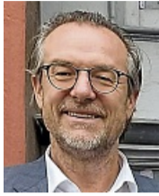
Thomas Eckhardt Bürgermeister

NEUJAHRSGRUSS des Bürgermeisters und des Stadtverordnetenvorstehers