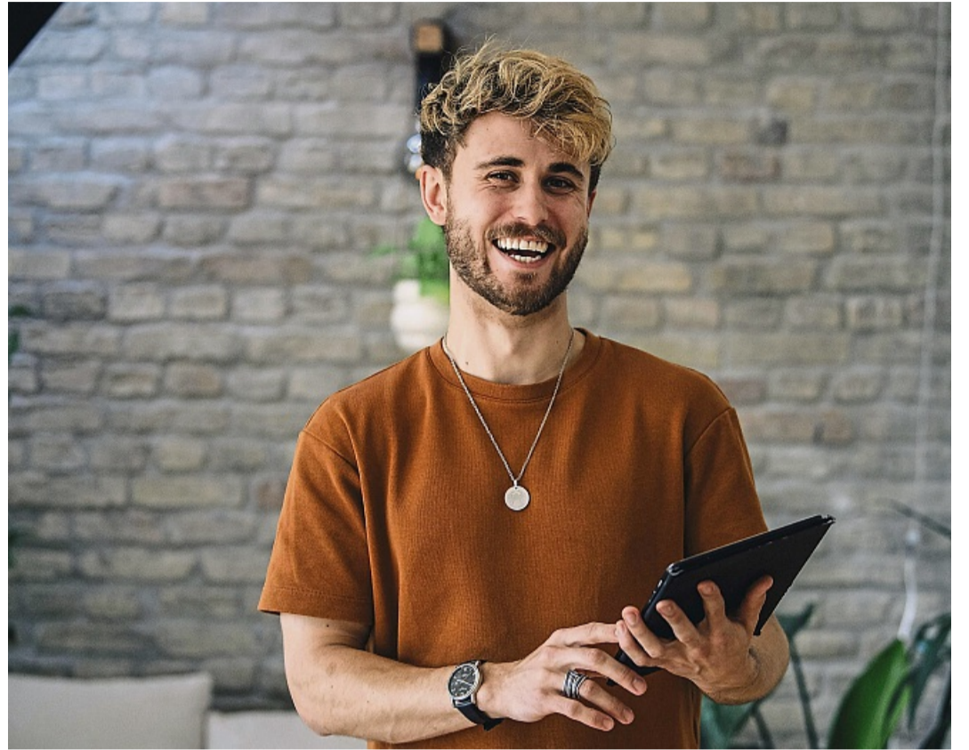
Wenn wir innehalten und bewusst handeln, entsteht Gelassenheit. Das lässt sich trainieren.

3. Kleine Rituale: Eine bewusste Pause nach dem Aufwachen machen. Oder mittags eine bewusste Pause ohne Multitasking einlegen. Einen Moment