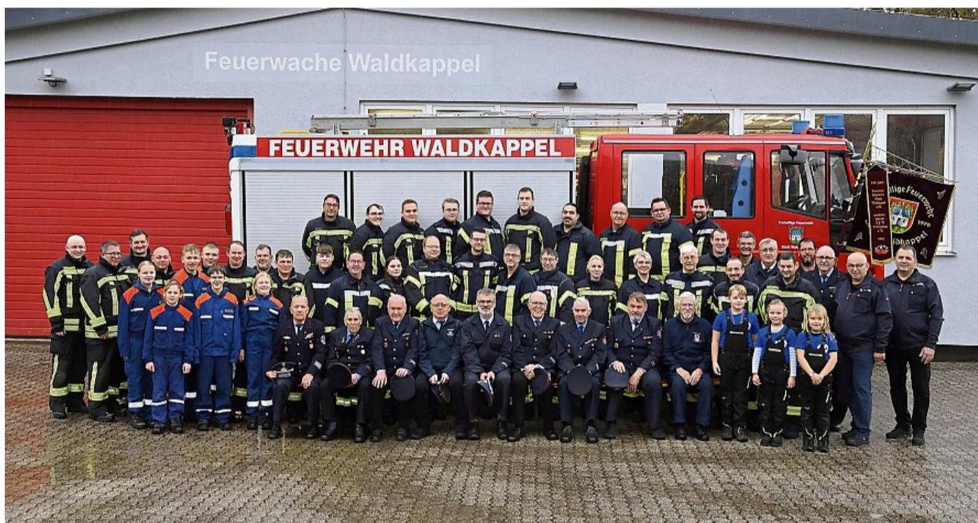
Die Mitglieder der Freiwilligen Feuerwehr Waldkappel freuen sich schon jetzt auf die Feierlichkeiten zum 150. Bestehen.

Zu Beginn der Feuerwehr Waldkappel konnten Brände nur mit den einfachsten Mitteln bekämpft werden. Um das Jahr 1900 kam zur technischen Einrichtung, die bislang aus einer Handdruckspritze bestand, eine frei stehende „Hüthersche Leiter“ dazu. Mit dem Bau einer Hochdruckwasserleitung wurde acht Jahre später auch der Brandschutz im Allgemeinen verbessert. Eine sogenannte Magirus-Drehleiter aus dem