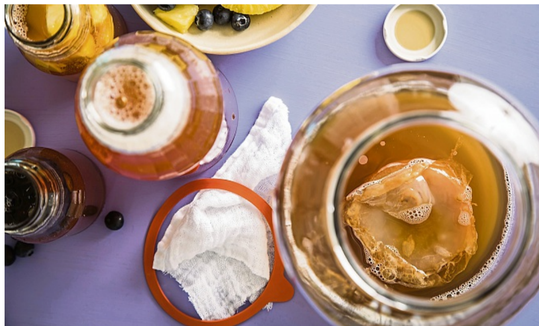
Ein kleines Feuerwerk an Aromen: Auch durch Fermentieren können komplexe Getränke entstehen – etwa Kombucha.