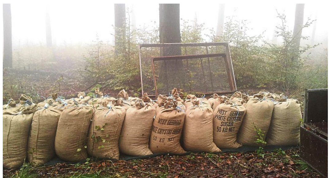
Die Ausbeute: So sieht es aus, wenn die Forstwirte Saatgut der Bäume geerntet haben.