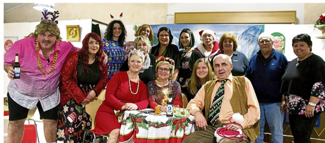
Die Aufführungen waren ein voller Erfolg: Die Kehrenbacher Theatergruppe blickt zufrieden auf das Jahr zurück.

Vor dem ersten Auftritt in diesem Jahr seien alle sehr aufgeregt gewesen, sagt Haase. Vor dem Vorhang warteten schließlich circa 160 Zuschauer und Zuschauerinnen. „Nachdem bei der ersten Vorstellung alles gut funktioniert hat, waren alle ganz entspannt“, berichtet Haase weiter.