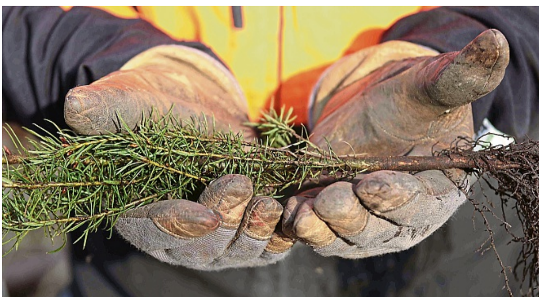
Verjüngen den Wald: Forstwirte pflanzen junge Douglasien, um Flächen wieder aufzuforsten.

„Dies liegt vor allem an den geringen Niederschlägen und der hohen Temperatur.“ Für den Wald wünscht er sich, dass es in den kommenden Jahren wieder höhere und regelmäßige Niederschläge gibt: „Die Bäume bräuchten mehrere niederschlagsreiche Jahre, um sich von der Trockenheit erholen zu können.“ MANFRED SCHAAKE