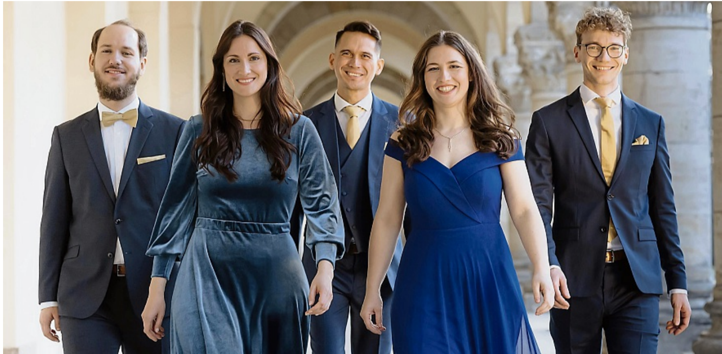
Sie kommen in die Melsunger Stadtkirche: Das Calmus Ensemble aus Leipzig.

Leipziger Musiker kommen in die Melsunger Stadtkirche – Vorverkauf läuft