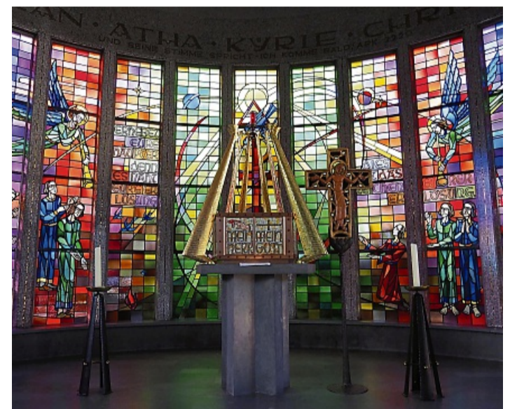
Das Chorfenster zeigt die Schöpfung und Erlösung in dramatischen, kräftigen Farben KRISTIN WEBER