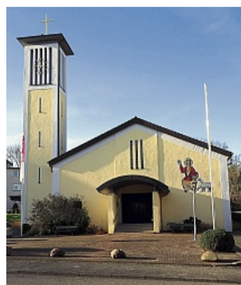
Die Kirche zum Göttlichen Erlöser in Witzenhausen wurde 1959 errichtet. Nach dem zweiten Weltkrieg war die vorherige Kapelle für die neuen Gemeindeglieder zu klein geworden.