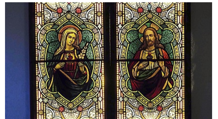
Glasfenster aus der Herz-Jesu-Kapelle , Maria und Christus KRISTIN WEBER