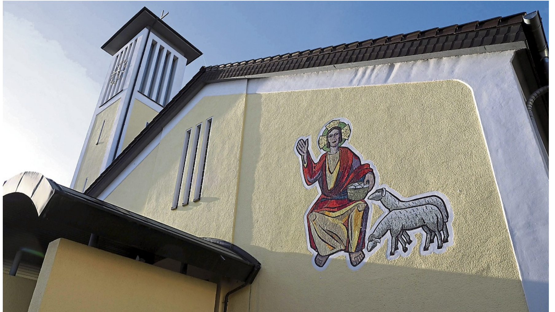
Die katholische Kirche zum Göttlichen Erlöser in Witzenhausen wurde 1959 errichtet. Nach dem zweiten Weltkrieg war die vorherige Kapelle für die neu hinzugekommenen Gemeindeglieder zu klein geworden.