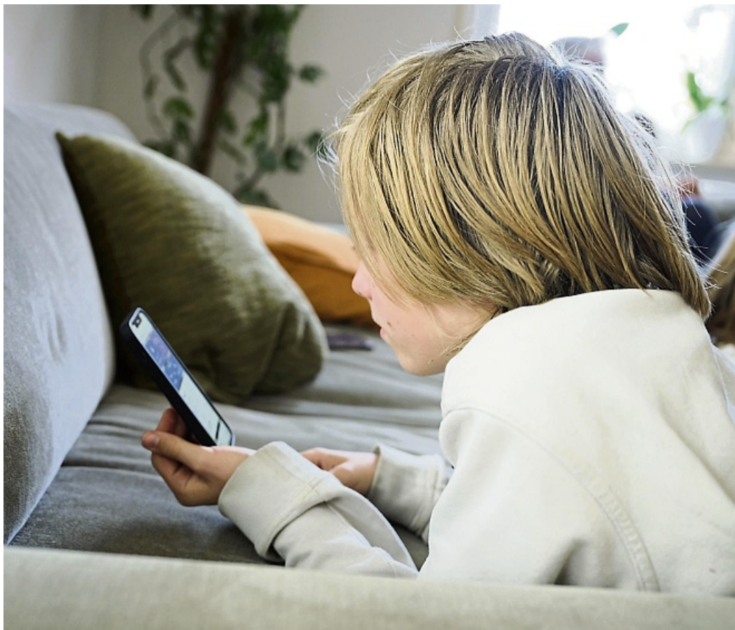
Mal easy peasy Influencer spielen? Viele Kinder vergessen, dass das auch Druck bedeutet, ständig Inhalte produzieren zu müssen, die Konkurrenz im Blick zu behalten und verschiedene Kanäle mit Content zu bespielen.

Denn hier werden schon die ersten Vorurteile klar, die Eltern auflösen könnten. Richtig ist, dass Influencer kein Ausbildungsberuf ist, viele Stars aber gut davon leben können. Es gibt jedoch die Möglichkeit, das nötige Handwerkzeug zu erlernen, etwa durch Studiengänge oder Aus- und Weiterbildungen, die das Thema Social Media im Lehrplan haben. Dazu gehören Mediengestalter, Content Creator oder Social Media Manager. „Da die Branche so schnelllebig ist und die Karriere sich schwer steuern lässt, ist es umso sicherer, einen Beruf oder eine Ausbildung zu haben“, sagt Woldemichael.