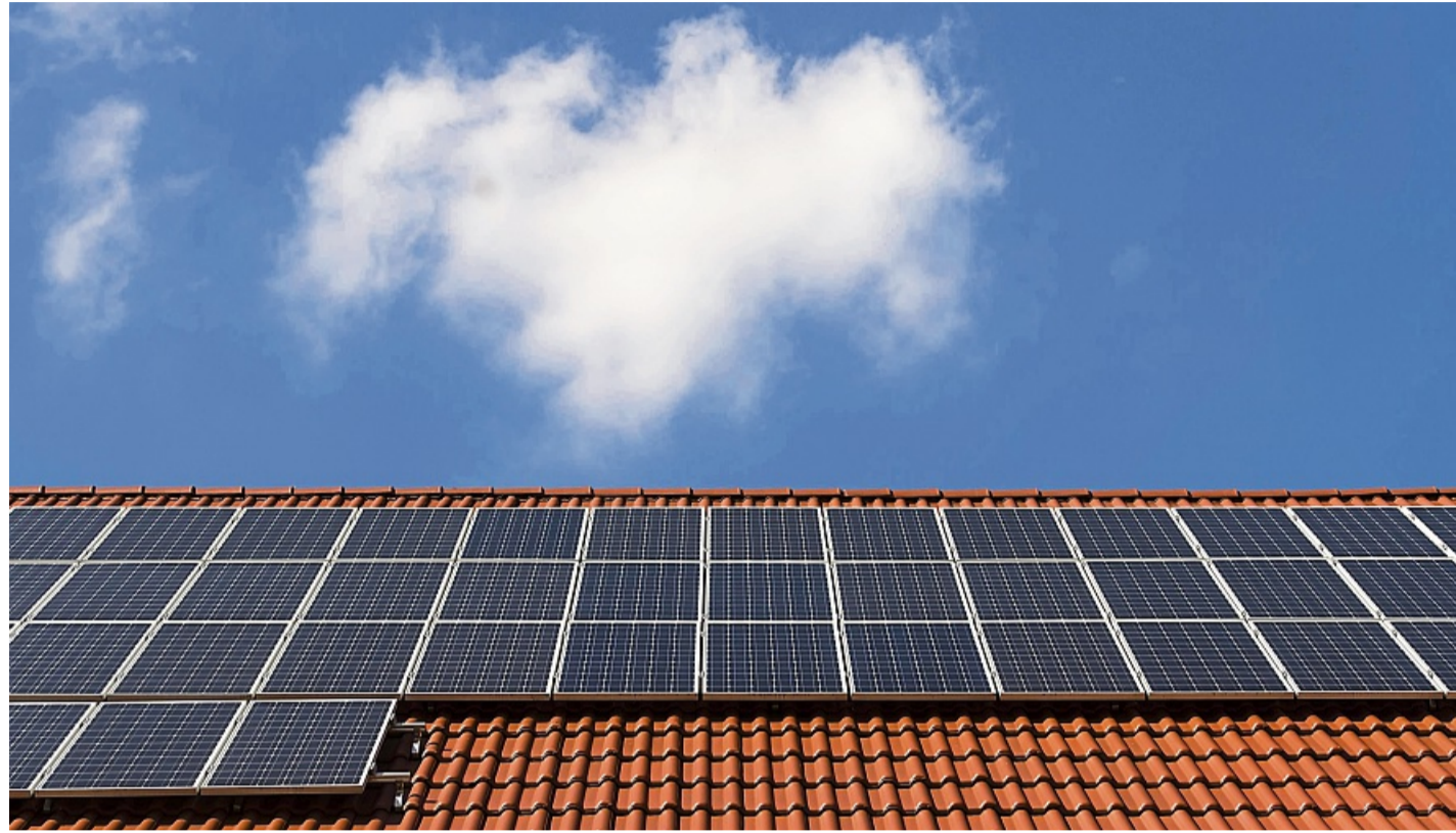
Neue Regelung: Ab Juni 2026 können Hauseigentümer überschüssigen Solarstrom unbürokratisch an Nachbarn im Quartier abgeben.

Bislang gilt in Deutschland: Wer in Spitzenzeiten mehr Strom produziert, als er ver-