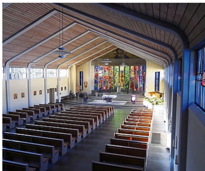
Blick ins Kirchenschiff, die Hallenkirche ist von farbigem Licht durchdrungen