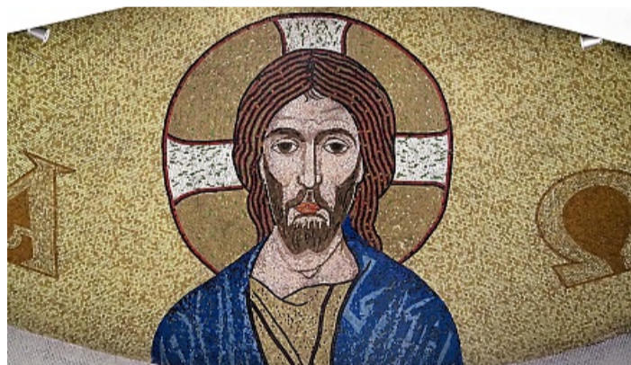
Das Mosaik mit der Christus-Ikone über dem Chor ist dem byzantinischen Stil aus Ravenna nachempfunden KRISTIN WEBER