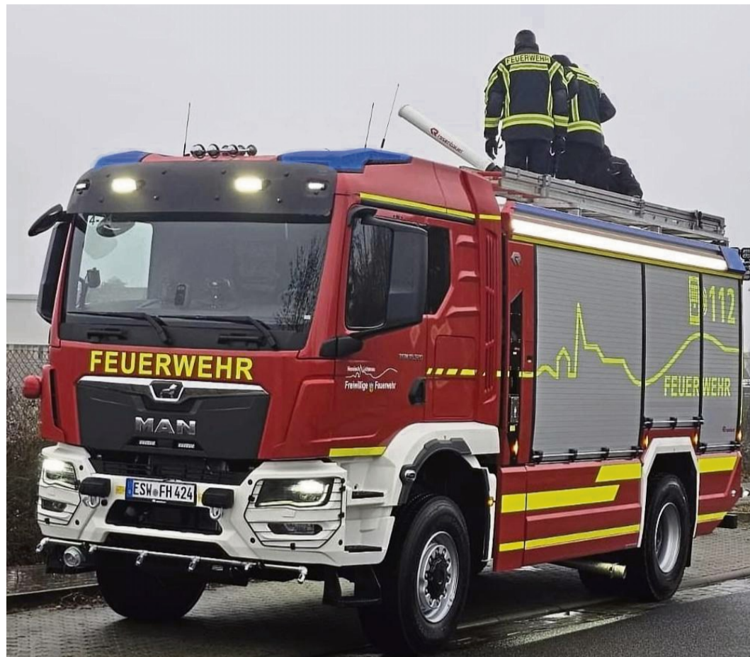
Die Ankunft des neuen TLF 4000: Das rund 500.000 Euro teure Tanklöschfahrzeug war kurz vor Weihnachten von einer Abordnung der Feuerwehr beim Hersteller Rosenbauer abgeholt worden. Die offizielle Übergabe muss noch erfolgen.

Die Familie lobte das Vorgehen der Feuerwehr ausdrücklich. Sie habe sich während des gesamten Einsatzes „jederzeit gut aufgehoben gefühlt“, sei fortlaufend über alle Schritte informiert worden und habe den Eindruck gehabt, „dass der Einsatz hochprofessionell abgearbeitet wurde“. Besonders beeindruckt zeigte sich die Familie zudem von der Zusam-