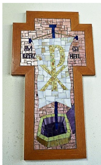
Die 15. Kreuzwegstation: Auferstehung KRISTIN WEBER