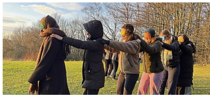
Für die Freizeiten in Reichenbach, am Königssee, dem Surf-camp oder dem Abenteuer-camp in Schweden werden noch Freiwillige gesucht.

Das Kennenlernseminar im Haus der Jugend in Reichenbach bietet interessierten Schülern, Studenten und jungen Erwachsenen aus der Region die Möglichkeit, die ganze Palette der Anforderungen an Betreuer kennenzulernen. Hier werden Spiele ausprobiert, im Rollenspiel Konflikte geschlichtet, die Anleitung von Bastelaktionen geübt, Freizeitprogramme fiktiv geplant oder die eigene Teamfähigkeit in abenteuerlichen Kooperationsspielen ge-