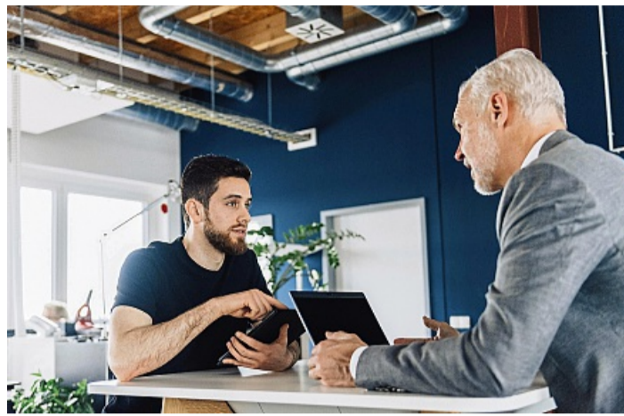
Angst vor Vorgesetzten zu haben ist eigentlich ganz normal – problematisch wird es, wenn uns die Angst im Job blockiert.