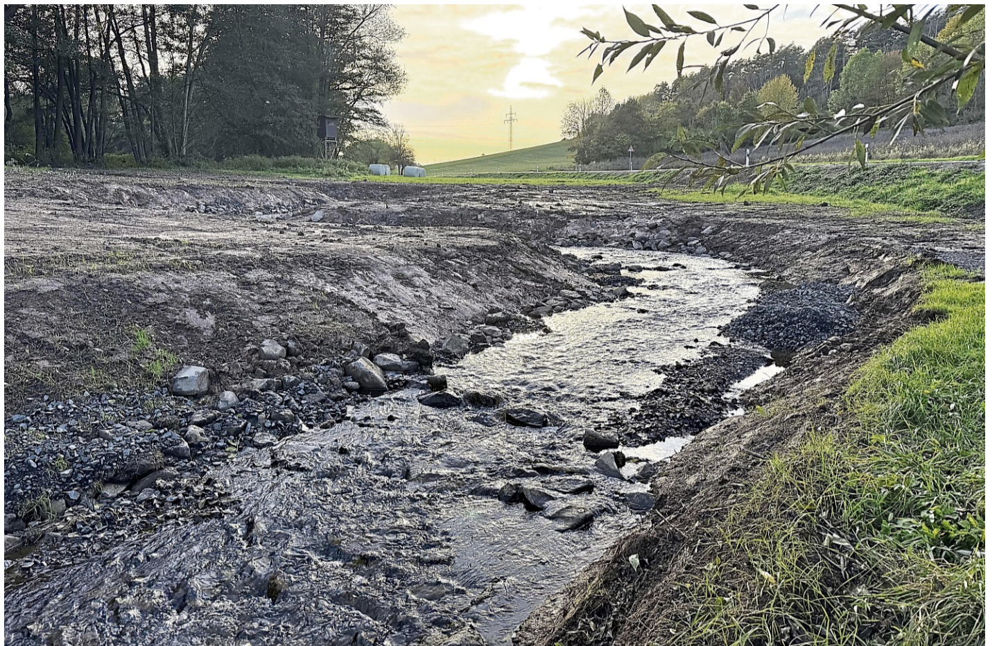
Das perfekte Labor: Wie man Kinder, die geheimnisse der Natur näher bringt, darum geht es unter anderen in der Fortbildung.

zum Beispiel einen Wasserfilter bauen, die Wasserqualität eines Baches „ohne Chemie“ bestimmen, mit einem Insektenstaubsauger auf die Suche nach Bodentieren gehen und vieles mehr. Theorie und Praxis werden in einem ausgewogenen Verhältnis vermittelt: Neben kurzen fachlichen Impulsen steht vor allem das eigene Erleben im Vordergrund. Die Teilnehmer haben die Möglichkeit, verschiedene Methoden selbst auszuprobieren und deren Wirkung direkt zu erfahren. Reflexionsphasen und der Austausch in der Gruppe unterstützen dabei, die gewonnenen Eindrücke auf die eigene berufliche Praxis zu übertragen und individuell passende Ansätze für unterschiedliche Zielgruppen und Rahmenbedingungen zu entwickeln. Anmeldung: erforderlich bis Mittwoch, 25. Februar, unter Angabe des Namens, der vollständigen Adresse, E-Mail und Telefonnummer – bevorzugt per E-Mail an bueno@altesforsthaus-germerode.de red/esp