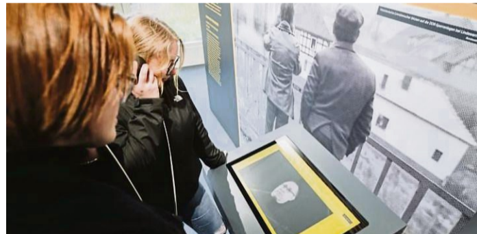
Junge Besucherinnen an einer der drei großformatigen Zeitzeugenstationen in der neugestalteten Dauerausstellung des Grenz-museums Schiffllersgrund.

öffentlicht, das sich insbesondere an junge Menschen richtet. Das Museum ruft Interessierte dazu auf, sich als Zeitzeugen an dem Projekt zu beteiligen.