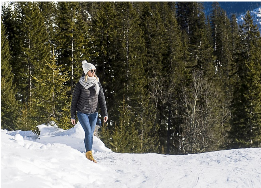
Unterwegs in den Bergen: Die zunehmende Höhe und der Schnee erhöhen das Sonnenbrandrisiko. Hier ist Sonnenschutz besonders wichtig.

Das Bundesamt für Strahlenschutz (BfS) schreibt online: „Im Winter ist die UV-Be-