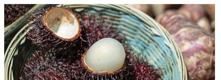
Rambutans bieten mehr Fruchtfleisch als Litschi: Das süß-saftige Innere umgibt einen kleineren Kern.