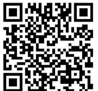
HeimatCheck der Werra-Rundschau WR QR-Code PRIVAT

Einfach nur den QR-Code scannen oder im Internet www.umfrageheld.de/survey/wr-check eingeben und schon ist man bei der Umfrage. Die Teilnahme am HeimatCheck ist anonym und vertraulich. Als Dankeschön für die Teilnahme verlosen wir jeweils 50 Euro bei Polstermöbel Henke in Eschwege.