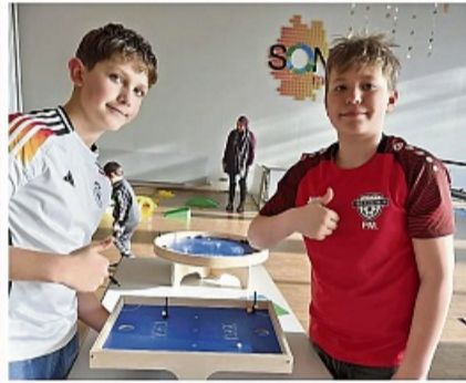
Wurde sehr gut angenommen: Impressionen vom Winterspielplatz im Sontraer Bürgerhaus.

Projekt, das sich immer stärker etabliert. Erstmals realisiert im Jahr 2024 und auch 2025 mit einer überwältigenden Beteiligung fortgeführt, war die diesjährige Veranstaltung ein weiterer Meilenstein. Insgesamt nahmen rund 70 Kinder mit ihren Familien an dem Event teil – darunter auch die Kindergartenkinder der evangelischen Kirche Sontra. Es war dabei keine Seltenheit, dass auch Besucher aus benach-