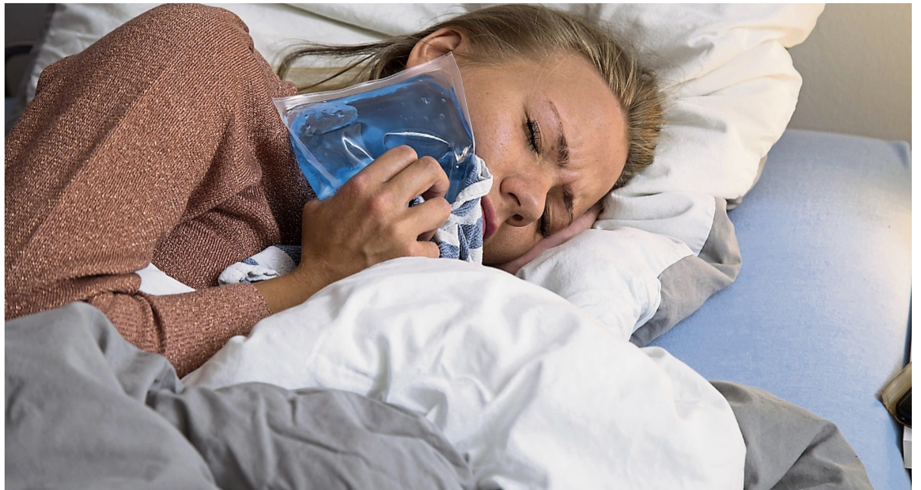
Wichtiger Helfer bei dicken Backen: ein Kühlpack. Um Erfrierungen zu vermeiden, legt man aber am besten regelmäßige Pausen ein.

„Sie treten vermehrt im Unterkiefer und nicht so sehr im Oberkiefer auf“, sagt Ullner. „Doch der behandelnde Arzt kann das durch operatives Geschick beeinflussen.“ Zudem