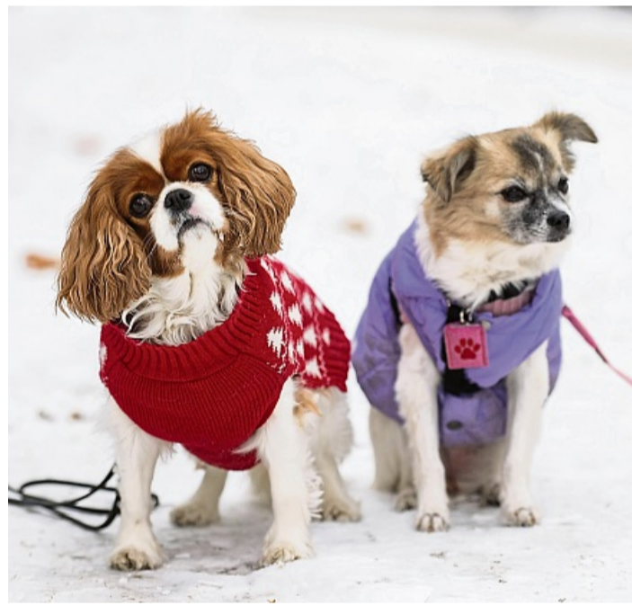
Mit dem Hund in den Winterurlaub? Nicht jeder Vierbeiner ist für den längeren Aufenthalt im Schnee gemacht.