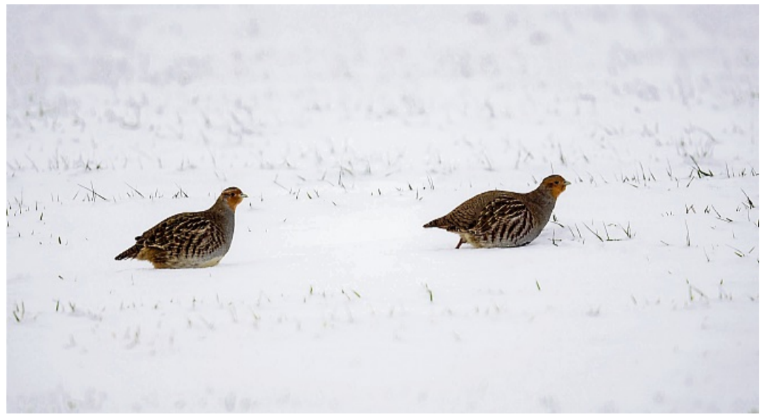
Ihre Tarnung entfällt im weißen Winter: Rebhühner sind mit ihrem braun-grau marmorierten Gefieder und dem orangebraunen Kopf im Schnee gut sichtbar.

„In dieser kritischen Zeit erweist sich eine gewisse Unordnung in der Feldflur als wahrer