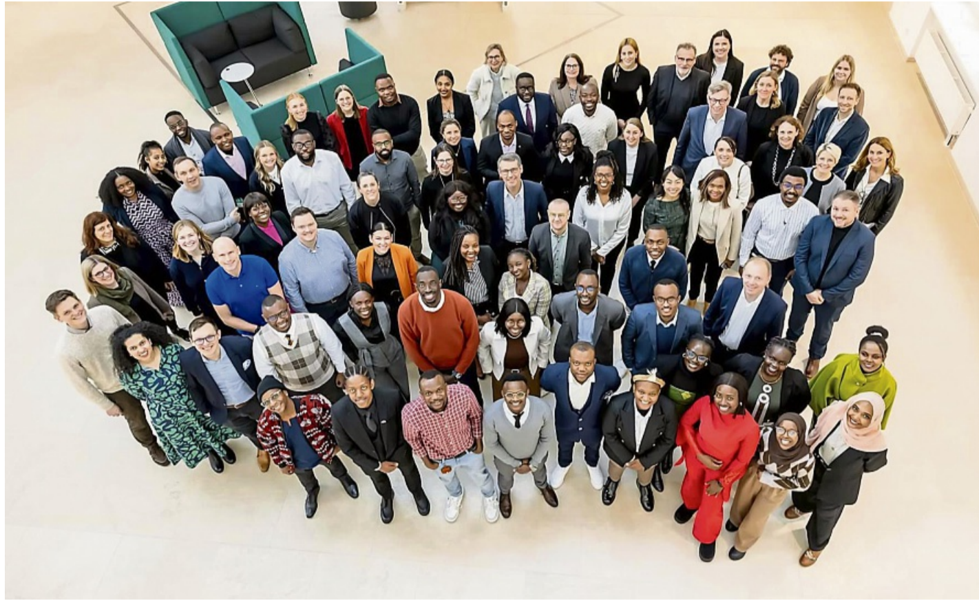
Nutzen die Gelegenheit zum Austausch und zum Kennenlernen: Die Stipendiaten und die Vertreter der Unternehmen. Im Februar beginnen sie ihre Praxiseinsätze.

„Afrika kommt!“ – und der frische Wind, den die Fellows mitbringen, öffnet uns immer wieder die Augen für neue Perspektiven, Kulturen und Hintergründe. Wir lernen sehr viel voneinander. Dieser Austausch