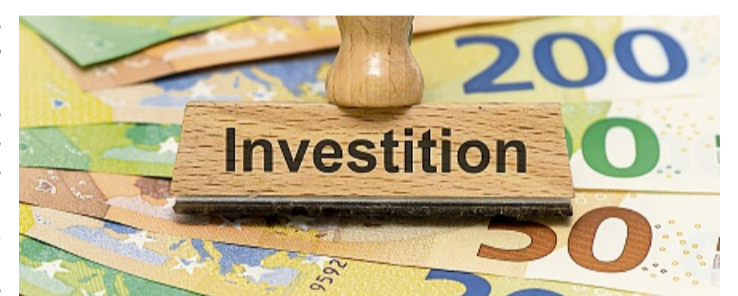
Zukunftsfähige Stärkung: Eine externe Zwischenevaluation bescheinigt der Leader-Region Mittleres Fuldata eine wirkungsorientierte Entwicklung.