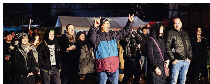
Zum Feiern aufgelegt: Auch in den vergangenen Jahren herrschte beim Publikum auf dem Dorfplatz in Wichte beste Stimmung.

Line-Up für den Sommer bekannt gegeben. Tickets für das Silobrandfestival können aber auch jetzt bereits online zum vergünstigten Preis gekauft werden unter silobrand.de/tickets . red