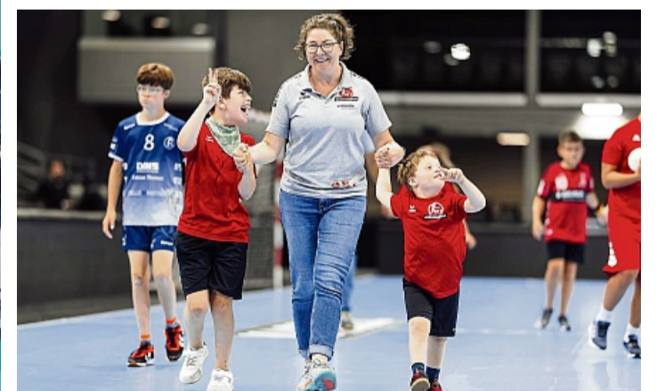
Helfer gesucht: Seit fast drei Jahren gehören die Glückskinder fest zur MT-Familie.