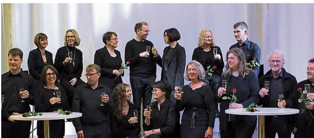
Barockmusik zum Jahresauftakt: Rainer-Schmidt-Chor eröffnet mit Konzert in Melsungen das Jahr.

Leader ist ein EU-Programm zur Stärkung ländlicher Regionen. Lokale Aktionsgruppen entscheiden selbst, welche Projekte vor Ort – von Kultur bis Wirtschaft – gefördert werden. Das Geld stammt zum Großteil aus dem EU-Fonds Eler (Europäischen Landwirtschaftsfonds für die Entwicklung des ländlichen Raums), ergänzt durch Mittel von Bund und Ländern sowie einen privaten Eigenanteil. So sollen Steuergelder direkt zurück in die Gestaltung der Heimat fließen. win