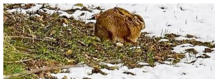
Farbkontrast bedeutet Lebensgefahr: Wildhasen haben – aufgrund ihres braunen Fells – Probleme, sich im Schnee zu tarnen.