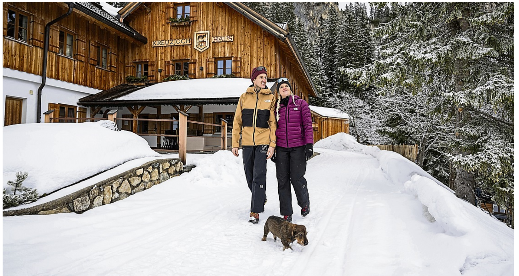
Nur mit der passenden Unterkunft wird der Winterurlaub für Zwei- und Vierbeiner wirklich entspannt.

Ski-Gebiete, die nur per Seilbahn oder Pistenraupe zu erreichen sind, bieten sie sich für einen Urlaub mit Hund eher weniger an. „Wenn, dann dürfte der Hund nicht zu ängstlich sein und man müsste so etwas