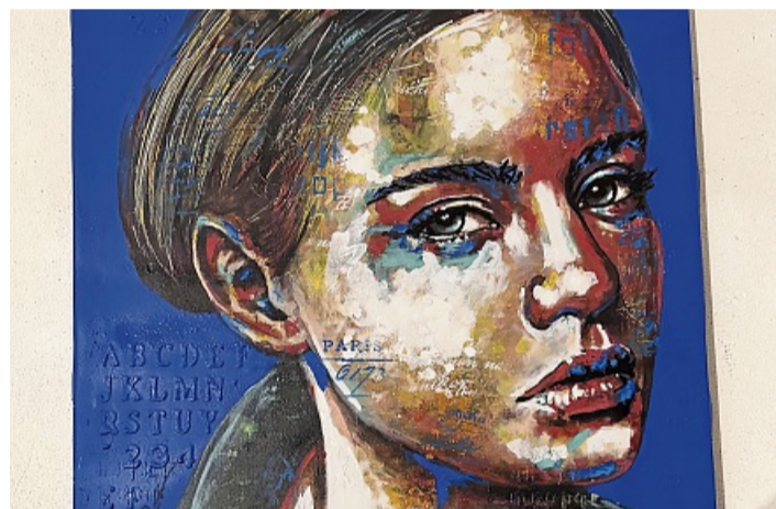
Ein zentrales Motiv in Adil Roufis Arbeiten: Der Blick bleibt offen, das Gesicht in Bewegung.