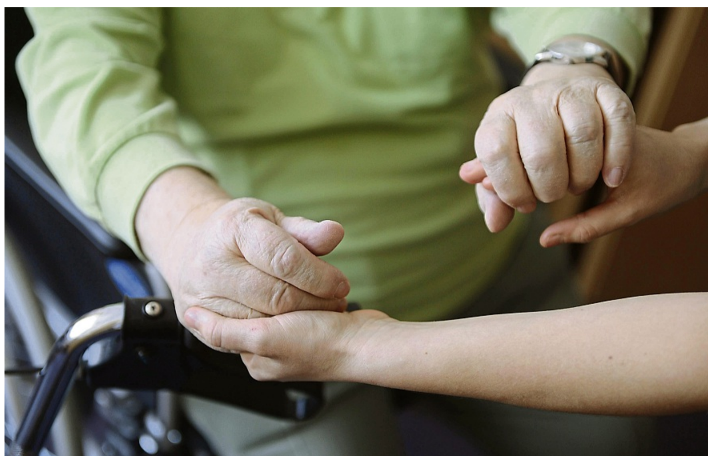
Eine junge Frau hält die Hände eines alten Mannes. (zu dpa: «Landtagsfraktionen fordern mehr Hilfe bei häuslicher Pflege»)

Im Beratungsalltag zeige sich nun zunehmend, dass die monatlichen Eigenanteile für einen Heimaufenthalt für viele Pflegebedürftige und ihre Angehörigen eine „erhebliche finanzielle Belastung“ darstellen – und das, obwohl der Landkreis zu den 40 günstigsten