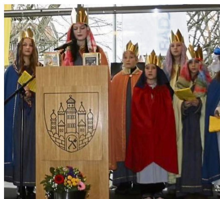
Sammelten Spenden für Kinder in Bangladesch: die Sternsinger der St.-Bonifatius-Gemeinde.