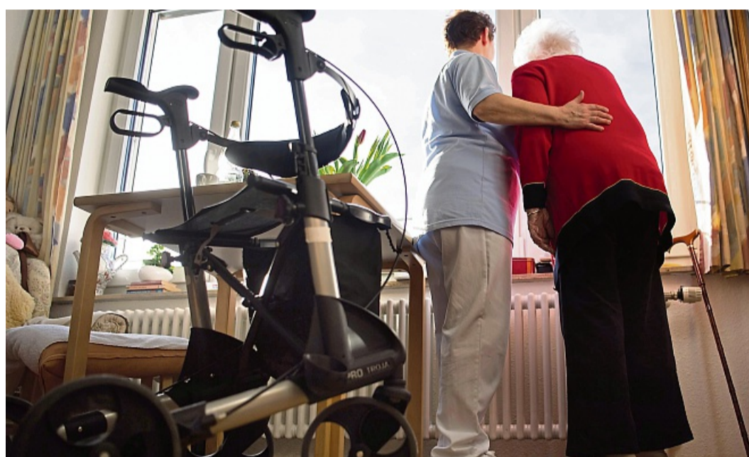
Viele Menschen können sich den Heimaufenthalt nicht mehr leisten.

Eine besonders intensive Beratung erfolge in Situationen, in denen Kurzzeitpflege oder Verhinderungspflege in An-