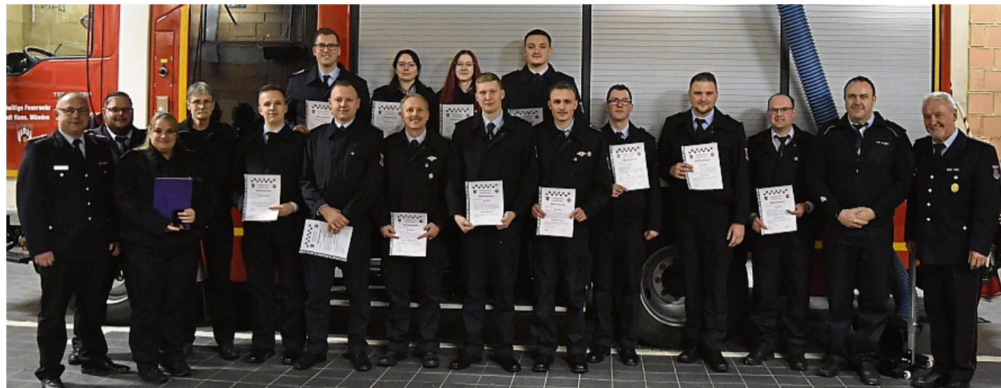
15 aktive Mitglieder der Feuerwehr Hann. Münden sind bei der vergangenen Versammlung befördert oder geehrt worden.

Vor allem in Erinnerung geblieben sei ihm ein Einsatz in Rosdorf. Am 3. April brannte dort ein Dachstuhl, die Feuer-