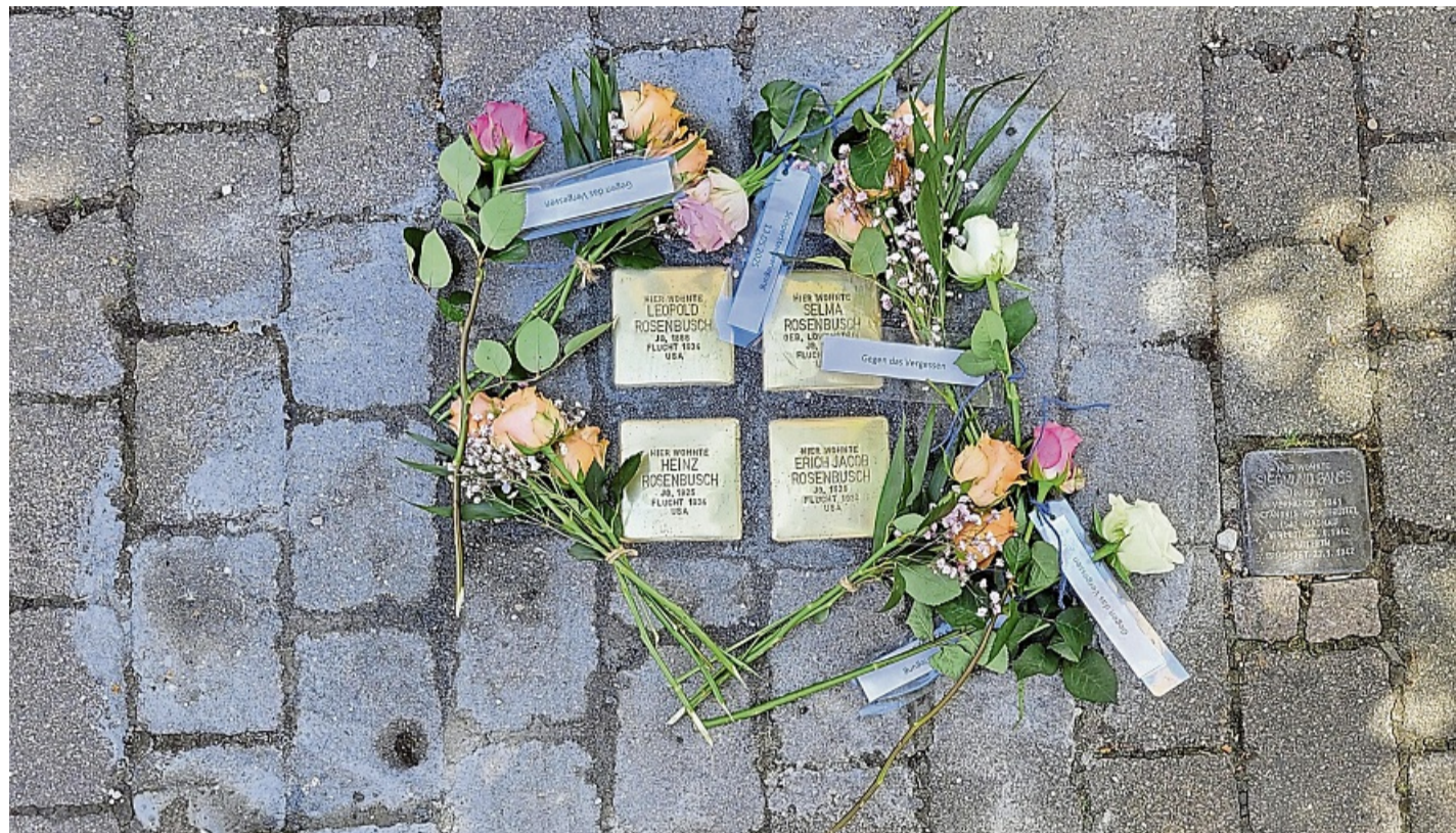
Stolpersteine für Familie Rosenbusch in der Lindenstraße 14 in Bad Wildungen.

Die Stolpersteine und die Verlegung sollen durch Spenden finanziert werden, der Geschichtsverein würde dies koordinieren. Hier können sich einzelne Personen, Vereine oder Kirchengemeinden engagieren.