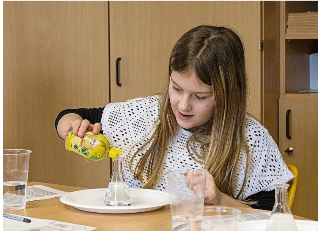
Mit Brausetabletten und Zitronensäure lassen die Viertklässler einen kleinen Vulkan „ausbrechen“.

Bad Wildungen – Es sprudelt, brodelt und zischt in den Gläsern. Ballons blähen sich langsam auf, bunte Farben wandern durch Filterpapier, und aus kleinen Gefäßen bricht plötzlich ein Mini-Vulkan aus. In einem Klassenraum der Breiter-Hagen-Schule am Standort Altwildungen wird gestaunt, gelacht und genau hingeschaut.