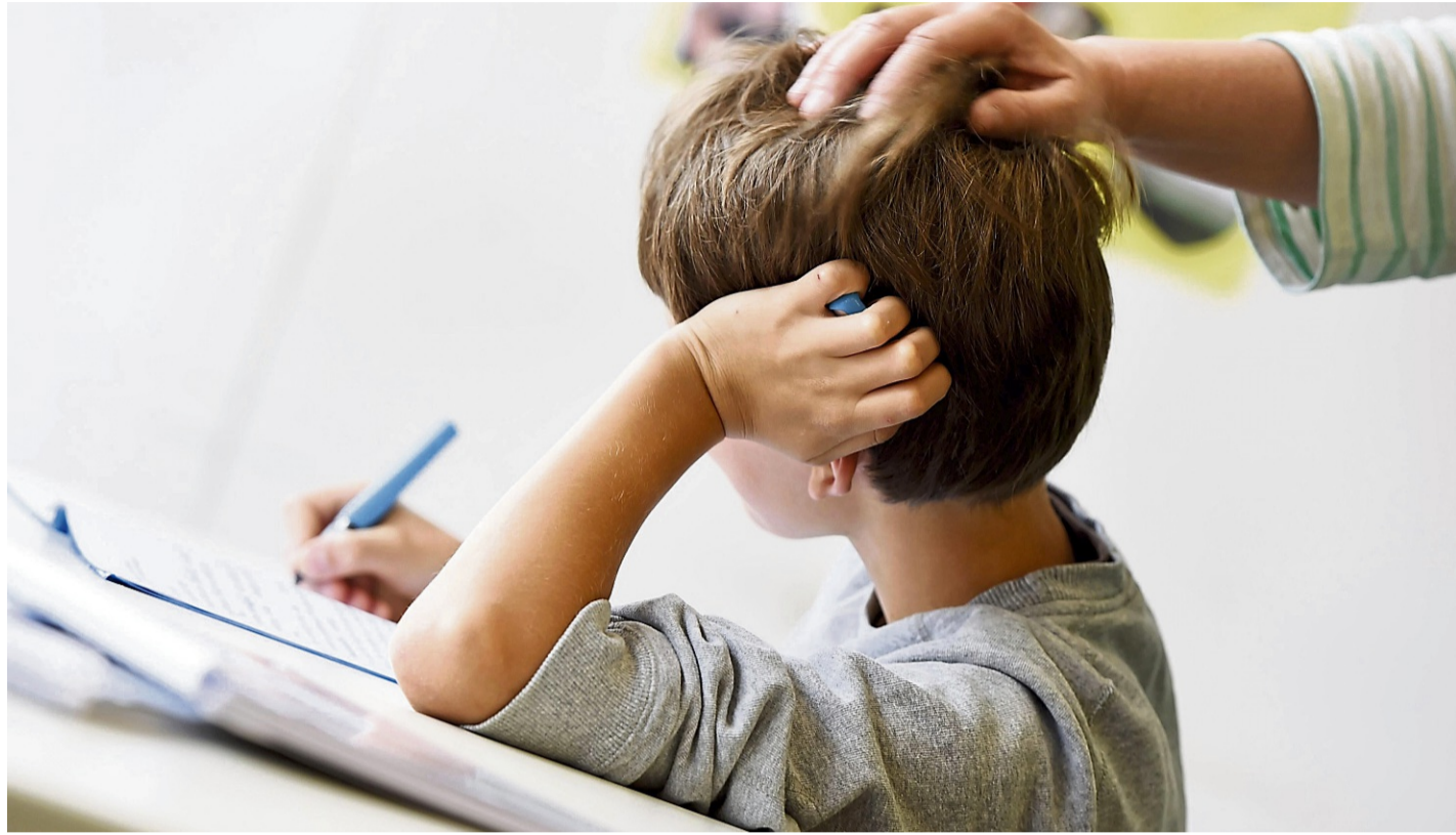
Die Wertschätzung kleiner Erfolge und Interesse am Schulalltag stärken das Selbstbewusstsein und die Lernmotivation.

Nicht zu vergessen sind die Erinnerungen, die Eltern in dem Moment mit ihren eigenen Zeugnissen haben. Wie haben sie sich damals gefühlt? Wie haben die eigenen Eltern reagiert: Waren sie stolz? Oder enttäuscht? Kommt da vielleicht sogar Angst, Wut oder Trauer wieder hoch? Mit dem Schulfang ist es für Eltern gefühlte