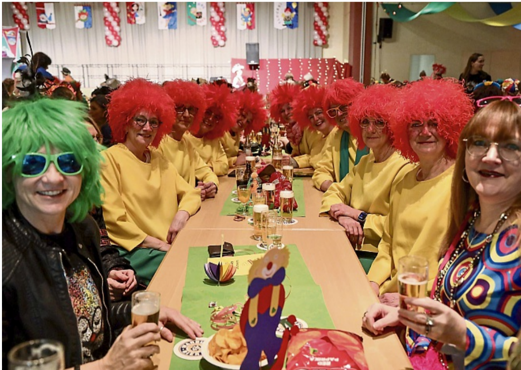
Kunterbuntes Publikum: Fast alle Gäste kamen verkleidet, so auch dieser Tisch voller Pumuckels.