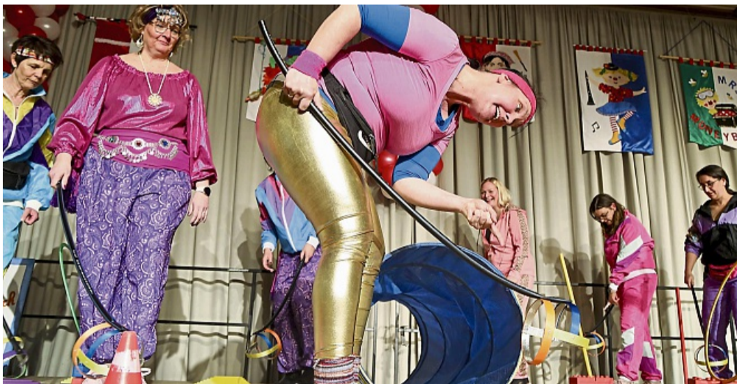
Sitz Bello: Die Vorstandsdamen der Volkmarser Landfrauen gingen mit ihren imaginären Hunden zum Hobby-Dogging.