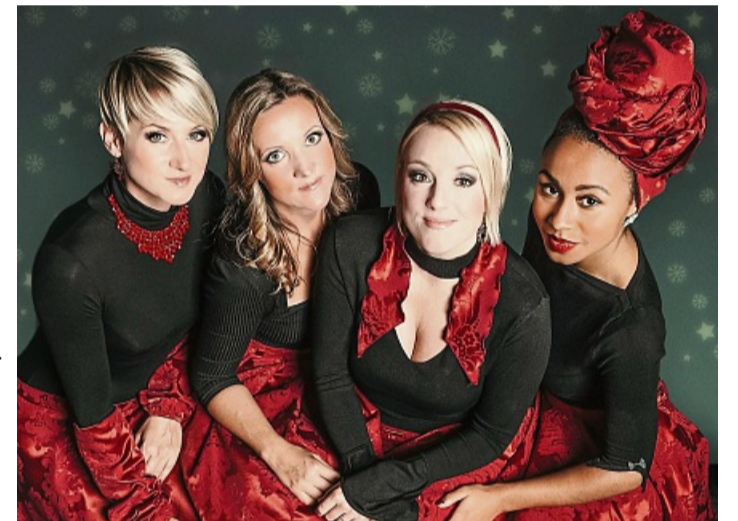
Die A-cappella-Frauenband „Die Medlz“ tritt am 27. Februar in Korbach auf.

Tickets für das Konzert kosten zwischen 28 und 32 Euro und sind im Vorverkauf bei der Korbach-Information, Prof.-Bier-Straße 15, Korbach, oder online auf der Webseite korbach.reservix.de erhältlich. red