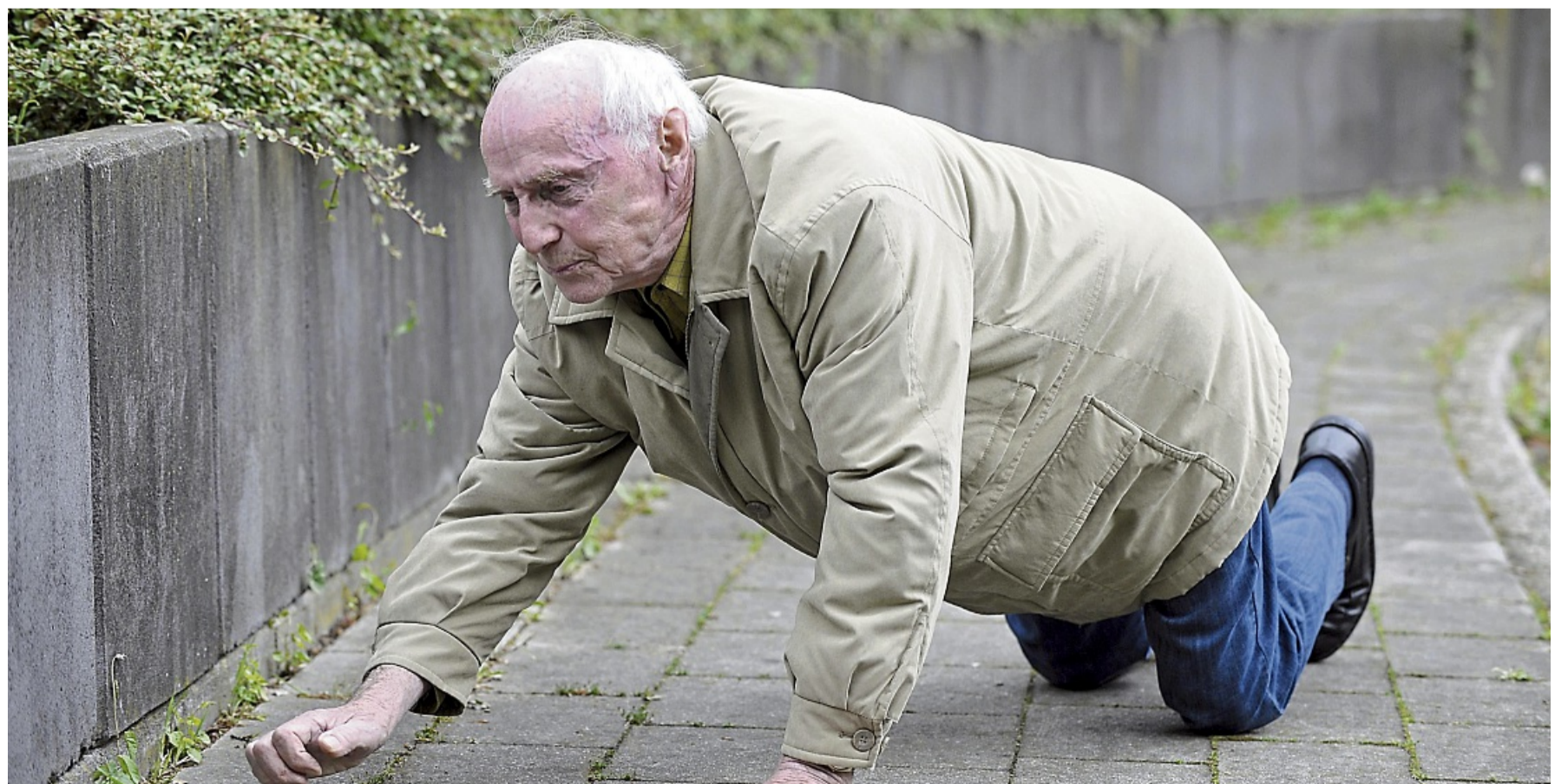
Stürze und andere Unfälle im Alter können schwere Folgen nach sich ziehen. Ihre Behandlung mit dem Ziel, Selbstständigkeit und Erhalt der Lebensqualität bestmöglich zu erhalten, ist Aufgabe des neuen Alters-Traumazentrums in der Wildunger Stadtklinik. TOMXTHOENE

■ CINE K KINO Korbach Die drei ??? - Toteninsel: Sa u. So 13, 15.15 u. 17.30 h, Mo bis Mi 15 u. 17.15 h Extrawurst: Sa u. So 15, 17.15 u. 19.45 h, Mo u. Di 15, 17.15 u. 19.30 h, Mi 15, 17.15 u. 20 h Zoomania 2: Mo bis Mi 15 h Avatar - Fire and Ash (3D): Sa u. So 14.45 u. 18.30 h, Mo u. Di 19.15 h, Mi 19 h Checker Tobi 3 - Die heimliche Herrscherin der Erde: Sa u. So 13 u. 15 h, Mo u. Di 15 h Mercy: Sa 19.30 u. 22.30 h, So u. Di 19.30 h, Mo u. Mi 17.15 h The Housemaid - Wenn sie wüsste: Sa u. So 17 u. 19.45 h, Sa auch 21.30 h, Mo u. Mi 19.30 h, Di 17.15 u. 19.30 h 28 Years later - The Bone Temple: Sa 22 h, Mo 19.30 h Greenland 2: Sa 22.15 h, Mo bis Mi 17 h Woodwalkers 2: Sa u. So 13, 15.15 u. 17.30 h, Mo u. Di 15 u. 17.15 h, Mi 15 u. 17.45 h Primate: Sa 19.30 u. 21.45 h, So 19.30 h, Mo bis Mi 19.45 h Bibi Blocksberg - Das große Hezentreffen: Sa u. So 13 h SpongeBob Schwammkopf - Piraten Ahoi: Sa u. So 13 h