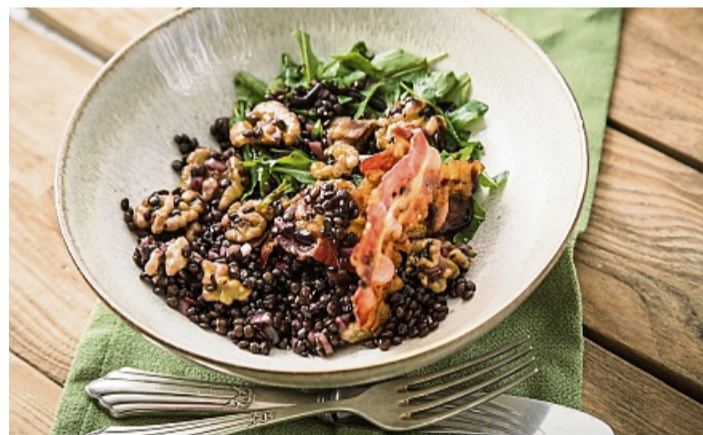
Schwarze Beluga-Linsen eignen sich perfekt für einen Salat mit Walnüssen, Speck, Petersilie, roten Zwiebeln und Rucola.