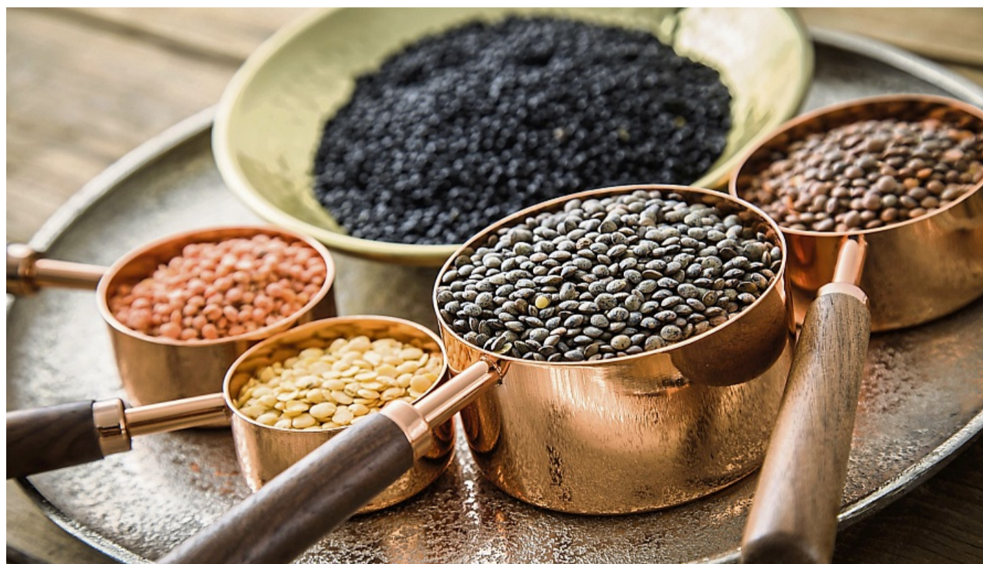
Von Rot über Gelb und Braun bis Schwarz – die Auswahl an unterschiedlichen Linsensorten ist groß.

und hat ein nussiges, erdiges Aroma“, schwärmt Häußler. Ein Erlebnis, das man im Mund fühlen könne.