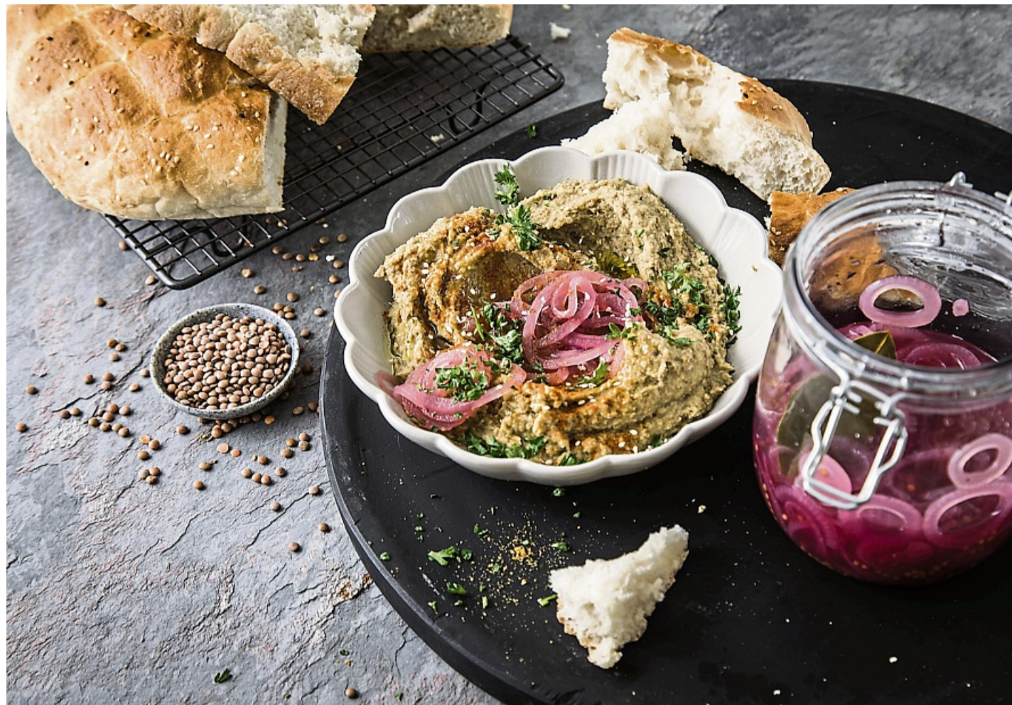
Wie wär's mit Linsen-Hummus? Er wird aus braunen Berglinsen, eingelegten roten Zwiebeln, Sesam, Petersilie und Paprikapulver gemacht. Perfekt zum Fladenbrot.

Die Ernte ist aufwendig: Die Linsen wachsen nicht allein, sie brauchen eine Stützfrucht wie Leindotter oder Gerste, an der sie sich festhalten können. Nach der Ernte muss das Gemisch getrennt, gereinigt und getrocknet werden. Doch der Aufwand lohnt sich für den Geschmack: „Die Alblinse ist eher bissfest, sie kocht nicht zu Brei