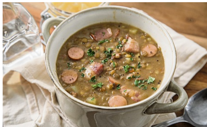
Auch die klassische Frankfurter Linsensuppe mit Frankfurter Würstchen kann modern interpretiert werden – mit Speck und Essig und etwas Apfelkompott.