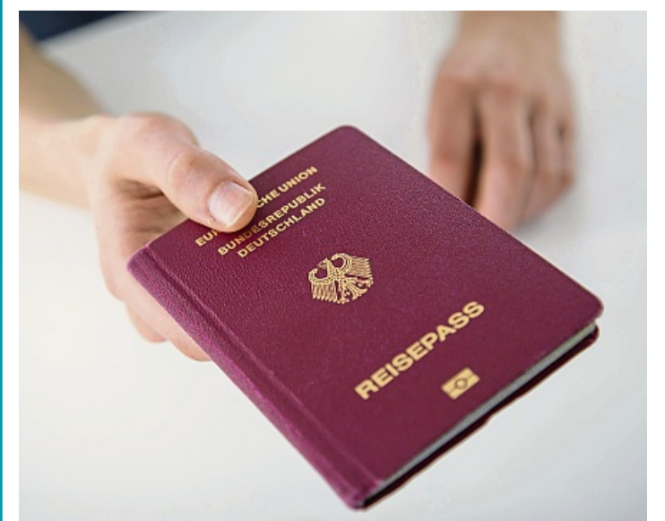
Wer am Pass bastelt, riskiert Ärger. Selbst fehlende Seiten machen das Dokument unbrauchbar – mit Konsequenzen am Flughafen.

Fehlen in einem Reisepass Seiten, gilt dieser als beschädigt und wird dadurch ungültig. Deswegen kann auch die Ausreise aus Deutschland verweigert werden, wie der Fall eines jungen Mannes zeigt, der kürzlich vom Flughafen Karlsruhe/Baden-Baden aus nach London fliegen wollte, aber nicht ausreisen durfte, wie die Bundespolizei mitteilt. Im Reisepass des 22-Jährigen fehlten die letzten beiden Seiten, fiel einem Beamten bei der Passkontrolle auf. Der 22-Jährige gab daraufhin an, die fehlenden Seiten für Notizen genutzt und anschließend aus dem Pass entfernt zu haben. Die Bundespolizei stellte den Reisepass sicher und der 22-Jährige wurde wegen Sachbeschädigung angezeigt. dpa