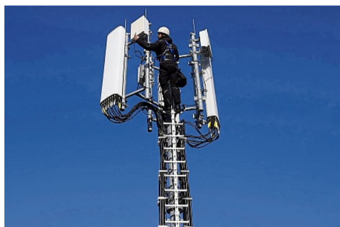
Ein Techniker installiert neue Antennen an einem Mobilfunkstandort.

das sich die Mobilfunkanbieter zeitversetzt nach Fertigstellung des Funkmastes mit ihren Diensten aufschalten.