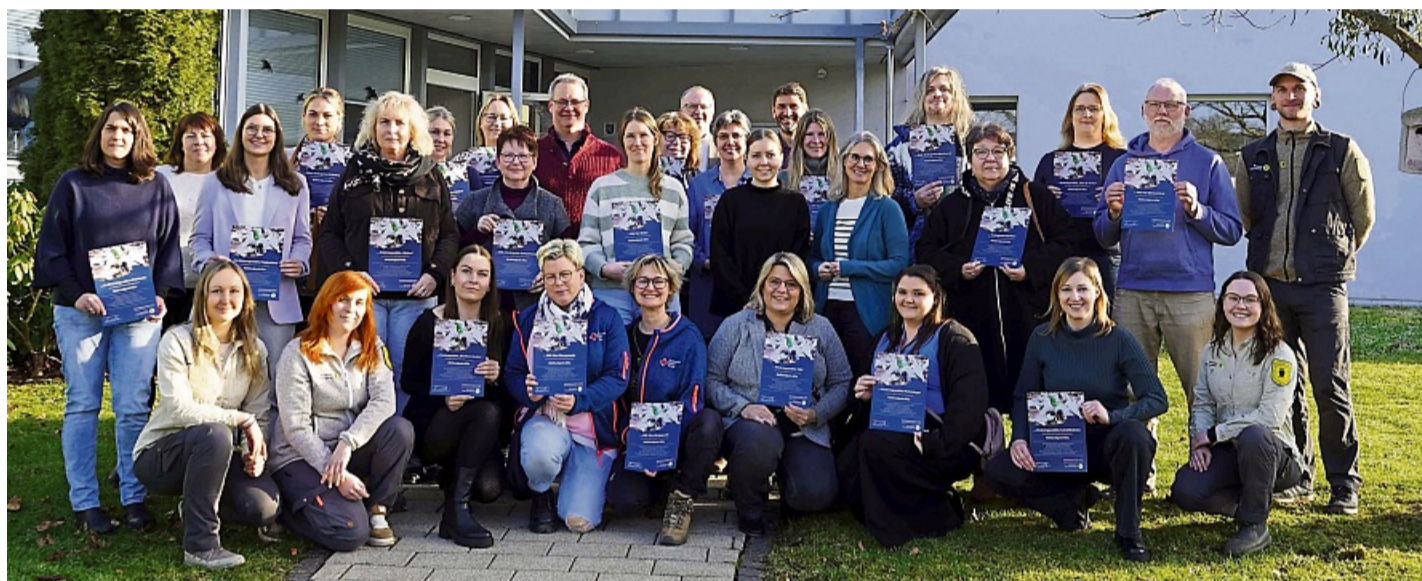
21 Nationalpark-Kitas: Am vergangenen Freitag wurden 21 regionale Kindertagesstätten als Nationalpark-Kitas rezertifiziert.