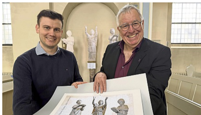
Wie beim Puzzle: Auch kleine Beträge helfen beim großen Sanierungsprojekt.