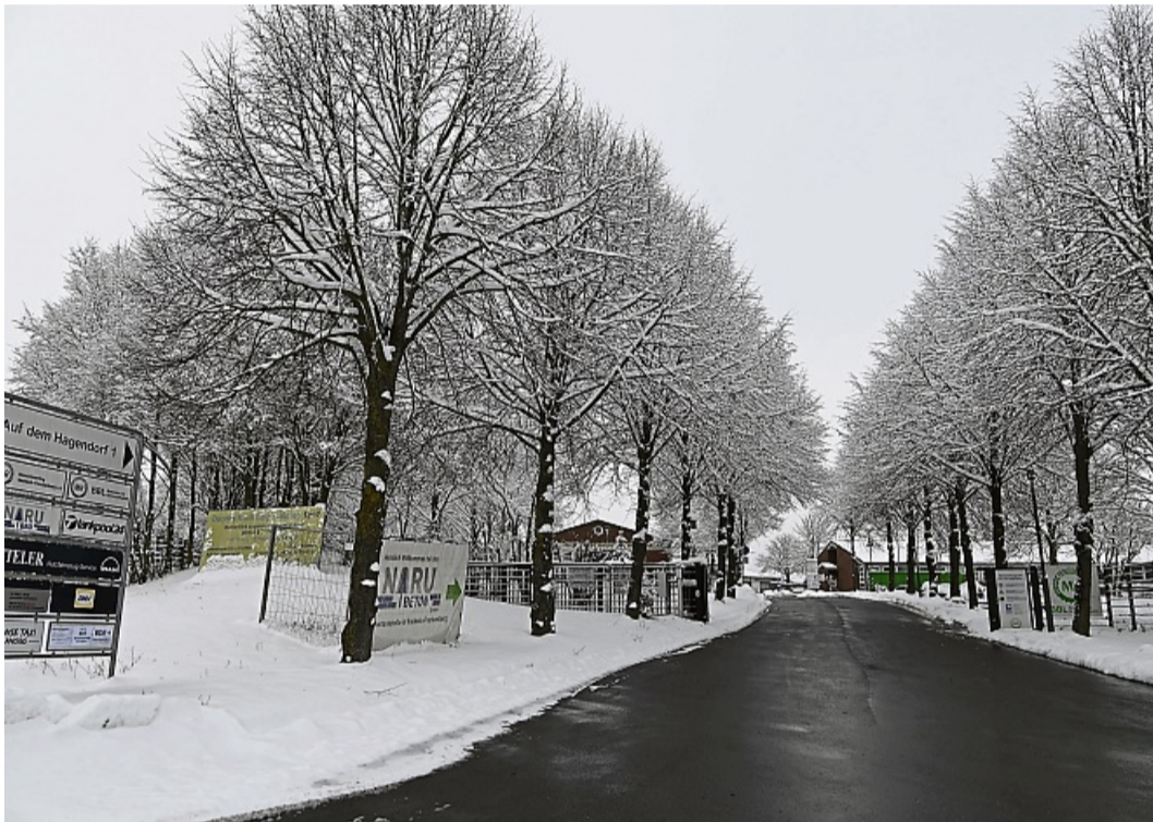
Vergrößerung gewünscht: Das Gewerbegebiet Dorffitter soll erweitert werden.

Änderung der beiden Flächenpläne ausgesprochen. md