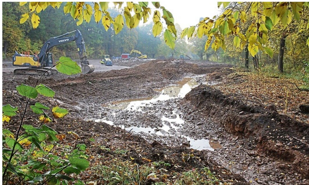
Für die Renaturierung der Thiele-Aue wurde zwischen Birkenweg und Knusterweg ein neues Bett ausgehoben. Das hat Auswirkungen auf den Füllstand der angrenzenden Teichanlage.

Selbstverständlich habe man sich im Fachbereich Bauen Gedanken über die Kosten des Weges gemacht. Dabei sei heraus-