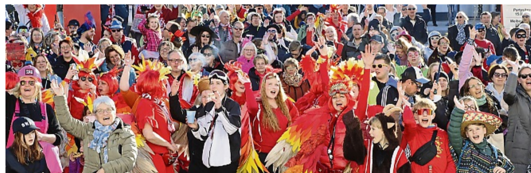
Der krönende Abschluss folgt am Montag, 16. Februar, wenn um 14.11 Uhr am Kolpinghaus der farbenfrohe Rosenmontagszug startet.