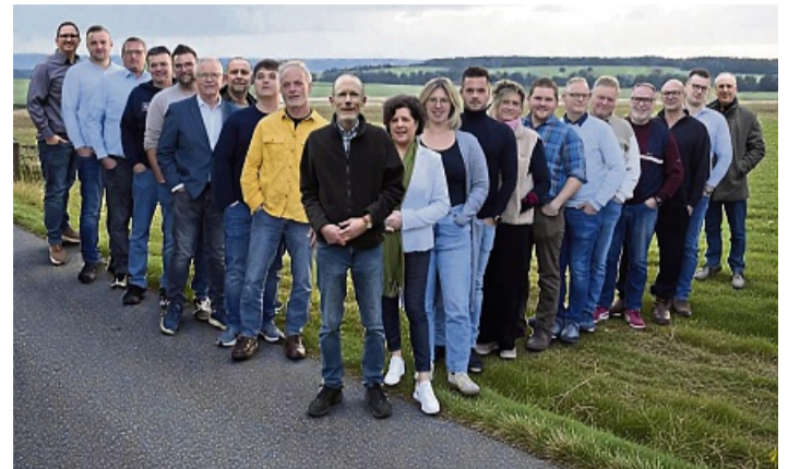
Hoch motiviert: Die 21 Kandidaten des Bürgerbündnisses Wehretal.

KOMMUNALWAHL Bürgerbündnis Wehretal ist gut aufgestellt