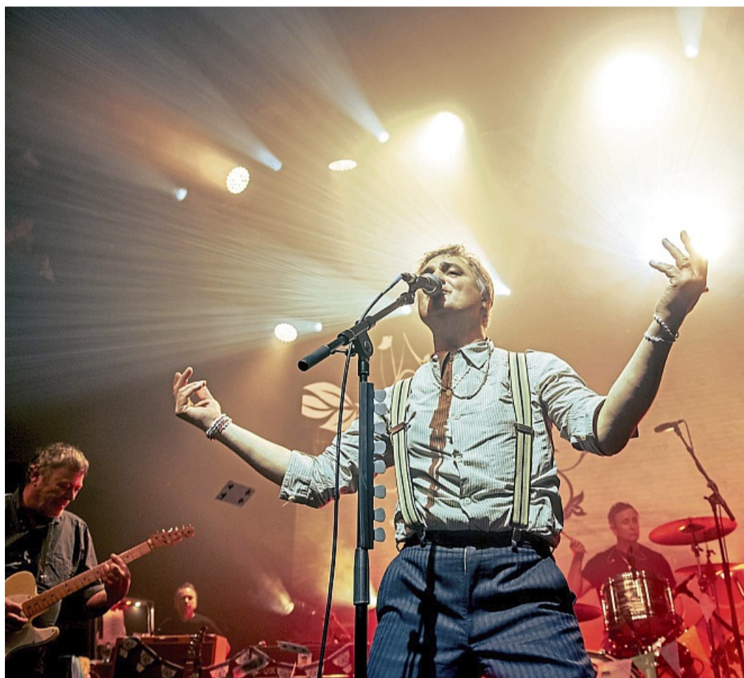
Mit Frontmann Pete Doherty treten die Babyshambles dieses Jahr beim Open Flair auf.

Frank Turner zählt seit Jahren zu den prägendsten Stimmen zwischen Punk, Folk und Singer-Songwriter-Kunst. Mit seiner unermüdlichen Live-Energie und Hits aus inzwischen neun Soloalben bringt er jede Bühne zum Beben. Nach einem feuchtfröhlichen Auftritt beim