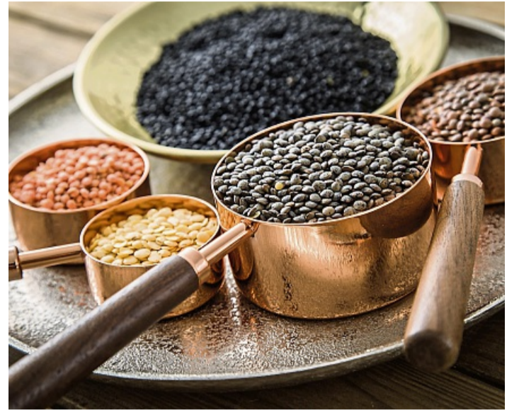
Von Rot über Gelb und Braun bis Schwarz – die Auswahl an unterschiedlichen Linsensorten ist groß.

Linsen werden im Rahmen einer nachhaltigen Fruchtfolge zusammen mit anderen Getreidesorten angebaut, das heißt: weniger Unkraut und weniger Krankheiten. Außerdem kommen Linsen als Direktsaat in den Boden, was bedeutet, dass dieser zwischen den Ernten nicht gepflügt wird: Das schützt vor Erosion und hilft der Artenvielfalt.