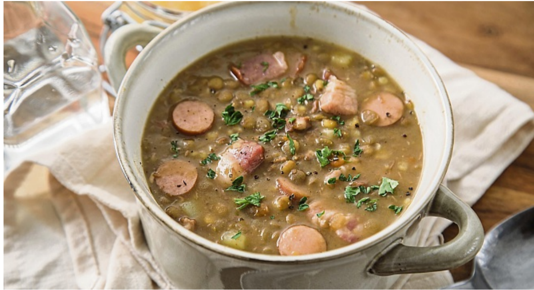
Auch die klassische Frankfurter Linsensuppe mit Frankfurter Würstchen kann modern interpretiert werden – mit Speck und Essig und etwas Apfelkompott.

Deutschland importiert jährlich rund 40.000 Tonnen Linsen. Etwa 25 Prozent kommen aus Kanada. Vor allem aus der Provinz Saskatchewan, die im Herzen des Landes liegt und bekannt ist für seine weiten Prärien. Dieser Platz ist nötig, denn