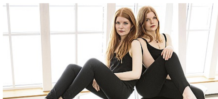
Die Ballettmusiken „Estancia“ sind von Clara und Marie Becker zu hören.