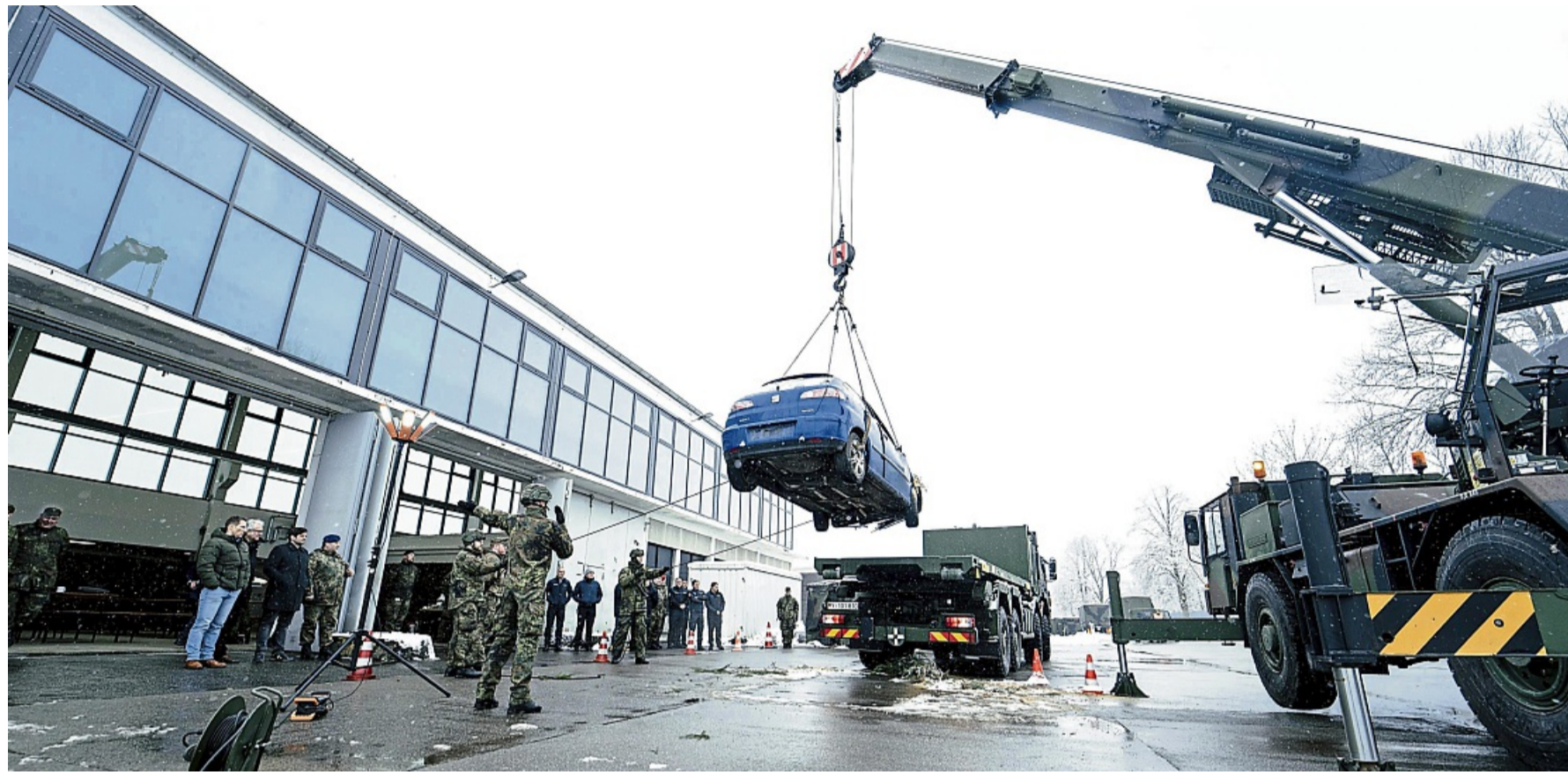
Feldkran im Einsatz: Beim Blaulichttag des Bataillons Elektronische Kampfführung wurde auch der Abtransport von Fahrzeugen demonstriert.

Nach einer Vortragsreihe und einem Mittagessen mit Erbsensuppe aus der Feldküche verfolgten die Teilnehmer den