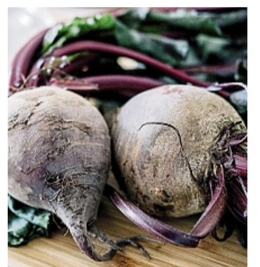
Vom Kellerkind zum Küchentrend: Rote Bete ist kein stiller Begleiter mehr. Beim Einkauf gilt: Kleine Knollen sind milder im Geschmack, große erdiger.