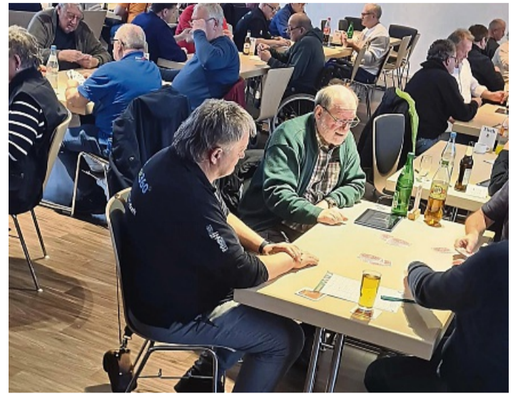
An zwei Tagen wurde intensiv Skat gespielt: Insgesamt acht Serien standen am Samstag und Sonntag auf dem Programm.

Waldecker Buben haben Einzelmeisterschaften ausgerichtet