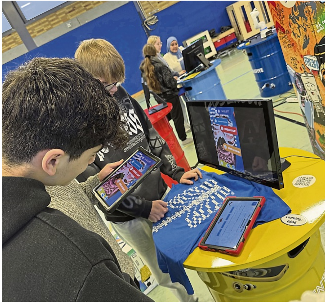
Wie an Messeständen war das Berufsorientierungsangebot der Kaulbach-Schule in der Sporthalle aufgebaut.

Für die Schülerinnen und Schüler der Kaulbach-Schule bedeutete dieser Projekttag eine wertvolle Ergänzung zur klassischen Berufsorientierung: Sie konnten sich selbst ausprobieren, Fragen stellen und erste Anknüpfungspunkte für ihre berufliche Zukunft in digitalen Umfeld finden - ein Gewinn vor allem für diejenigen, die in den nächsten Monaten ihren Schulabschluss machen