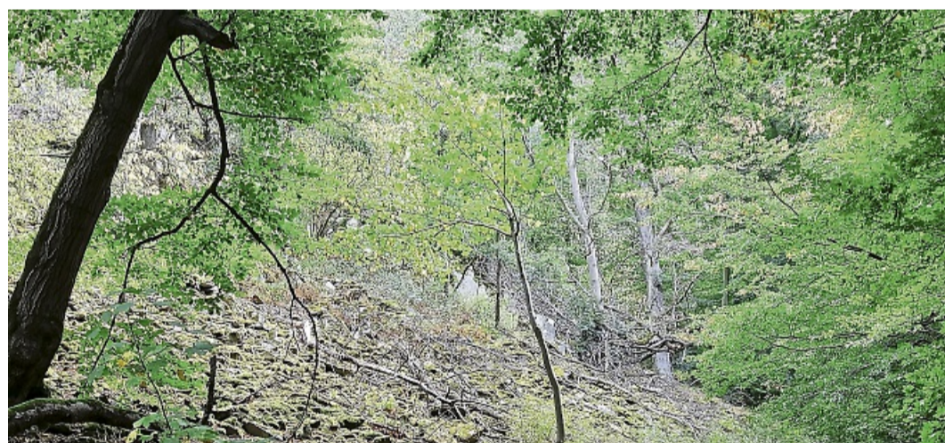
Nachfolger gesucht: Die Blockschutthalde am Edersee waren 2025 Geotop des Jahres.

2026 möchte der Nationale Geopark Grenz-Welten, der in diesem Jahr sein 20-jähriges Bestehen feiert, wieder ein solches Geotop hervorheben. Es wird die Reihe besonderer erdgeschichtlicher Formationen ergänzen, die seit 2017 von einer fachkundigen Jury als „Geotop des Jahres“ ausgezeichnet wurden (siehe weiteren Text). Der Geopark ruft daher dazu