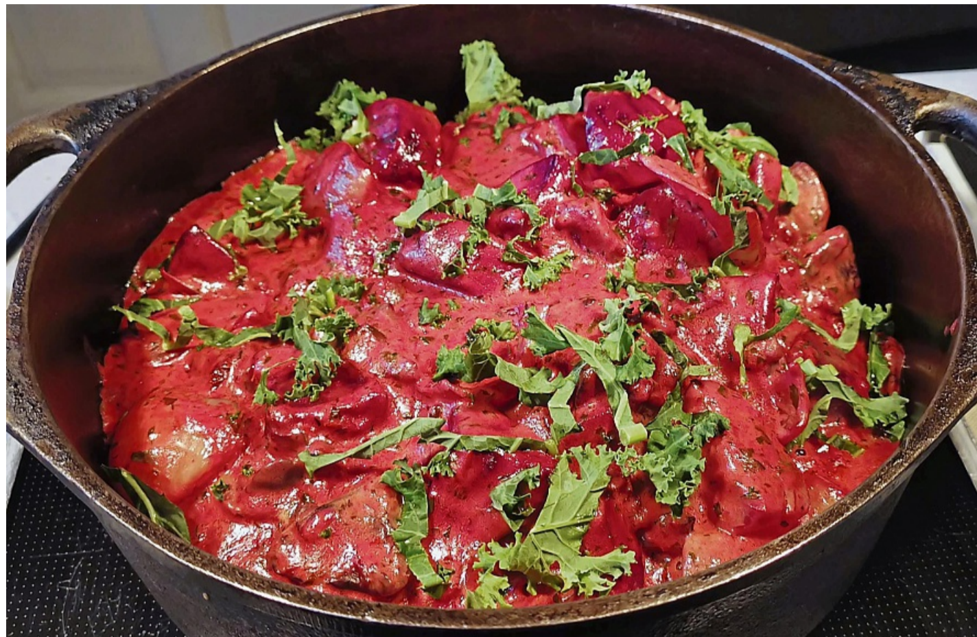
Skandi-Style: Bevor die Rote Bete mit anderem Wurzelgemüse zum Eintopf wird, entwickelt sie im Ofen reichlich Röstaromen.