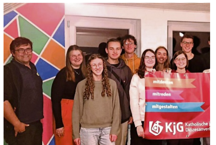
Laden ein zum Sommerncamp: die neu gegründete Gruppe katholischer Jugendlicher im Dekanat Waldeck.

Neu gegründete katholische Jugendgruppe lädt ein: Gästehaus nahe der Nordsee