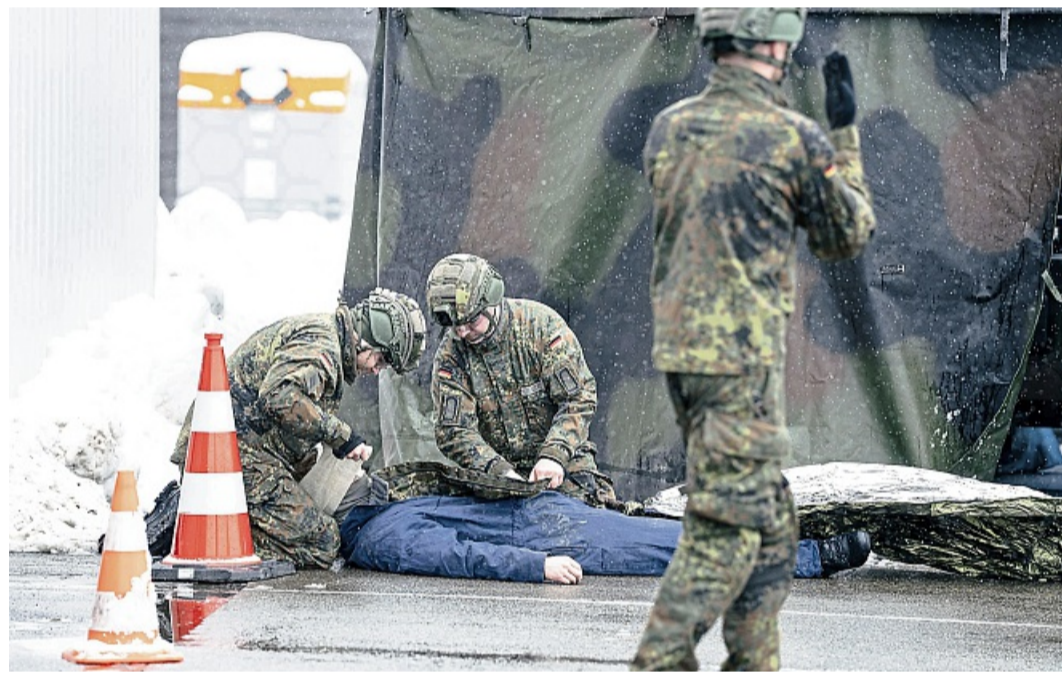
Versorgung von Verletzten: Auch das wurde in der Burgwaldkaserne geübt.

Damit zeigt die Bundeswehr, dass sie flexibel, schnell und wirksam zur Krisenbewältigung beitragen kann – auch im Frankenberger Land, heißt es in der Pressemitteilung. Die Veranstaltung wurde von allen