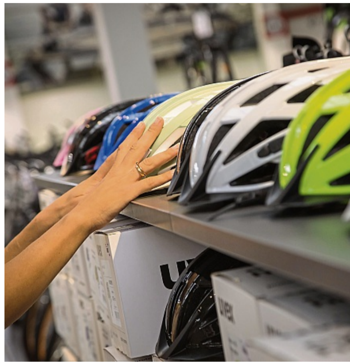
Sitzt, passt, schützt: Der richtige Fahrradhelm macht den Unterschied.

Bei typischen Rennradhelmen geht es oft um ein möglichst geringes Gewicht sowie eine gute Aerodynamik. Sie liegen oft preislich zwischen 70 und 250 Euro. Es gibt auch sogenannte Hybrid-Helme. Diese kombinieren hohe Stabilität