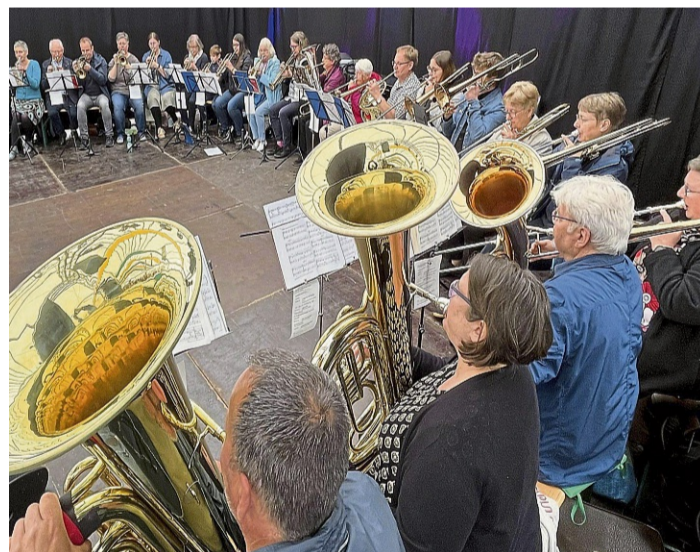
Kraftvolles Lob Gottes: So wie hier beim Pfingstmarkt 2025 hat der evangelische Posaunenchor Frankenberg seit seinem Bestehen an vielen hundert Gottesdiensten mitgewirkt.