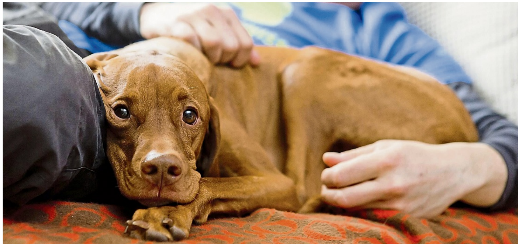
Im Kontakt mit Tieren schüttet unser Körper Oxytocin aus. Dieser Effekt kommt tiergestützten Therapien zugute.