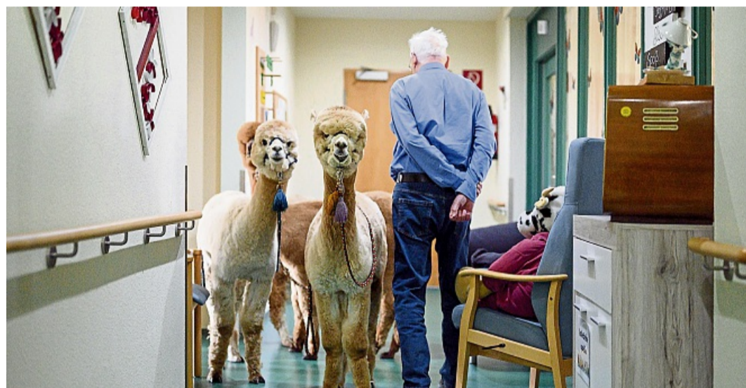
Alpakas bringen vielen Menschen Freude: Im Rahmen von tiergestützten Interventionen werden die Tiere deshalb auch in Pflegeeinrichtungen eingesetzt.