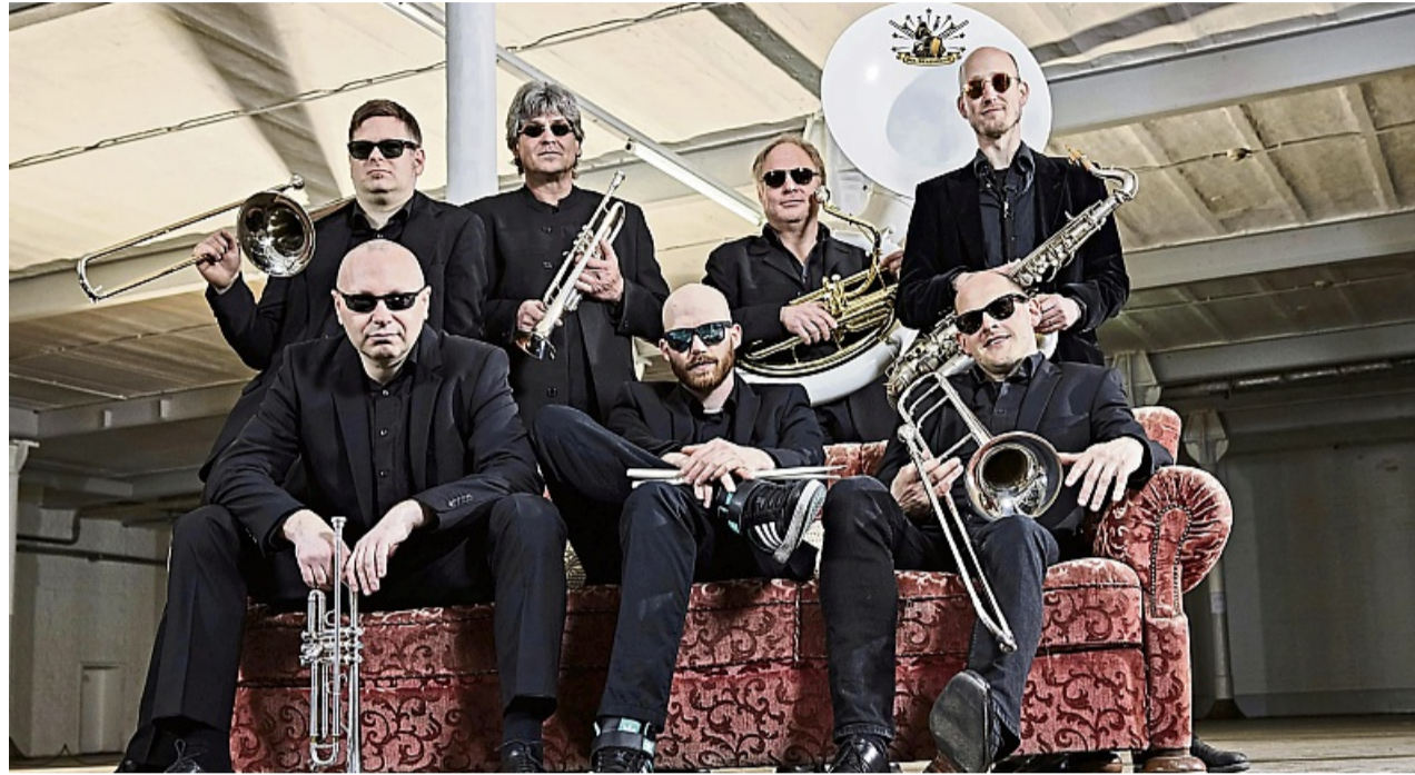
Die achtköpfige Formation „Mr. Brassident“ ist im März mit Blasinstrumenten und Schlagzeug zu Gast im BAC-Theater.

Achtköpfige Band „Mr. Brassident“ gastiert im März im BAC-Theater