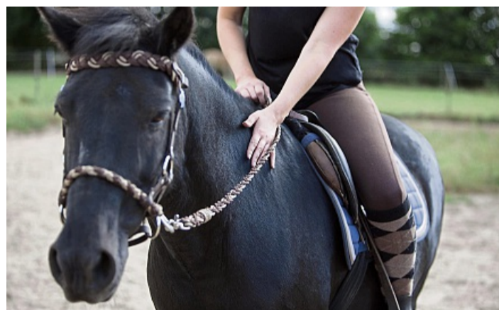
Auch Begegnungen mit Pferden können zu einer Therapie von psychischen Krankheiten gehören.