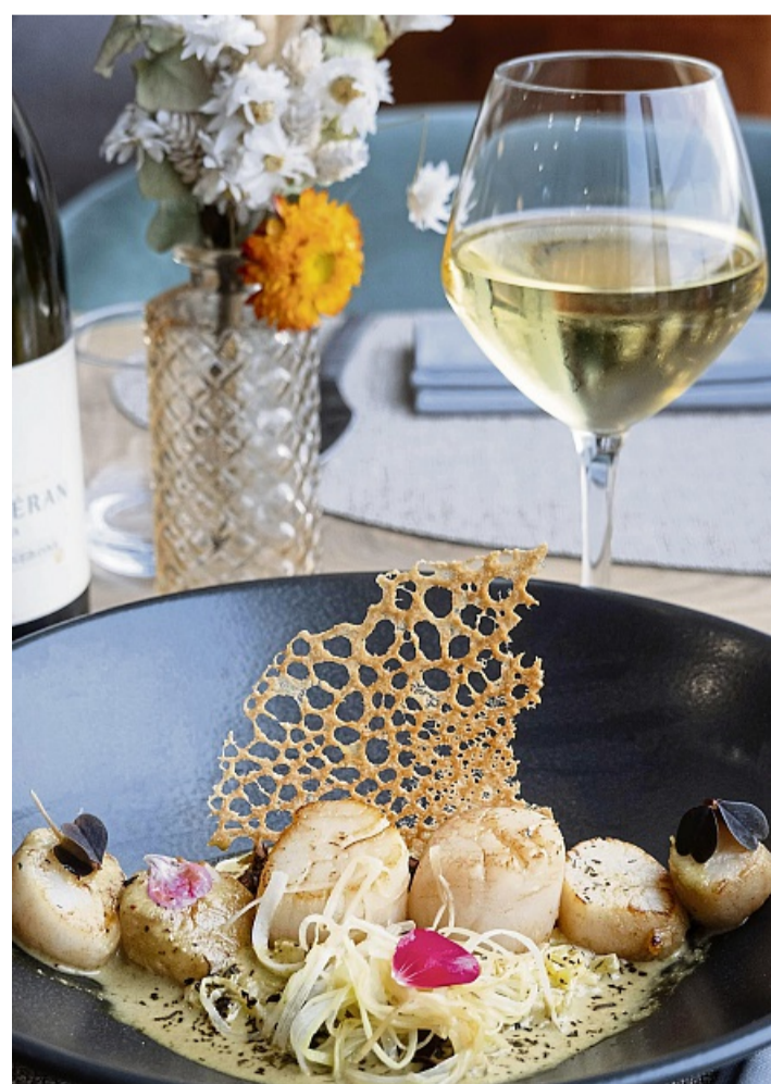
Aurélien Leclerc richtet die Jakobsmuscheln sehr dekorativ mit Lauchgemüse und Quinoa an, empfiehlt dazu einen trockenen Weißwein.