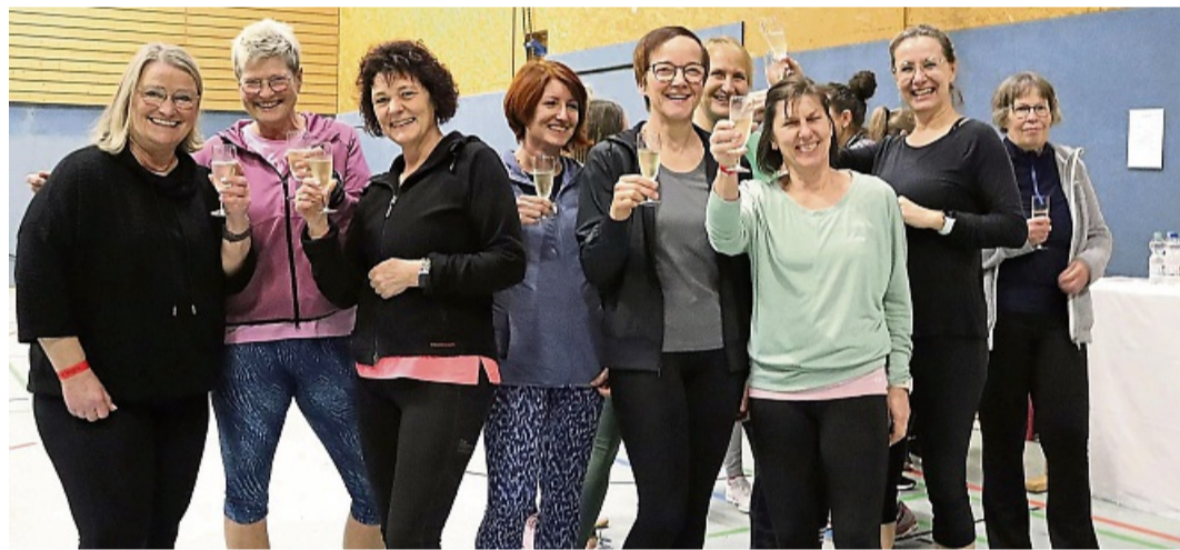
Die Teilnehmerinnen vor dem Start beim Sektempfang.