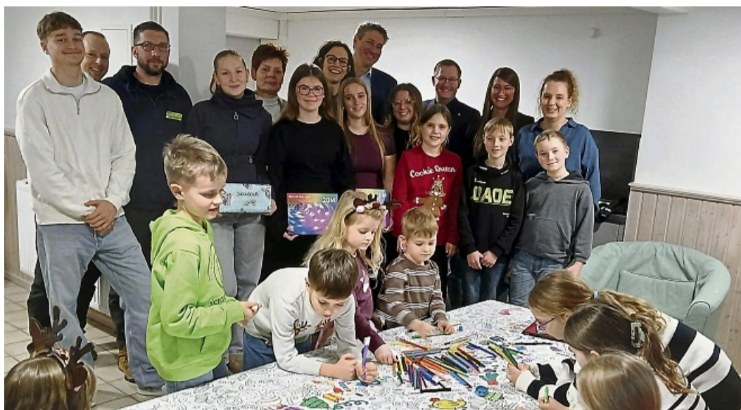
Freuen sich über den neuen Jugendraum: Vertreter aus Stadt und Dorf sowie einige Jugendliche.

Zu den konkreten baulichen Veränderungen zählen laut Angaben der Stadt: die Vergrößerung des Jugendraums durch den Teilabbruch von Trennwänden zu einem ehemaligen Lagerraum, die Ergänzung des Fliesenbelags, der Einbau neuer Heizkörper sowie die In-