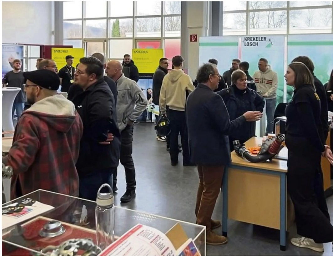
Auf der JobArena Münden können die Weichen für die berufliche Zukunft gestellt werden..

Auch soziale und kaufmännische Berufe kommen nicht zu kurz: Die Ergotherapie stellt die