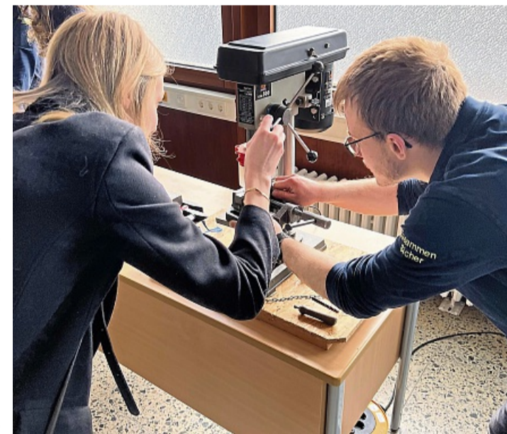
Bei der JobArena Münden kann man in verschiedene Berufe reinschnuppern und sich ausprobieren.

Ein besonderes Highlight der JAM 2.0 ist das neue Punkteranking: Nach Beratungsgesprächen an den Ständen können Besucher QR-Codes scannen