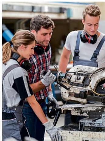
Talente sind individuell und keine Frage des Geschlechts.

Studien belegen, dass Begabungen individuell sind und unabhängig vom Geschlecht entwickelt werden können. Entscheidend sind vielmehr Übung und Interesse. Die Initiative Klischee-frei setzt sich dafür ein, Jugendliche zu ermutigen, Rollenklischees zu hinterfragen, und bietet auf klischeefrei.de eine umfassende Informationsdatenbank zu diesem