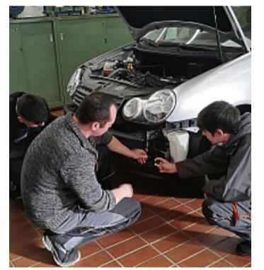
Die JobArena Münden bietet Einblicke in viele Berufe.