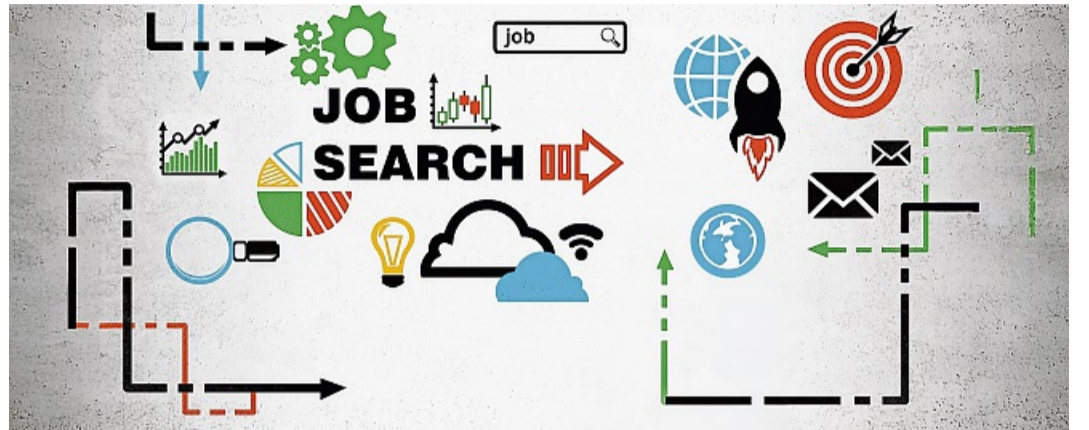
Was will ich einmal werden? Diese Entscheidung fällt vielen jungen Menschen nicht leicht und hängt von Fähigkeiten, Interessen und vom Abschluss ab.