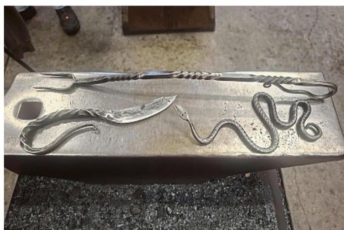
Um die Faszination des Feuers geht es bei verschiedenen Kursen in der Schmiede Hemeln.

In der Dreiflüssestadt Münden gibt es zum Beispiel Angebote im Bereich von Stand-Up-Paddling, Kajakfahren und Sportbootführerschein. Wer lieber trockenen Fußes draußen unterwegs ist, kann Fastenwandern.