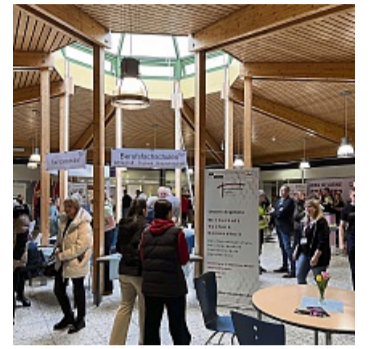
Orientierung für die berufliche Zukunft.