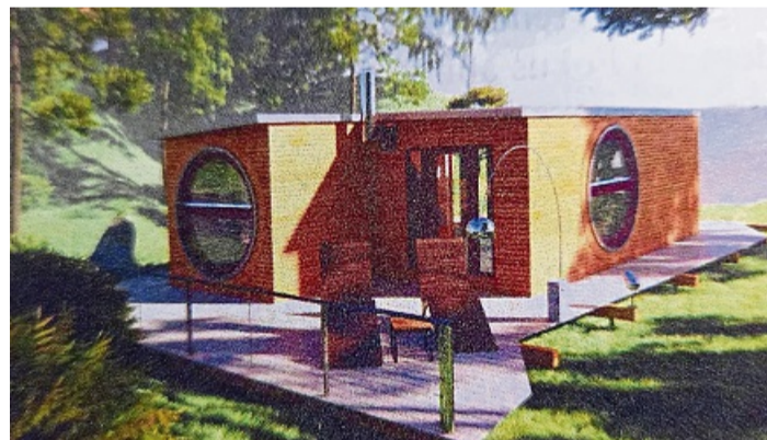
Die Vorstellung ist Wohnen und Natur im Einklang: Ein Modell, wie das Tiny-Haus in der Siedlung in Roßbach aussehen könnte.

Weiterhin soll in unmittelbarer Nähe eine gemeinschaftliche Wohnform entstehen. „Ihr Gasthaus Zur Linde möchten die Eigentümer verkaufen und in diesem Zug in eine sinnvolle Nutzung für den Ort überführen“, beschreibt der Ortsbeirat.