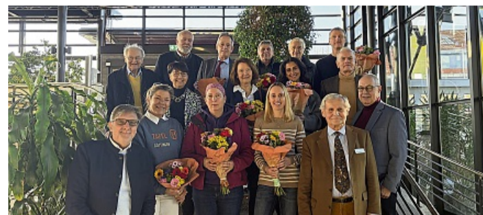
Acht Vereine und Organisationen konnten sich über die Hilfe vom Rotary Club Göttingen-Hann. Münden freuen. Darunter auch die „Lebenshilfe für das behinderte Kind Hann. Münden“.

Rotary Club Göttingen-Hann. Münden unterstützt mit insgesamt 19.800 Euro