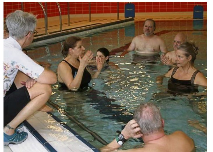
Lagebesprechung: Teilnehmer im Wasser und außerhalb beim „Aqua In“-Kurs in der Werratal-Therme.