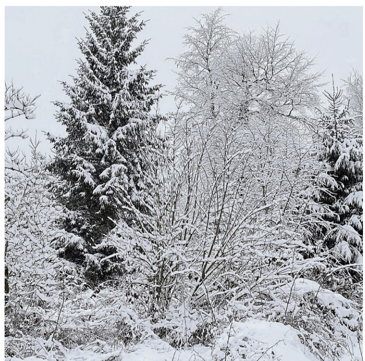
Schwerer Schnee lastet auf den Ästen der Bäume: Astbruch gibt es im Altkreis wenig.