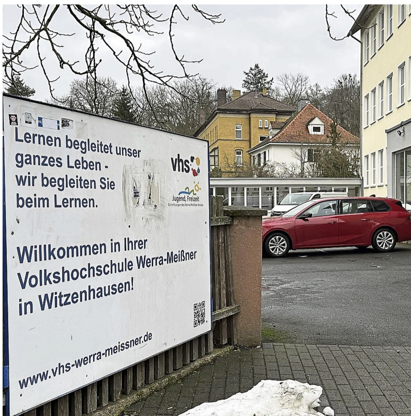
Ort des Lernens: Auch am Standort Witzenhausen startet die Volkshochschule Werra-Meißner in das neue Semester.

Ergänzend bietet die Volkshochschule mit der neuen digitalen Vortragsreihe „vhs.wissen live“ Livestream-Formate zu gesellschaftlichen, wissenschaftlichen, politischen und kulturellen Fragestellungen an. Teilnehmer können dabei Fragen direkt einbringen. Im Bereich Gesundheit und persönliche Entwicklung stehen erneut zahlreiche Kurse zur Auswahl, darunter Seminare für Eltern und pädagogische Fachkräfte zu Themen wie Hochsensibilität, Neurodiversität und Mobbingprävention. Hinzu kommen