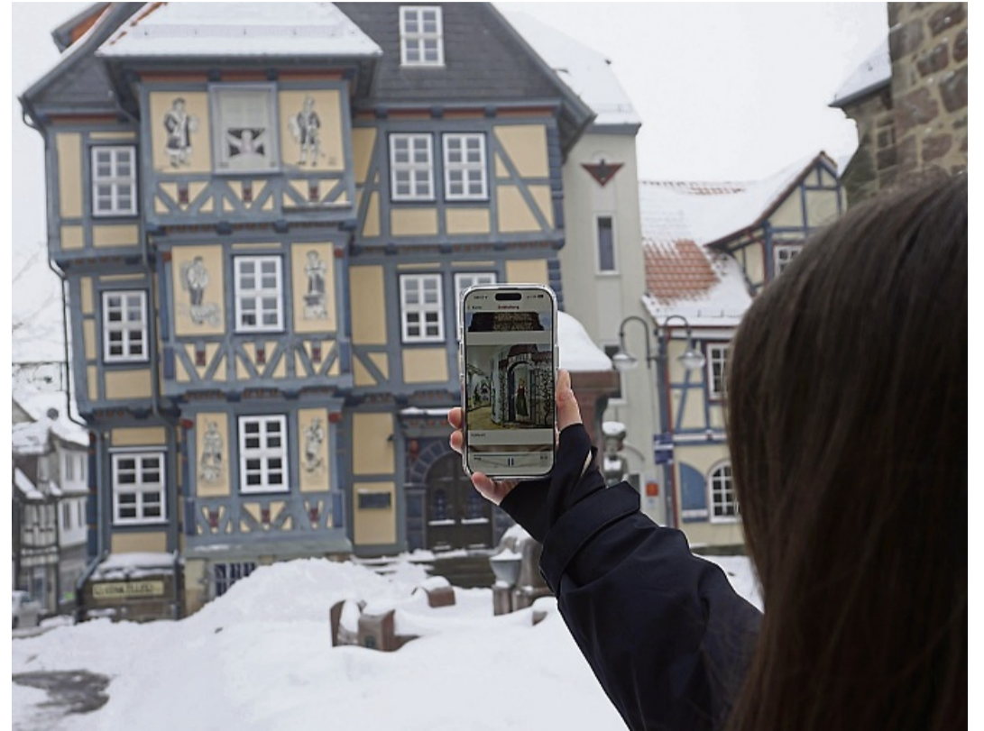
Hessisch Lichtenau hat nun eine Lauschtour: Mit ihr ist eine Stadtführung der besonderen Art möglich.

terliche und märchenhafte Art und Weise. Die Fotos in der App veranschaulichen die Sehenswürdigkeiten am Frau-Holle-Rundweg, vor denen man sich selbst gerade befindet. Auf dem Foto ist der Turm mit Efeu bewachsen, am vergangenen Mittwoch war sein Dach mit Schnee bedeckt. Beim Starten der „Lauschtour-App“ beginnt nach einem ersten Signalton zunächst eine kurze Einführung. Danach führt die App