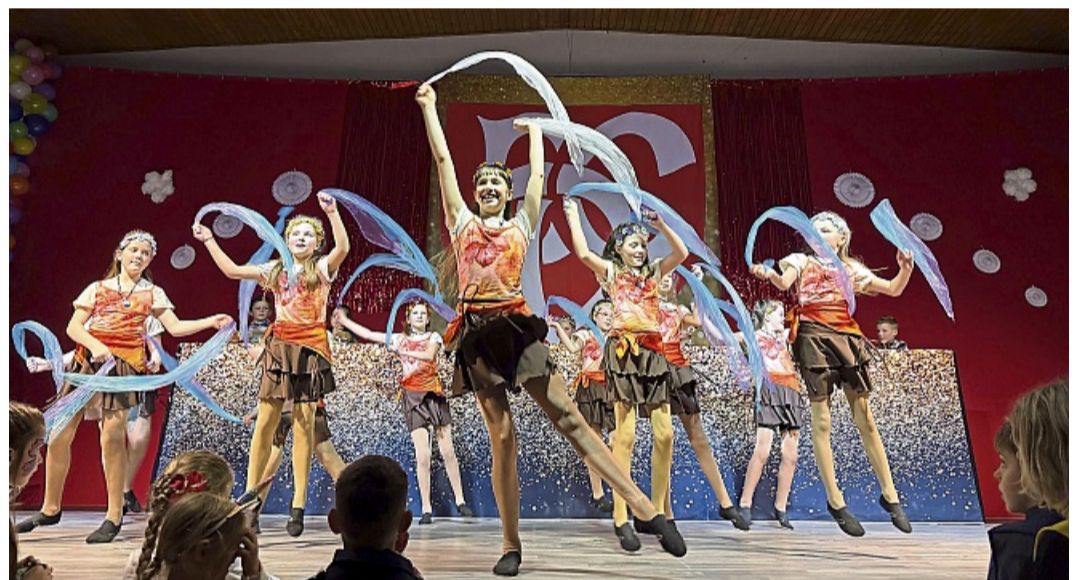
Sonnige Traumwelten beim Kinderkarneval: Die „Knallfrösche“ verzauberten mit ihrem Showtanz.

eingesprungener Trainerin. Ein Aushängeschild des Abends war die Prinzenгарde des ECV. Mit ihrem Showtanz unter dem Motto „Goldrausch“ überzeugte sie durch Ausdruck, Professionalität und gro-