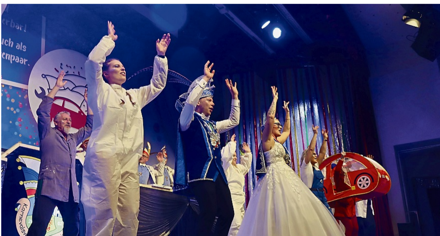
Nach den Auftritten stieg eine Party auf der Bühne.