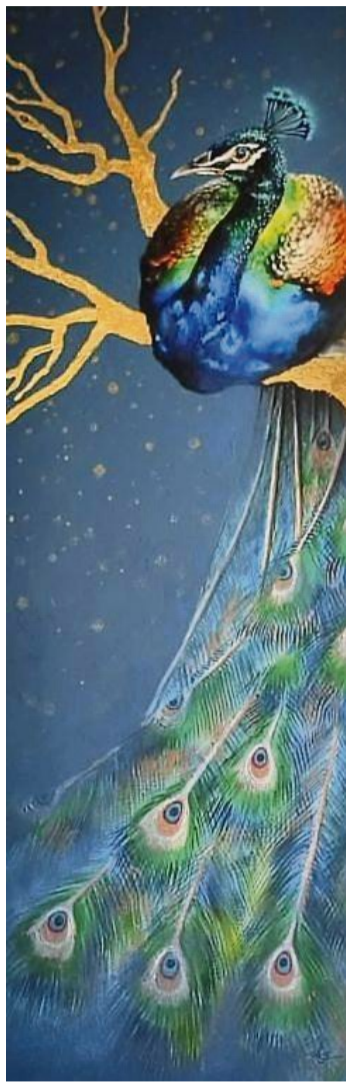
Dieses Werk zeigt eine stolzen Pfau mit schillerndem Federkleid.

Für ihre Arbeit nutzt die Künstlerin sehr unterschiedliche Materialien und Techniken. Dazu gehören Acryl- und Aquarellmalerei ebenso wie Zeichnungen mit Bleistift oder Kugelschreiber, Mischtechniken oder Arbeiten mit Pastellkreide. Neben den klassischen Techniken wagt sie sich seit ei-