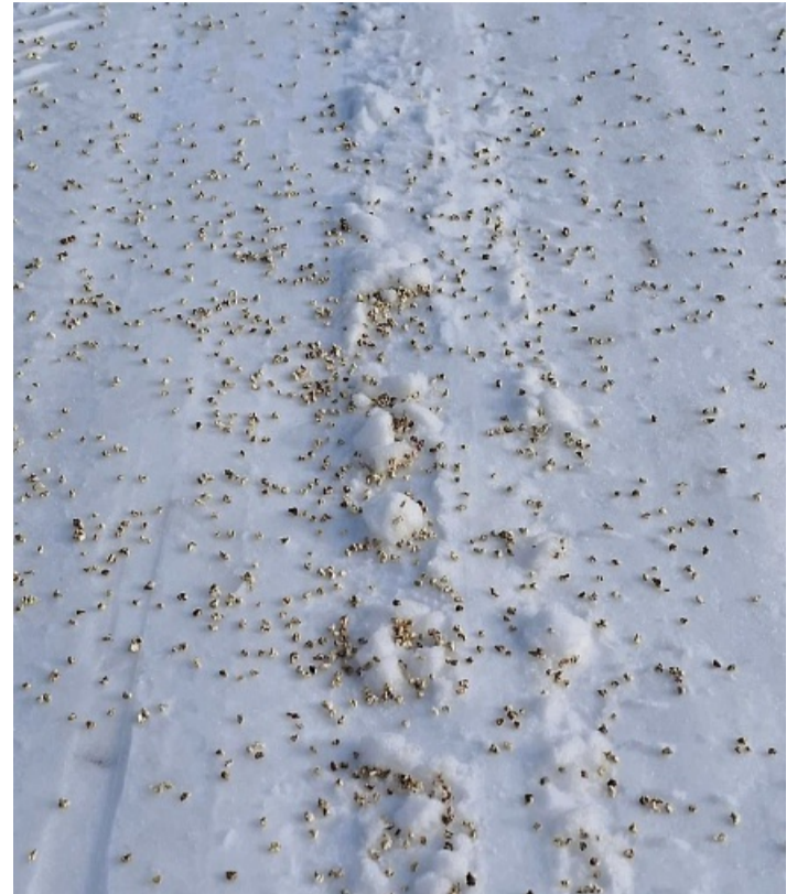
Hat eine abstumpfende Wirkung: Maisspindelgranulat sei gute Alternative für Streusalz.

Mündener Biologe Hermann Dreyer hält Maisspindelgranulat für gute Alternative