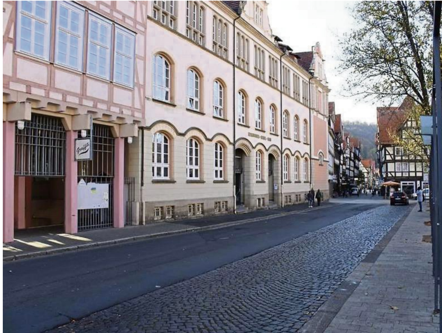
Im Geschwister-Scholl-Haus findet die Tauschbörse statt.

Der Ablauf wird bewusst einfach und niedrigschwellig gestaltet: Ab 15 Uhr können Besucher im Foyer des Geschwister-Scholl-Hauses gut erhaltene, saubere und tragbare Textilien abgeben. Pro Person werden bis zu zehn Teile angenommen. Neben Kleidung können auch Heimtextilien wie Bettwäsche