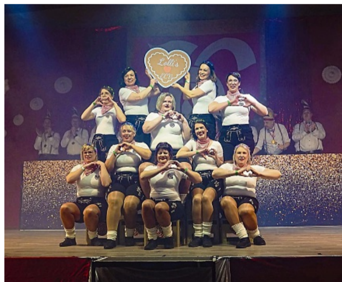
Die Lollies aus Nieste tanzen in Lederhose – mit Herz und Liebesbotschaft für den ECV.

humorvolle Akzente und betonten: „Wir alle haben Ecken und Kurven – wir alle sind schön“. Das Männerballett aus Rothwesten reiste als Schornsteinfeger an und eroberte die Bühne mit Charme, Witz und