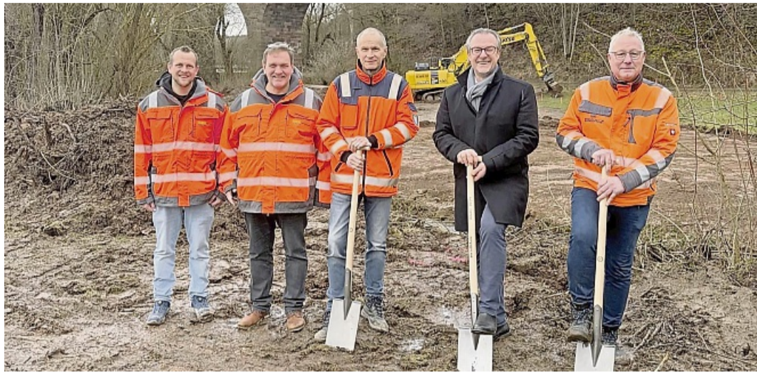
Offizieller Spatenstich für den Neubau eines Teilstücks des Radfernweges R5 bei Hornel.