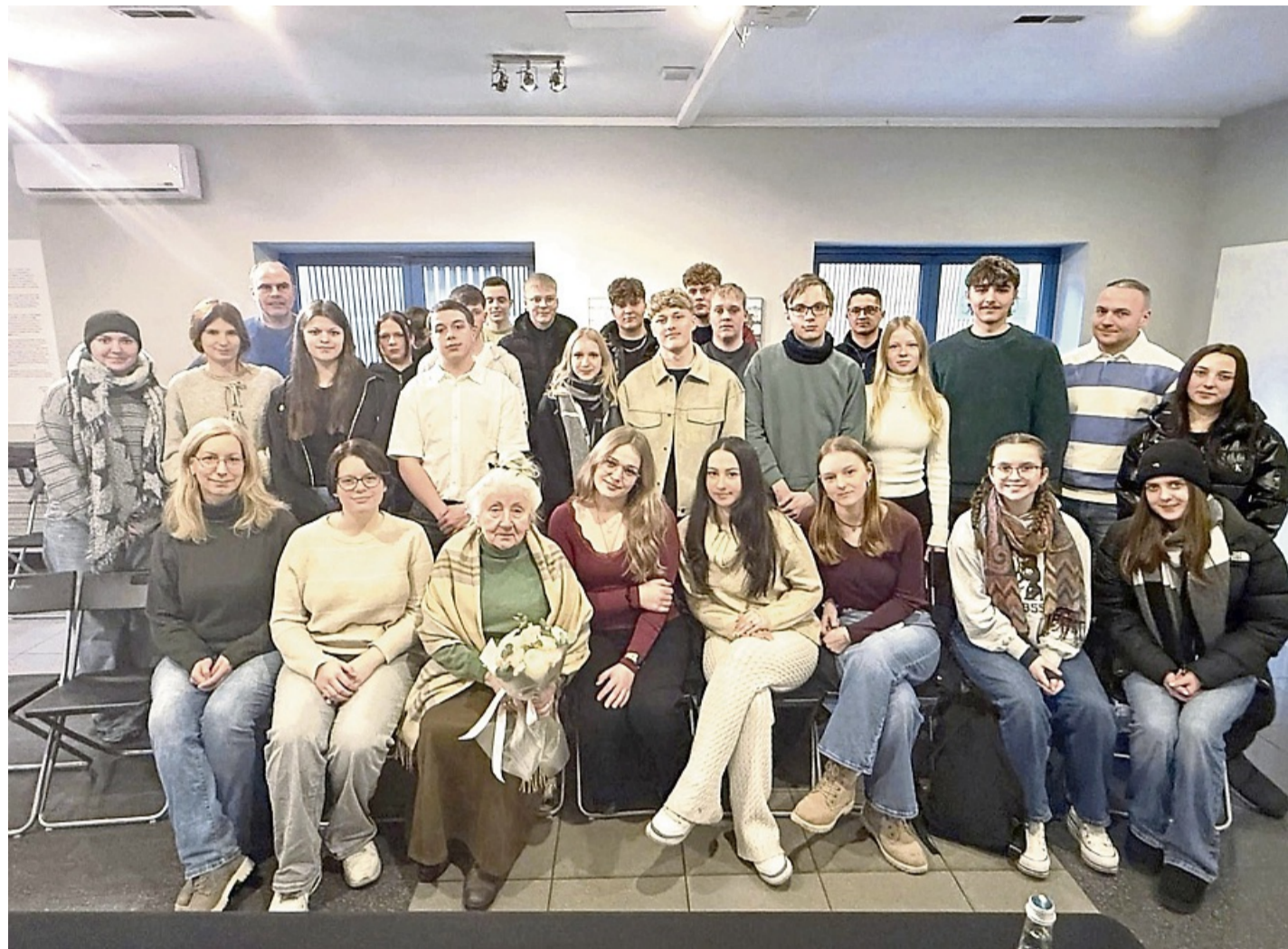
26 Schüler der Beruflichen Schulen in Eschwege haben sich mit der Verfolgung der jüdischen Bevölkerung im Zweiten Weltkrieg auseinandergesetzt.

Zunächst fuhr die Gruppe nach Auschwitz (polnisch Oświęcim). Dort wurden das Stammlager des Museums Auschwitz und das Vernichtungslager Auschwitz-Birkenau besucht. Es ist das größte Konzentrations- und Vernichtungslager der Nationalsozialisten. Die Gruppe besichtigte die Gebäude der Lager, die Gaskammern und die Baracken. Besonders eindrucksvoll war der Raum mit den aufgehäuften persönlichen Gegenständen der Opfer. Das Museum Auschwitz ist heute ein Gedenkort, an dem die Gräueltaten des Holocaust dokumentiert werden. Zusätzlich nahmen die Schüler