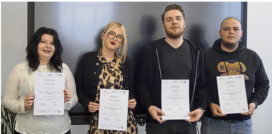
Projekt beendet: Die Jump-Teilnehmer des ersten Durchgangs mit ihren Zertifikaten.