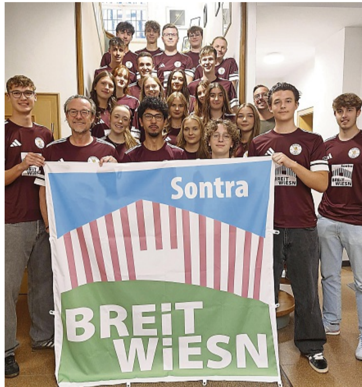
Die Freizeitmansschaft „Bella Promilla“ beteiligt sich seit letztem Jahr im Arbeitskreis BREITWiESN und übernimmt in diesem Jahr die Funktion des Symbolträgers.

Im Anschluss verwandelt sich das Festzelt von 21 bis 2 Uhr in