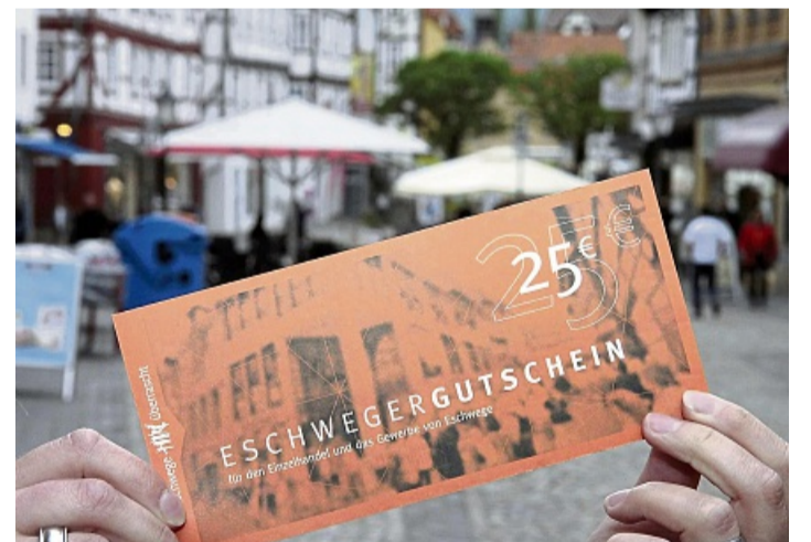
Im März lohnt sich das Einlösen doppelt: Wer seinen Gutschein zum Bezahlen gibt, kann mit etwas Glück

Marketing Eschwege veranstaltet Eschweger Gutschein-Aktion