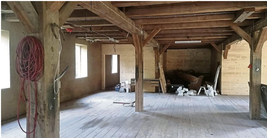
Für den öffentlichen Mehrzweckraum gibt es bereits viele Nutzungsideen. Hier könnten etwa Seminare und Schnuddeltreffs stattfinden.