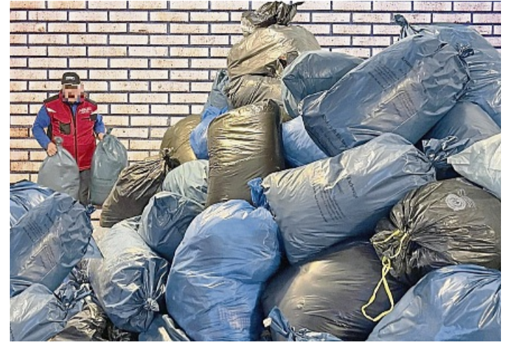
Es ist zu viel geworden: Eschwege Hilft kann keine Kleidung mehr lagern.

„Eschwege Hilft“ bittet im März um Verzicht auf Anlieferungen