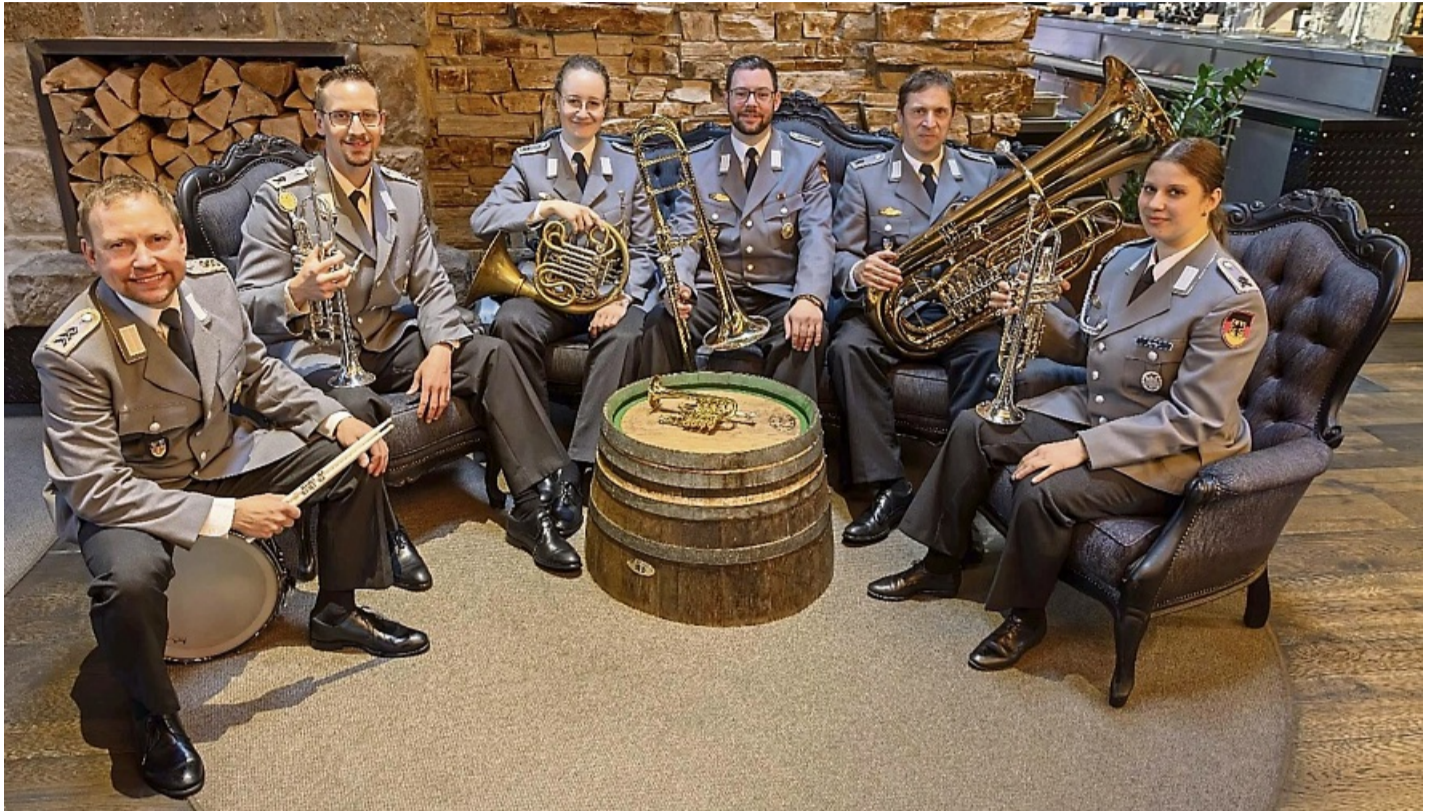
Ein besonderes Konzert bieten die Kammerensembles des Heeresmusikkorps Kassel in der Henkelhalle in Vöhl.

Für das von der Aktion für behinderte Menschen Waldeck-Frankenberg e. V. und der Nati-