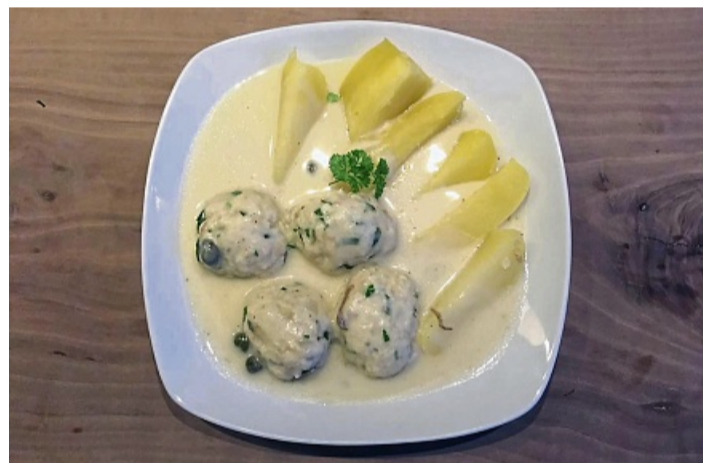
In den Königsberger Hecht-Klopsen stecken nicht nur Fischfilets, sondern passend dazu auch reichlich Petersilie und Zitronenabrieb.

weißen Pfeffer sowie Zitronensaft zurück.