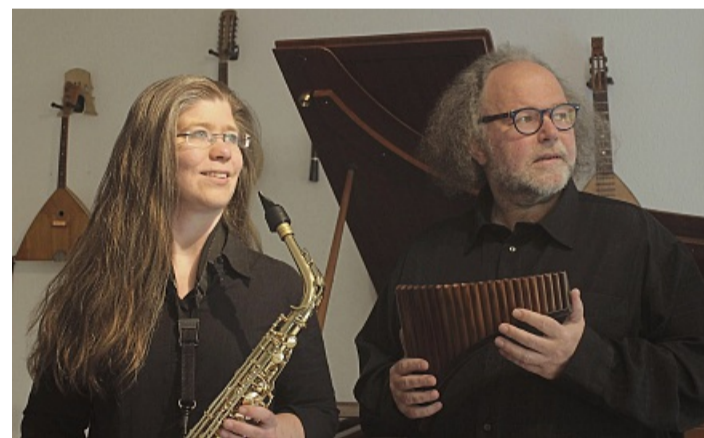
Das Duo Windwood & Co

Musikalischer Gottesdienst mit „Windwood & Co.“ am 1. März in der Pilgerkirche