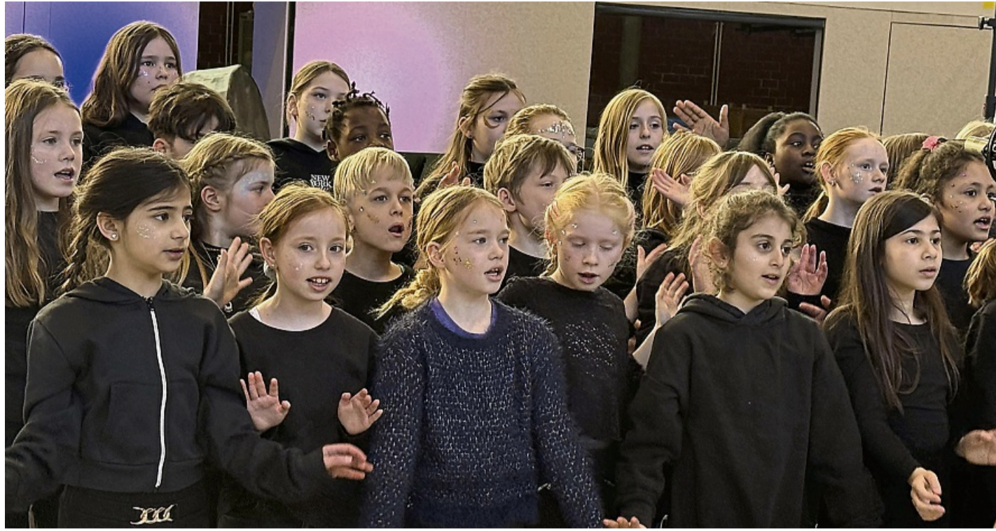
Der Chor der Grundschule Neuer Garten bezauberte mit einem Medley aus mehreren Stücken zum Thema Licht und Schatten.