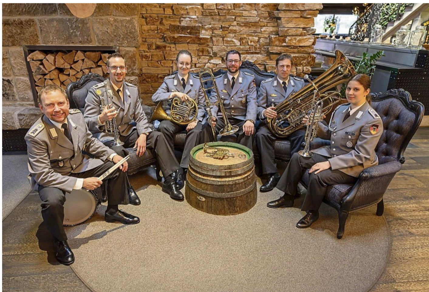
Musizieren für guten Zweck: Die Kammerensembles des Heeresmusikkorps Kassel geben in Vöhl ein Konzert zugunsten der Aktion für behinderte Menschen.

renamtliche Mitglieder organisierten Hilfen erfolgen, wenn staatliche Fürsorge aufgrund von Gesetzen gar nicht oder erst zu spät möglich ist. Das erfolge unbürokratisch und in Abstimmung mit öffentlichen Trägern der Sozialhilfe. red