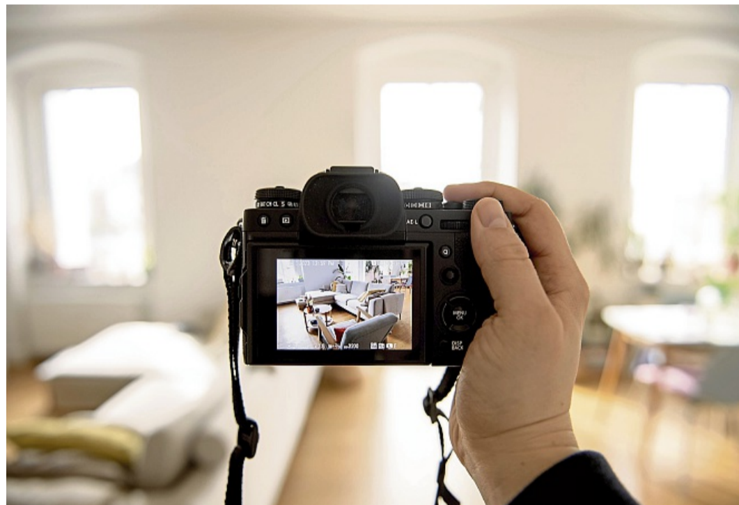
Keine privaten Details teilen: Für die Arbeit mit KI muss man oft Fotos von der Wohnung machen. Doch nicht alle Einzelheiten sollten darauf zu sehen sein.