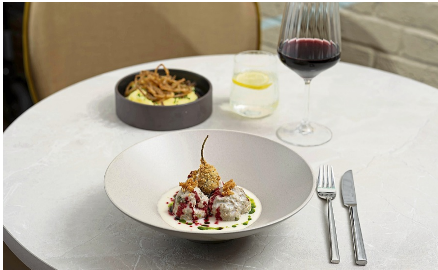
Der frittierte Kapernapfel und die Tröpfchen von dem eingekochten Rote-Bete-Sirup geben den Königsberger Klopsen zusätzlich Textur sowie Crunch und sorgen für ein Spiel mit Säure-Nuancen.

Zum Abschmecken greift Kristof Mulack zusätzlich auf Salz, Zucker, Knoblauchgranulat,