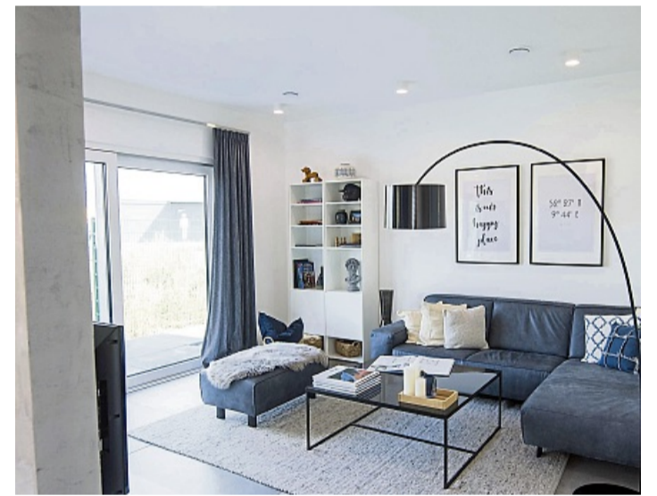
Passt der Lichteinfall zum Sofastandort? Bei solchen Fragen kann KI helfen.