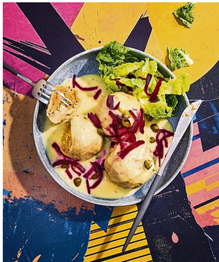
Ganz ohne Hack werden diese veganen Klopse nach Königsberger Art zubereitet. Die Basis sind gegarte Maronen, Speisestärke und Kichererbsenmehl, was für einen leicht nussigen Geschmack sorgt.