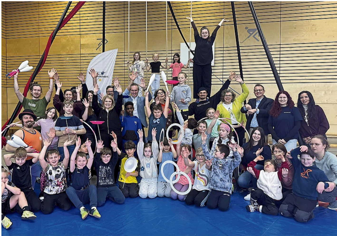
Der Kiwanis Club Frankenberg unterstützt das Projekt des Landkreises und der Stadt Frankenberg „Kinder machen Zirkus“ mit einer Spende. Die Übergabe fand im Rahmen der jährlichen Schnupperwoche in Frankenberg statt.