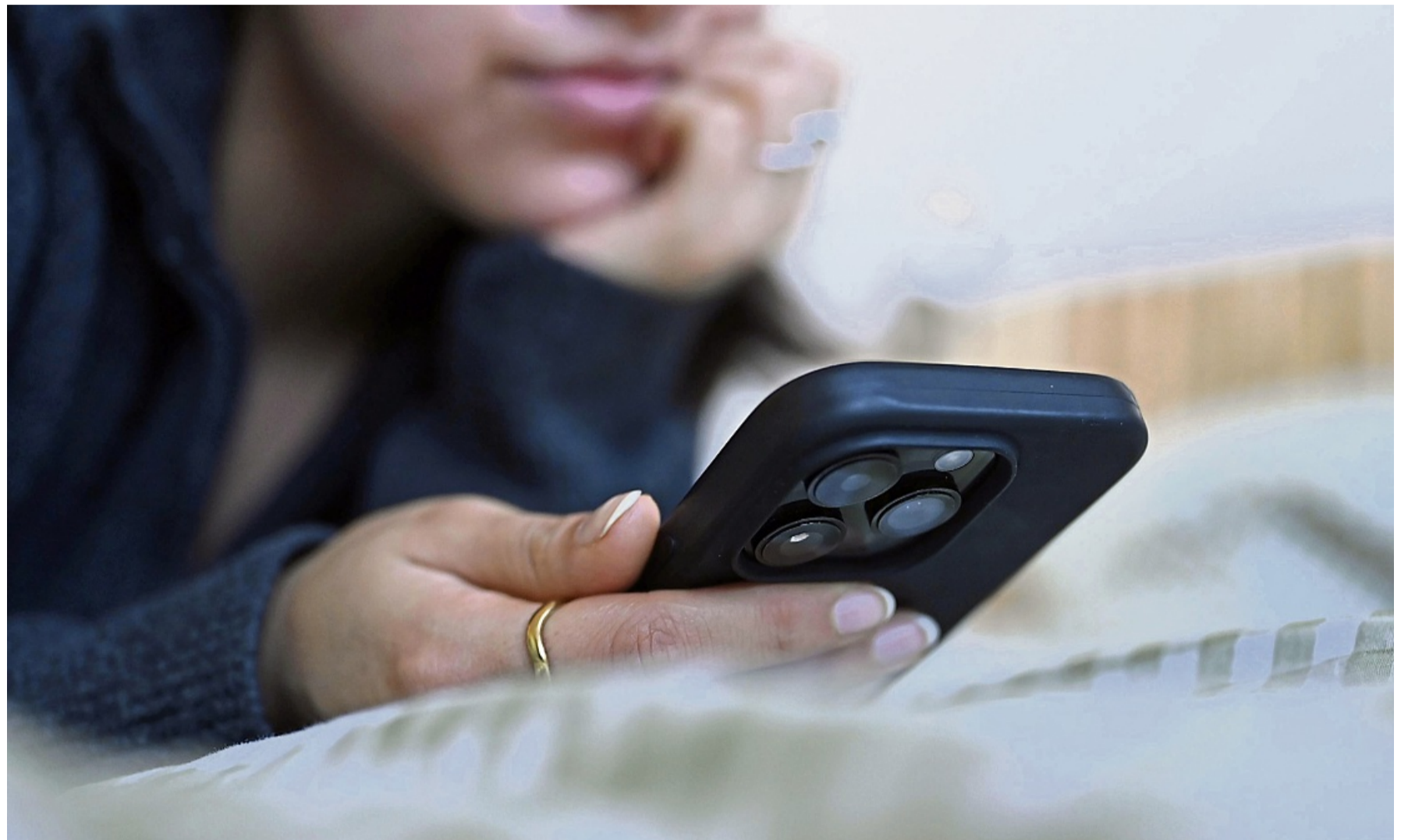
Eine App auf Rezept: Digitale Gesundheitsanwendungen können bei verschiedenen psychischen Krankheiten unterstützend eingesetzt werden.