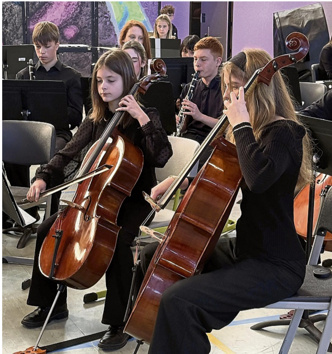
Im Jugendorchester des Arolser Gymnasiums spielen Kinder von der sechsten bis zur achten Klasse.

te Ensemble stellte das Jugendorchester der Edertalschule, deren Mitglieder mit „Trumpet Voluntary“ und „Bellinzona Castle“ zeigten, wie weit sie ihre Instrumente schon beherrschten. Den krönenden Abschluss bildeten die 55 Musiker des Jugendsinfonieorchesters des Frankenger Gymnasiums. Mit ihren Arrangements von „The Lion King“ und „Themes of 007“ begeisterten sie das Publikum noch einmal richtig.