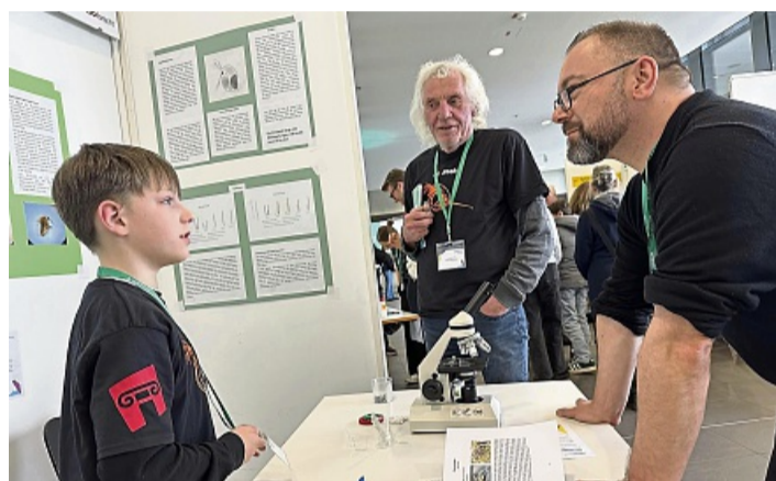
Im Schulteich begann die Spurensuche: Die jungen Forscher zeigen, wie unscheinbare Dauereier über Bestand und Fortpflanzung des Wasserfloh entscheiden.

KiKA-Wissenschaftsjournalisten Eric Mayer. Eine 62-köpfige Jury wählte 13 Siegerprojekte in sieben Kategorien aus. Entscheidend war nicht die Originalität allein, sondern die wissenschaftliche Stringenz von Hypothese, Versuchsdesign, Auswertung bis hin zur Fehleranalyse.