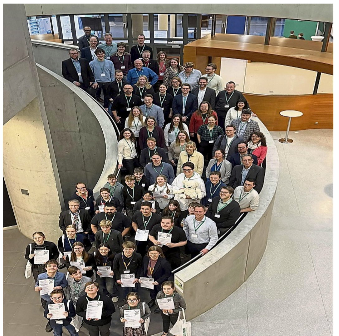
Eine Generation mit Ideen: 55 Nachwuchstalente präsentieren ihre Projekte beim Regionalwettbewerb im B.-Braun-Werk.