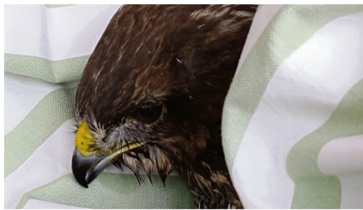
Der aus der Fulda gerettete Bussard hatte Lähmungserscheinungen, nachdem er etwas Giftiges gefressen hatte, und ist jetzt in den Händen einer Tierärztin.

Heftchen mit Bewerbungsvoraussetzungen für die Polizei.