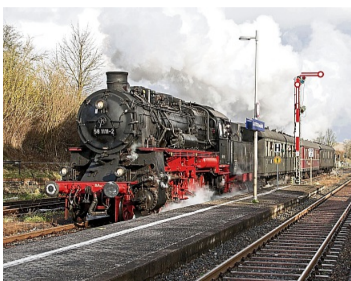
Nostalgiefahrt: Der Verein „Eisenbahn-Nostalgiefahrten-Bebra“ veranstaltet Fahrten mit dem historische Dampfzug.

Der Cornberger Tunnel, der seit 1876 fester Bestandteil der Bahnstrecke Bebra-Göttingen ist, „zählt zu den bedeutenden Ingenieurbauwerken der Region“. Da in den kommenden Jahren ein neuer Tunnel errichtet und die alte Tunnelröhre dann nicht mehr benötigt wird, soll es zum Jubiläum „noch einmal richtig dampfen“. Mit der Ein-