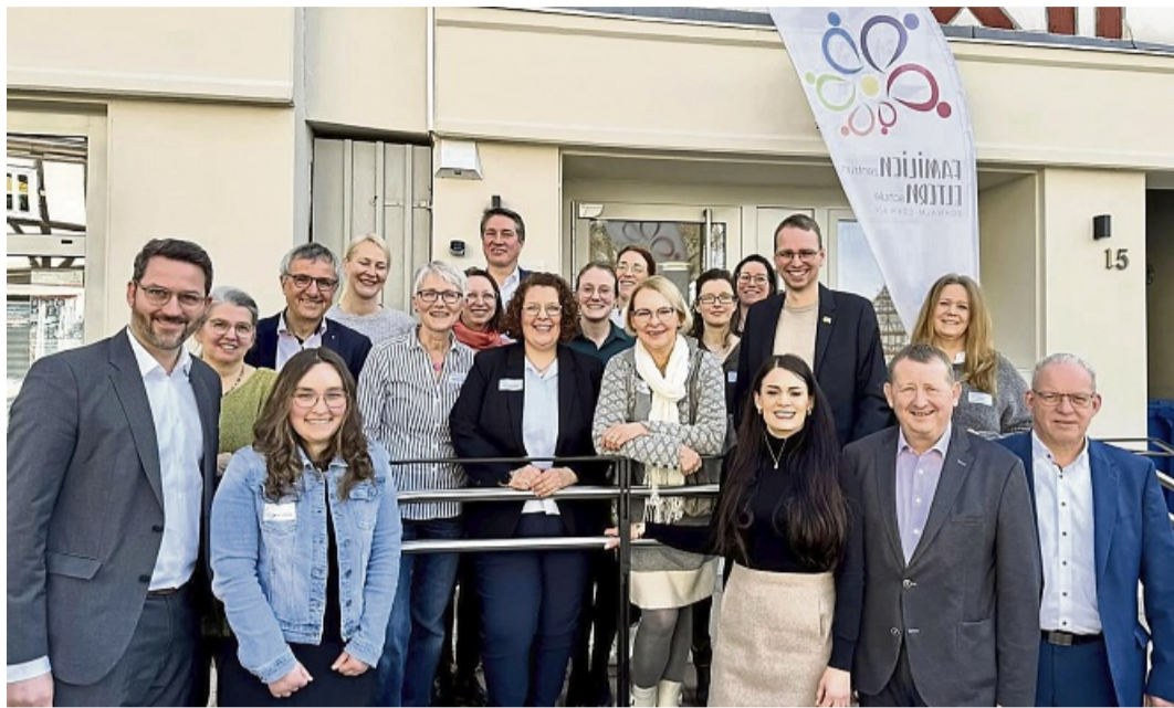
Große Wertschätzung: Mitarbeiter, Gründungsmitglieder, Ehrenamtliche und Vorstand erfuhr bei der Jubiläumsfeier von zahlreichen Politikern große Anerkennung für ihre Leistung.