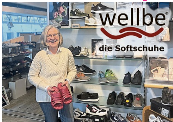
Das Team im Schuhhaus Schreier, Nikolausstraße 2 freut sich auf Sie.

Mit orthopädischen Einlagen perfekt kombinierbar.