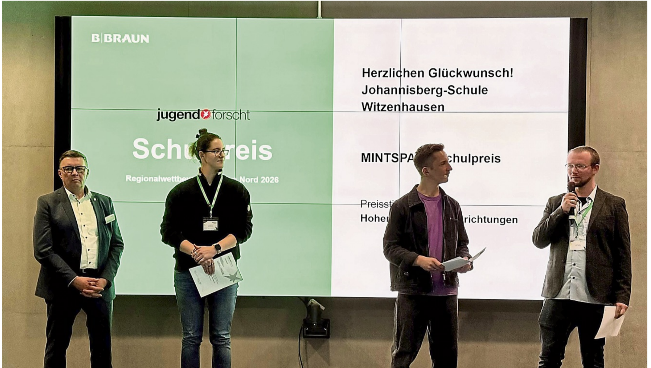
Die Johannisberg-Schule Witzenhausen wurde beim Regionalwettbewerb mit dem Minspace-Schulpreis ausgezeichnet. Die Ehrung würdigt die kontinuierliche Förderung naturwissenschaftlich-technischer Projekte an der Schule.

Johannisberg-Schule überzeugt bei „Jugend forscht“ und erhält Sonderpreis