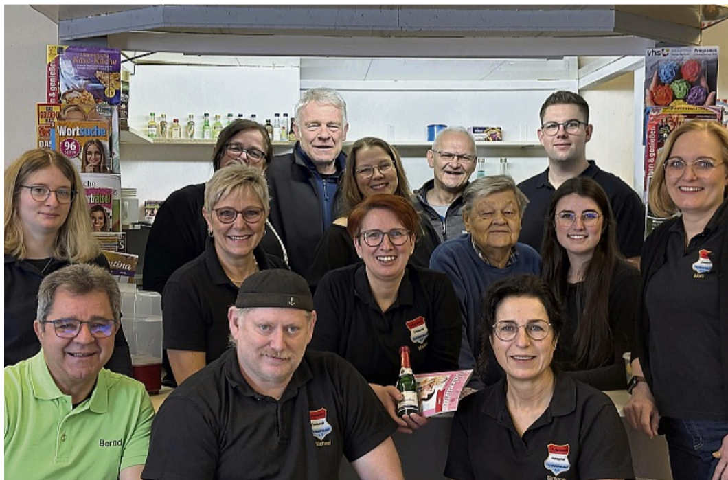
Ihr neues Stück „Trudes Bude“ bringt die Theatergruppe des Kulturvereins Hundelshausen im April auf die Bühne des Bürgerhauses.

Theatergruppe Hundelshausen startet im April