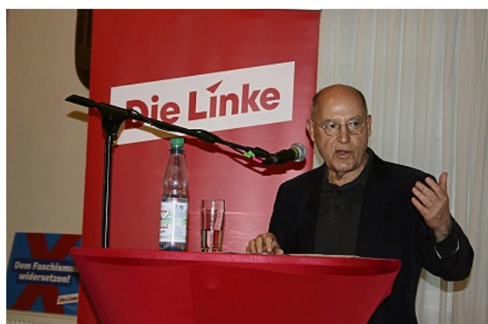
Viel Beifall von Jung und Alt: Politurgestein Gregor Gysi bei seiner Rede.

er beteuert, von der Schuldenbremse nicht abzuweichen. Das Gegenteil sei aber der Fall. Merz, urteilte er, gehe es nicht um Wahrheiten, sondern nur um Mehrheiten. Der Wähler fühle sich „verarscht“, und genau das gefährde die Demokratie.