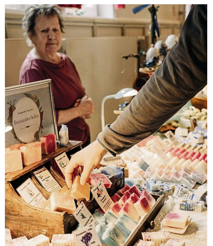
Die Stände laden mit vielfältigen Geschenkideen und handgemachten Schätzen zum Staunen und Stöbern ein.

Der Eintritt kostet 5 Euro für Erwachsene. Jugendliche zwischen 12 und 17 Jahren sowie Menschen mit Schwerbehindertenausweis zahlen 2 Euro, Kinder und Jugendliche bis 12 Jahre haben freien Eintritt. Die Burg ist leider nicht barrierefrei. Parkplätze befinden sich am Fuße des Burgbergs, ein kostenloser Shuttle-Service bringt die Gäste bequem zur Burg und zurück. Veranstaltet wird der Markt vom Arbeitskreis Europäische Jugendwochen e.V., einem gemeinnützigen, ehrenamtlich tätigen Verein. Der Erlös des Ostermarktes fließt vollständig in die Finanzierung der