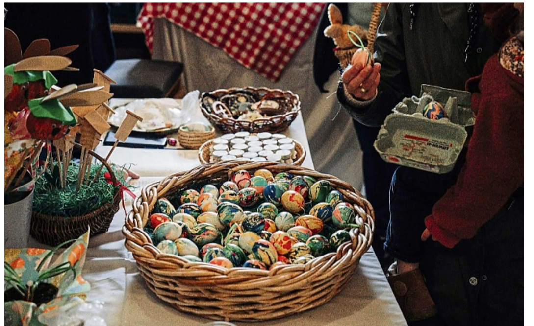
Ein weiterer Höhepunkt ist die diesjährige Osterausstellung unter dem Motto „Kuriositäten“. Hier werden außergewöhnlich bearbeitete Eier gezeigt, die mit verschiedensten Techniken gestaltet wurden.

Auch kulinarisch kommen die Sie voll auf ihre Kosten: Von Bratwurst, Crêpes und Ofenkartoffeln mir leckeren Dips über Kuchen und Kaffee bis hin zu erfrischenden Kaltgetränken ist für jeden Geschmack etwas dabei. Für die Jüngsten gibt es eine fröhliche Bastelstube, in der nach Lust und Laune kreativ gestaltet werden kann. Außerdem können Groß und