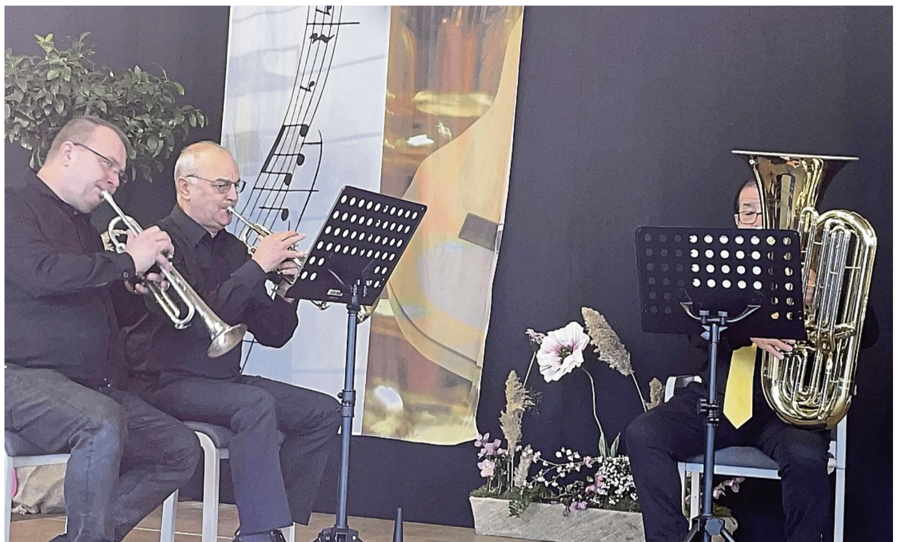
Das Solling Brass Quintett spielte während der Feierlichkeiten zusammen mit dem Schulchor des Grotefend-Gymnasiums.

Landrat Marcel Riethig sprach über die Begriffe Ehrenamt und Kultur und hob in seinem Grußwort die Bedeutung