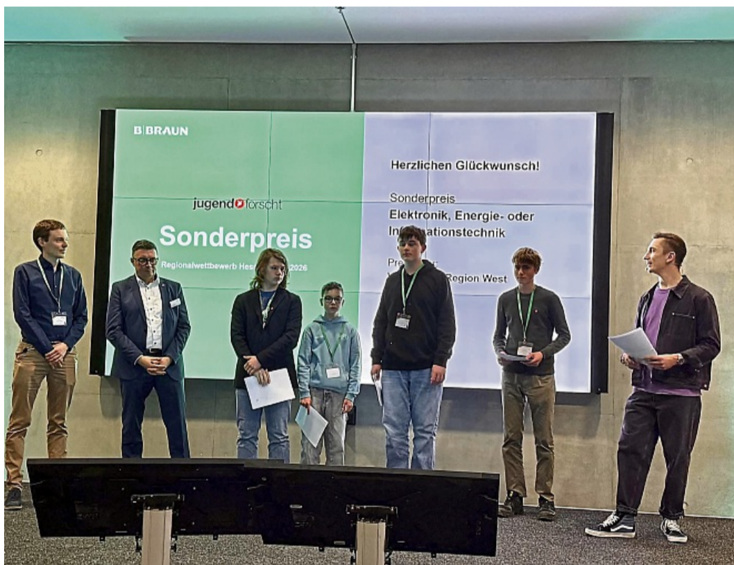
Technik gegen Müll: Die „Mobiltonne“ fährt Platz zwei bei „Jugend forscht Junior“ ein.