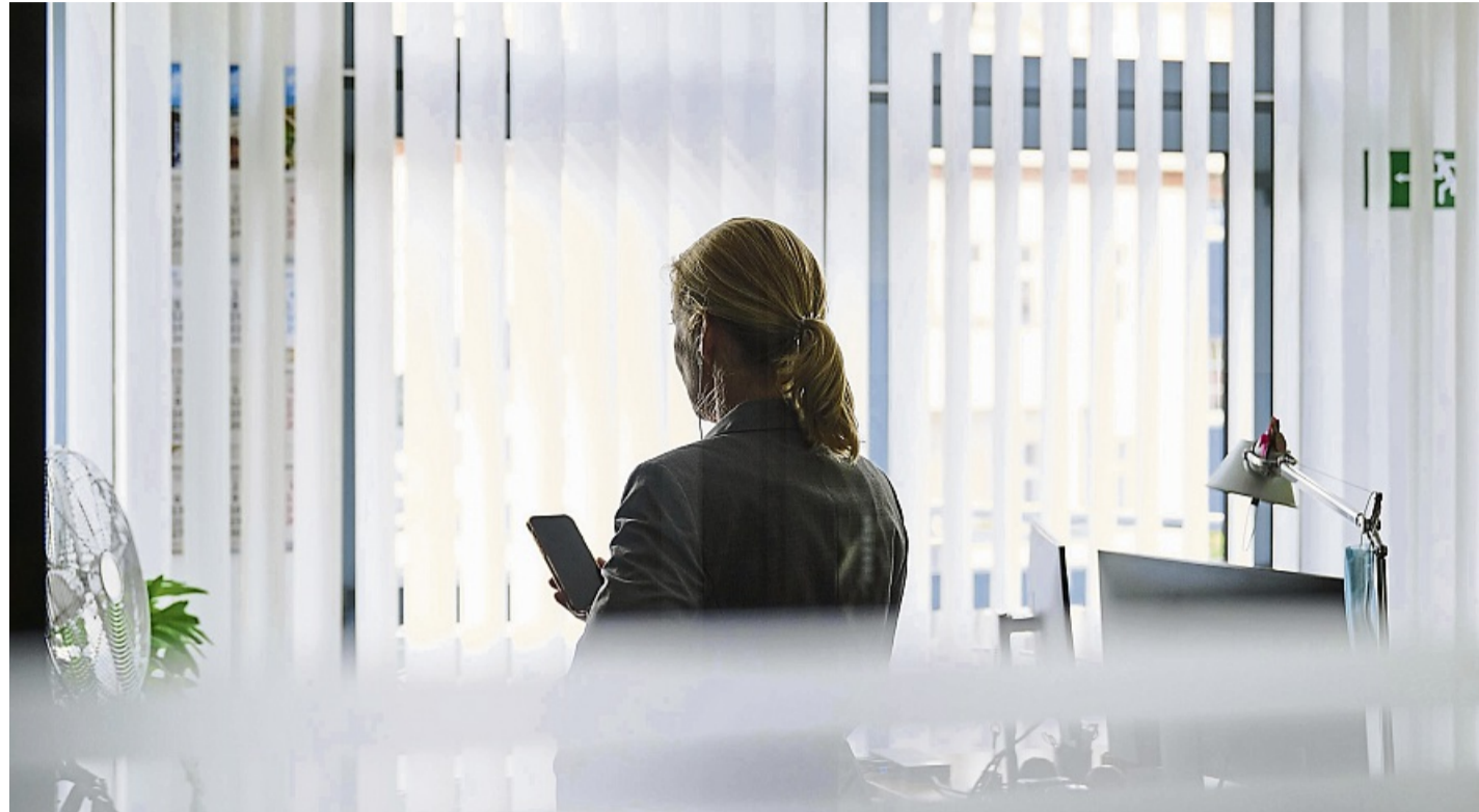
Es ist nie zu spät, mit dem Sparen anzufangen: Wer allerdings früh startet, kann den Zinseszinsseffekt besser für sich nutzen.

Als Grund für die finanzielle Schlechterstellung im Alter geben Frauen häufig den fehlenden finanziellen Spielraum (66,9 Prozent) und Erwerbsunterbrechungen (43,4 Prozent) an. Geringere Einkünfte im Laufe ihres Erwerbslebens ermöglichen ihnen häufig nicht, privat so viel Geld wie Männer zurücklegen. Mehr als jeder dritte Mann (35,5 Prozent) kann