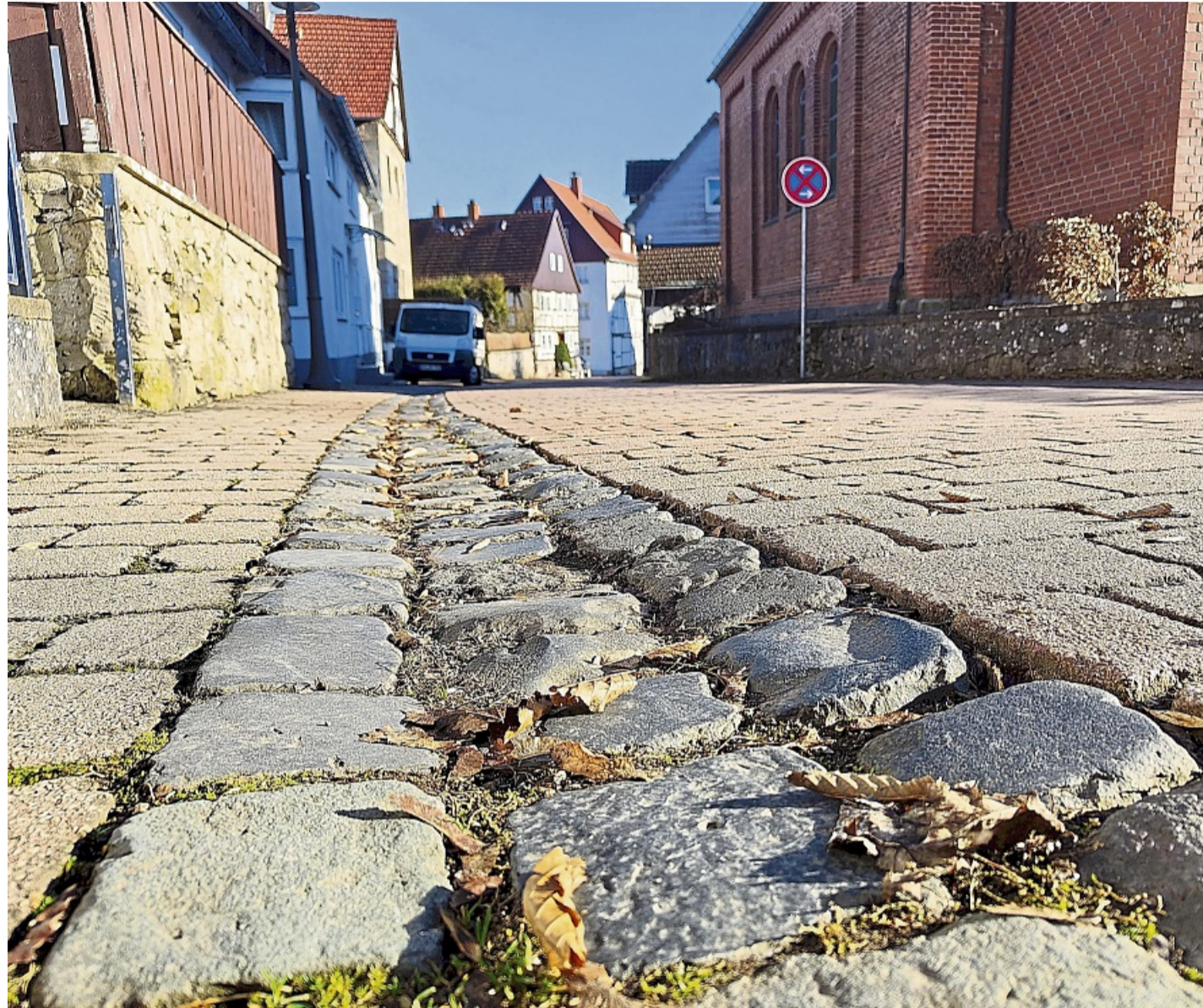
Wohnstraßen ohne baulich getrennten Bürgersteig, wie hier am Ascher in Korbach, sollten „im Regelfall“ als „verkehrsberuhigte Flächen“ ausgewiesen werden. Der Antrag der Grünen endete als unverbindlicher Prüfauftrag an die Stadtverwaltung der Hansestadt.