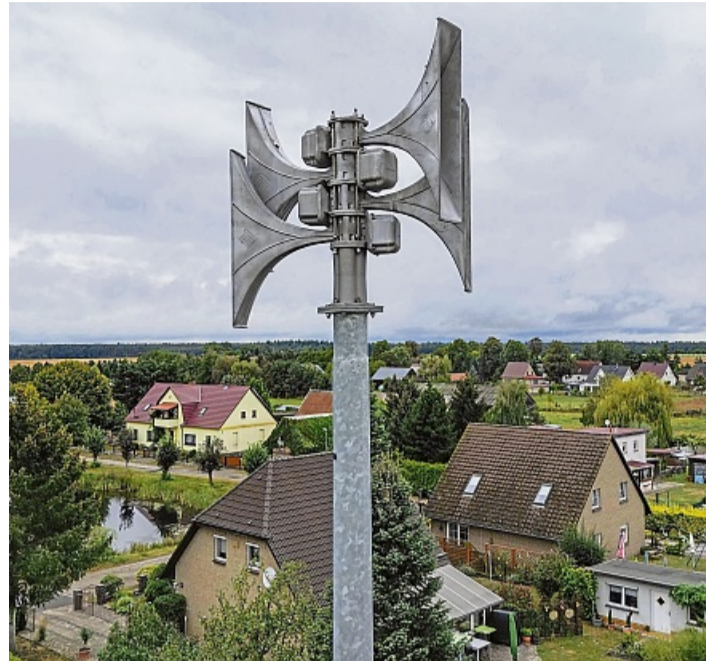
Am 12. März werden Sirenen zur Probe aufheulen und Warnmeldungen abgeben.

Großer Probealarm am 12. März mit Warnmeldungen aufs Smartphone