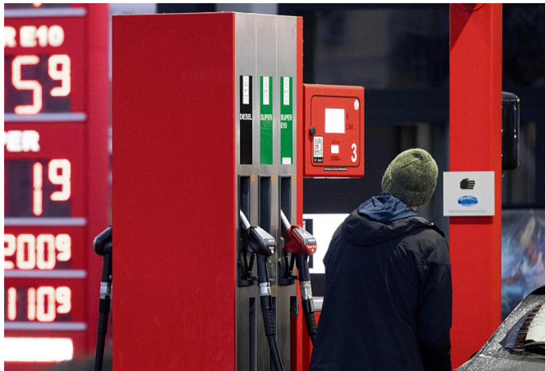
Bei den aktuell steigenden Spritpreisen geht für viele Menschen die Suche nach der günstigsten Tankstelle los.

Da bleibt die Faustformel: Ein kurzer Umweg kann sich lohnen, ein weiterer nur bei sehr