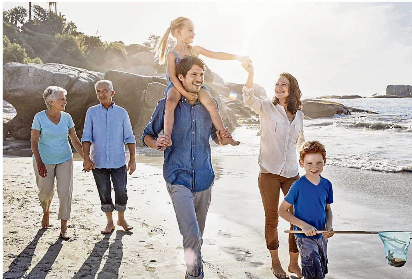
Wenn im Vorfeld Erwartungen besprochen und Kompromisse gefunden wurden, kann der Urlaub mit drei Generationen auch so laufen, dass jeder gewinnt.