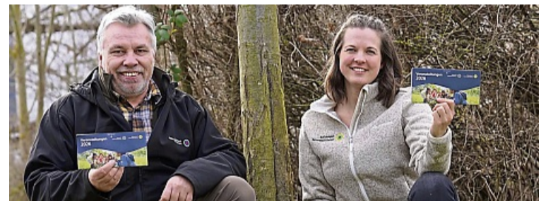
Der gemeinsame Veranstaltungskalender ist ab sofort erhältlich.

machen. Ansonsten gibt es vielfältige Veranstaltungen, um die einzigartige Natur der Region das ganze Jahr über neu zu entdecken – das Programm bietet für jede Altersgruppe und jedes Interesse passende Angebote.