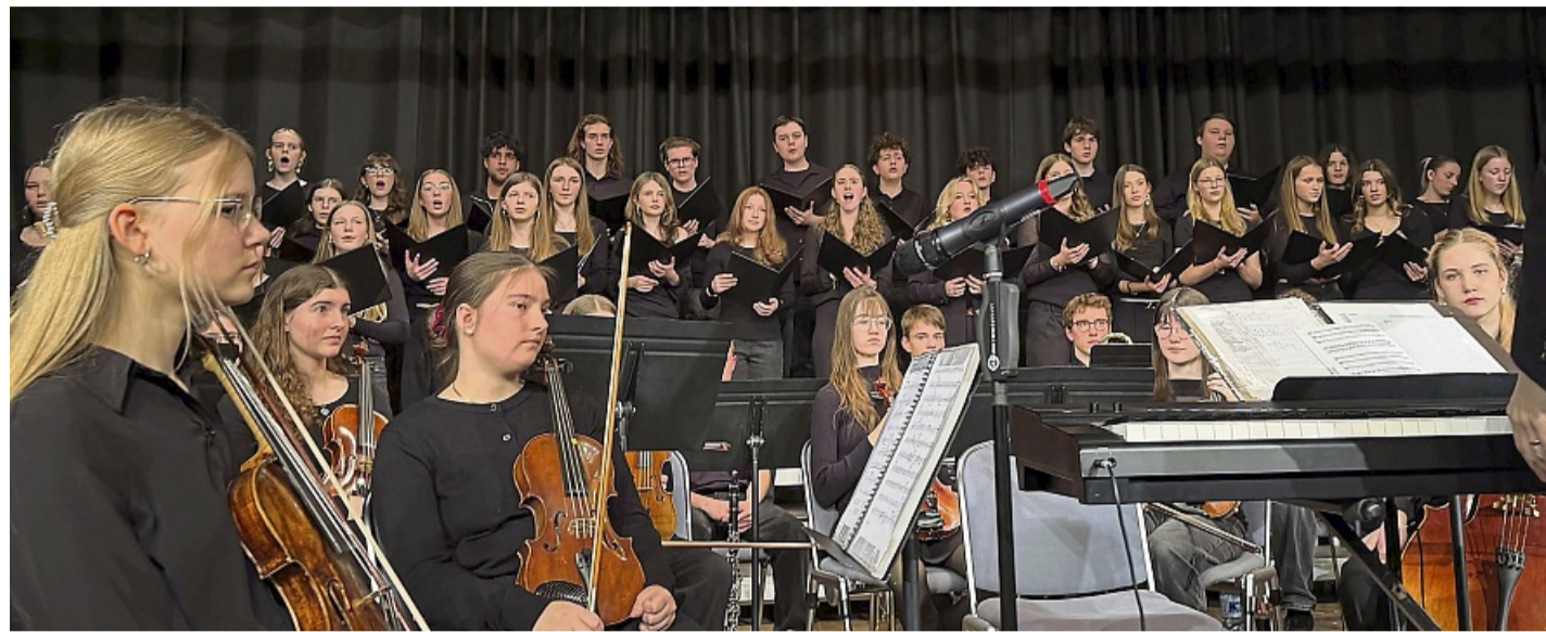
Den musikalischen Rahmen der Benefizveranstaltung in der Fürstlichen Reitbahn gestalteten der Chor und das Orchester der Christian-Rauch-Schule.

Russland, das nicht erst seit Beginn des Angriffskrieges auf die Ukraine die größte Bedrohung für den Frieden in Europa darstelle, verbrauche gerade in einem erbarmungslosen Abnutzungskrieg seine alten Militärbestände aus Zeiten der Sowjetunion. Gleichzeitig laufe