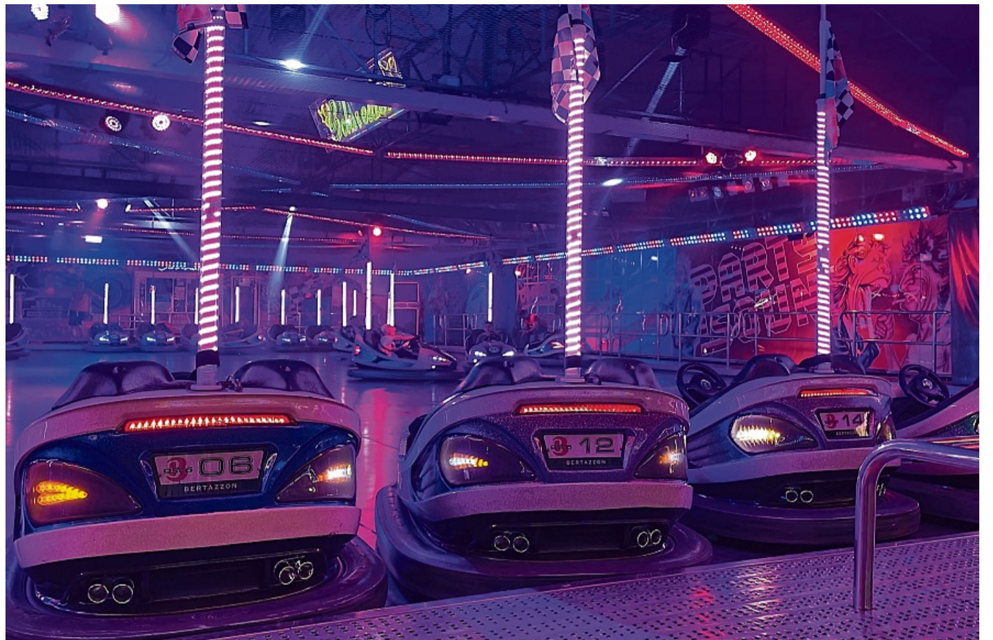
Gegenüber der Reithalle: In diesem Jahr wird es nur einen Autoscooter auf dem Viehmarkt geben.

Auf dem Plateau des Königsbergs sorgt der historische Jahr-