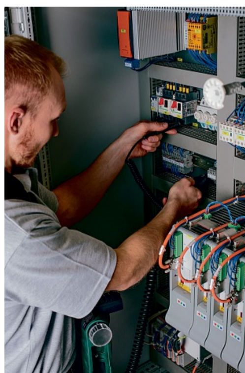
Ein E-Check gibt Sicherheit und spart Kosten.

Nach VDE-Norm sind seit 1. Oktober 1997 auch Wohnungen und Gebäude von der Prüfpflicht der elektrischen Anlagen nicht mehr ausgeschlossen. Die ausschließlich von Fachbetrieben der Elektro-Innung Waldeck-Frankenberg vergebene E-CHECK-Plakette dokumentiert, dass zum Zeitpunkt der Überprüfung und gegebenenfalls erfolgter Instandsetzung keine Sicherheitsmängel an den elektrischen Anla-