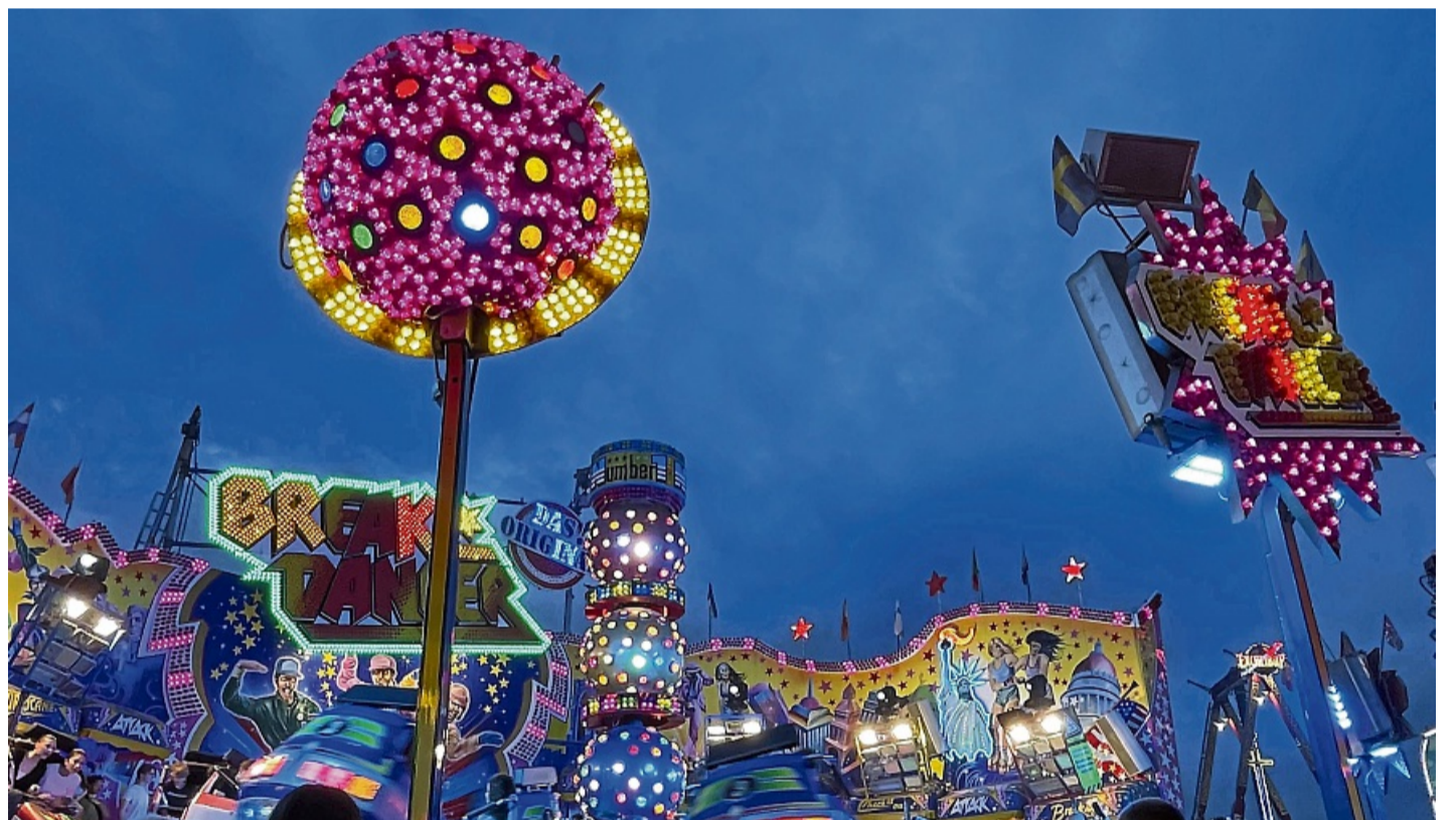
Im August wird der große Bruder des Breakdancers kommen.