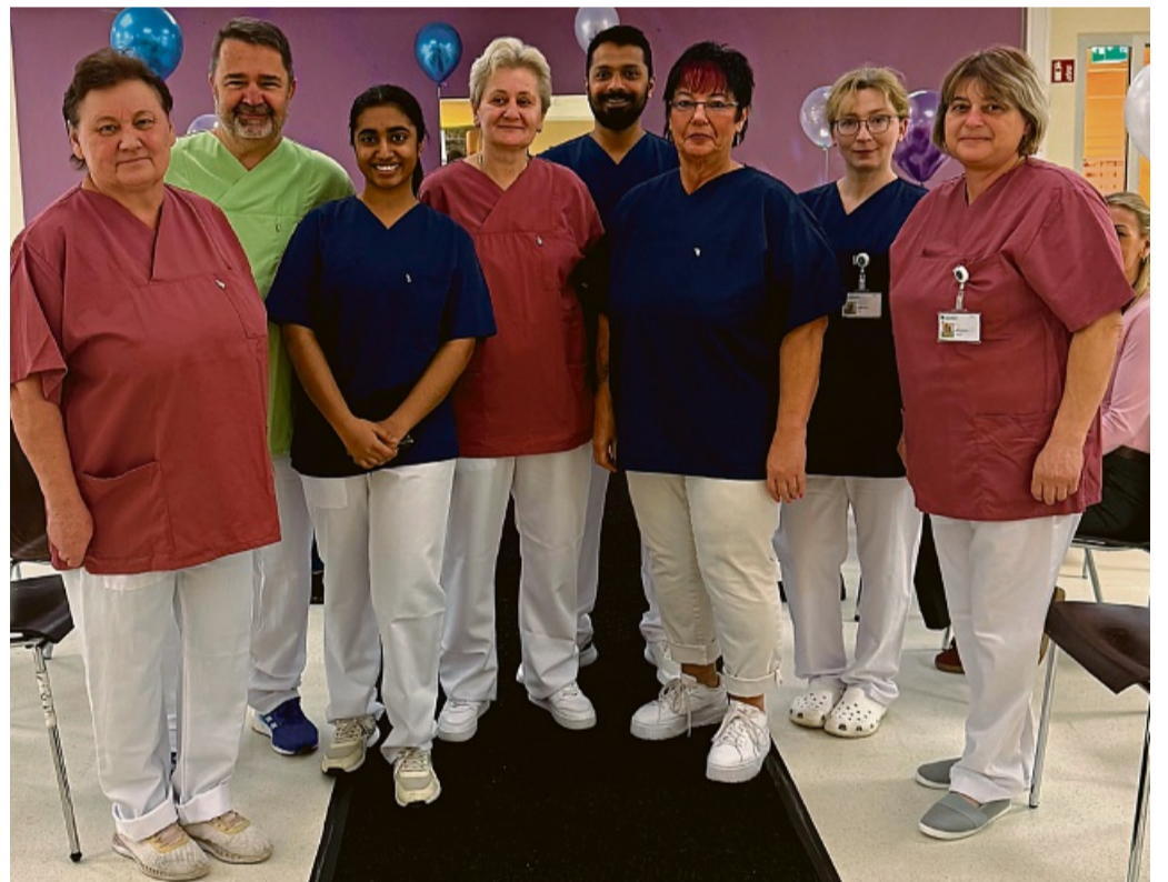
Ob Marineblau, Himbeerroth und Apfelgrün: Die neue Dienstkleidung ist nicht nur komfortabel, sondern auch nachhaltig und modern.

Kessler erläuterte derweil den Hintergrund des Projekts: „Nach