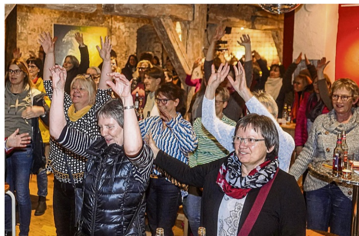
Rudelsingen in der Kulturscheune: Kollektives Singen unter der Discokugel.

Tickets gibt es online und direkt in der Touristinfo Fritzlär, aktuelle Infos zum Programm auf der Webseite der Kulturscheune: kulturscheune-fritzlär.de MAJA YÜCE