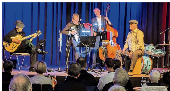
Den Auftakt macht das Ensemble jens'n'frens am Samstag in der Kulturscheune.