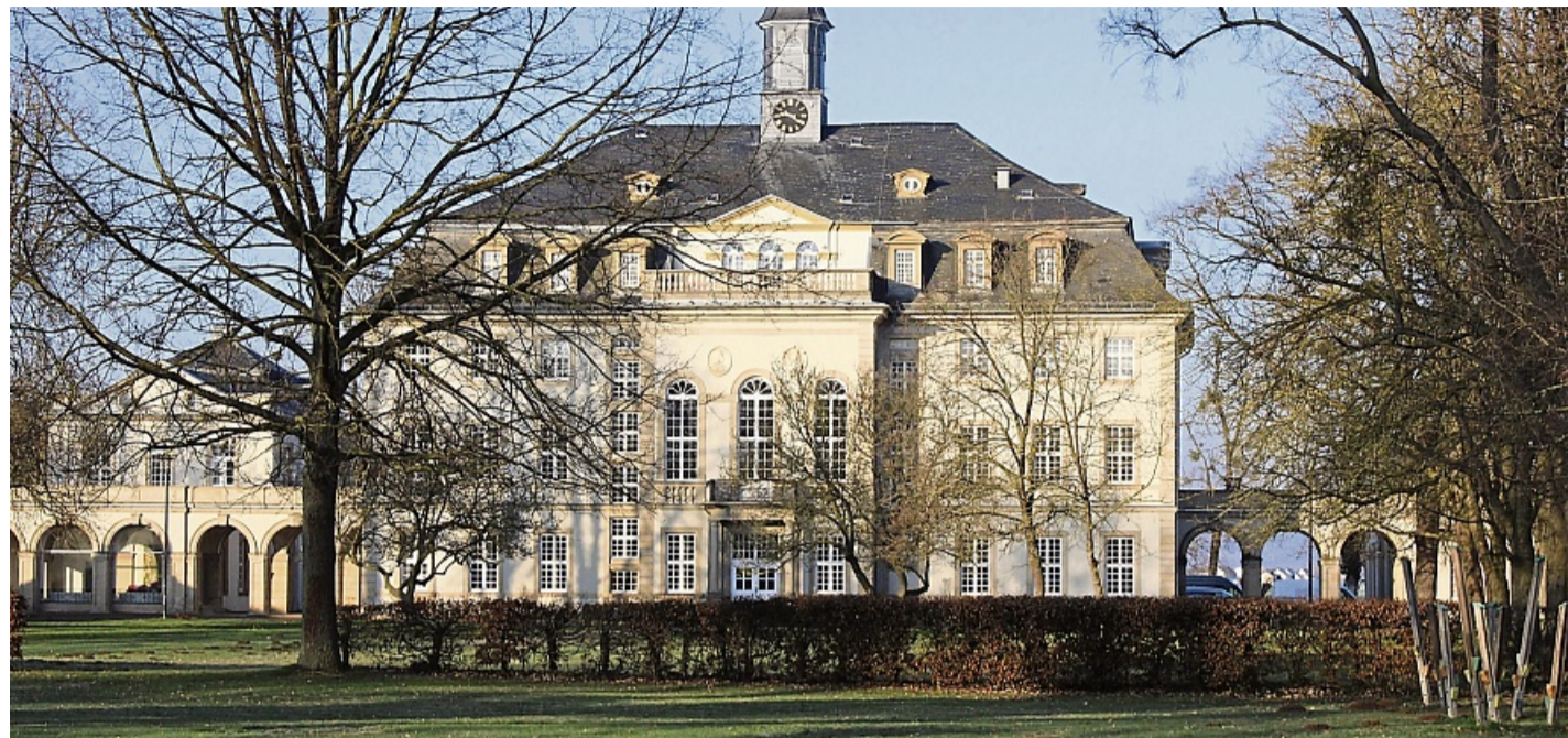
Auch die Gemeinde Wabern hat sich beworben: Das ehemalige Jagdschloss „Karlschloß“ ist einer von drei möglichen Standorten für das Projekt Fachkräfte-Campus. Derzeit gibt es für diesen Standort einen Vorsprung.