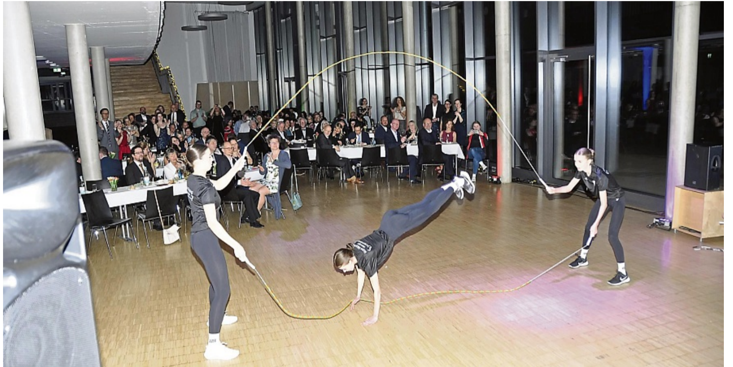
Die Rope Skipperinnen der MT zeigten artistisches Seilspringen.