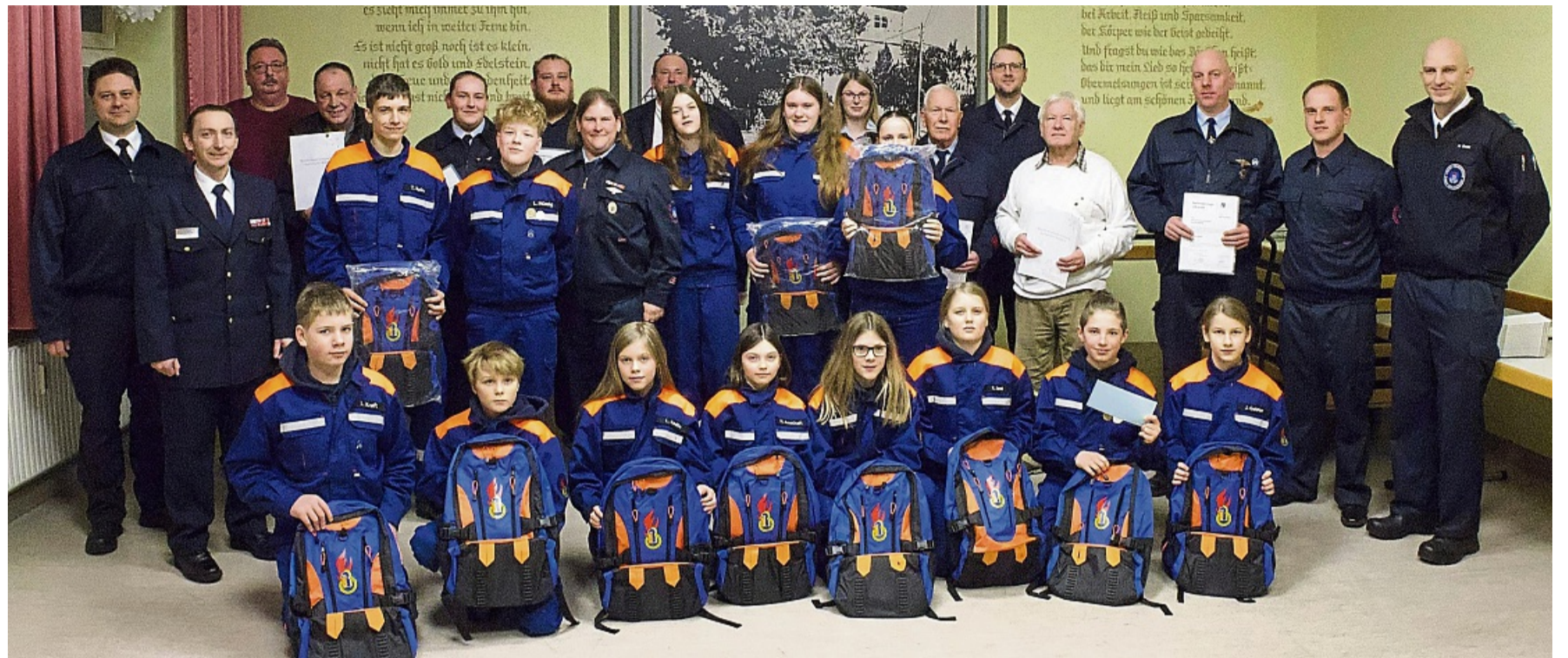
Großes Engagement: Über 4240 Stunden ehrenamtlicher Arbeit kamen bei der Obermelsunger Feuerwehr zusammen.

Ein besonderes Augenmerk galt laut Feuerwehr erneut der Nachwuchsförderung: „Die Jugendfeuerwehr mit 16 Jugendlichen erlebte 2025 einige Höhepunkte: Beim Kreiszeltlager in Rhünda erreichten sie den ersten Platz und qualifizierten sich erstmals seit 14 Jahren für den Großkreisentscheid.“ Auch