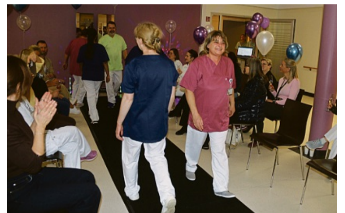
Unter tosendem Applaus der Kollegen wurde die neue „Kollektion“ auf dem Laufsteg präsentiert.

„Das Material der neuen Kasacks und Hosen nennt sich Tencel – es ist atmungsaktiv, besitzt einen höheren Tragekomfort und ist nachhaltiger“, betonte er und ergänzte, dass es selbstverständlich auch die hohen Hygieneanforderungen für den Einsatz im Klinikbereich erfülle. „Weiterhin wurde die Farbpalette reduziert, durch die Straffung des Sortiments ist der Umlauf leichter und wir kommen schneller an aufbereitete Wäsche“, beschreibt Kessler das neue Konzept, „so wird es in Zukunft beispielsweise keine graue Dienstkleidung mehr geben.“ Die Beschaffung und die Reinigung erfolgen wie bisher über die Firma Ullmer, einem erfahrenen Textilmanager mit Fullservice.