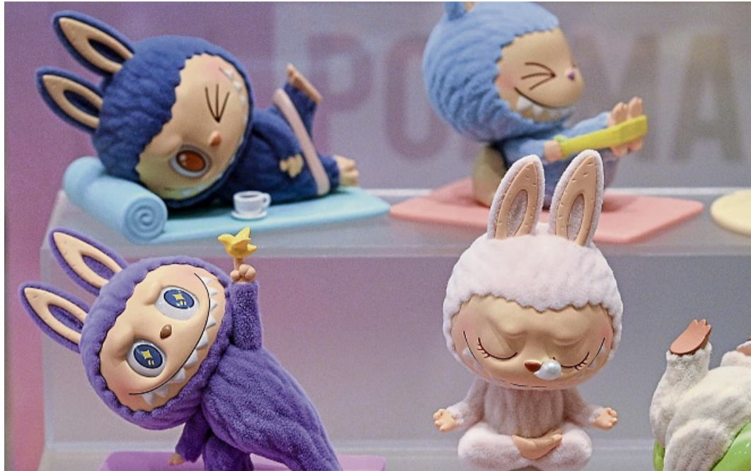
Chinesische Plüschfiguren mit breitem Grinsen wurden zu begehrten Sammlerstücken bei Kindern.

Manche Kinder argumentieren in solchen Situationen auch mit dem Gefühl „Ich habe ja fast nichts“. Dann können Eltern dem Kind deutlich machen, was es schon alles hat - denn das verlieren Kinder oftmals aus dem Blick. Man kann gemeinsam bereits vorhande-