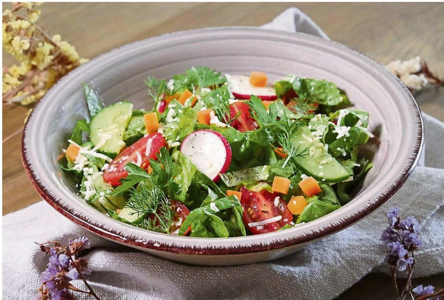
Walnussöl eignet sich nur für die kalte Küche und passt gut, um Salatdressings oder Dips mit seiner nussigen und leicht fruchtigen Note zu verfeinern.

Kostengünstiger und geschmacklich neutral sind raffinierte Öle. Dafür werden die Ölfrüchte erhitzt und zusätzlich verarbeitet. Die fertigen Öle eignen sich besonders gut zum Frittieren oder Braten bei hohen Temperaturen und sind länger haltbar, so die Verbraucherzentrale. Allerdings gehen laut der Experten beim Raffinieren auch Vitamine, be-