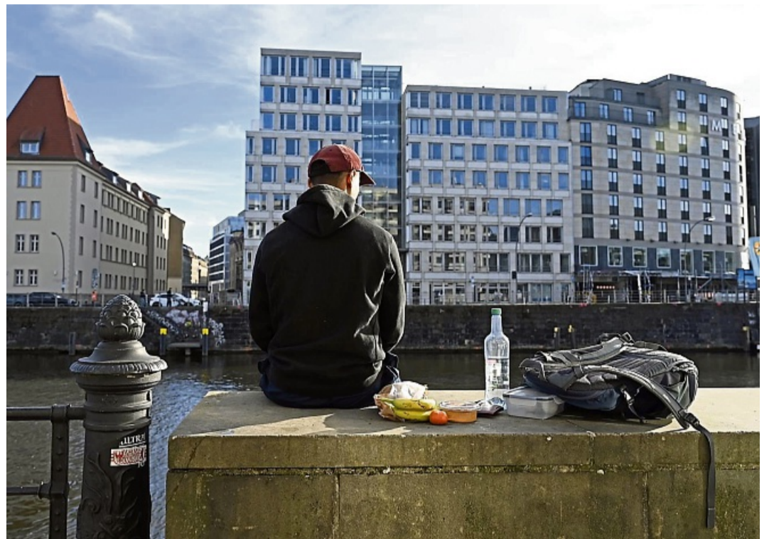
Glück als Nebenprodukt: Wohlbefinden entsteht oft durch kleine Momente wie Spaziergänge, Gespräche oder neue Erfahrungen, ohne Zwang oder Erwartungen.

Wer sich im Frühling nicht automatisch euphorisch fühlt, müsse sich deshalb keine Sorgen machen. Emotionen verlaufen individuell und nicht immer synchron mit der Jahreszeit. Auch ruhige, unspektakuläre Tage können Teil eines gesunden emotionalen Gleichgewichts sein. „Glück ist nicht immer spektakulär“, sagt Thiele. Manchmal zeige es sich eher in kleinen Momenten – etwa bei einem Spaziergang, einem Gespräch oder einer kurzen Pause. Statt sich von Erwartungen leiten zu lassen, könne es deshalb hilfreicher sein, neugierig zu bleiben und bewusst kleine positive Erfahrungen wahrzunehmen. So entstehe Wohlbefinden oft ganz nebenbei – ganz ohne Druck. dpa