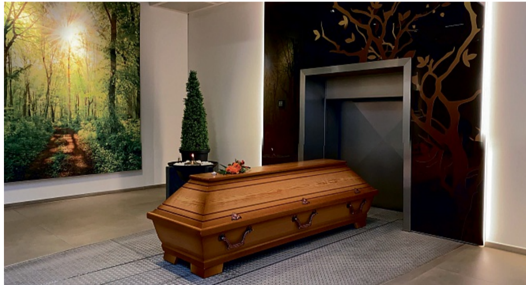
Im Krematorium kann am Sarg Abschied genommen werden.

Eine der häufigsten Fragen betrifft die Feststellung des Todes vor der Einäscherung. Hier besteht ein wichtiger Unterschied zur Erdbestattung: Bei der Feuerbestattung ist eine zweite Leichenschau gesetzlich vorgeschrieben. Diese erfolgt unabhängig von der ersten ärztlichen Todesfeststellung und muss abgeschlossen sein, bevor die Einäscherung über-