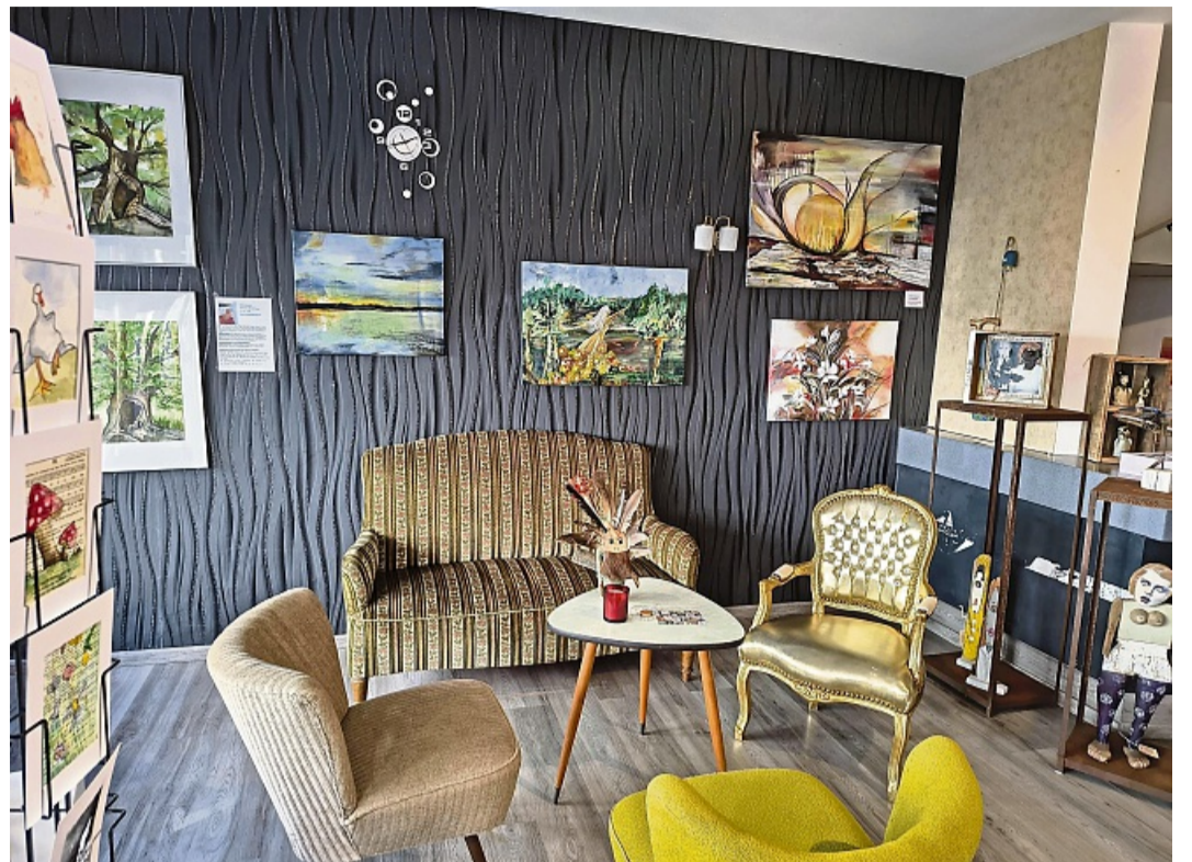
Die „Galerie auf Zeit“ des Wildunger Kunstraums in der Altstadt ist weiterhin freitags am Nachmittag geöffnet.