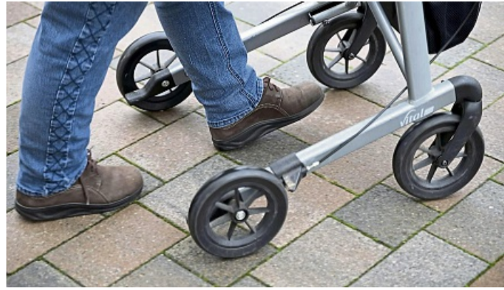
So geht's richtig: Die Füße befinden sich zwischen den Hinterrädern. Heißt: Man geht nicht hinter, sondern im Rollator.

Auf die Körperhaltung achten: Die goldene Regel lautet: möglichst aufrecht. Man sollte sich, wenn man mit Rollator unterwegs ist, also weder noch vorn beugen noch die Schultern hochziehen, erklärt das ZQP. Für diese Haltung dankt auch der Rücken. Für die größtmögliche Stabilität ist wichtig, dass sich die Füße beim Gehen zwischen den Hinterrädern befinden. Anders ausgedrückt: Man geht also nicht hinter, sondern im Rollator. Das gilt übrigens auch, wenn die Strecke