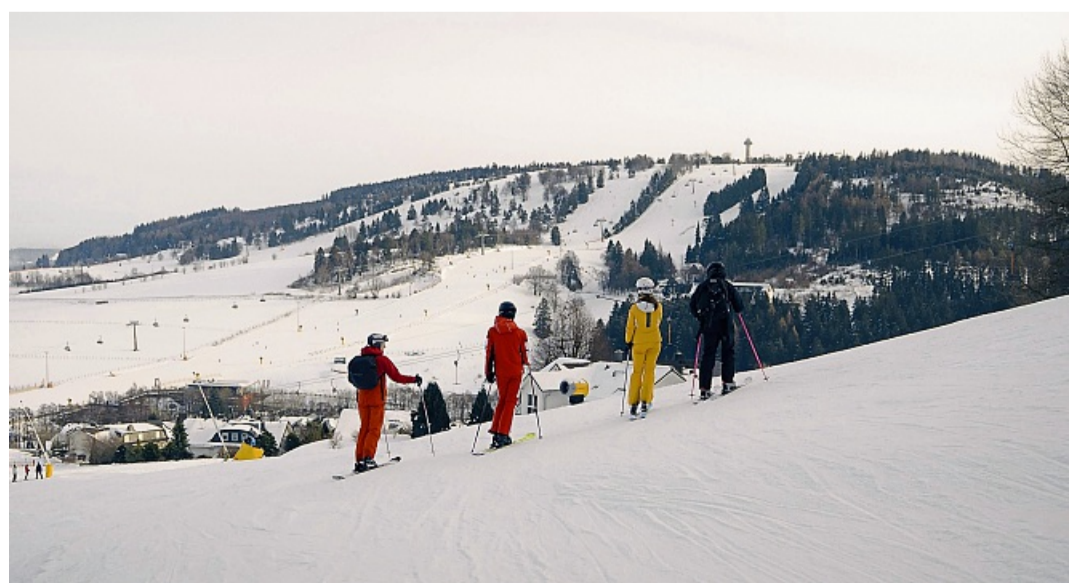
Zufrieden blickt das Skigebiet Willingen auf die Wintersportsaison zurück. Im Bild der Blick vom Sonnenhang auf den Ettelsberg.