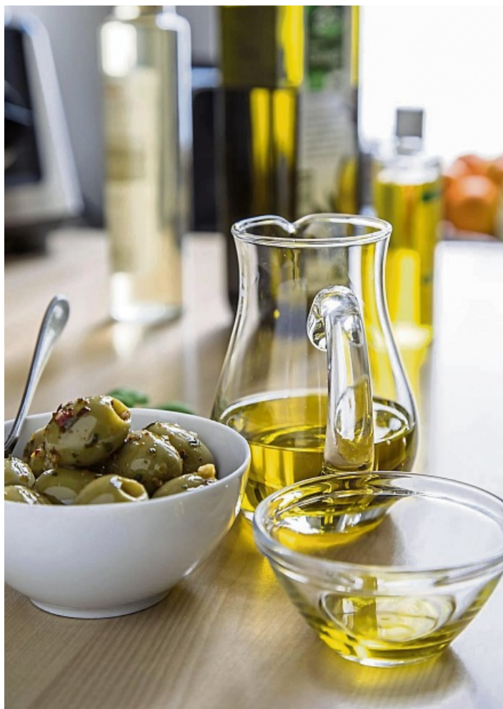
Olivenöl gilt als Multitalent, schmeckt zu Blatt- oder Kartoffelsalat, geschmortem Gemüse, Fleisch oder Antipasti. Ist es kaltgepresst nativ, eignet es sich auch zum Braten und Frittieren bis 175 Grad.

Flechtendorferstr. 4 34497 Korbach Tel. 05631 506310