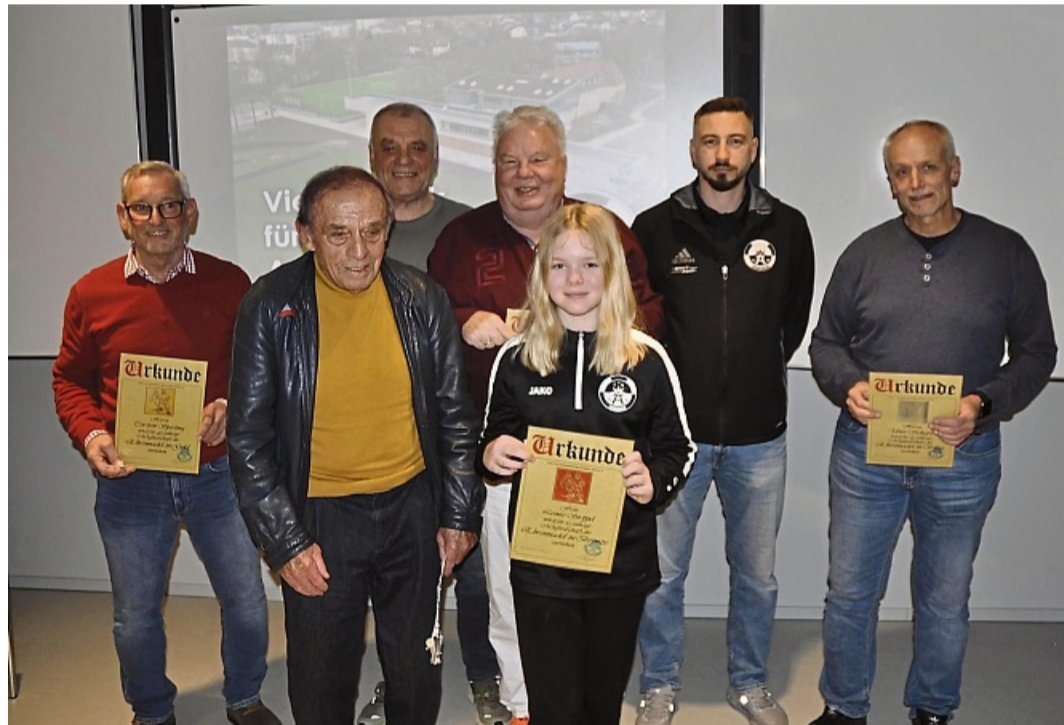
Ehrungen beim TuS Bad Arolsen: Nach 50 Jahren gab es die Ehrenmitgliedschaft, nach zehn Jahren die bronzene Vereinsnadel.