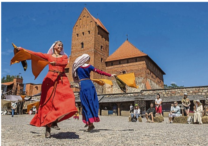
Bräuche des Baltikums: Eine Live-Reisereportage gibt es am 25. März in der Korbacher Stadthalle zu sehen.

Waldeck-Frankenberg – Seit gestern sind die Sammelfahrzeuge in Waldeck-Frankenberg unterwegs, um Sonderabfälle entgegenzunehmen. Bis 17. April besteht die Möglichkeit, Sondermüll einer fachgerechten Entsorgung zuzuführen. Kleinmengen aus Privathaushalten können kostenlos abgegeben werden. Von Unternehmen oder aus dem Verwaltungsbereich wird eine Gebühr von sieben Euro pro Kilogramm erhoben. Altöle werden nicht angenommen, da alle Händler gesetzlich zur Altöl-Rücknahme in Höhe der verkauften Frischölmenge verpflichtet sind. Altmedikamente aus privaten Haushalten werden ohne Verpackungen in kleinen Mengen entgegengenommen. Auch Elektro-Kleingeräte bis zu einem Raumvolumen von 10 Litern können abgegeben werden. Dabei darf keine Kantenlänge 50 Zentimeter überschreiten. Fernsehergeräte und Bildschirme sowie alle Großgeräte – etwa Herde, Waschmaschinen, Trockner, Mikrowellen, Dunstabzugshauben, Bügelmaschinen, Rasenmäher – sind grundsätzlich von der Annahme über die mobile Sammlung ausgeschlossen. Sie können in haushaltsüblichen Mengen kostenlos an den Abfallentsorgungsanlagen des Kreises abgegeben werden. Weitere Auskünfte gibt die Abfallberatung unter Tel. 05631/954-1746 und der Tourenplan ist unter www.landkreis-waldeck-frankenberg.de , Suchbegriff: „Abfallwirtschaft“, verlinkt. red