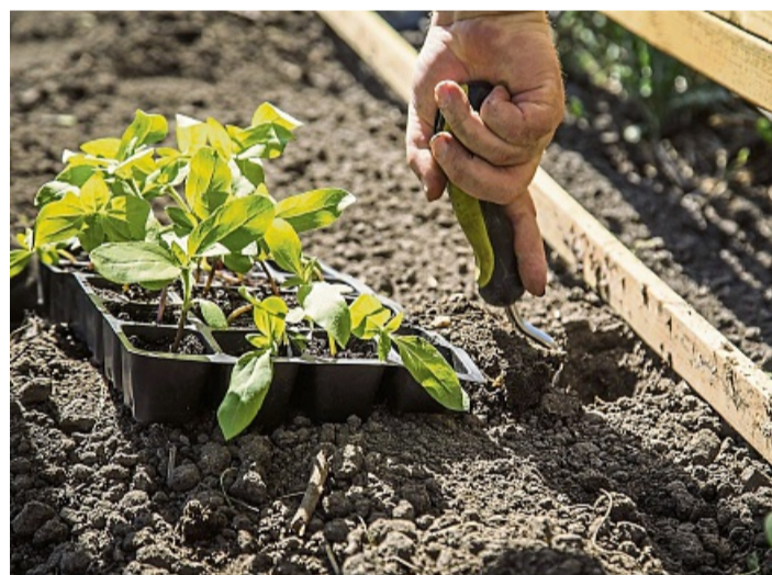
Nach den Eisheiligen Mitte Mai können die selbst gezogenen Pflänzchen ins Beet umziehen.