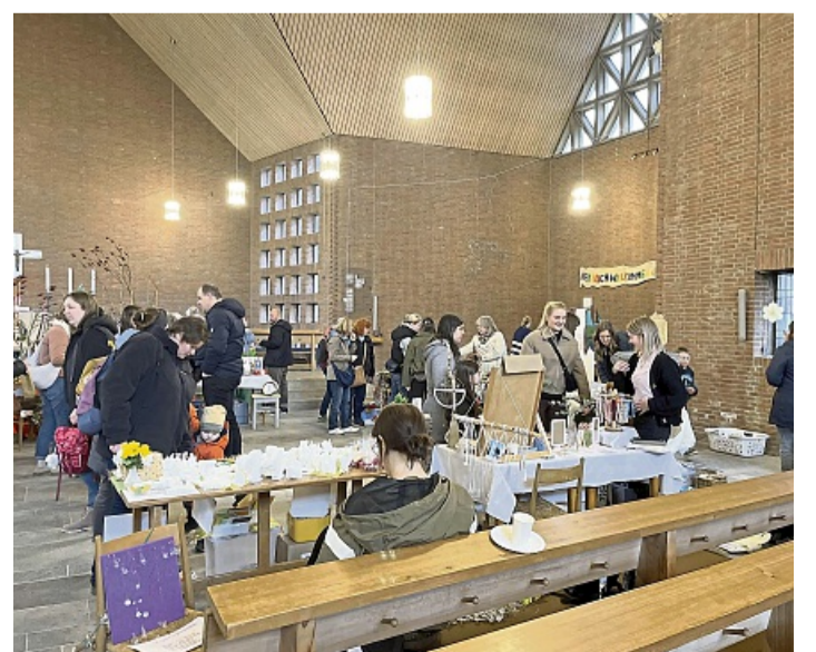
Viele Besucher haben sich den Ostermarkt in der Kreuzkirche nicht entgehen lassen.