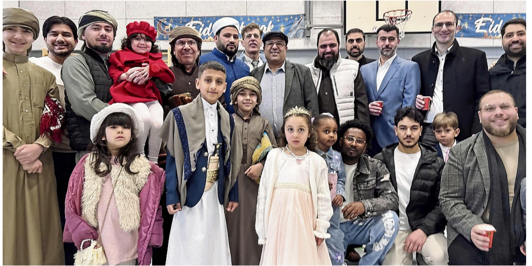
Freudige Stimmung in der Jahnturnhalle: Viele der Gäste haben sich zum Zuckerfest besonders festlich und teils traditionell angezogen.

Den Auftakt bildeten das traditionelle Gebet und die Predigt des Imams. Hunderte Gläubige drängten sich in der kleinen Turnhalle zusammen, ihre Gebetsteppiche dicht an dicht gereiht. „Bitte rückt zusammen und macht Platz für unsere Brüder und Schwestern, die draußen stehen“, bat der Imam mehrfach, doch irgendwann war nichts mehr zu machen. Jeder Quadratzentimeter war mit Männern, Frauen oder einem der vielen anwesenden Kinder gefüllt. Eine größere Gruppe musste das Gebet schließlich draußen verfolgen – der festlichen, fröhlichen Stimmung tat das jedoch keinen Abbruch.