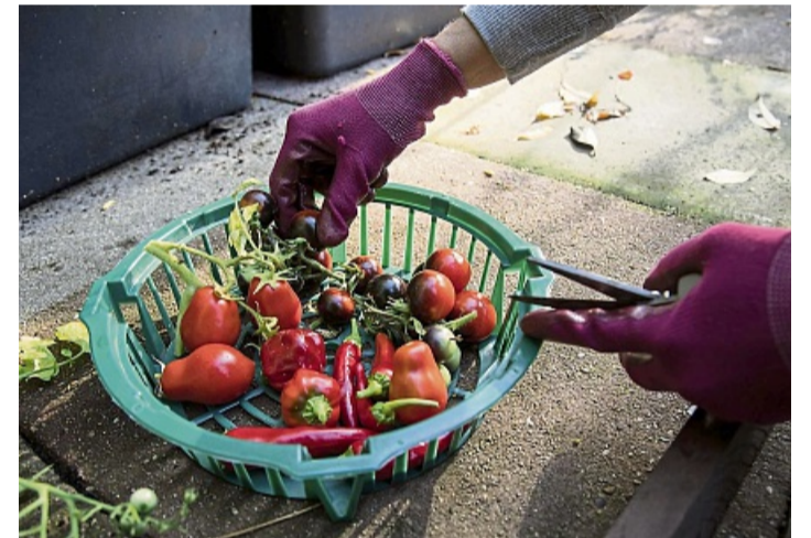
Im Ernteglück: Gut gepflegte Pflanzen liefern frisches Gemüse direkt aus dem Garten.