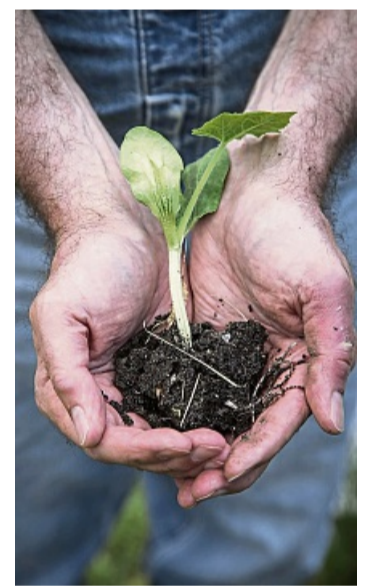
Ist die Erde gut durchwurzelt, sollten die Pflanzen vor dem Auspflanzen umgetopft werden.