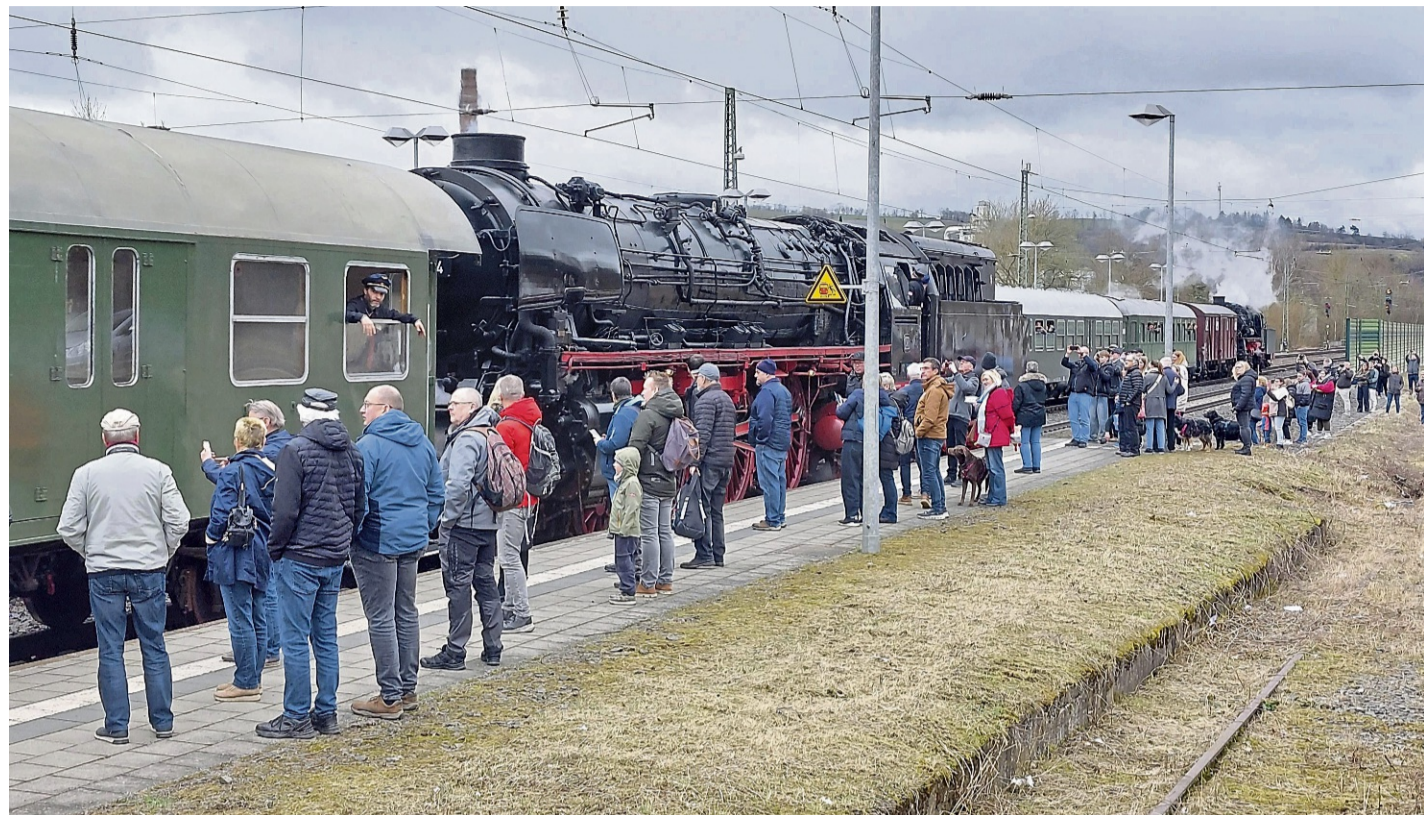
Dampflok in Sontra: Gleich beide historischen Dampflok konnte man auf dem Sontraer Bahnhof sehen.

Sowohl auf dem Bahnhofsvorplatz als auch im Bahnhofsgelände herrschte ein lebendiges und fröhliches Treiben. Die Bahnhofsführungen von Reinhard Ehmer wurden hervor-