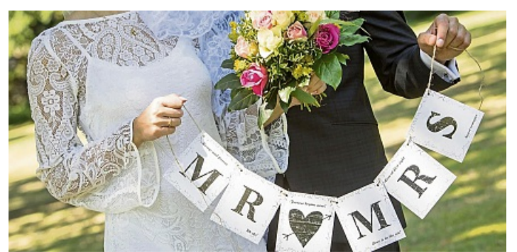
Frisch getraut? Wer einen Ehevertrag haben möchte, sollte mit dessen Planung etwa ein halbes Jahr vor dem großen Tag starten.