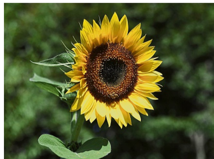
März oder April? Auch wer später sät, kann sich im Sommer über prächtige Blüten freuen.

Für die Reihenansaat bei Gemüse im Freiland empfiehlt