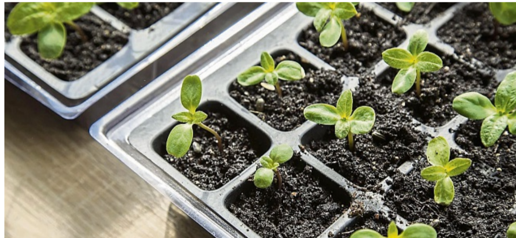
Gesunde Sämlinge: Gleichmäßig feuchte Erde und ausreichend Licht sorgen für kräftiges Wachstum.