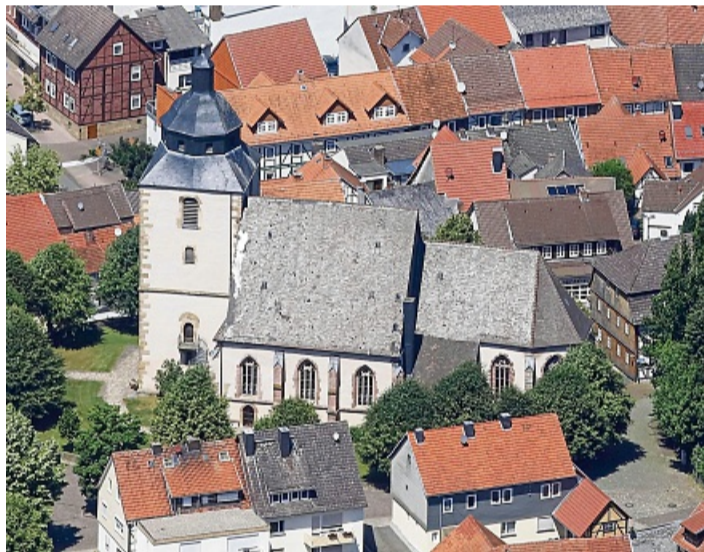
Die evangelische Stadtkirche St. Marien in Sontra.

Die Versammlung endete nach einem gemeinsam eingenommenen Imbiss im gemütlichen Beisammensein in den Räumen des Ortsvereines.