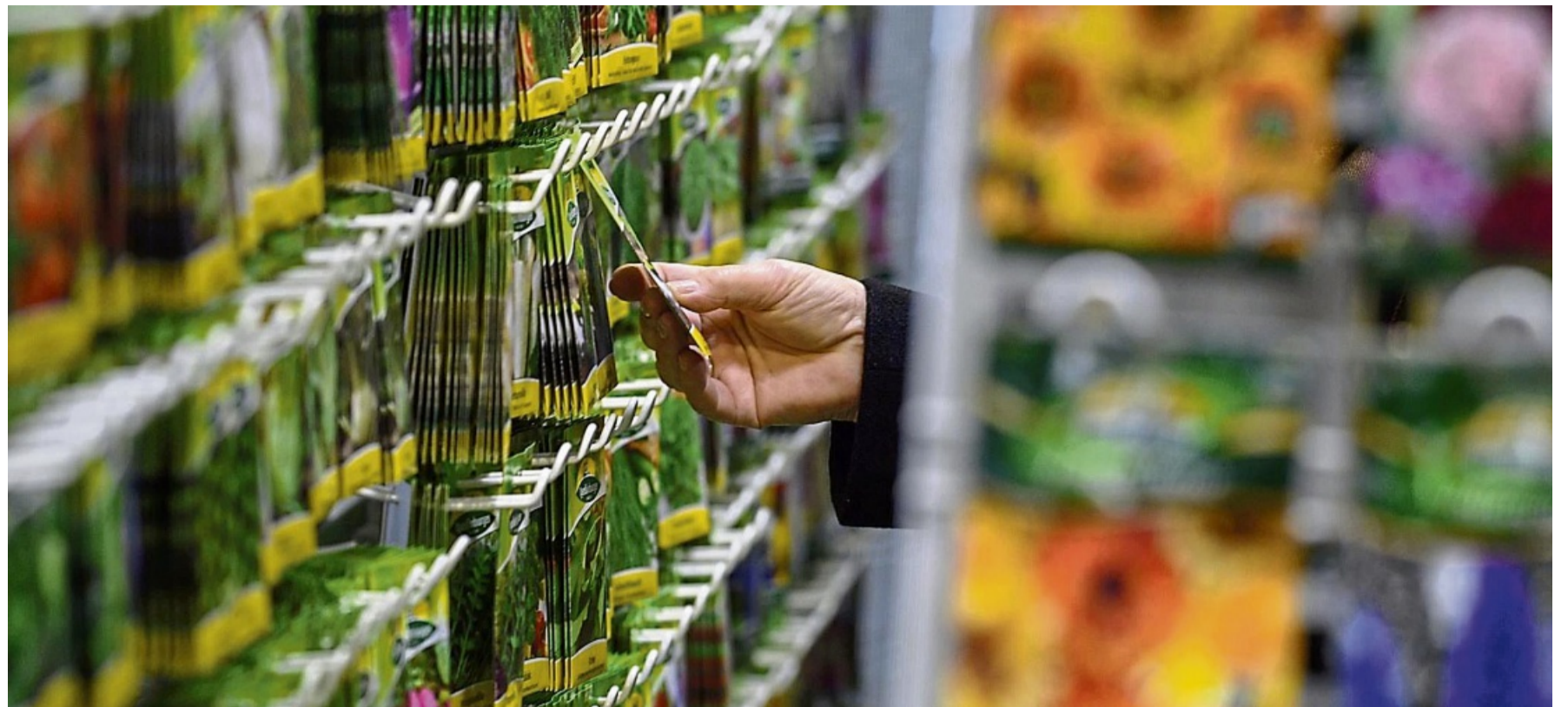
Die Qual der Wahl: Samentütchen verlocken, doch nicht alles passt am Ende in den Garten.

Gut geeignet sind Gefäße und Schalen, die Abzugslöcher für überschüssiges Gießwasser haben. „Besonders gut eignen sich Schalen oder Anzuchtplatten mit einer Abdeckung“, so die Gärtnermeisterin. Das hat den Vorteil, dass die Aussaat vor Austrocknung geschützt ist und das Klima das Wachstum fördert.