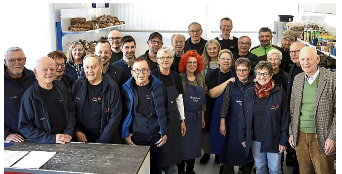
Melsunger Tafel hat neue Räume bezogen: Helfer und Ehrengäste