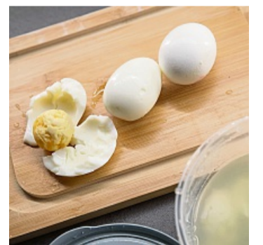
Gemischtes Fazit: Ein Ei ist kaputt, eins komplett geschält, und eins mit völlig intakter Schale.

Und wie sieht's dann aus? – Der Trick funktioniert grundsätz-