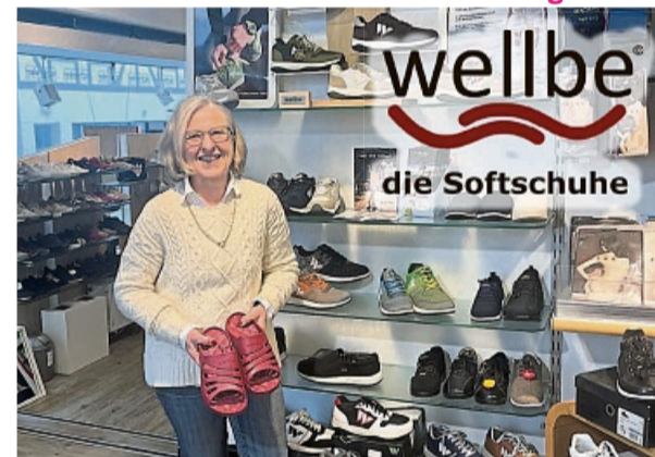
Das Team im Schuhhaus Schreier, Nikolausstraße 2 freut sich auf Sie.

Mit orthopädischen Einlagen perfekt kombinierbar.