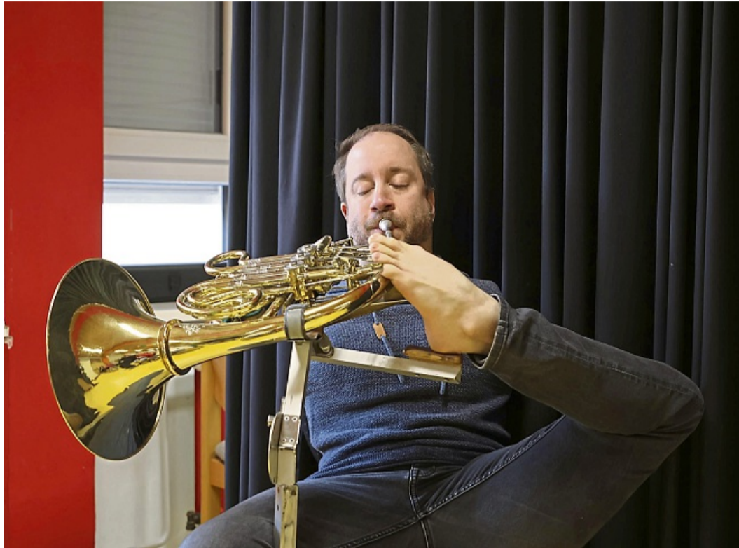
Hornist Felix Klieser

Als Klieser ihnen dann auf ihre Frage sagte, dass er täglich drei bis vier Stunden mit dem Horn übt, waren die Kinder doch sehr erstaunt. Aber er sagte ihnen auch: „Das ist mein Beruf. Wenn ich irgendwo arbeiten ginge, müsste ich vermutlich täglich acht Stunden arbeiten.“ Erstaunt schauten die Schüler zu Klieser, der sein Horn auf einer speziellen Halterung aufgebaut hatte, als er sei-