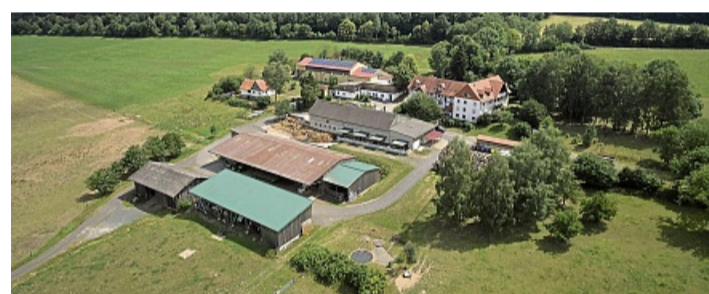
Hier wird investiert: Der Schälbetrieb auf Gut Halbersdorf soll modernisiert werden.

Die Ausgleichsabgabe ist ein gesetzliches Instrument zur Förderung der Teilhabe schwerbehinderter Menschen am Arbeitsleben. Arbeitgeber, die die vorgeschriebene Anzahl von Arbeitsplätzen mit schwerbehinderten Menschen nicht besetzen, müssen für jeden unbesetzten Pflichtarbeitsplatz eine Ausgleichsabgabe entrichten. Die Einnahmen werden für die nachhaltige Förderung von Beschäftigung, beruflicher Teilhabe und Inklusion schwerbehinderter Menschen eingesetzt. bkz