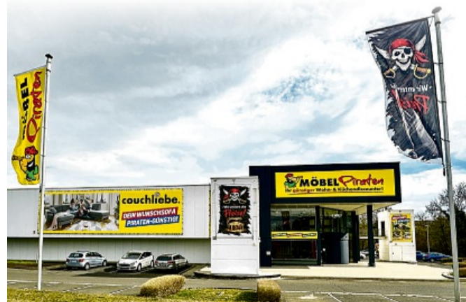
Die „Besatzung der Homberger MÖBELPIRATEN“ steht in den Startlöchern und freut sich mit Piraten-Attraktionen für die ganze Familie auf Sie. Wir sehen uns an Bord!

Warum sie ihre Beute zu Piratenpreisen anbieten können? Weil sie ihre Ware immer in riesigen Mengen „kapern“ und außerdem viel weniger Kosten für Mieten, Werbung usw. haben, als „normale“ Möbelhäuser. Für ihre Kunden ergattern sie außerdem immer auch Sonderposten und zahlreiche Schnäppchen-Artikel, mit denen sie ihr reguläres Sortiment ergänzen. All das steht im Abholmarkt bereit und wartet auf den nächsten Beutezug unserer Kunden. Ein Besuch „an Bord“ wird so immer zur Schatz-Suche für alle Landratten, die zusätzlich noch die MÖBELPIRATEN-Tiefpreisgarantie und ihre günstigen Finanzierungsangebote zu schätzen wissen.