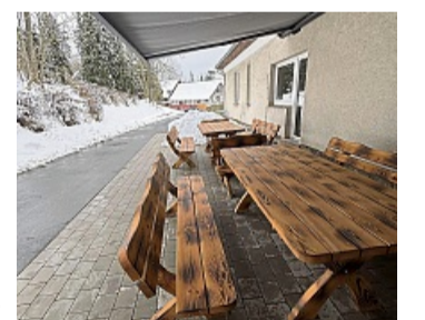
Lädt zum Verweilen ein: Vor dem Dorfgemeinschaftshaus werden künftig Bänke und Tische stehen. Eine Markise bietet Schutz vor der Sonne.

Herlefeld hat mit seinen 180 Einwohnern ein sehr aktives Vereinsleben. Es gibt die Dorfgemeinschaft, den Jugendclub,