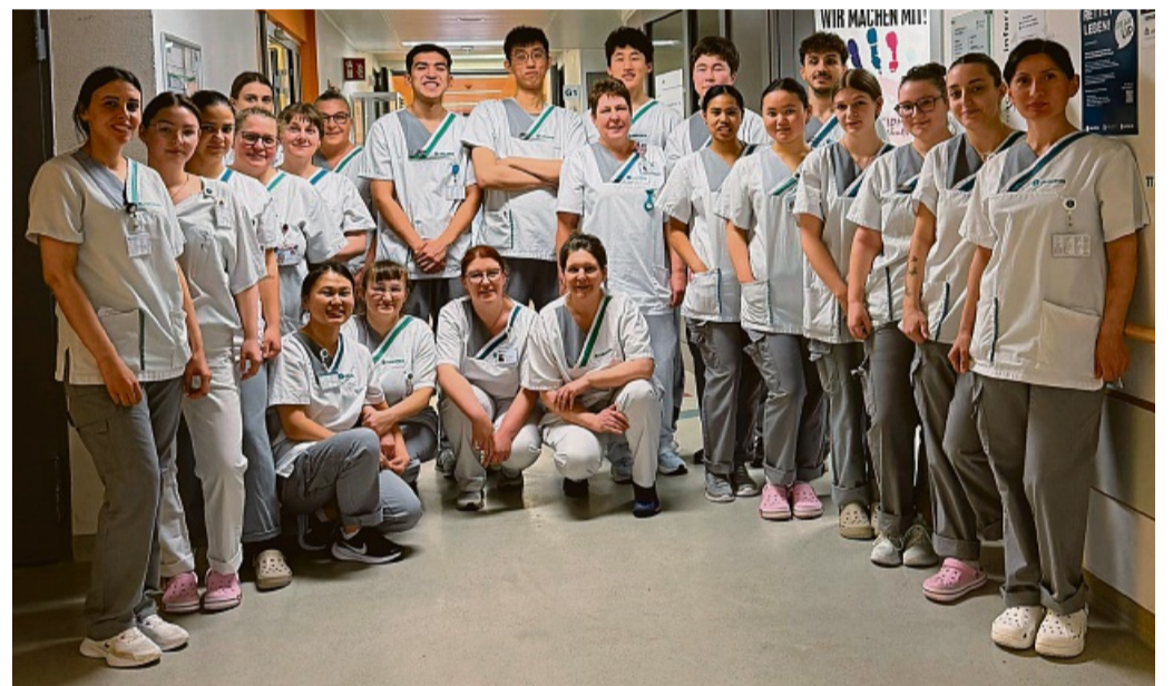
Der Oberkurs, Lehrkräfte des Bildungszentrums, Praxisanleiter sowie die Pflegekräfte der Station ziehen eine positive Bilanz des Projekts „Auszubildende leiten eine Station“.

Schwalmstadt. Die generalistische Pflegeausbildung dauert in der Regel drei Jahre – während dieser Zeit durchlaufen die Auszubildenden sowohl theoretischen Unterricht als auch praktische Unterweisungen. Vor über 20 Jahren rief man bei Asklepios das Projekt „Schüler leiten eine Station“ ins Leben, um das Gelernte im realen Alltag umzusetzen. Etwa ein halbes Jahr vor ihrer Abschlussprüfung übernehmen die Auszubildenden seither für drei Wochen die Organisation einer Pflegestation in eigener Verantwortung.