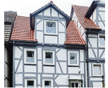
Auch Fachwerkhäuser sind bei uns in guten Händen.