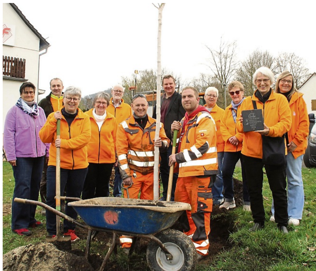
Freude über einen Ginkgo-Baum: Weil die Wurzeln des Hospizdienstes in Felsberg und Melsungen waren, wurden Bäume gespendet: Eine Elsbeere für Melsungen und ein Ginkgo für Gensungen. Unser Bild zeigt die Teilnehmer der Pflanzaktion an der Karthäuser Straße in Gensungen.