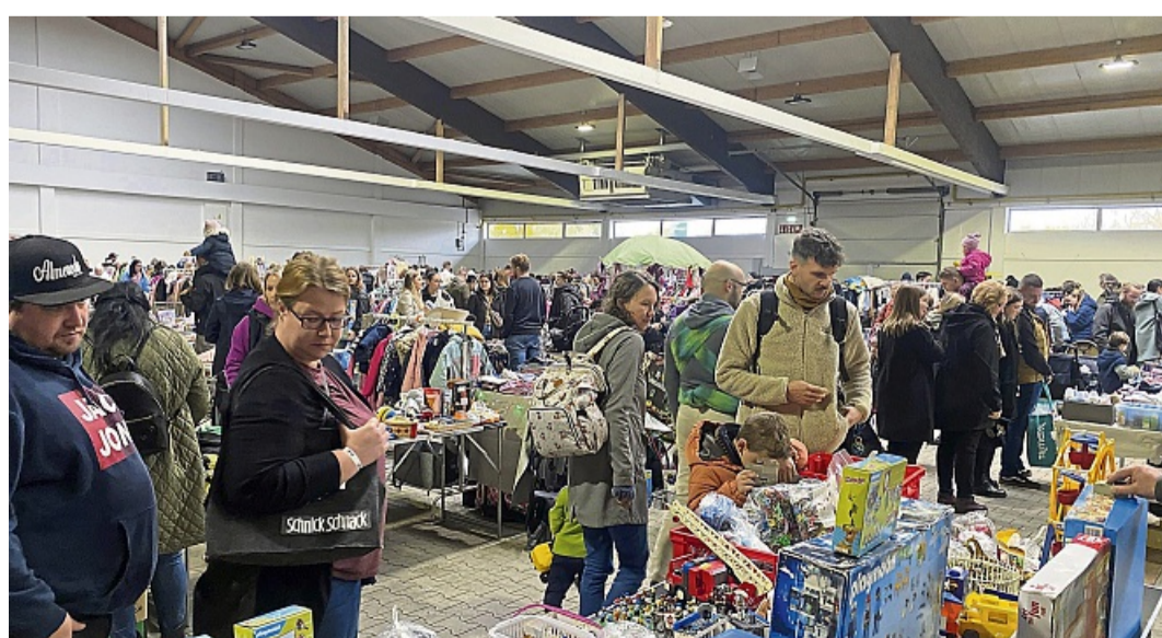
Auf dem Kinderbasar werden Artikel allerlei rund um Spielzeug, Kleidung, Gesellschaftsspiele und weitere Bedarfsartikel für Kinder und Babys angeboten.

Erwachsene zahlen 3€ Eintritt und für Kinder bis 12 Jahren ist der Eintritt frei. Für mehr Informationen und falls man als Aussteller aktiv sein möchte, bitte die jeweiligen Internetseiten besuchen. Jeder kann mitmachen! www.kinderbasar-kassel.de und www.maedelsflohmmarkt-kassel.de oder unter der Telefonnummer 0172-682 66 60.