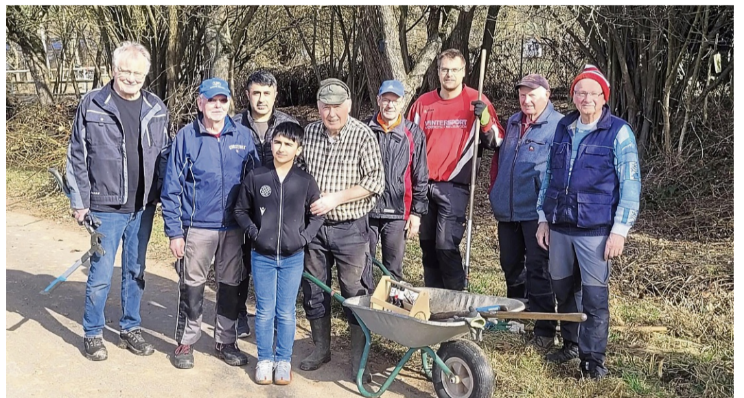
Auebach von Wildwuchs befreit.

am Auebach sehr gefreut“, heißt es aus der Gruppe. „Nun finden Kinder aus dem Umfeld wieder eine natürliche, gefährlose Gelegenheit zum Spielen.“