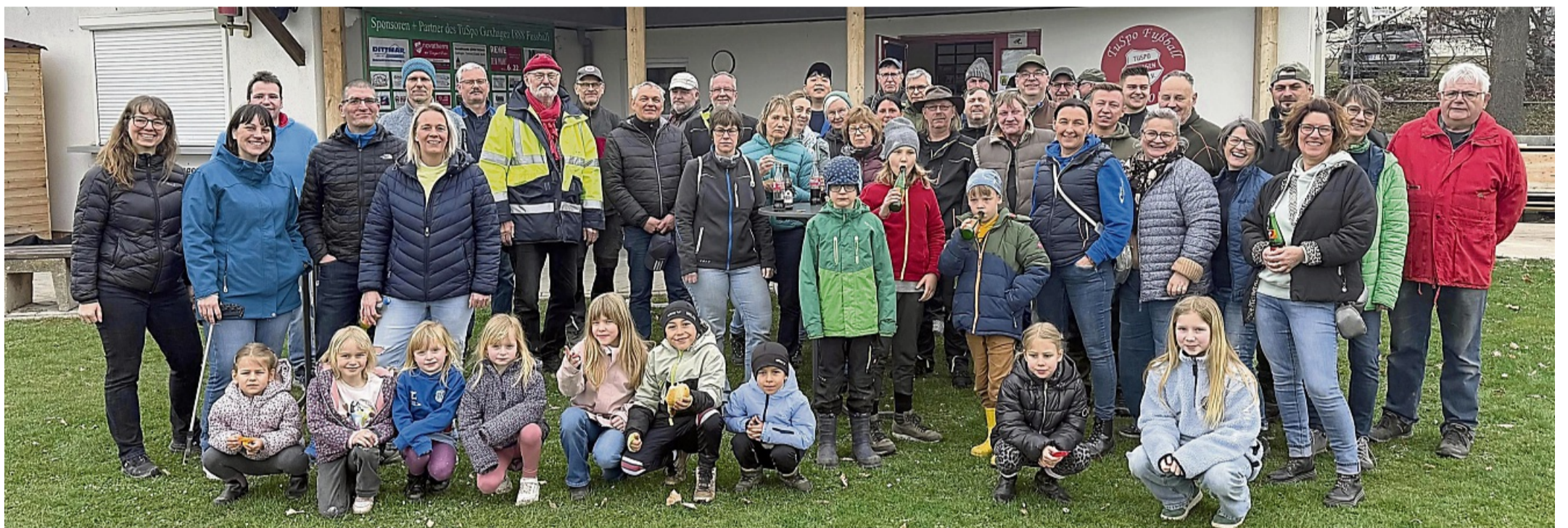
Sie waren fleißig: Beim Umwelttag packten viele Guxhagener mit an.