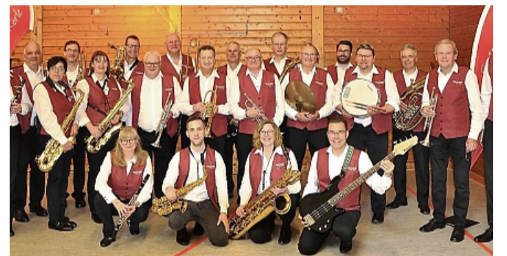
Das Orchester Körle lädt zu seinem traditionellen Frühjahrskonzert ein.