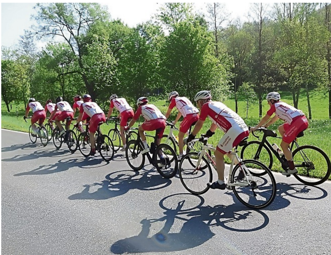
Saison beginnt: Die MT-Jedermann-Radsport bietet die Fahrt in den Frühling an.