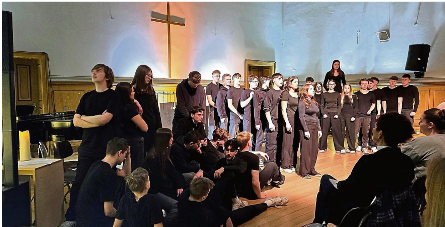
Eine Synode mit Themen der Jugend: Schüler der THS in Homberg zeigten ein szenisches Theaterstück.

Wohnungskonflikt, der in einer Zwangsäumung eskalierte. Dahinter stand eine Botschaft für Gerechtigkeit: „Warum hat ein Mensch mit mehr Geld als ich, ein Recht auf Wohnen?“ Unter dem Aspekt „Ankunft ohne Annahme“ stand die problematische medizinische Versorgung. Das veränderte Stadtbild wurde in einem Zeitsprung aufgezeigt: „Was sind Döner? Wo sind denn die vielen bunten Marktstände, Schmiede und Schneider?“ Dass keine Bildungsgerechtigkeit bestehe, wurde anhand von zwei Biografien klar. Der Wettstreit, im Alltag allgegenwärtig, bekam ein Gesicht: Fünf Figuren standen für verschiedene Persönlichkeiten und soziale Positionen. „Ich bin einsam“ – in der Synode 2026 wird durch das unerwartete Erscheinen von Luther ein Gespräch über Einsamkeit entfacht. Ein Gefühl vieler Menschen, welches in der Gesellschaft nicht ernst genommen werde. „Meine Damen und Herren, werde Gemeinde“, erklange es zum Abschluss, „wie aller Welt zweifellos bewusst sein dürfte, ist H der wahrhaftigste aller Töne – H ist der Ton der Hoffnung.“ Im gemeinsamen Kanon mit „Bruder Jakob“, gefolgt von frenetischem Applaus, endete ein Abend voller Eindrücke, die nachklangen. SILVIA KLEPS