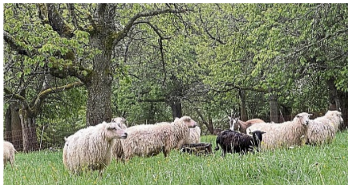
Auf Abstand, aber aufmerksam: Die ostpreussischen Skudden beobachten ihre Besucher aus sicherer Entfernung.