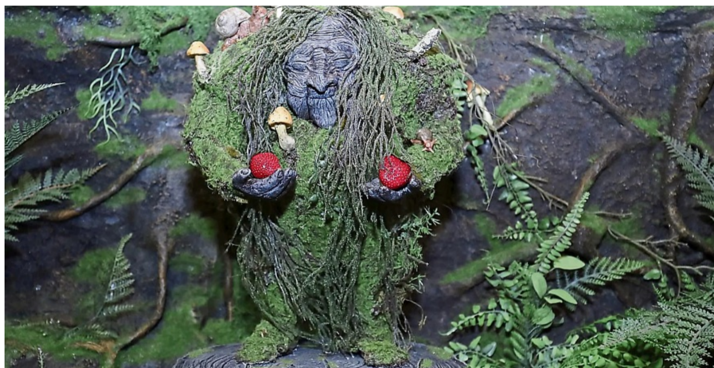
Moosweiblein sind Waldgeister, die mit Kräuterkunde, dem Heilen und Auslösen von Krankheiten verbunden sind.

Im Mittelpunkt der Ausstellung stehen lebensgroße und detailreiche Nachbildungen von Fabelwesen aus der Märchen- und Sagenwelt. Nachdem