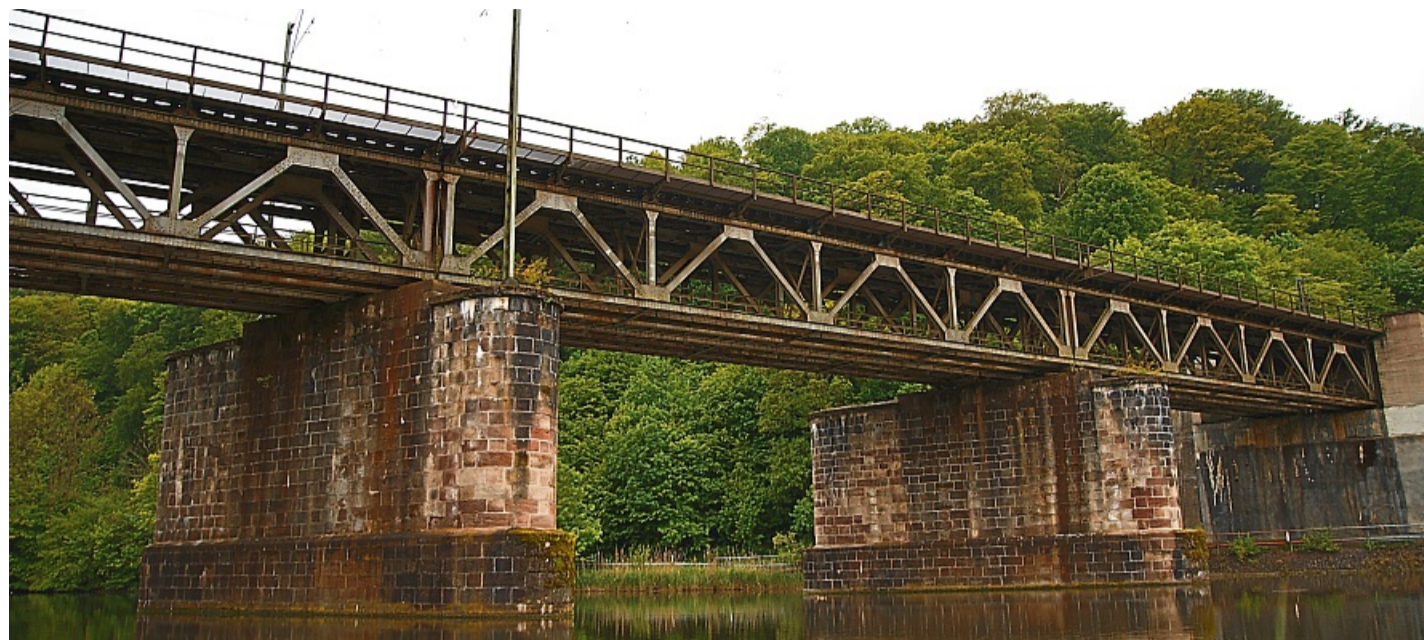
Schwimmen verboten: 100 Meter ober- und unterhalb von Brücken ist das Baden und Schwimmen nicht erlaubt. Hier die Eisenbahnbrücke über die Werra zwischen Hedemünden und Laubach.