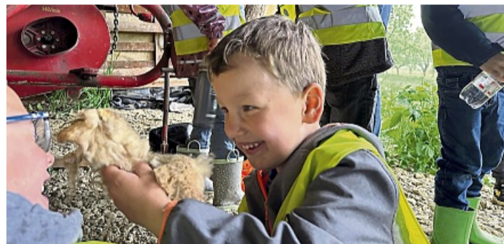
Lernen mit allen Sinnen: Die Kinder erfahren auch, wie Lebensmittel und Materialien entstehen.