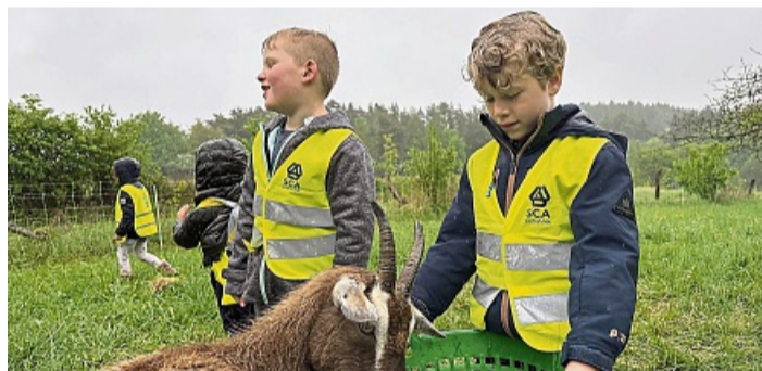
Mit Warnwesten, Möhren und vielen Fragen unterwegs: 18 Kinder erkunden den Schüsterchens Lernbauernhof.