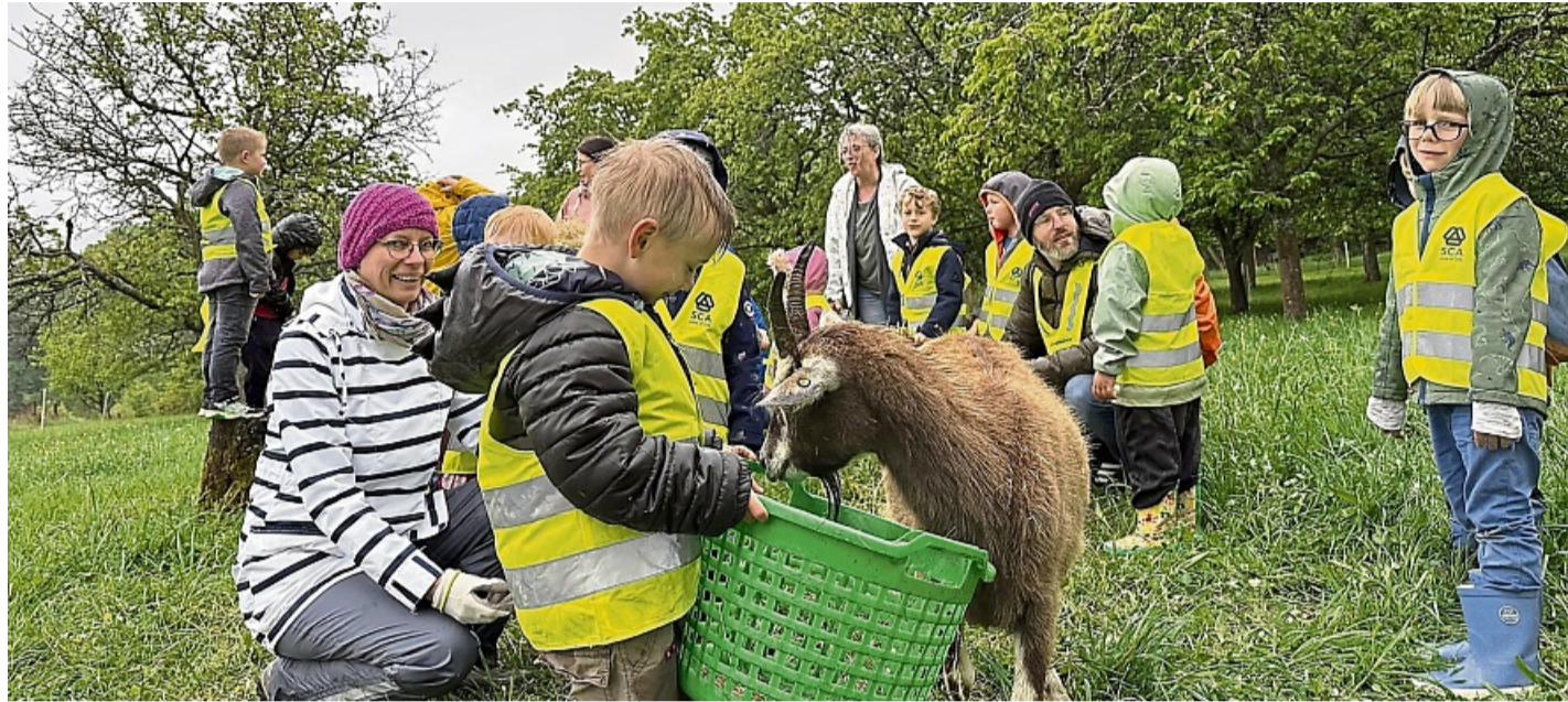
Füttern erlaubt: Mit Heu und viel Aufmerksamkeit nähern sich die Kinder den alten Nutztierarten.

Für die Kinder wird genau das spannend. Sie beobachten auf-