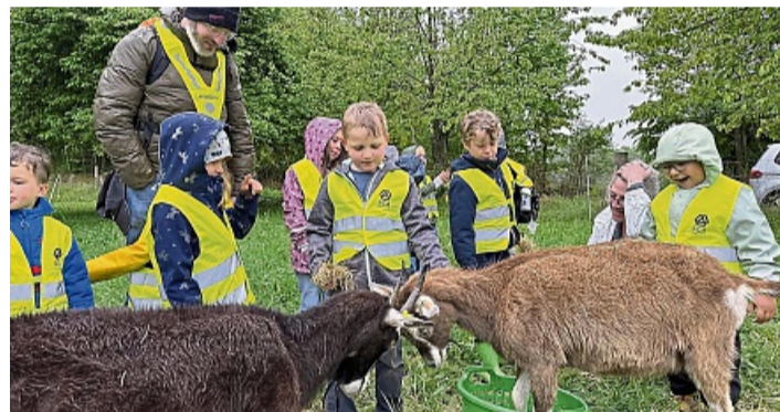
Füttern erlaubt: Mit Heu und viel Aufmerksamkeit nähern sich die Kinder den alten Nutztierarten.