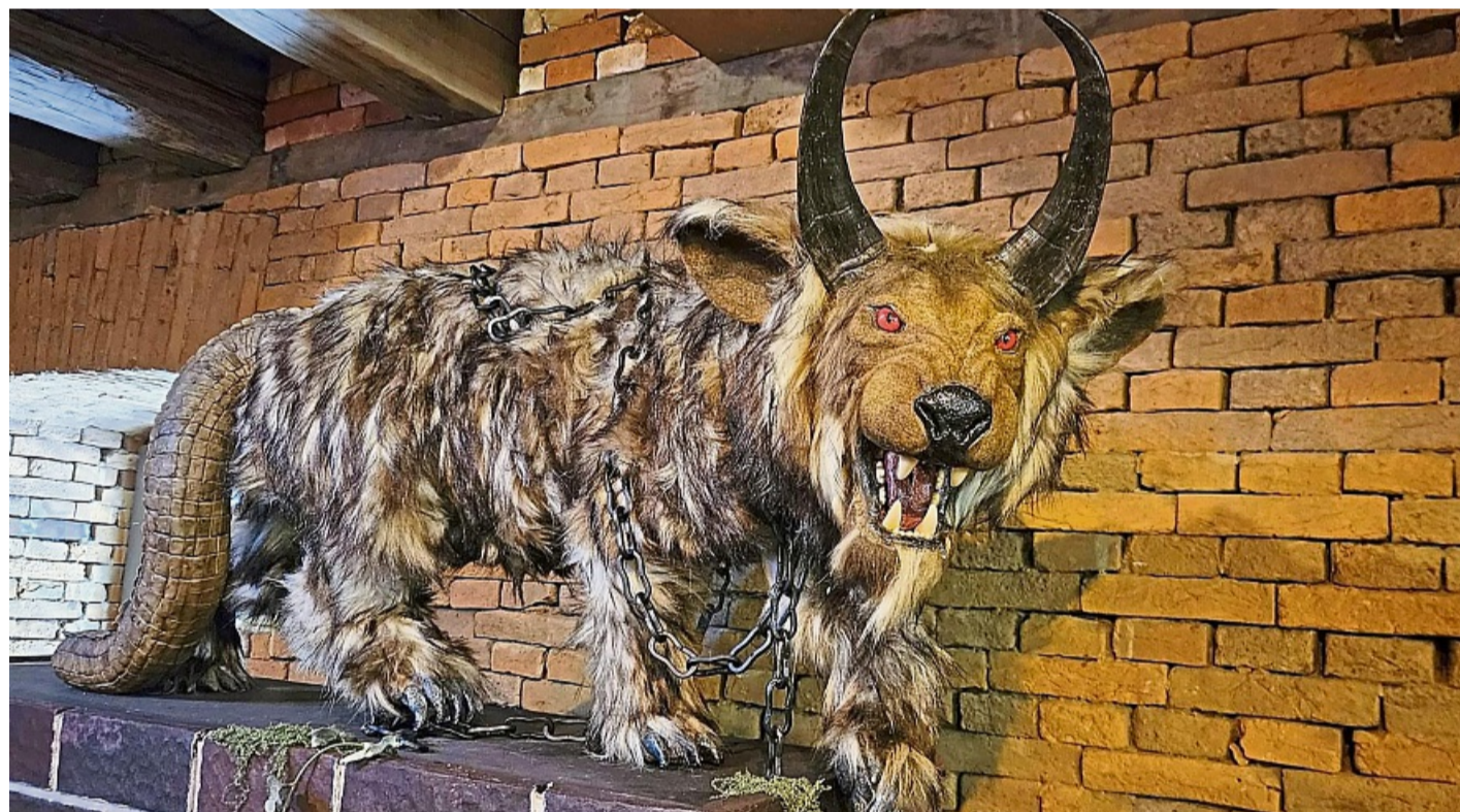
Der Bahkauv ist auf der Pirsch im Packhof in Hann. Münden. Das Fabelwesen soll an Brunnen und Quellen unterwegs gewesen sein.