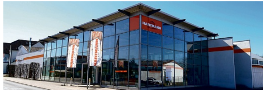
über 5.000 qm Ausstellungsfläche

Kein Wunder also, dass man sich in Eschwege für den Ansturm der Kunden gewappnet hat. Wir müssen unseren kompletten Warenbestand in Millionenhöhe binnen kürzester Zeit restlos verwerten, hört man von der Geschäftsleitung und das ist nur mit gnadenlosen Preisnachlässen zu schaffen. Rücksicht auf Verluste kann da nicht genommen werden – ganz zum Vorteil der Kunden. Wer zuerst kommt macht natürlich die besten Schnäppchen.