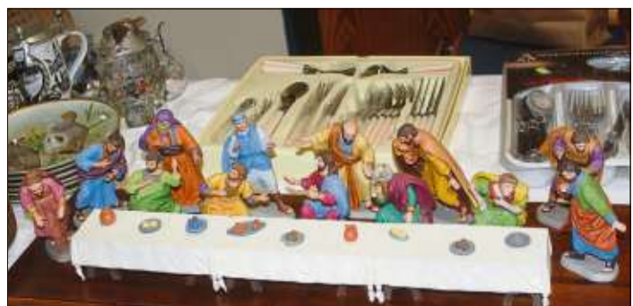
Aus einer Haushaltsauflösung stammt die Holzschnitzerei ‚Letztes Abendmahl‘.