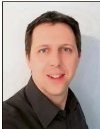
Der gelernte Verwaltungsbetriebswirt wird neuer Haupt- und Personalamtsleiter in Bad Soden-Salmünster.