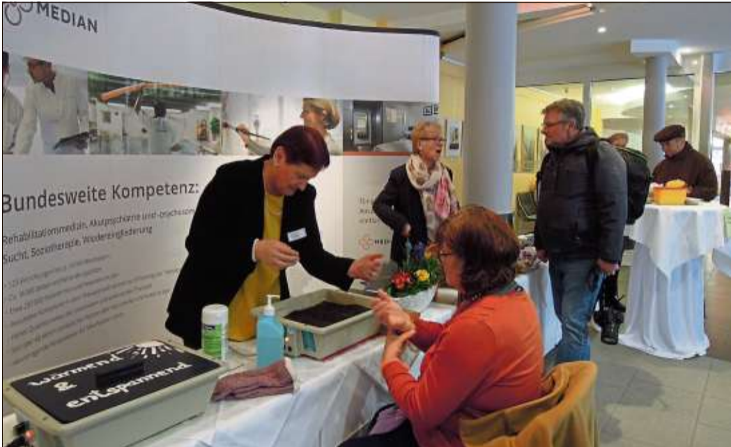
Beratung und kleine Gesundheits-Checks boten die Netzwerk-Kliniken und weitere Gesundheitsdienstleister.