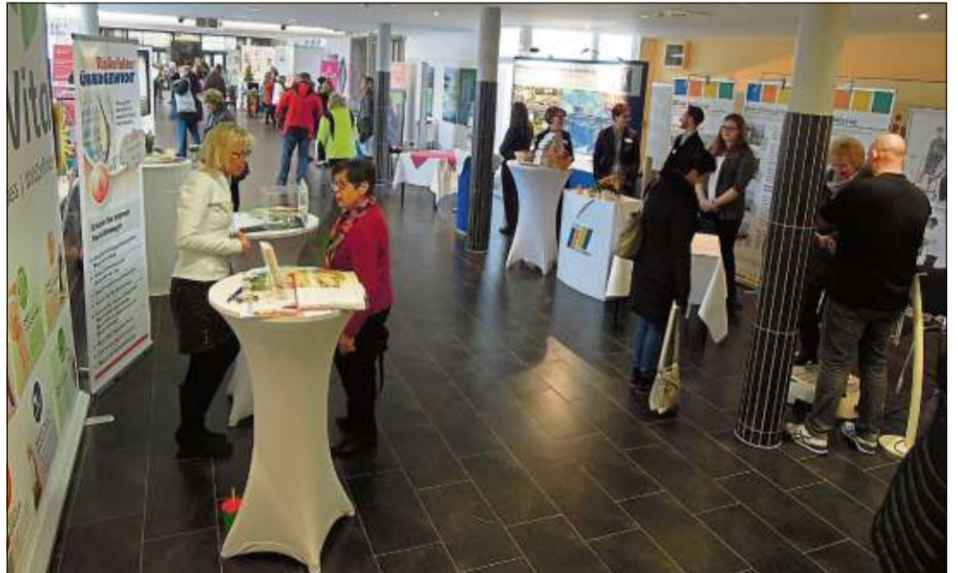
Viele Besucher waren zu den Gesundheitstagen in die Spessart Therme gekommen.