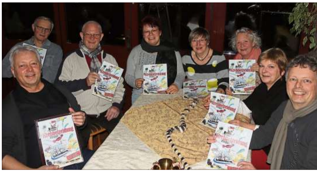
In der Gaststätte Hausmann präsentierten die Autoren die neue Krebbelzeitung 2019.