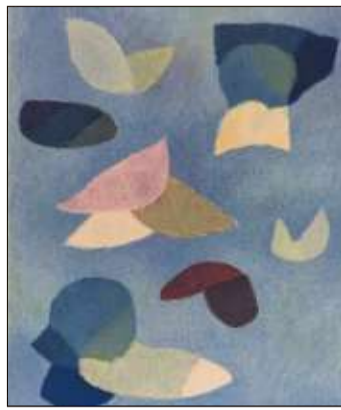
Werk mit Titel „Fliegende Objekte“.