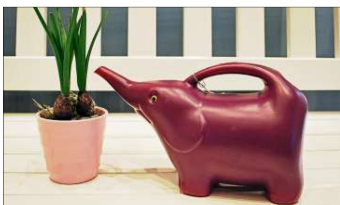
Gießkannen gibt es in den unterschiedlichsten Formen und Ausführungen, hier ein lila Elefant aus Kunststoff.

Mit viel Variantenreichtum und Kreativität die heimischen Pflanzen gehegt, gepflegt und vor allem gewässert werden und werden, zeigt ein Blick auf die Homepage des im Jahr 2011 im Vorfeld der Gartenschau ins Leben gerufene Gießkannenmuseums, das sich inzwischen längst zum Publikums- und Medienliebhaber gemauert hat: www.giesskannenmuseum.de