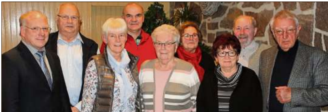
Die in der Jahreshauptversammlung geehrten Mitglieder.