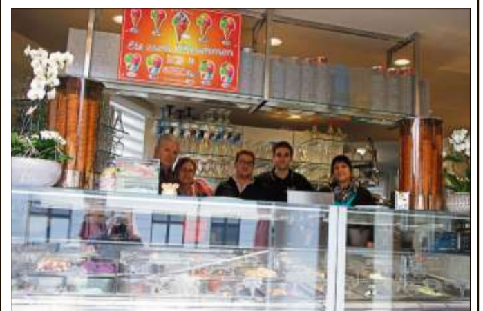
Eine extra große Theke bietet reichlich Platz zum Eisverkaufen.