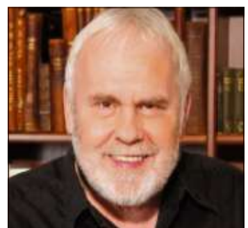
Opernsänger, Entertainer und TV-Moderator: Gunther Emmerlich.

STEINAU (BWB). Der bekannte Opernsänger und Entertainer Gunther Emmerlich tritt am Samstag, 16. März, um 20 Uhr im Theatrium in Steinau auf.