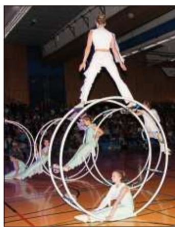
Das Rhönradteam Tausenstein zeigt eine fantasievolle Rhönrad-Show.