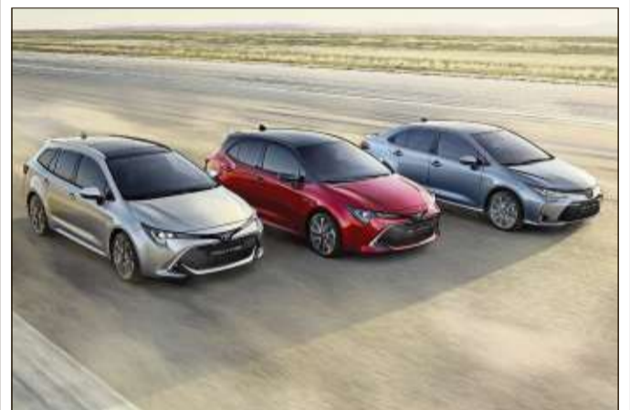
Der Corolla ist zurück und läutet eine neue Ära ein.