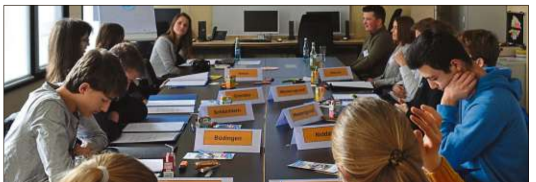
Unser Bild zeigt die Gruppe beim „Weg in das Berufsleben“.

Sehr konkret wurde es im Projekt des Personalamtes, wo sich die zehn Teilnehmerinnen und Teilnehmer mit Eignungstests, Vorstellungsgesprächen und Bewerbungsmappen befassten. Die Gruppe aus der Pressestelle recherchierte über das vielfältige Aufgabenfeld der Journalistin, befragte die Beschäftigten im Bürgerportal und formulierte einen Text zum diesjährigen Girls'- und Boys'-Day.