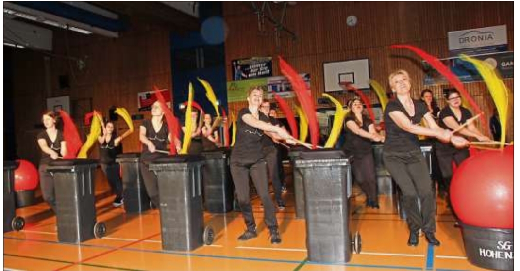
Trommelfeuer auf den schwarzen Tonnen.