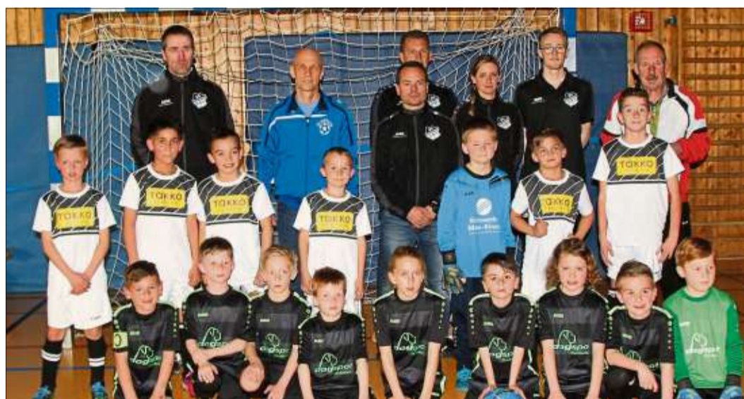
Die F-Junioren der SG Schlüchtern/Elm und der SG Distelrasen.