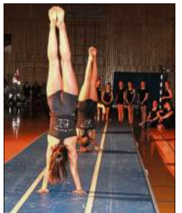
Die Steinauer Turnerinnen im „Dauerstress“, den sie souverän meisterten.