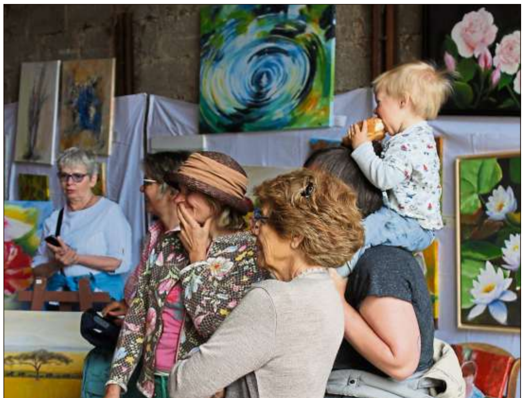
Groß und Klein begeben sich auf eine Entdeckungsreise bei den Ausstellungen.