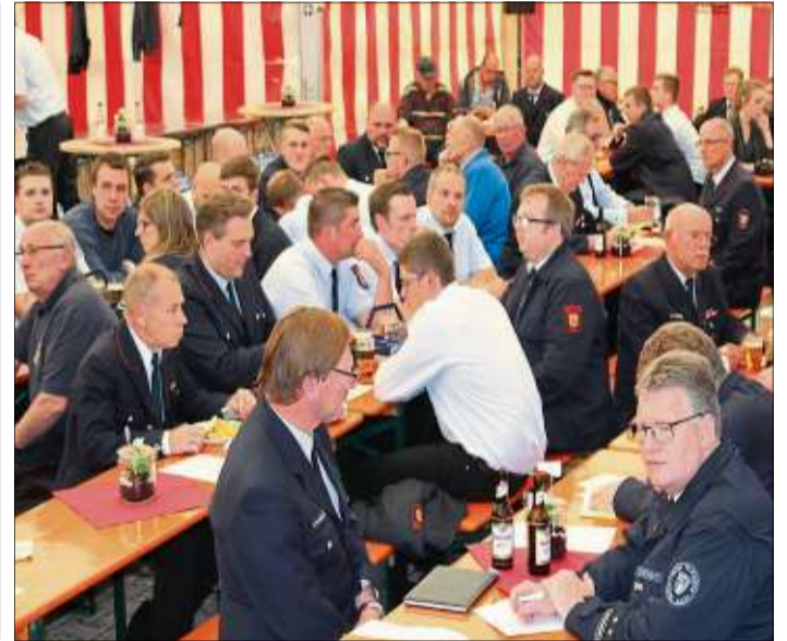
Gut besucht war die Versammlung im Herolzer Festzelt.