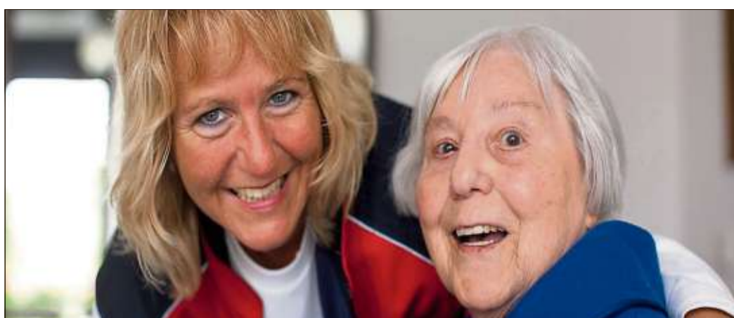
Sowohl für die Mitarbeiter als auch für die Patienten wird es durch die Übergabe an den DRK-Kreisverband keine Veränderung geben.