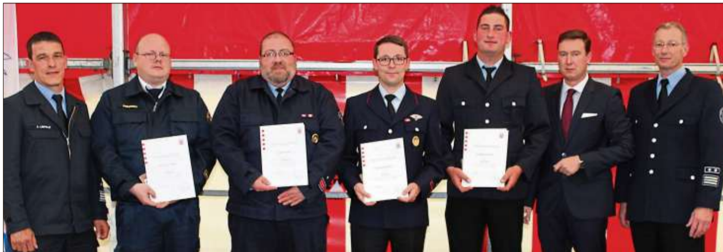
Diese Aktiven der Schlüchterner Stadtteilwehren erhielten Auszeichnungen des Landes Hessen.