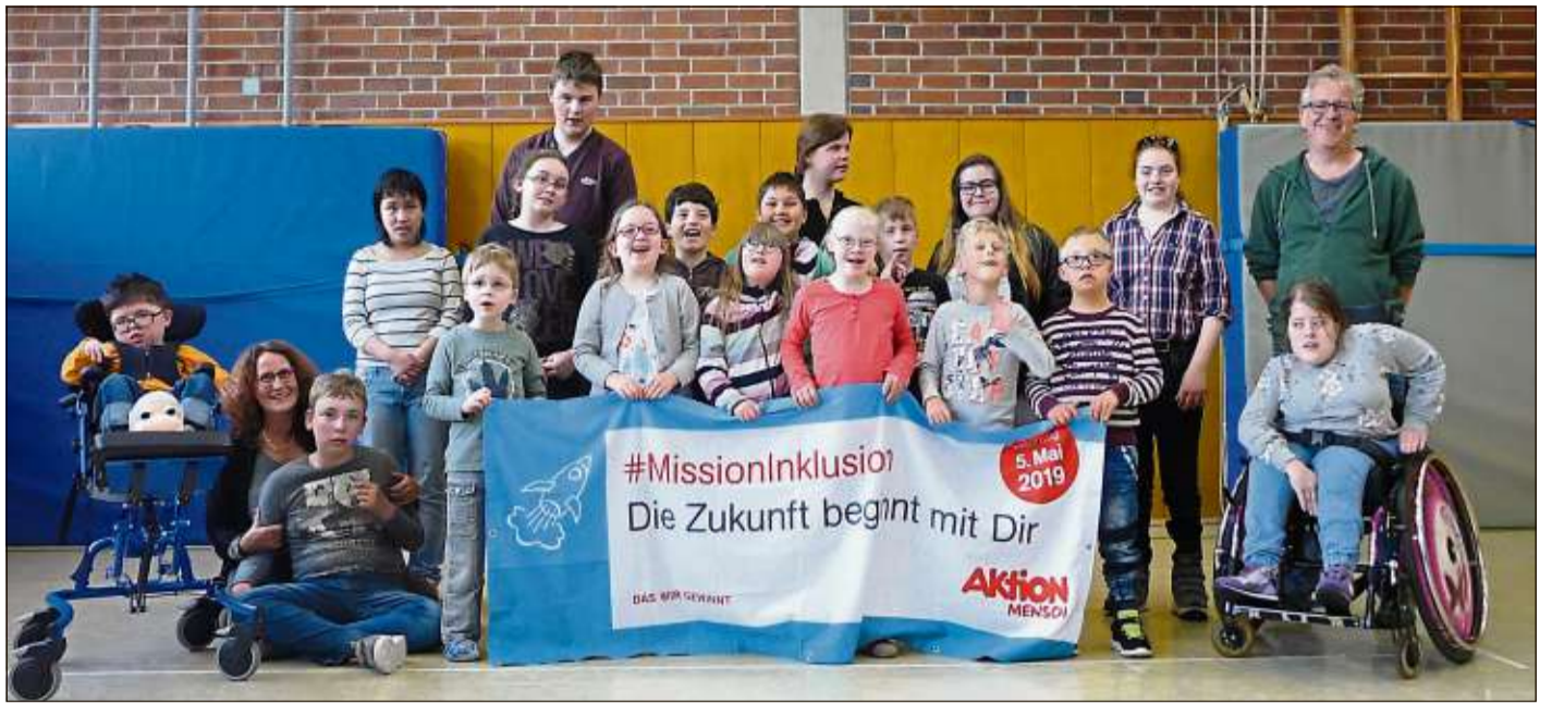
In dem Musikvideo zeigt jedes Kind seine individuellen Stärken und Fähigkeiten. Das beeindruckende Ergebnis ist auf YouTube zu bewundern.

Interessenten können sich montags bis 15 Uhr beim Bauamt der Gemeinde unter Telefon (06664) 80-217 anmelden..