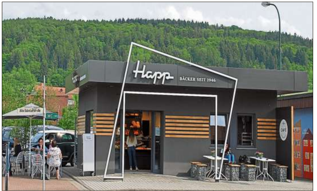
Die neue Filiale von Bäcker Happ am Untertor in Schlüchtern.

Die Öffnungszeiten der Bäcker-Happ-Filiale sind: Montag bis Samstag von 5.30 bis 18 Uhr, sowie Sonntag von 7 bis 17 Uhr.