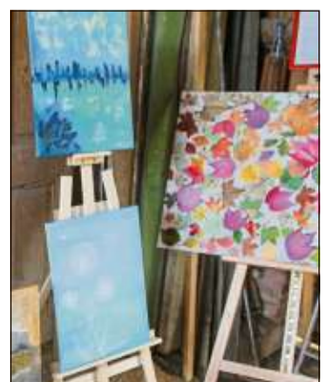
Die Gemälde sind wesentlicher Bestandteil der Kulturwoche.

Während der Kulturwoche gibt es auch eine Tombola, für welche alle Künstler etwas bereitstellen. Der Erlös daraus wird erneut für die Sri-Lanka-Hilfe von Altlandrat Karl Eyerkaufner zur Verfügung gestellt.