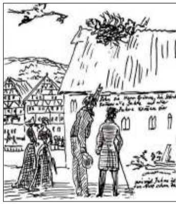
Eine Skizze von Steinau, angefertigt von Ludwig Emil Grimm.

Das Steinau des 19. Jahrhunderts wird darin lebendig, seine Plätze, Gebäude und seine Menschen. Auf den Spuren dieser Zeichnungen führt Mariéle Syllwasschy in der offenen Führung „Zeitreise in Ludwig Emil Grimms Steinau“ durch die schöne Fachwerkstadt. Viele von Ludwig Emil Grimm festgehaltenen Orte sind heute noch so präsent wie damals. Herauszufinden, was verändert, verschwunden oder sofort wiederzuerkennen ist, macht den Reiz dieser unterhaltsamen, informativen Führung aus. Sie findet am Sonntag, 2. Juni, von 14 bis 15.30