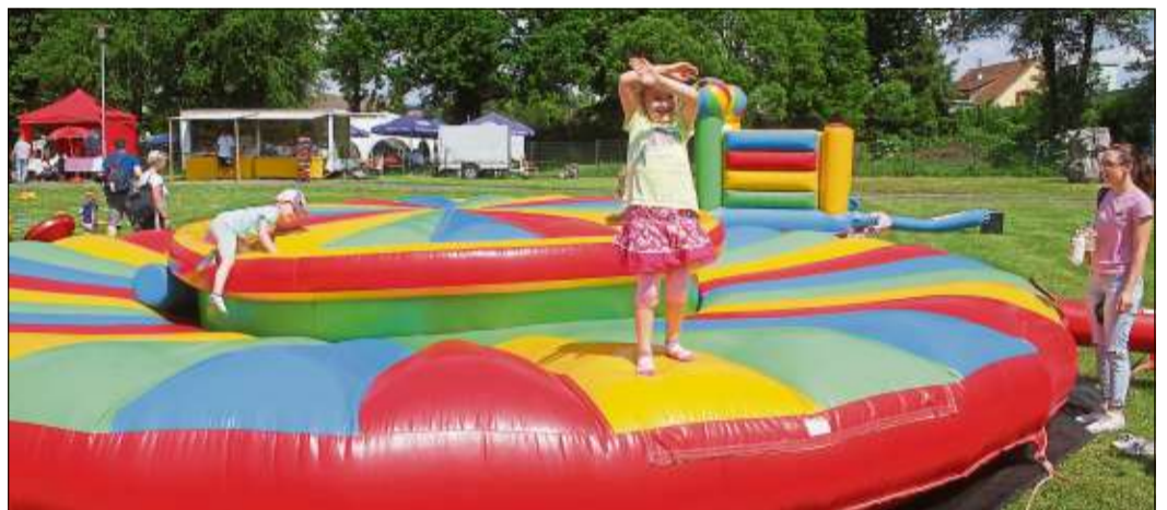
Die Kleinsten hatten ihren Spaß auf der Knax-Fete.

SCHLÜCHTERN (CS). Rund 1000 Kinder haben sich am vergangenen Samstag auf der Schlüchterner Mauerwiese bei der Knax-Fete der Kreissparkasse bespaßt lassen. Mit Unterstützung des Kunterbunten Kinderzettes und des Kulturkinos Kuki erlebten die Knaxianer einen unvergesslichen Tag.