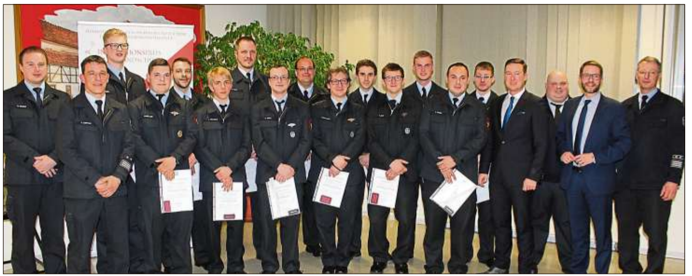
Eine Vielzahl von Aktiven der Schlüchterner Stützpunktwehr wurde ausgezeichnet.

Diese finden vom 1. bis zum 5. Juli (1. Ferienwoche) und vom 8. bis 12. Juli (2. Ferienwoche) statt. Anmelden können sich Kinder zwischen sechs und zwölf Jahren. In der ersten Woche gibt es ein buntes Programm Lego-Bautagen und einer Lama-Tour. In der zweiten Woche dreht sich alles um die „bunte Zirkuswelt“ auf der Sinntal-Ranch in Weiperz. Hier schlüpfen die Kinder in die Rolle der Artisten und können vieles ausprobieren und erfahren, was zur bunten Zirkuswelt gehört. Am Ende der Woche werden die erlernten Künste in einer Zirkusvorstellung, zu der die Eltern, Geschwister und Freunde eingeladen werden können, vorgeführt. Der Flyer mit Programmablauf sowie das Anmeldeformular sind bei der Gemeindeverwaltung Sinntal, Sozialverwaltung, Am Rathaus 11, 36391 Sinntal-Sterbfritz, erhältlich und stehen auf der Homepage der Gemeinde Sinntal www.sinntal.de als Download bereit. Für Fragen stehen unter den Telefonnummern (06664) 80-111 (Uwe Ziegler) und (06664) 80-119 (Bianca Arnold) Ansprechpartner zur Verfügung. Soweit noch freie Plätze vorhanden sind, können auch Kinder, die außerhalb der Gemeinde Sinntal wohnen, an den Ferienspielen teilnehmen.