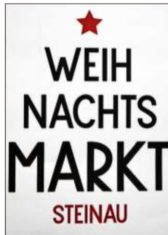
Das neue Logo des Steinauer Weihnachtsmarkts.