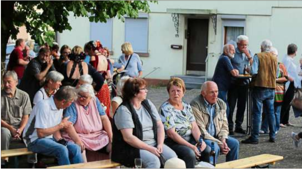
Zahlreiche Zuhörer besuchten das Open-Air-Konzert am Elmer Kirchenvorplatz.