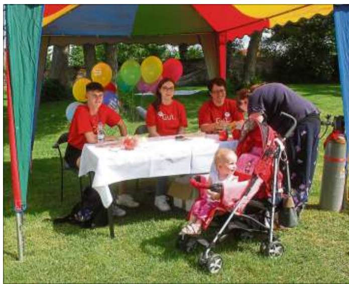
Ein Jahr Taschengeld gab es beim Luftballonwettbewerb zu gewinnen.