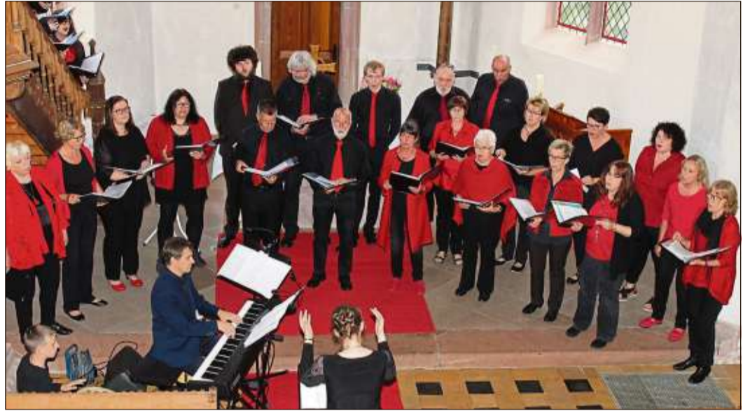
Der Elmer Chor „Good News“ bei seinem Auftritt zum Auftakt der Kulturwoche.