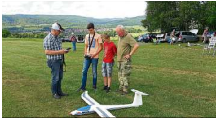
Beim Schnuppermodellfliegen erhalten Interessierte jeden Alters Einblicke in ein faszinierendes Hobby.

STEINAU (BWB). Die Modellflieger der Segelfluggruppe (SFG) Steinau laden für Pfingstmontag, 10. Juni, nach dem ökumenischen Gottesdienst zum Schnupper-Modellfliegen ein.