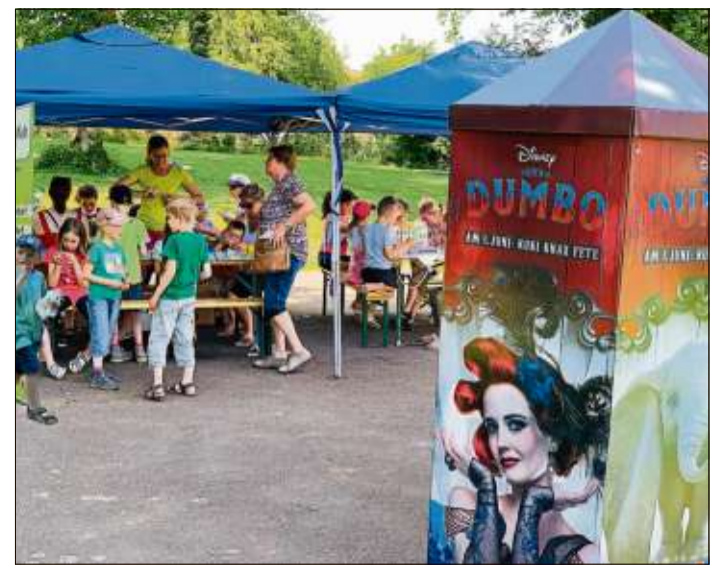
Die Kreativwelt sorgte ebenso wie das Kuki für gute Unterhaltung.