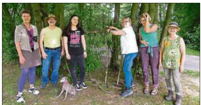
Die Teilnehmer schufen Kunstwerke aus Naturmaterialien.