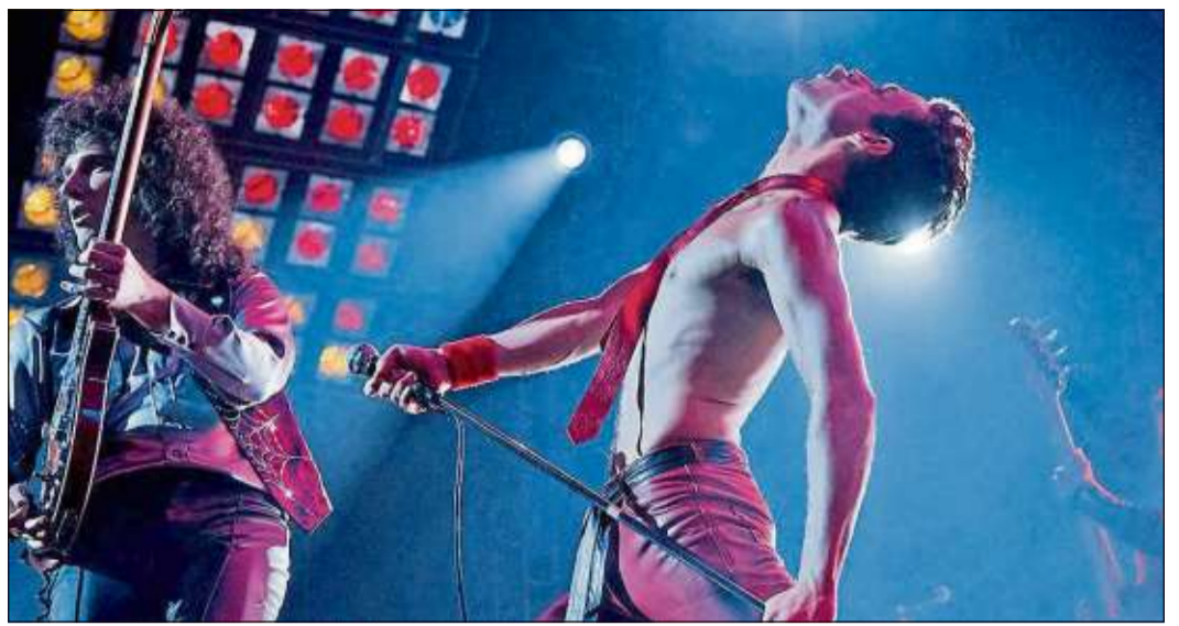
„Bohemian Rhapsody“ ist ein hochsensibler, nie voyeuristischer musikalischer Film und wird am Freitag, 19. Juli, bei „Rock am Hinkelhof“ gezeigt.