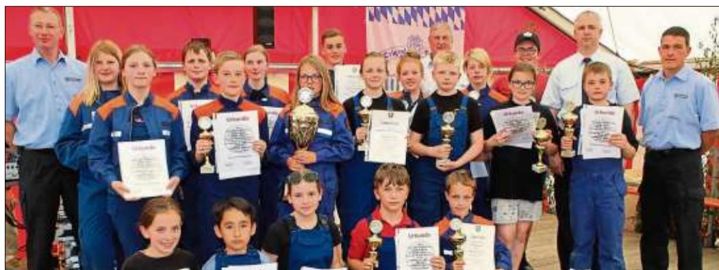
Stolz zeigen Vertreter von allen teilnehmenden Mannschaften des Jugendfeuerwehr-Wettbewerbs in Herolz Urkunden und Pokale.

ings, Ulmbach, Vollmerz, Sarrod/Rabenstein/Rebsdorf, Altengronau/Jossa 2, Sterbfritz 2, Altengronau/Jossa 1, Schlüchtern/Kressenbach, Weiperz/Sannerz und Sterbfritz 1.