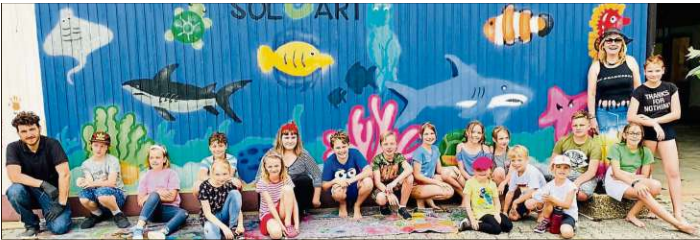
Am Schwimmbad verschönerten die Kinder eine kahle Wand.