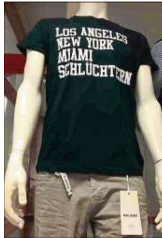
Die „Be Famous“-Herren-T-Shirts mit dem Aufdruck Los Angeles, New York, Miami und Schlüchtern gibt es exklusiv bei Rech.

„Ich gehe mal zu Rech, Schatz. Nur mal gucken, ob die was für die Geburtstagsfeier deiner Mutter haben, nur mal schauen.“ So hört man(n) sie sagen. Wenn sie nach Hause kommt, versteckt sie die auffällige rote Tüte. Das kommt Ihnen bekannt vor?