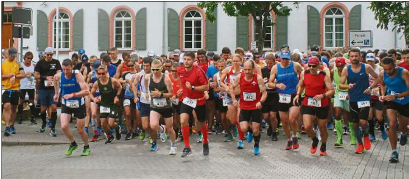
Unser Bild zeigt den Start zur fünften Etappe in Bad Orb.