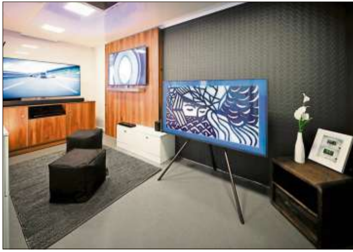
Im Inneren des Trucks bringt Samsung TV-Fachhändlern und den Kunden aktuelle Produkt-Highlights näher.

SCHLÜCHTERN (BWB). Der Samsung-Trainings-Truck ist nun einige Wochen in Deutschland unterwegs und macht am Freitag, 14. Juni, von 10 bis 17 Uhr Station bei Elektro Beisler, Am Reitstück 6, in Schlüchtern.