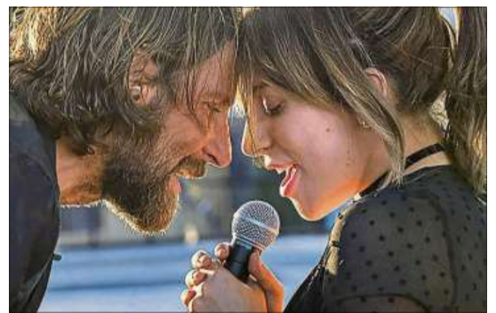
Bradley Cooper und Lady Gaga in „A Star Is Born“.