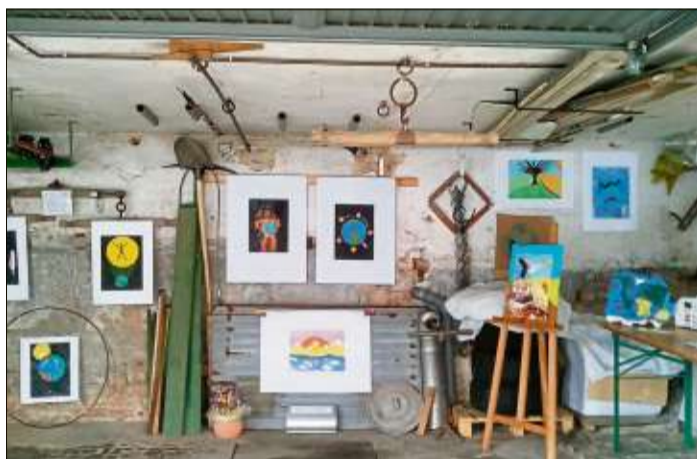
Schüler der Henry-Harnischfeger-Schule hatten das Thema „Klimaerwärmung“ künstlerisch umgesetzt und ihre Arbeiten auf der Elmer Kunstwoche ausgestellt.

Die jungen Kunstschaffenden hoffen, dass ihre Bilder eventuell noch einmal in der Schule ausgestellt werden können.