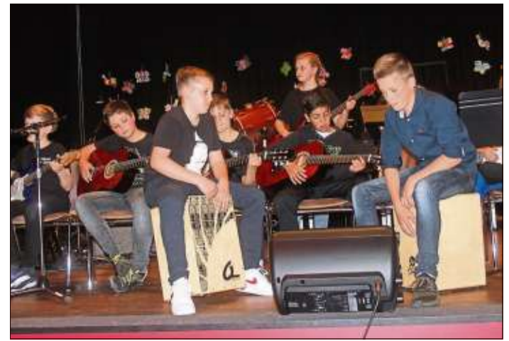
Die Gitarren-AG mit „Come as you are“.