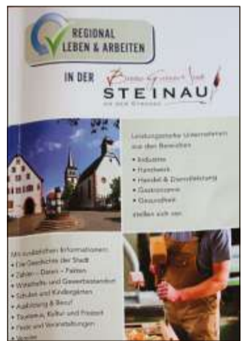
Der 102-seitige Gewerbeführer erscheint in einer Auflage von 6000 Exemplaren.