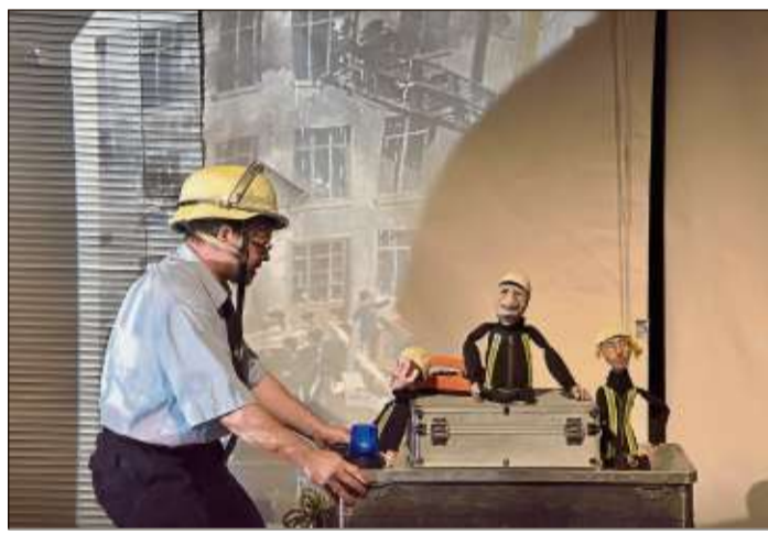
Lehrreich und lustig: Das Stück „Bei der Feuerwehr wird der Kaffee kalt“ im Theatrium.