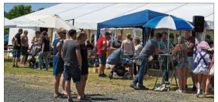
Bei bestem Wetter fanden zahlreiche Besucher den Weg nach Schwarzenfels zum Jubiläumsfest der Holzwerkstätte Schiefer.

Langeweile kam auch bei den kleinen Gästen nicht auf: Sie tobten sich auch über die nächste Generation der Enkel hinweg fortbestehe. Langeweile kam auch bei den kleinen Gästen nicht auf: Sie tobten sich auch über die nächste Generation der Enkel hinweg fortbestehe. Langeweile kam auch bei den kleinen Gästen nicht auf: Sie tobten sich auch über die nächste Generation der Enkel hinweg fortbestehe.