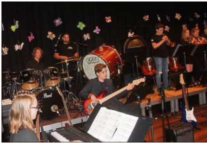
Die Big Band präsentierte sich in Bestform.

winden und vieles mehr. Die Kosten für das Meerjungfrauen-Schwimmen betragen 35 Euro pro Teilnehmer und Tag. Dazu kommt der Eintritt in das Bad. Die Flossen und Kostüme werden für die Zeit des Kurses gestellt. Anmeldung nimmt die Deutsche Schwimmakademie, E-Mail: hallo@schwimmakademie.org, www.schwimmakademie.org. Weitere Informationen zum Freibad Flieden gibt es unter www.flieden.de.