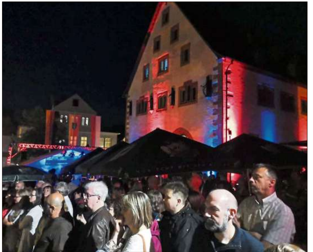
Zum Großen Zapfenstreich präsentierte sich der Kumpen festlich illuminiert.