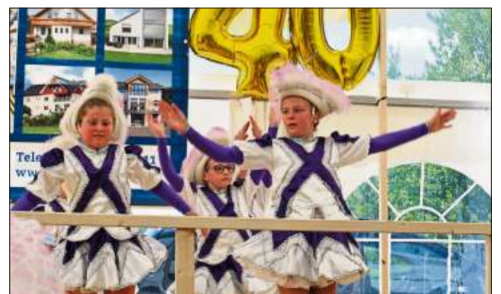
Die Lollipopps unterhielten die Besucher mit schwungvollem Gardetanz.