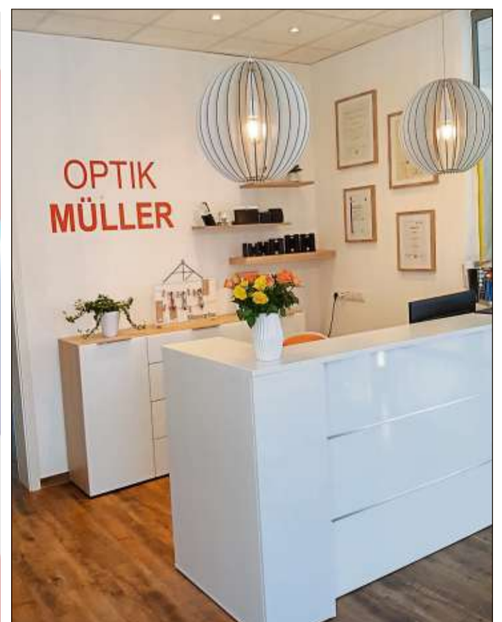
Frischer Wind in neuen Geschäftsräumen: Davon können sich die Besucher am Samstag beim Tag der offenen Tür überzeugen.

Bahnhofstraße 5 | 36391 Sinntal-Sterbfritz Telefon (0 66 64) 40 38 70 | info@optik-mueller-sinntal.de