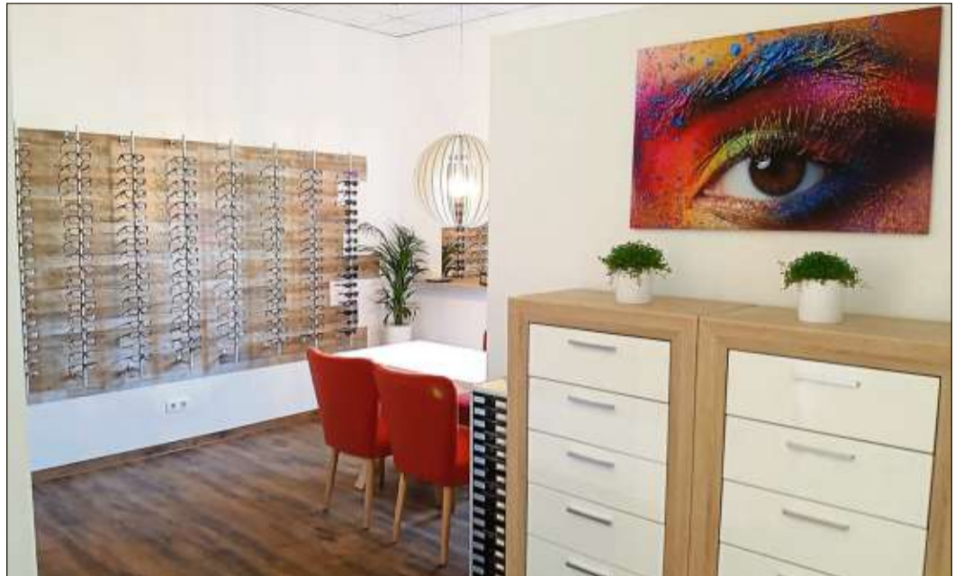
In den neuen Verkaufsräumen sind die aktuellsten Brillengestelle namhafter Hersteller ausgestellt.