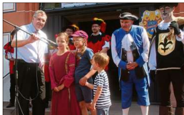
Bürgermeister Malte Jörg Uffeln und drei Kinder eröffneten den Märchensonntag.

Im Literaturcafé, im Hirschgraben und der Hofstube des Steinauer Schlosses waren die Märchen-erzähler aktiv. Dort spielte das Spielmansche Stück „Knuzius, der edle Ritter“. Im Märchenwald kamen die Kinder bei den vielen kleinen Märchenmotiven versehenen Spielhäuschen nicht aus dem Staunen heraus.