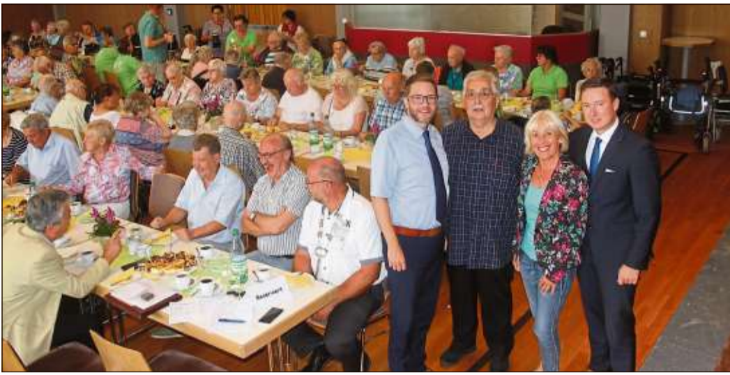
Die Stadthalle war beim Seniorennachmittag gut gefüllt. Landrat (links), Bürgermeister (rechts) und Seniorenenbeauftragter freuten sich über den Besuch der Bundestagsabgeordneten Bettina Müller.