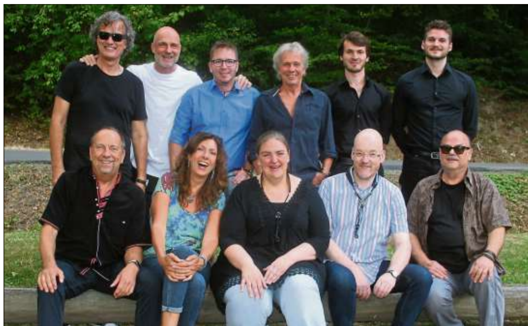
Die Rockformation Nexus war mit dem Bläsersatz dabei und setzte ein weiteres Glanzlicht in der lauen Sommernacht am Acis.