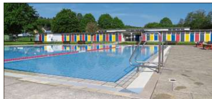
Die farbig lackierten Türen im Freibad geben der Veranstaltung ihren Namen: „Familienfest der bunten Türen“.

SCHLÜCHTERN (BWB). Mit einem evangelischen Gottesdienst, musikalisch begleitet von der Band „New Spirit“, beginnt am Sonntag, 18. August, um 10 Uhr im Freibad Schlüchtern das „Familienfest der bunten Türen“. Bereits ab 9 Uhr ist das Bad zu freiem Schwimmen, Baden, Spielen und Chillen geöffnet.