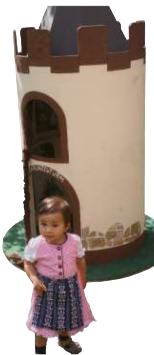
Im Märchenwald fühlten sich die jüngsten Besucher pudelwohl.

Uffeln bedankte sich bei der Agenda-Gruppe 21 dafür, diese schöne Tradition aufrecht zu erhalten und Kindern und Erwachsenen Gelegenheit zu geben, für einen Tag tief in die Welt der Brü-