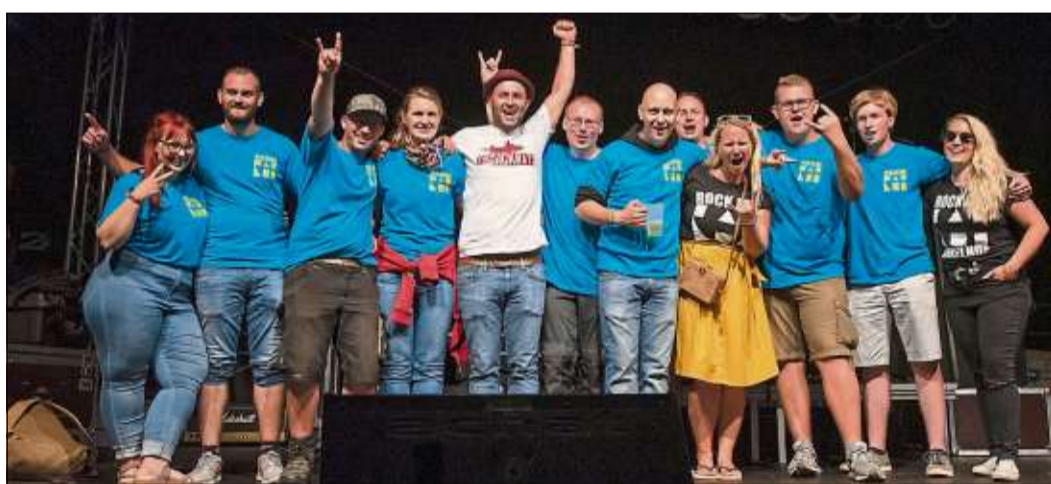
Sehr zufrieden und stolz: Das Team von „Rock am Hinkelhof“.