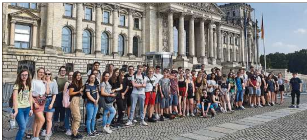
Drei der sechs neunten Klassen der Henry-Harnischfeger-Schule vor dem Reichstagsgebäude.

ROMSTHAL (BWB). Der Ski- und Wanderclub Huttengrund beteiligt sich am Samstag, 10., und Sonntag, 11. August, an den 1. Europa-Volkswandertagen in Bad Orb. Veranstalter ist die THW-Helfervereinigung Bad Orb. Start und Ziel ist die THW-Unterkunftshalle. Startzeiten sind am Samstag von 11 bis 16 Uhr (Zielschluss 18 Uhr) und am Sonntag von 7 bis 12 Uhr (Zielschluss 15 Uhr). Es werden Strecken von 6, 12 und 20 Kilometern angeboten. Die zehn größten Gruppen erhalten Pokale.