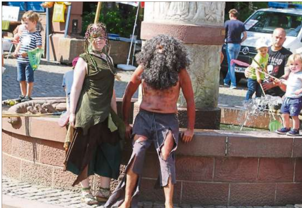
Der Eisenhans und die Baumnymphe Wencke mischten sich unter die Besucher und legten ein Püschchen am Märchenbrunnen ein.