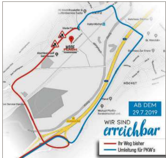
Die Skizze zeigt, wie das Modehaus Flach und der „Marktplatz Haitz“ trotz Baustelle erreichbar sind.