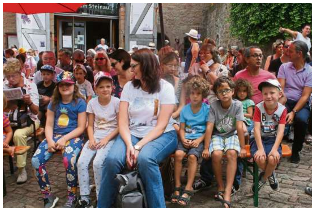
Hunderte Besucher erlebten das Märchenspiel im Amtshof.

Nach dem Gottesdienst unterhält die Band die Festbesucher noch für eine weitere Stunde musikalisch. Beim „Familienfest der Bunten Türen“ bieten die Schlüchterner Vereine den Besuchern ein vielfältiges Programm. Das Kunterbunte Kinderzelt hat Hüpfburgen und andere aufblasbare Spielstationen, einschließlich des beliebten Bällepools, im Gepäck. Die Jugendfeuerwehr Schlüchtern bietet für Kinder Zielspritzen mit der Kübelspritze an, das DLRG Schülchtern „6 I 36 I 76“ Familien-Seepferdchen-Schwimmen, Schnuppertauchen mit Leichttauchgerät und die Seniorenstaffel der DLRG Rettungsschwimmern. Stabhochsprung für Jedermann im Beachvolleyballfeld und eine Hindernis- oder Biathlonstaffel organisiert die Abteilung Leichtathletik der SG Schlüchtern.