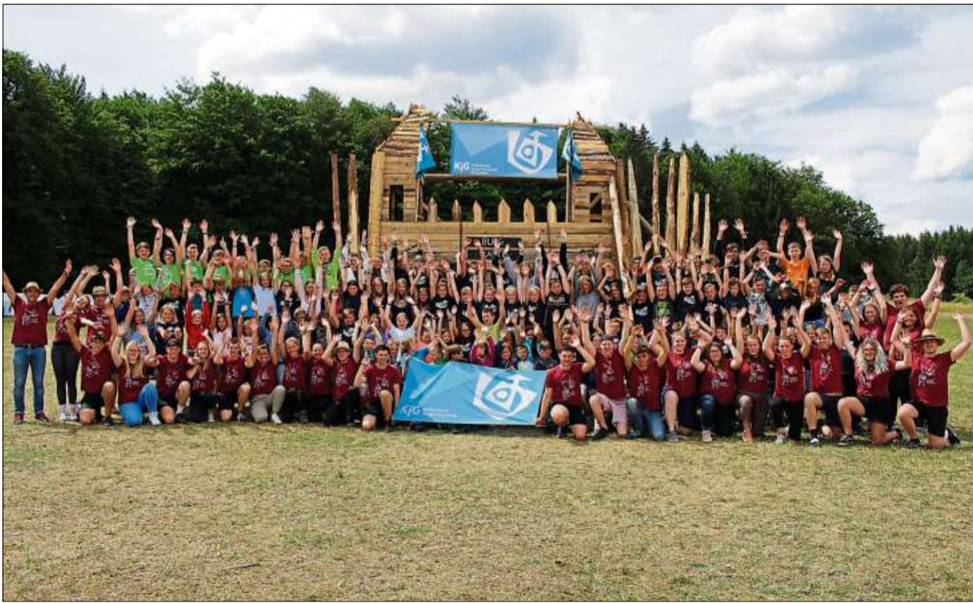
Das diesjährige Zeltlager war mit 110 Kindern das größte seit der Gründung der KjG Bad Soden.