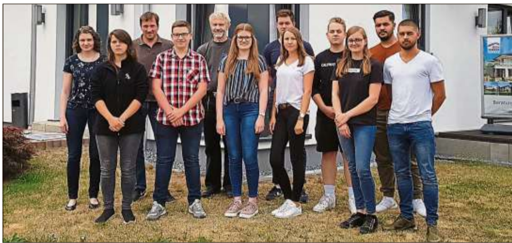
Bien-Zenker heißt den neuen Azubi-Jahrgang willkommen.

SCHLÜCHTERN (BWB). Neun Auszubildende haben am Donnerstag, 1. August, mit dem Start des neuen Ausbildungsjahrs bei Bien-Zenker ihre Berufsausbildung begonnen. Darunter Industriekaufleute, Bauzeichner und Zimmerer sowie eine Bauzeichnerin, die nach Abschluss ihrer Lehre nun ein duales Studium zur Bauingenieurin aufnimmt.