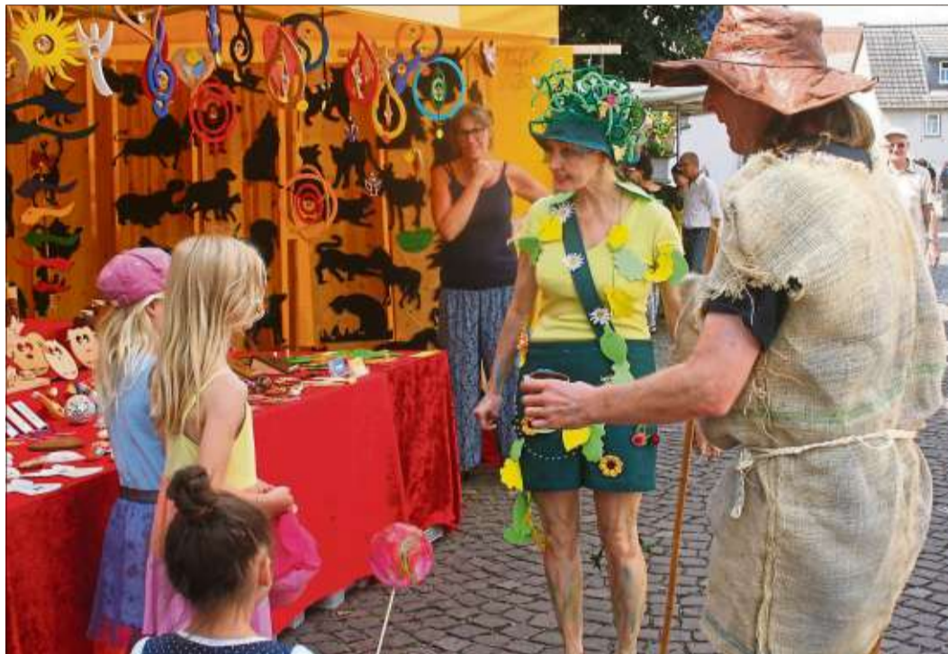
Auch ein Waldgeist und ein weiterer Eisenhans streiften durch die Gassen und nahmen sich Zeit für einen Plausch.