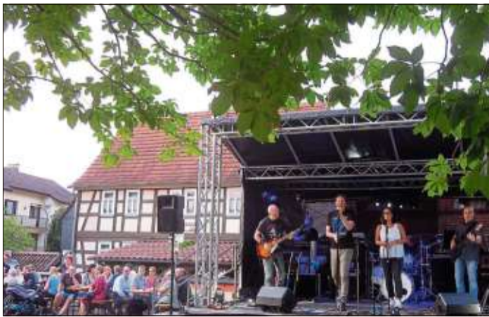
In der tollen Kulisse des Schleifrashofes spielte die Band „Monkeytones“ auf.