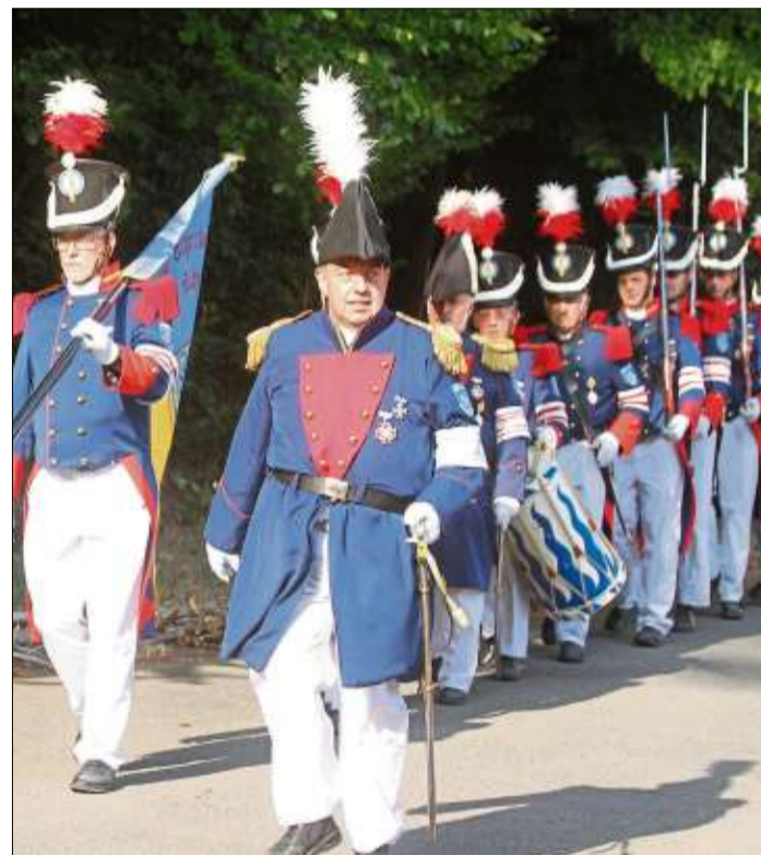
Die Bürgergarde beim Einzug ins Festzelt.