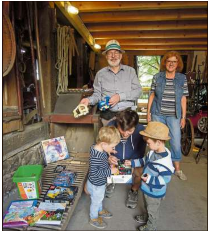
Der Flohmarkt beim Museumshoffest kam gut an.

Viele Besucher nutzen das Museumshoffest, um das Heimatmuseum zu besuchen und die liebevoll eingerichteten Zimmer zu bestaunen, die einen Eindruck von Leben, Wohnen und Arbeiten der Vorfahren vermitteln.