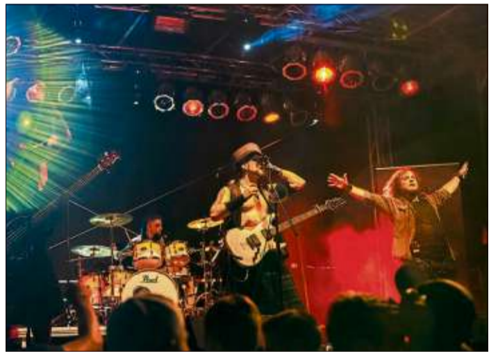
Mit „Triddana“ aus Argentinien war zum ersten Mal eine internationale Band zu Gast am Hinkelhof.