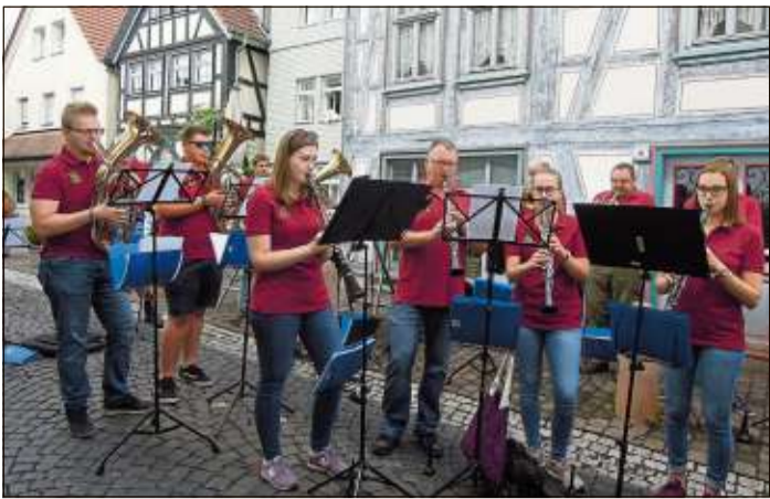
Der Musikverein Salmünster begleitete die Eröffnung mit zünftiger Blasmusik.