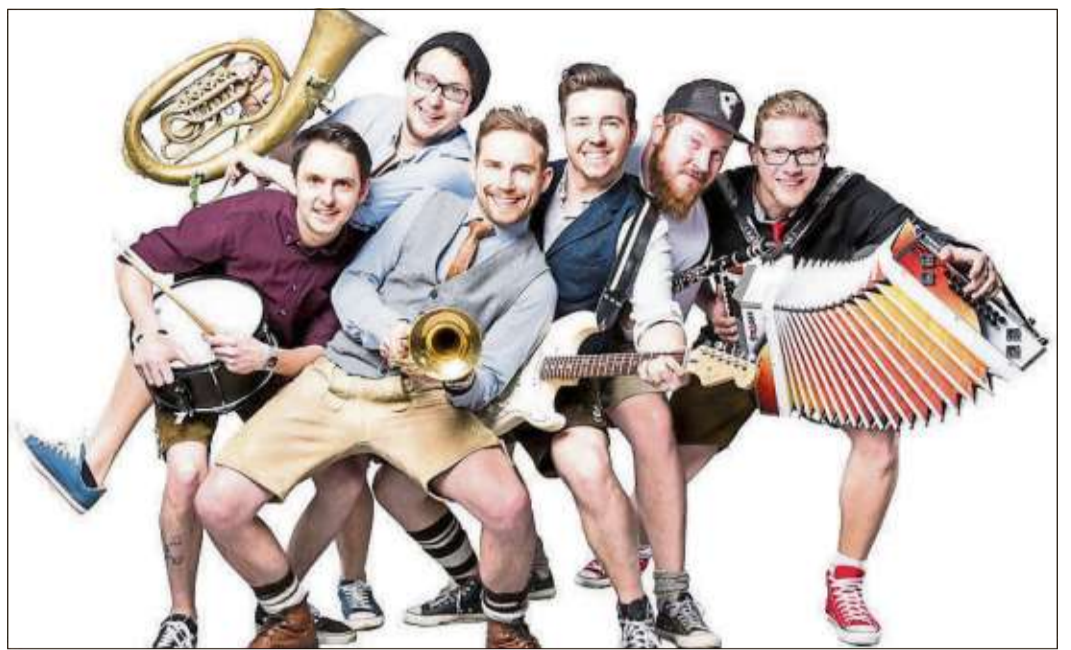
Mit den „Grabenlandbuam“ haben die Organisatoren der Mottgerner Kirmes eine Top-Band engagiert.

Auch am Montag wird den Gästen ein neuer Programmpunkt geboten. Nach dem mittlerweile schon legendären Entenwettrennen auf der Sinn spielt der Musikverein Oberzell als „Vorgruppe“ für die zum zweiten Mal in Mottgers gastierenden The Jets auf.