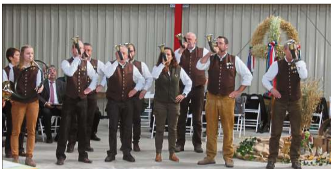
Die Jagdhornbläser umrahmten den feierlichen Gottesdienst.