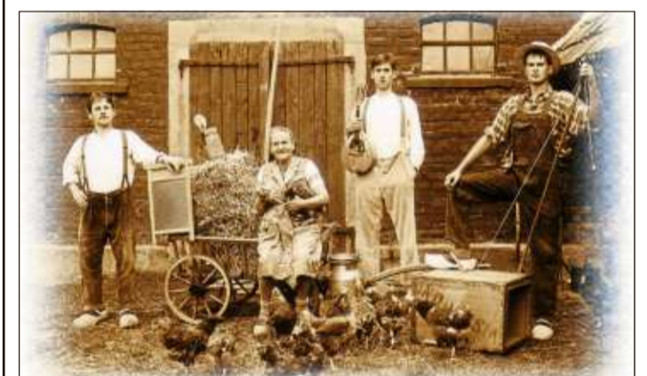
Die Rhöner Säuwäntzt treten in bäuerlicher Kostümierung, Cordhosen, breite Hosenträger und Holzschuhe, auf.