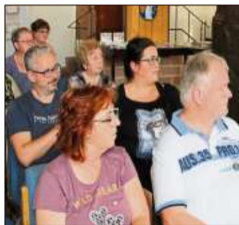
Einige Teilnehmer der Bürgerversammlung in der Markthalle des Rathauses.

Während die Geschäftsleute dafür plädieren, die Straße offen zu lassen, fordern die Anwohner „zumachen“. Laut Uffeln seien schon verschiedene Modelle ausprobiert worden, ohne dass es eine Lösung des Problems gegeben habe. Die Anwohner erhe-