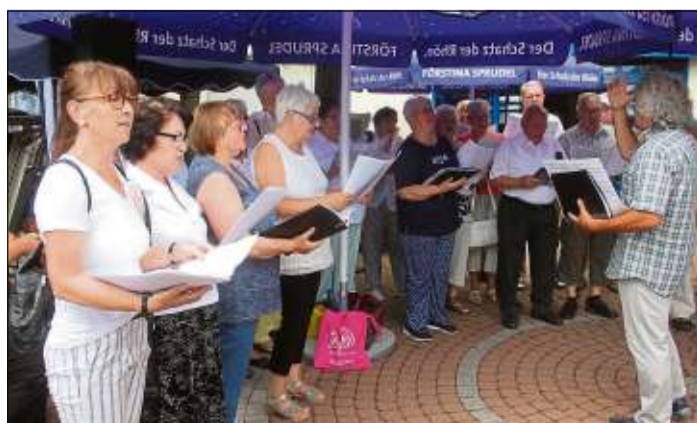
Der Chor Eintracht umrahmte das Sommerfest musikalisch.