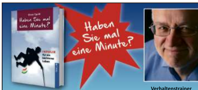
Das Buch zum Tipp: www.haben-sie-mal-eine-minute.de