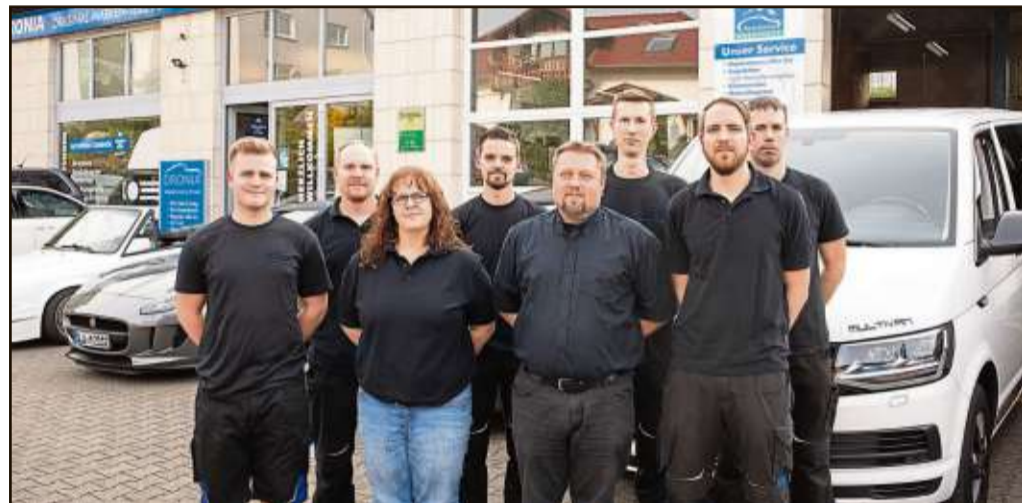
Das Team von Autoservice & Fahrzeugteile Dronia besteht aus engagierten und fachkundigen Mitarbeitern.