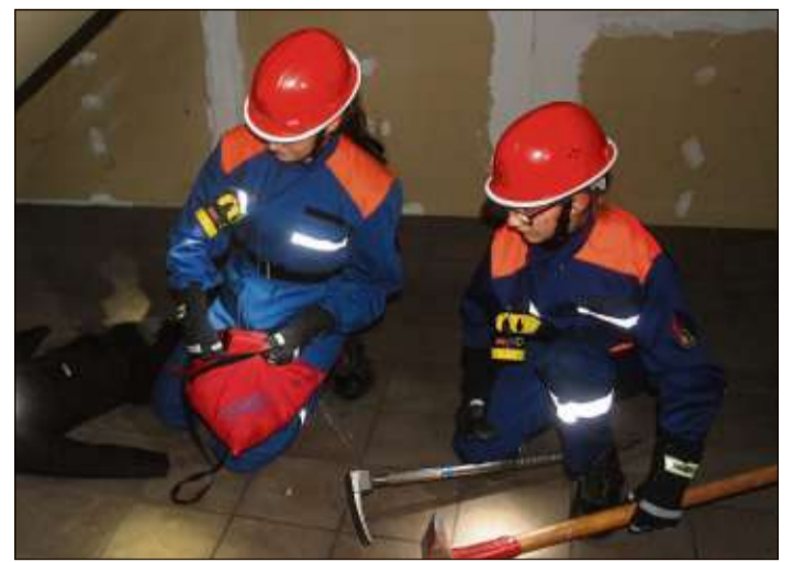
Auch im Keller des ehemaligen Kaufhauses suchten die Jugendlichen nach Verletzten.