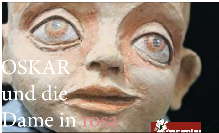
Die Theaterleute feiern das Stück „Oskar und die Dame in rosa“, das am 4. Oktober Premiere hat, als eine Hymne auf das Leben.

Tickets zu 20 Euro, ermäßigt 15 Euro. Zum Inhalt: „Männer und andere Irrtümer“ ist eine der besten