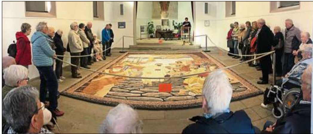
Die Senioren erhielten interessante Informationen zur Entstehung des Fruchteppichs und dessen Verkündigungscharakter.

Die nächste Fahrt ist bereits vorbereitet: Mit dem Bus geht es am 10. Dezember zum Weihnachtsmarkt nach Erfurt. Abfahrt ist um 9 Uhr am Untertorplatz in Schlüchtern. Anmeldungen bei Klaus Arnold sind unbedingt erforderlich.