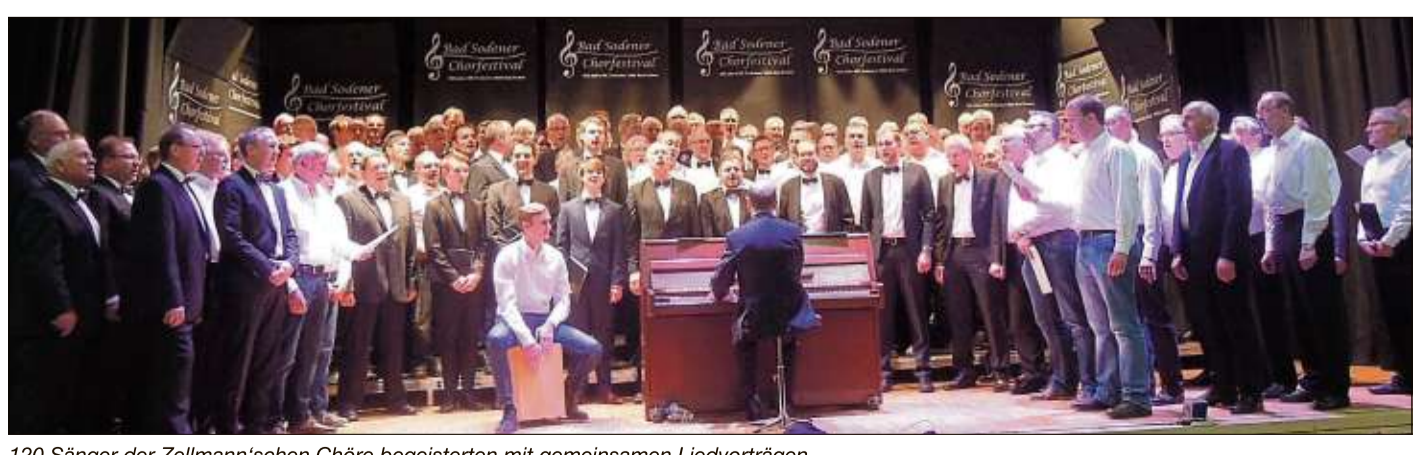
120 Sänger der Zellmann'schen Chöre begeisterten mit gemeinsamen Liedvorträgen.