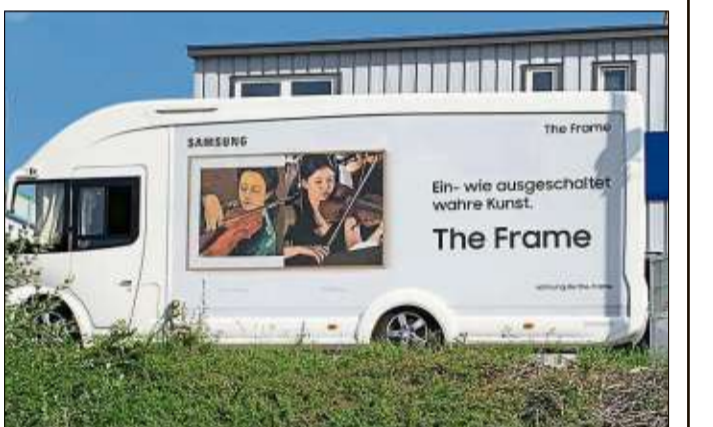
Der Samsung-Show-Truck macht bei Euronics Beisler am Reitstück in Schlüchtern Station.

SCHLÜCHTERN (OJ). „In der Region für die Region“ ist eines der Leitmotive des Elektrofachmarktes Euronics Beisler am Reitstück 6 in Schlüchtern.