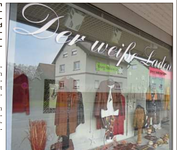
Zum Jahresende schließt das Textilfachgeschäft „Der weiße Laden & exclusiv“ in Salmünster.

„Der weiße Laden & exclusiv“ hat immer Wert auf gute Qualität und vor allem auf eine indi-