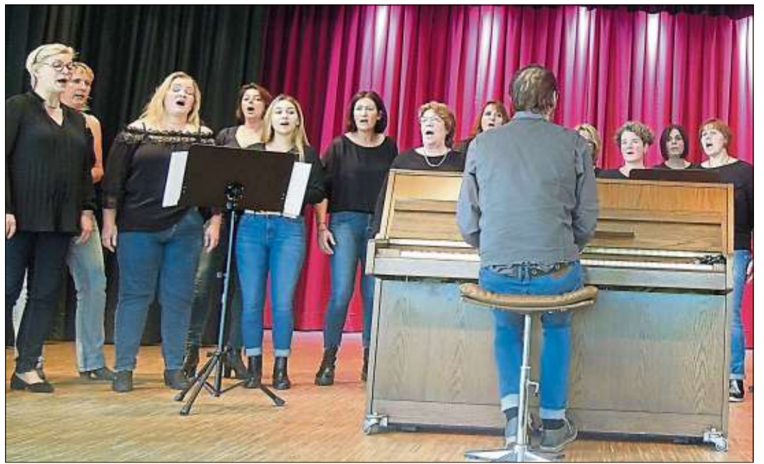
Die „New Voices“ aus dem Huttengrund brachten beim Matinee-Singen Rhythmus auf die Bühne.