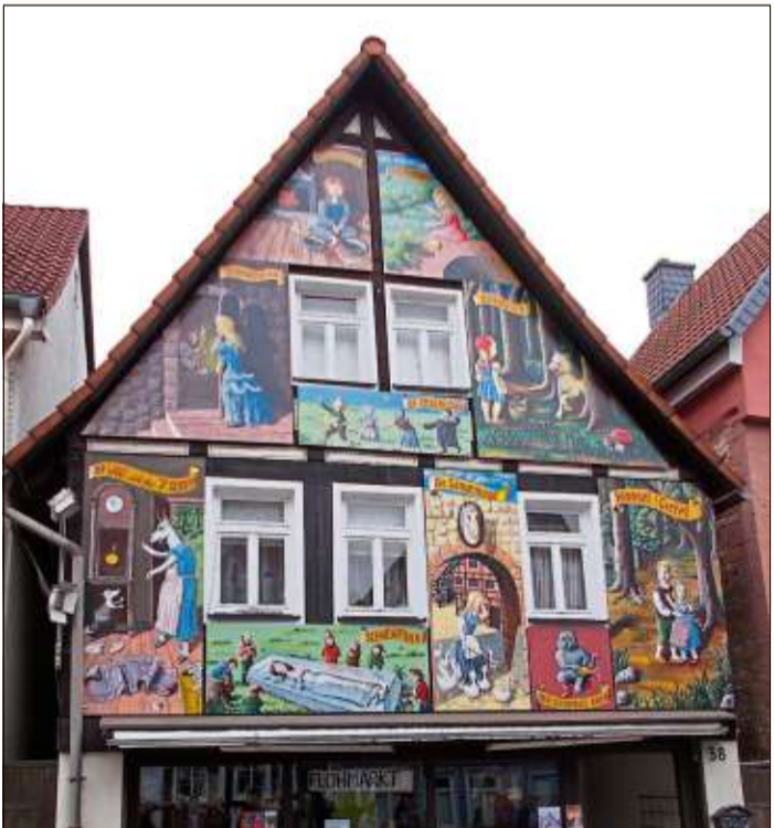
Zehn großformatige Märchenbilder zieren das Mühlhause-Haus in der Brüder-Grimm-Straße.