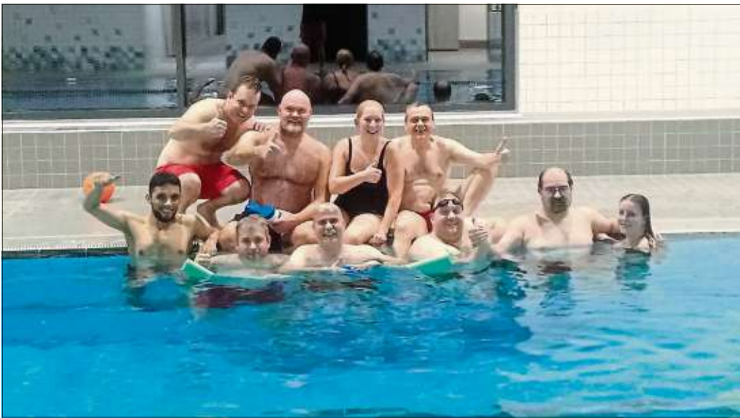
Die Schwimmerinnen und Schwimmer der DRK-Wasserwacht haben ihr erstes Training im neuen 25-Meter-Becken der Spessart-Therme absolviert.