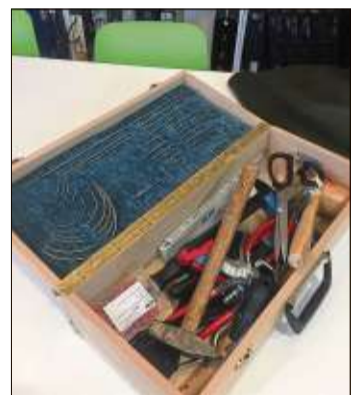
Typische Utensilien für den Raumausstatter.

Ziel ist es, die Auszubildende im familiär geführten Betrieb weiter zu beschäftigen, wo sie die Kunden vor Ort sowie im Geschäft unter anderem bei der Auswahl der Stoffe berät und bei der Montage aktiv mitwirkt.