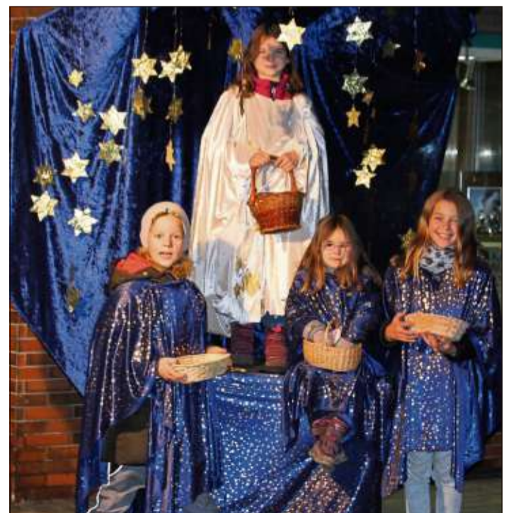
Märchenhafte Motive wie Sterntaler sind auf dem Lampionumzug für die Kinder gut einsehbar platziert.