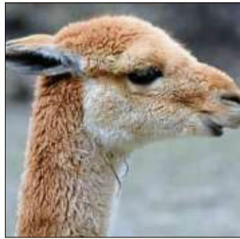
Vikunjawolle wird für Kleidung wie Mäntel, Pullover, Socken oder Schals verwendet.

Die Rede ist von Vikunjawolle, die vom gleichnamigen Tier gewonnen wird, das zur Familie der Kamele gehört. In einem aufwendigen Scherprozess werden die wild lebenden Tiere aus Nationalparks und weitläufigen Gehegen zusammengetrieben, um das feine Unterhaar vom Deckhaar zu trennen – pro Tier kommen bei dieser traditionellen Fangart jedoch gerade einmal 150 Gramm der Wolle zusammen.