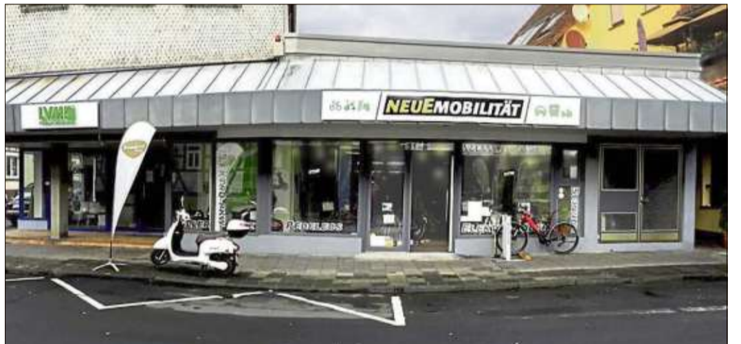
Zum Kalten Markt hat das Fachgeschäft NeuEmobilität in der Krämerstraße durchgehend von 10 bis 18 Uhr geöffnet.