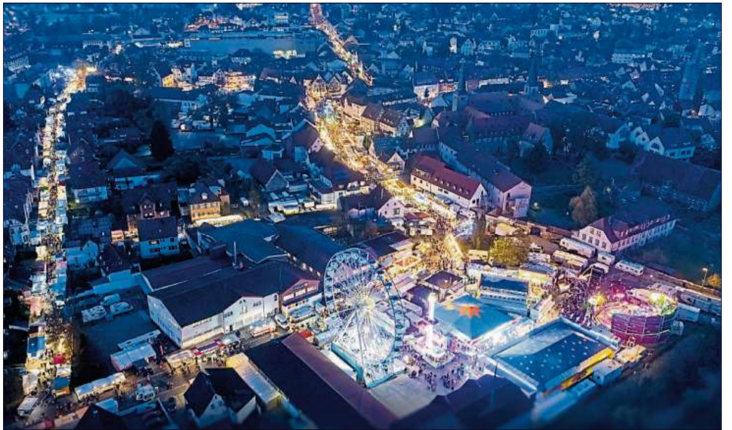
Ein imposanter Blick von oben auf die illuminierten Straßen beim größten Heimatfest im Bergwinkel.