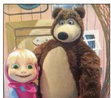
Wirbelwind Mascha und der gutmütige Bär sind dicke Freunde.

seine Ruhe haben möchte. Mascha besucht ihn jeden Tag wobei es dann natürlich vorbei ist mit der Ruhe. Der Bär kann zwar