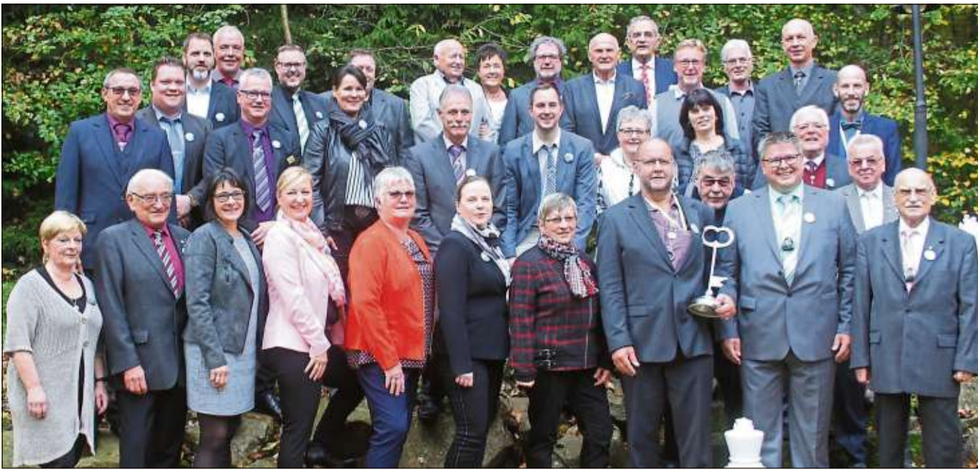
Das obligatorische Gruppenbild der Kalte-Markt-Präsidenten.