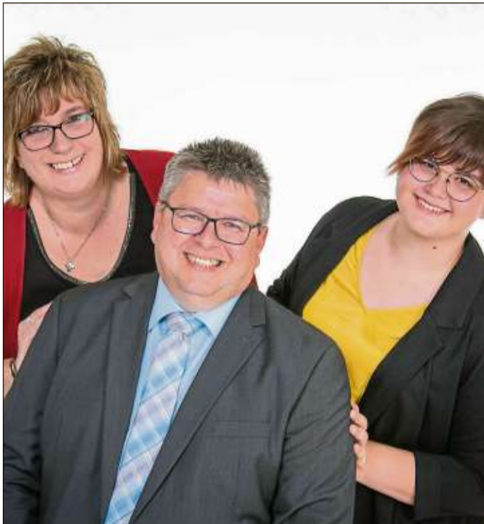
Eine glückliche Familie.