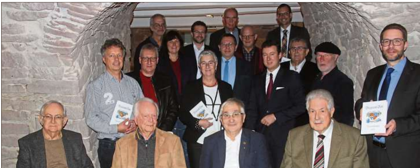
Sie zeichnen sich durch engagierte, ehrenamtliche Mitarbeit aus: Die Autoren des Bergwinkel-Boten 2020.