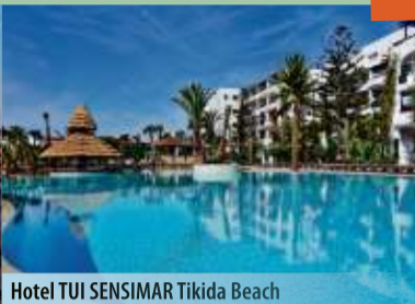
Hotel TUI SENSIMAR Tikida Beach

Tagesausflug Marrakesch inklusive! All inclusive!