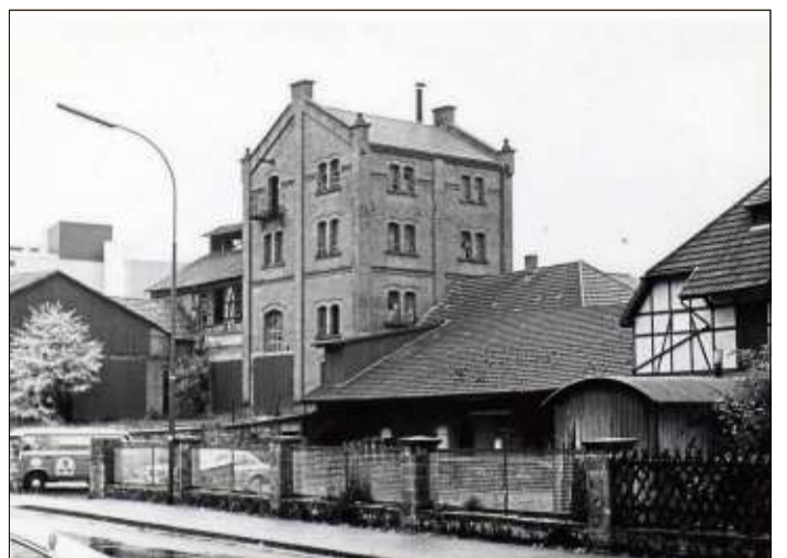
Viele alte Gebäude wie die Brauerei Thaler wurden abgerissen.