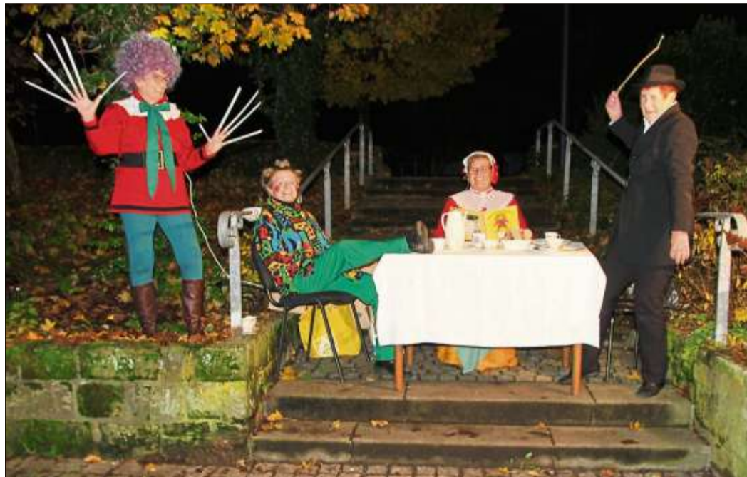
Die Struwelpeter-Gruppe bei ihrem Jubiläumsauftritt. Die Damen bereichern seit zehn Jahren den Lampionumzug.