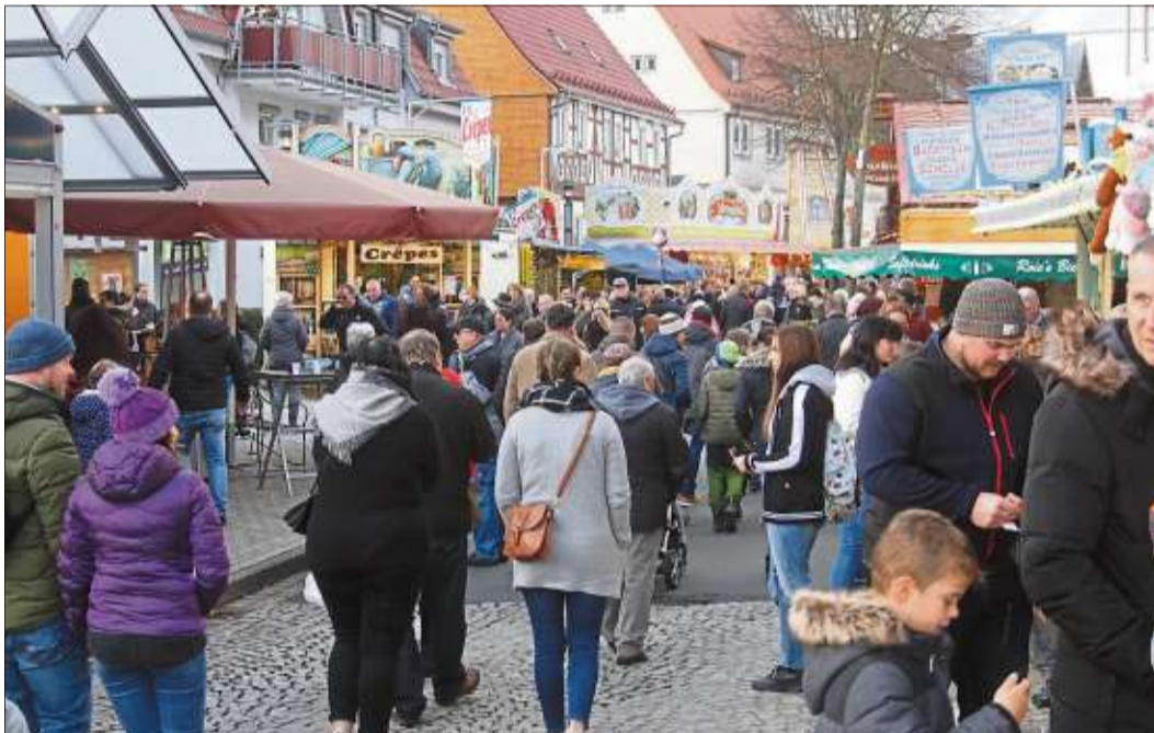
Nach dem Regenwetter zur Eröffnung blieben die weiteren Markttagge trocken – zumindest von oben. Zehntausende aus nah und fern kamen in die Bergwinkelmetropole.