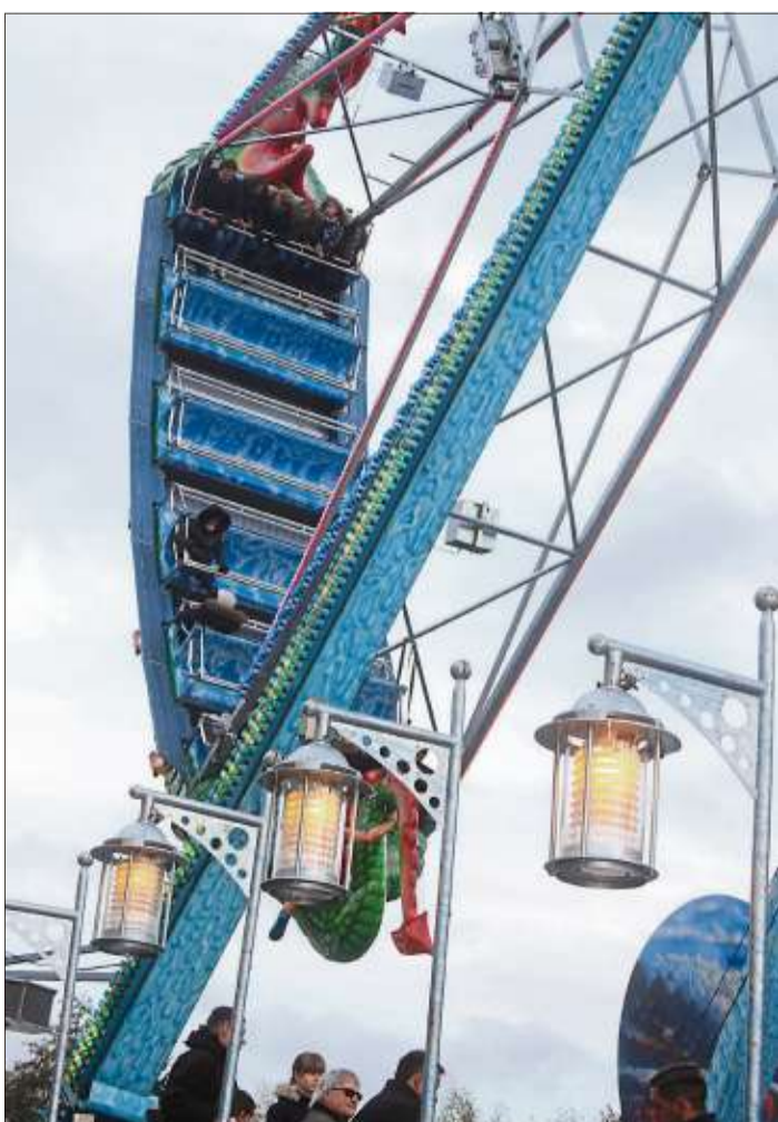
Die Riesenschaukel Nessy nimmt Fahrt auf.