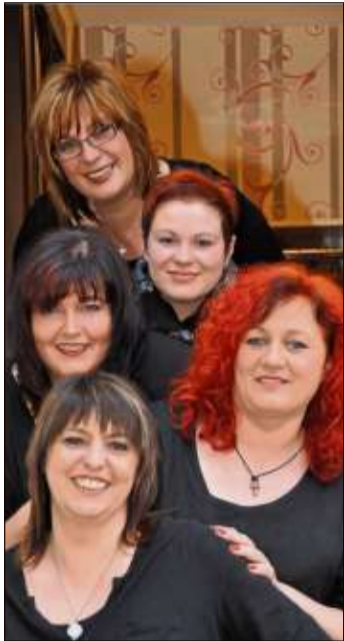
Das Friseurteam Möller ist heute in der Obertorstraße für seine Kunden da.