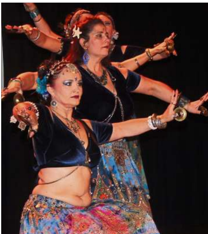
Waren eine Augenweide: Die Tänzerinnen der Tanzschule Layana.