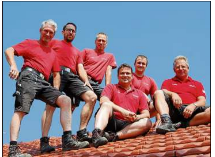
In einem filmischen Beitrag wurde der Dachdeckerbetrieb Philippi vorgestellt.