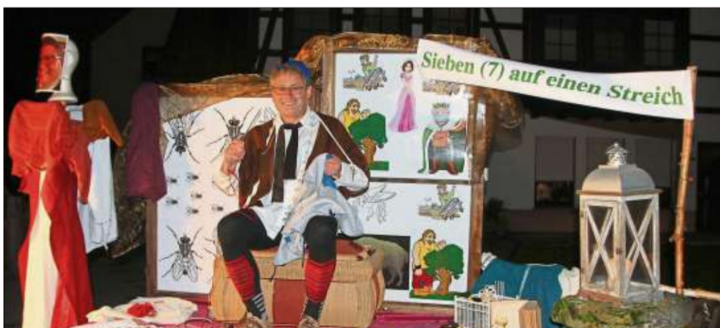
Zum ersten Mal war das tapfere Schneiderlein beim Lampionumzug dabei.