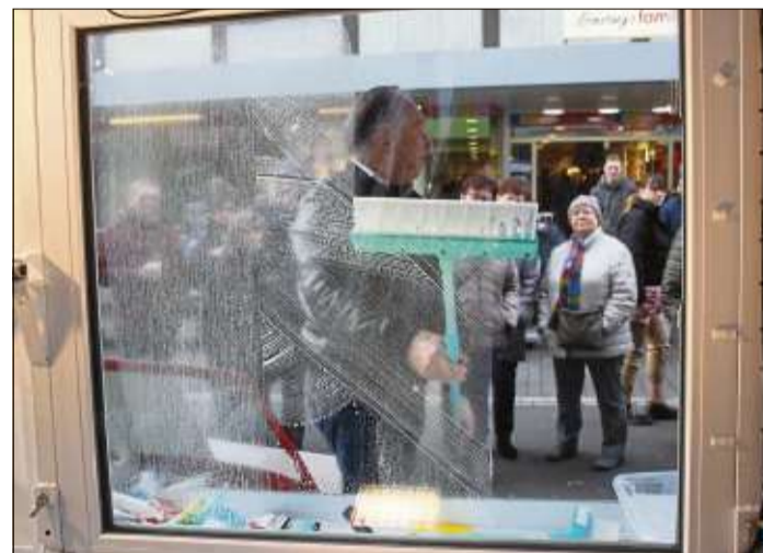
Fensterputzen leicht gemacht.