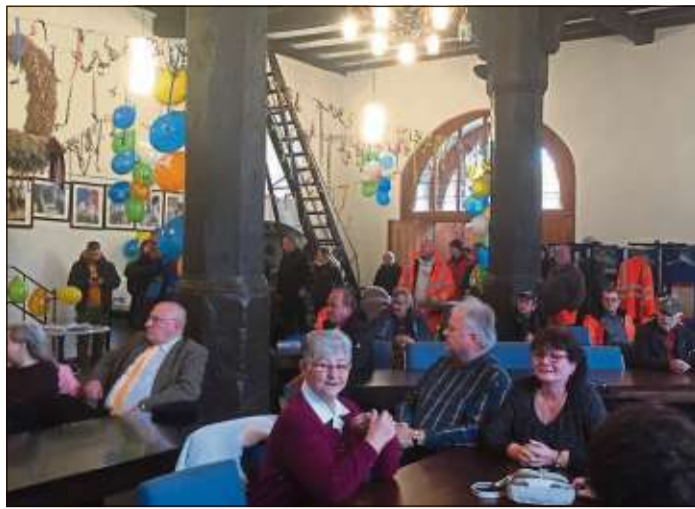
In der fröhlich und bunt geschmückten Markthalle verfolgten die Gäste die Kampagneneröffnung des SKV.