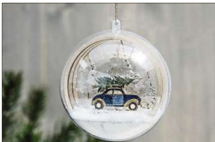
Ein Auto im Schnee in einer Glaskugel – eine wunderschöne Dekoidee.

Bei Glühwein und Gebäck können sich die Besucher von weihnachtlichen Deko- und Bastelideen inspirieren lassen. Ob sie einen Adventskranz suchen, Zutaten zum Selbermachen brauchen oder mit den Kindern basteln wollen, hier werden sie garantiert fündig. Außerdem gibt es an diesem Abend von 17 bis 21 Uhr 20 Prozent Rabatt auf alle Artikel aus der Weihnachtsdeko.