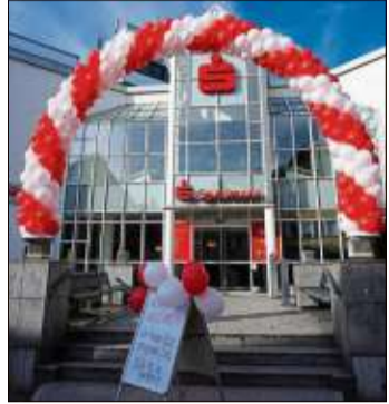
Rote und weiße Luftballons machten auf den Weltpartag in der Kreissparkasse aufmerksam.

fee und Kuchen: „Der Weltpartag ist für viele Kinder ein ganz besonderer Tag. Das ganze Jahr sparen sie diszipliniert und mit viel Freude. Am 30. Oktober kommen dann selbst unsere kleinsten Kunden zur Sparkasse, um zu sehen, wie viel sie über das Jahr angespart haben. Für das Durchhal-