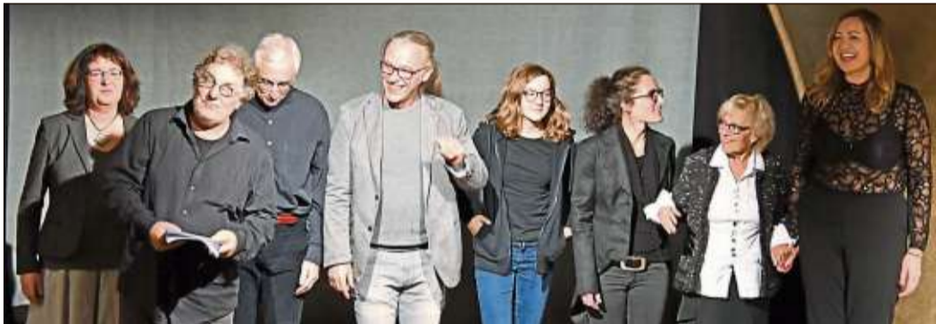
Die Akteure des Abends zeigten: Michael Endes Texte sind gesellschaftskritisch und von zwingender Aktualität.