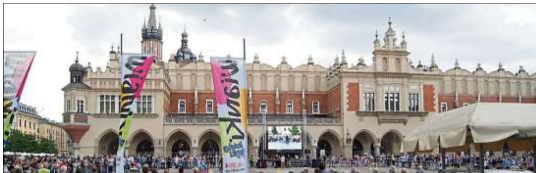
Das Rathaus in Krakau wird im kommenden Jahr wieder ein Ziel der Studien- und Begegnungsreise sein.

„Natürlich sind auch spontane Besucher willkommen. Der Vorstand des VTW freut sich auf die rege Teilnahme der Vertreter der heimischen Wirtschaft“, heißt es in der Pressemitteilung.