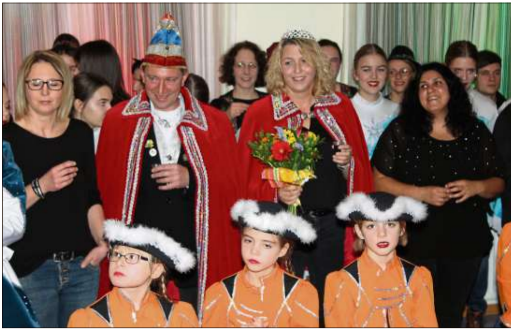
Das neue Hintersteinauer Prinzenpaar inmitten der Karnevalisten.