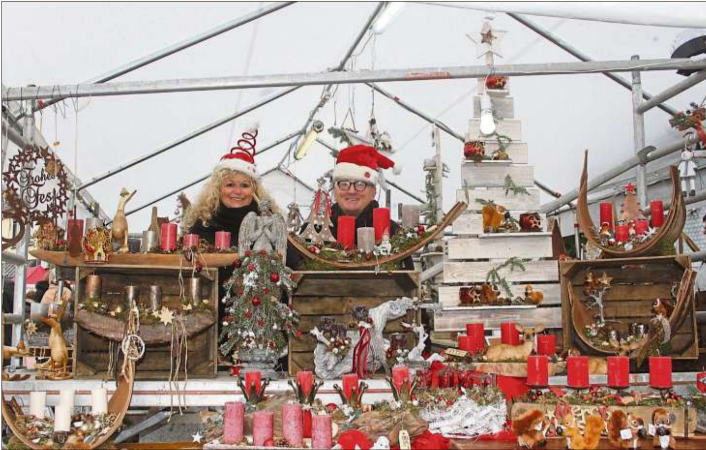
Adventskränze, Adventsgestecke und viele weihnachtliche Blumenarrangements gibt es bei der Adventsausstellung der Blumengalerie Deger.