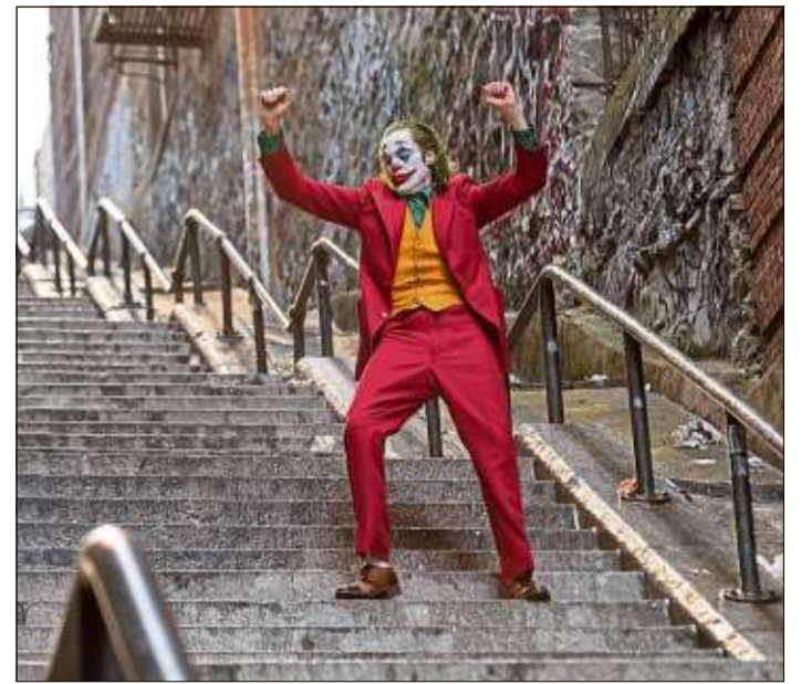
Der hochgelobte Thriller „Joker“ ist absolut oscarverdächtig.

Bis neue Räumlichkeiten bereitstehen, für deren Einrichtung Bund und Land Hessen üppige Kinoförderprogramme aufgelegt haben, müssen sich die Bürger gedulden und für Schulkinowochen, Spielfilme kurz nach Filmstart und OmU-Angebote wie das französische und britische Jugendfilmfestival nun zu den Kinos in Fulda, Gelnhausen, Aschaffenburg oder Frankfurt pendeln.