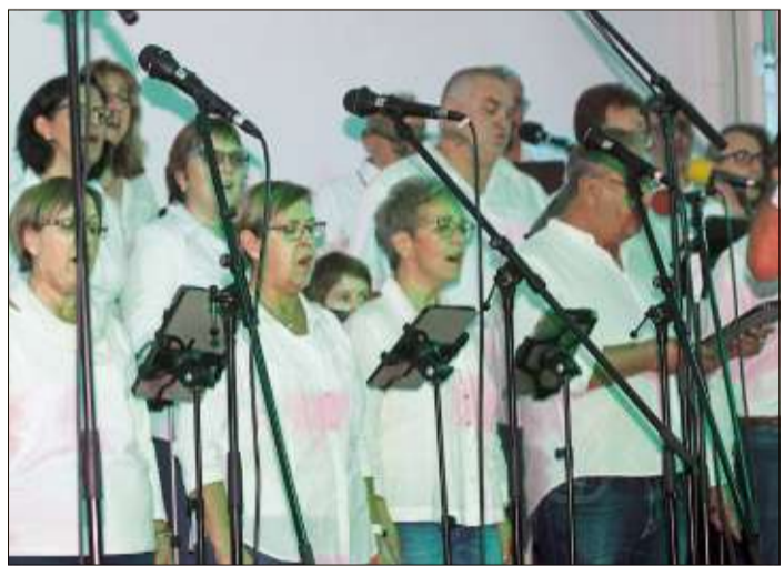
Mehrstimmig begeisterte der Chor die Zuschauer.