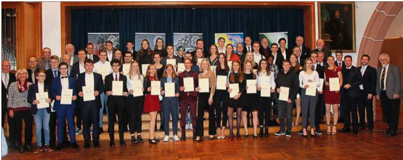
42 Stipendiaten wurden beim Stiftungsfest am Ulrich-von-Hutten-Gymnasium ausgezeichnet. Die Schülerinnen und Schüler stellten sich mit den Mitgliedern des Stiftungsvorstandes und des Stiftungsbeirates, den Bürgermeistern und Vertretern der Bergwinkel-Kommunen und den Laudatoren zu einem Erinnerungsfoto in der Aula der Schule.