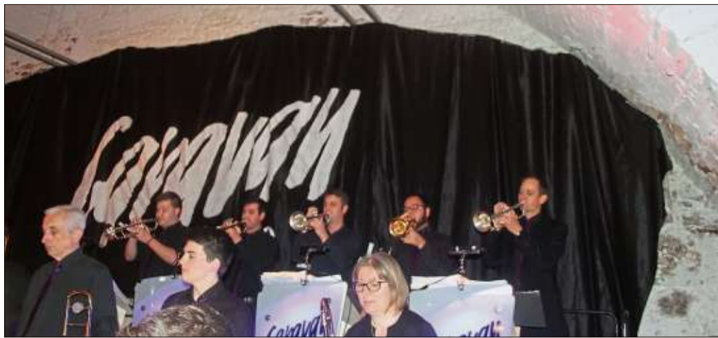
Voller Leidenschaft und Spielwitz konzertierten die Trompeter beim Trumpet Blues.

STEINAU (CS). Für ein klanglich besseres Erlebnis als in den großen Hallen geht die Caravan Big Band nur zu gerne in den Steinauer Rathauskeller. Hier ist die Akustik trocken und klar, hier entfalten die Musiker ein hohes Maß an Kreativität und durchfluten die alten Gewölbe mit ihrem unverwechselbaren Big-Band-Sound.